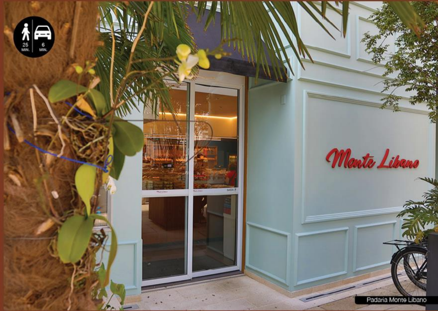
Padaria Monte Libano