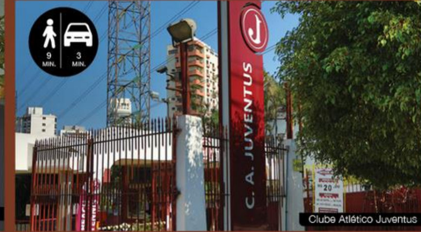
Clube Atlético Juventus