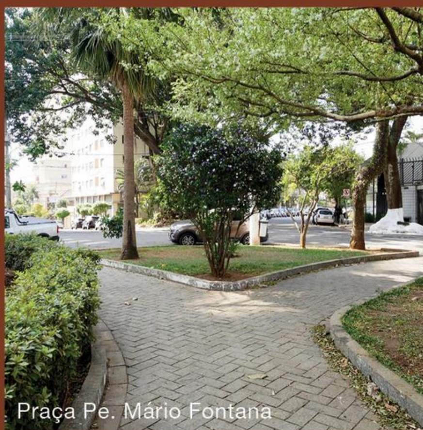
Praça Pe. Mário Fontana

Na melhor localização do Parque da Mooca, a 800 m do Clube Atlético Juventus.