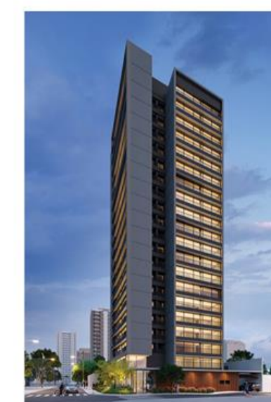
LUX HOUSE BROOKLIN