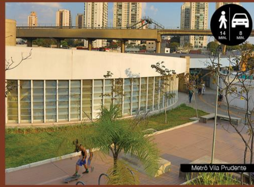
Metrô Vila Prudente