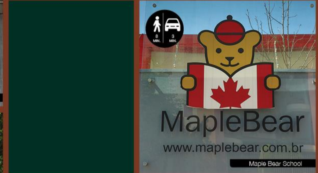
Maple Bear School