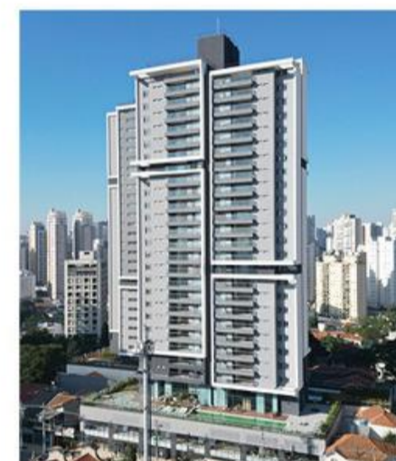
MARCCO VILA ROMANA

Sabendo valorizar seus clientes e seus projetos de vida, a REM tem o trunfo de aliar tradição e inovação para oferecer excelência em acabamentos, resultados e qualidade, além de segurança e confiança em cada uma de suas entregas.