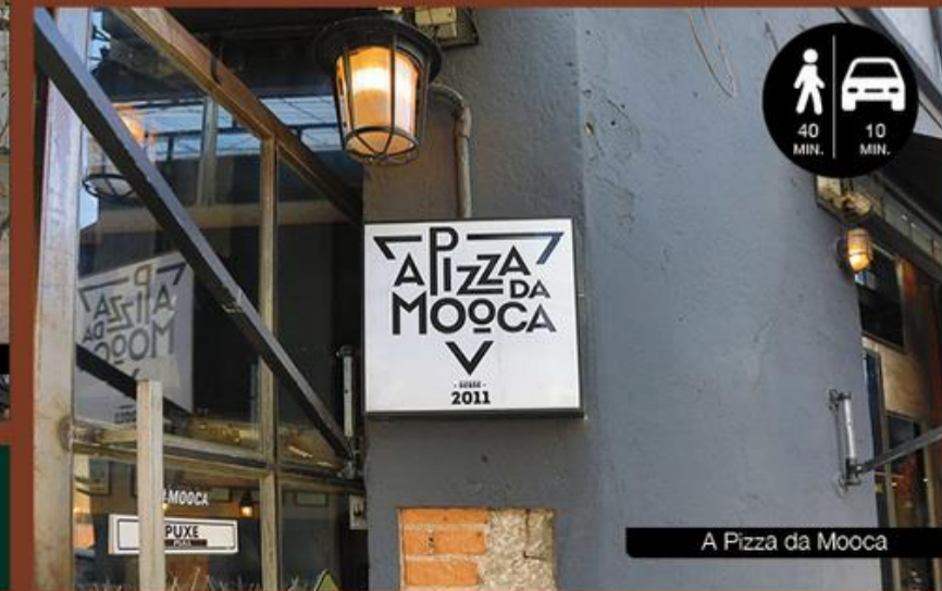
A Pizza da Mooca