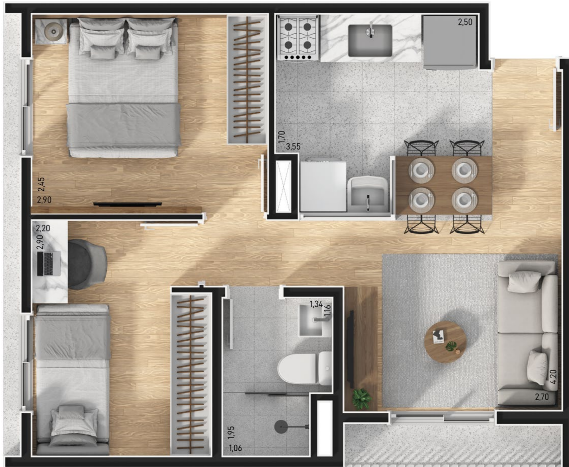
Planta Tipo 2 Dorms. 37,51m² - Finais 2, 3 e 6