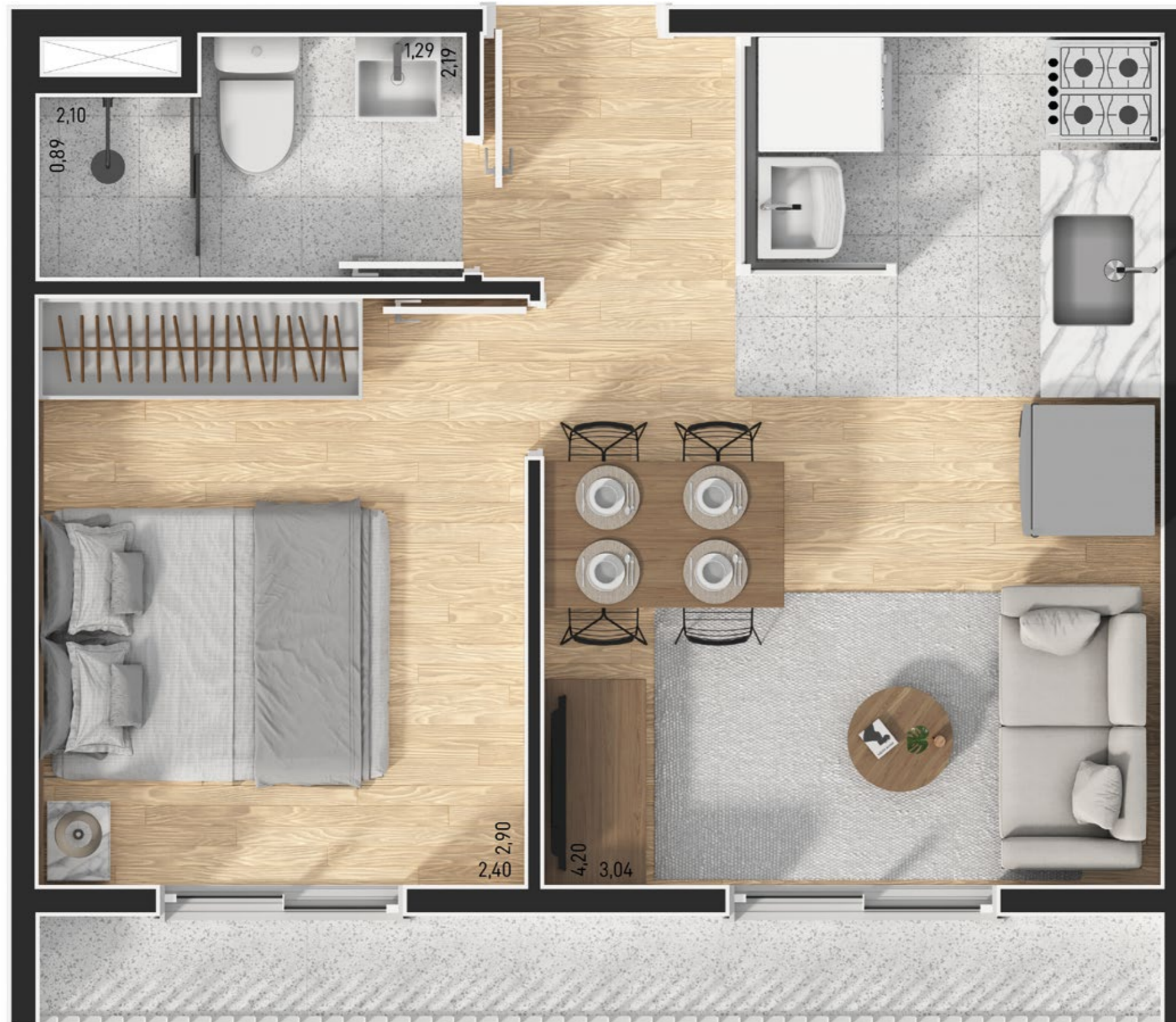
Planta Tipo 1 Dorm. 28,23m 2 - Final 5