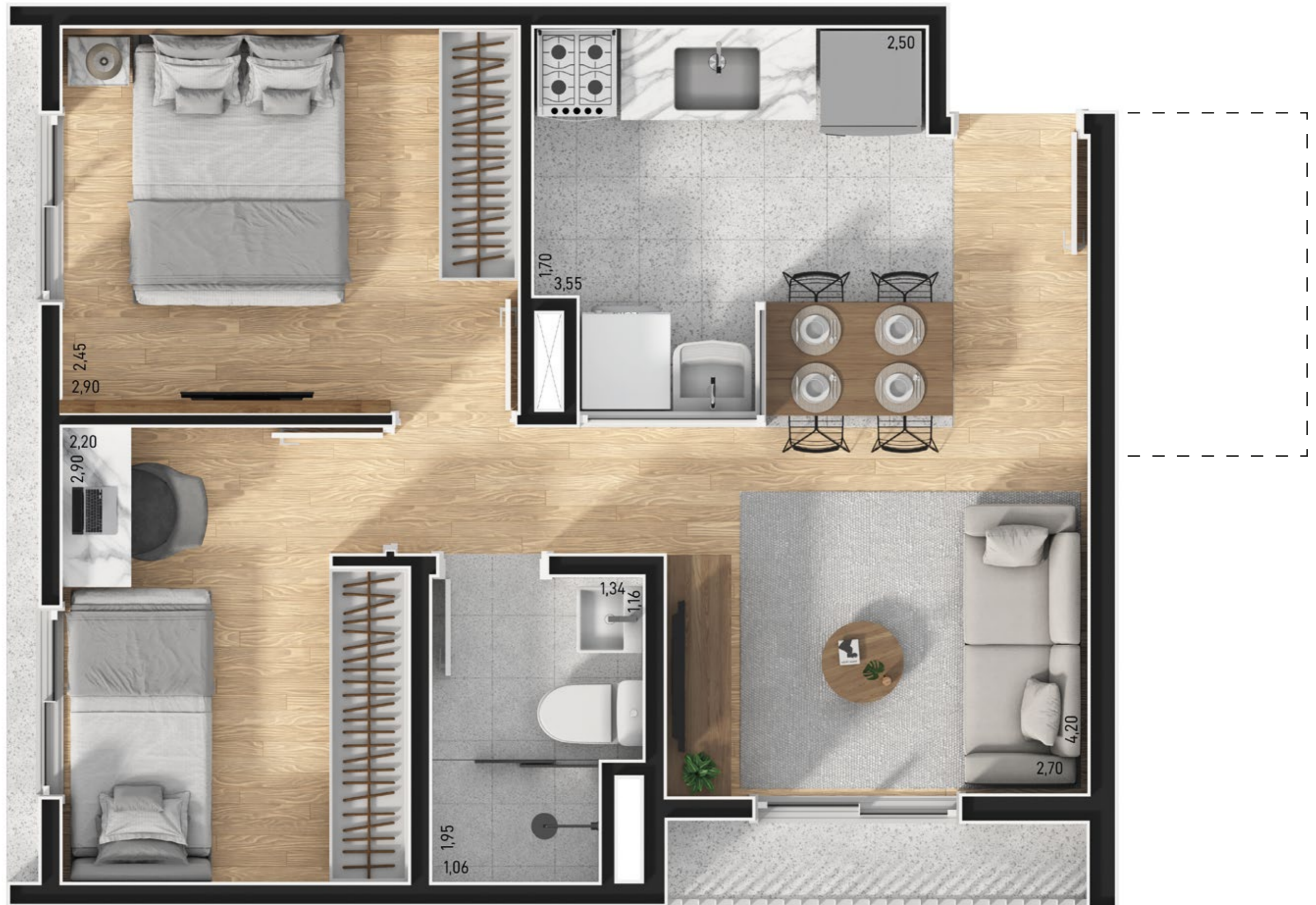
Planta Tipo 2 Dorms. 39,27m 2 - Final 7