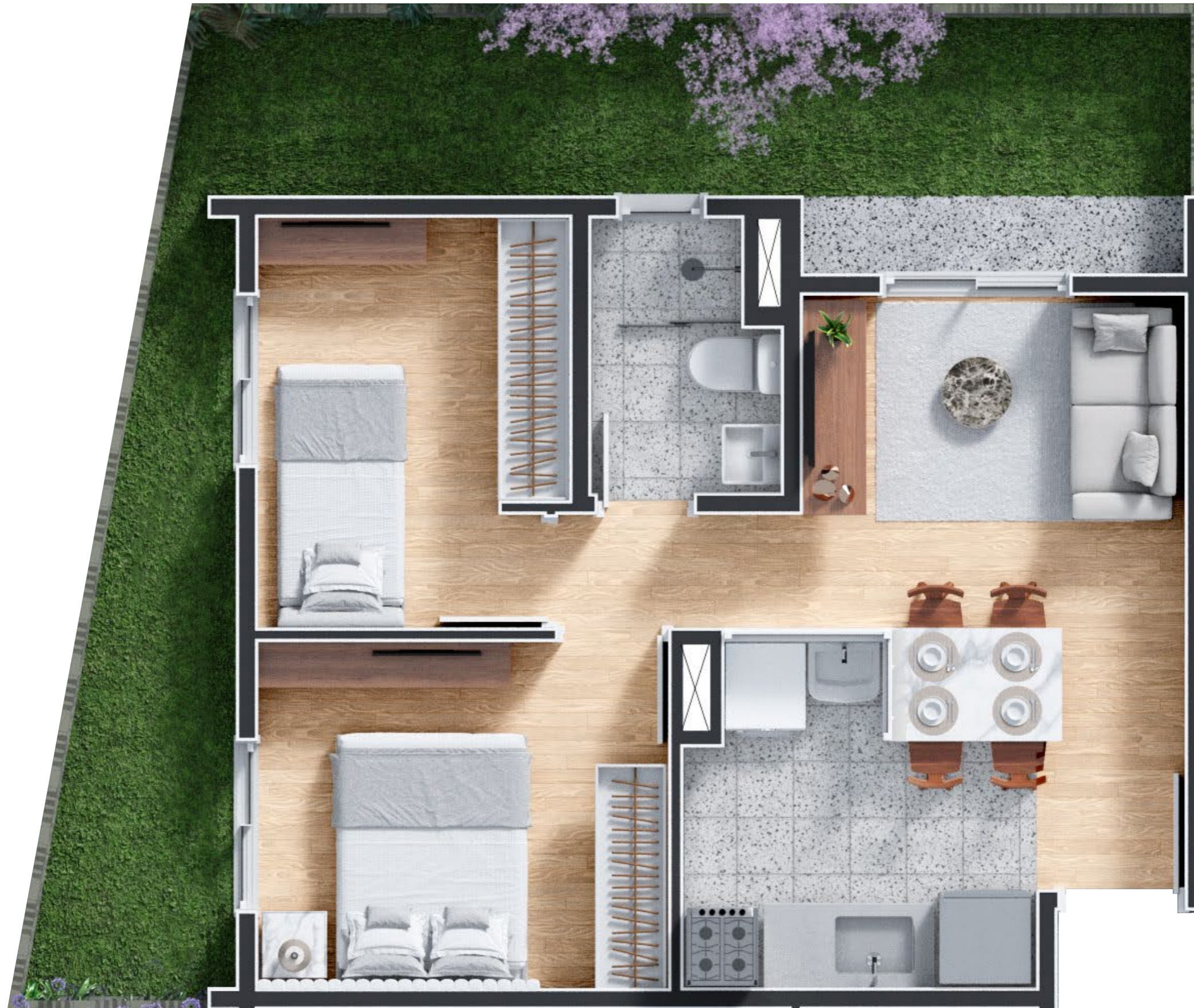
Garden Tipo 2 - 2 Dorms. 61,41m 2 - Final 2