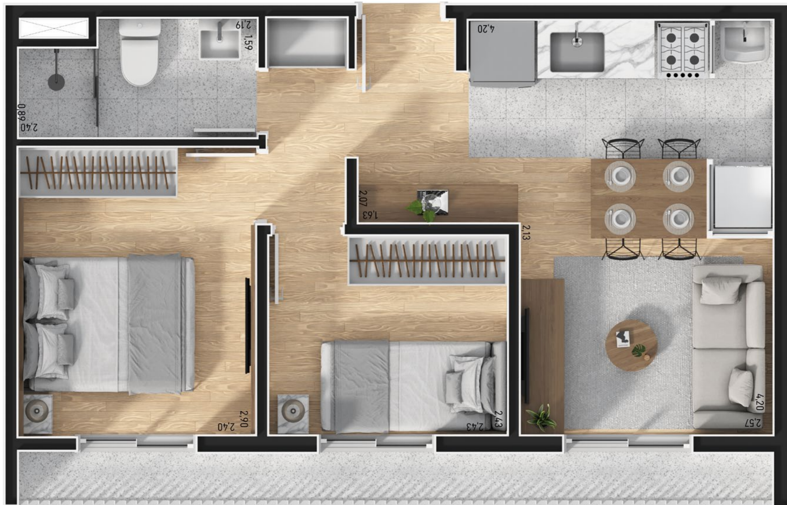
Planta Tipo 2 Dorms. 38,44m 2 - Final 4