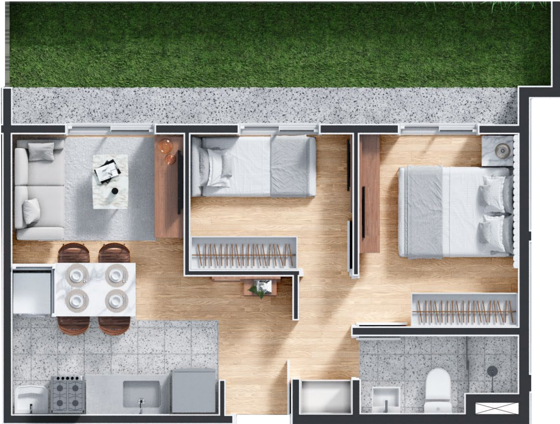
Garden Tipo 1 - 2 Dorms. 49,05m 2 - Final 1