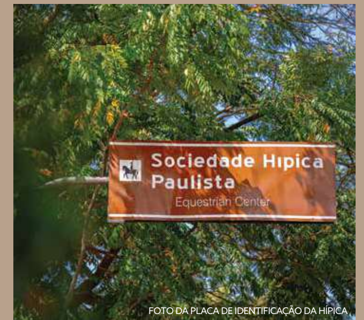
FOTO DA PLACA DE IDENTIFICAÇÃO DA HIPICA

Um dos locais mais nobres da cidade, além do perfil cosmopolita, o Brooklin preserva um lado com atmosfera residencial tranquila e arborizada, inspirada nos bairros-jardim. Lindenbergl Vista Brooklin está localizado neste cenário único e leva a sua paisagem para dentro de casa. Um privilégio de grande valor, vizinho à melhor infraestrutura da cidade.