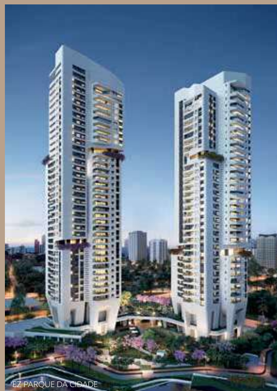
EZ PARQUE DA CIDADE