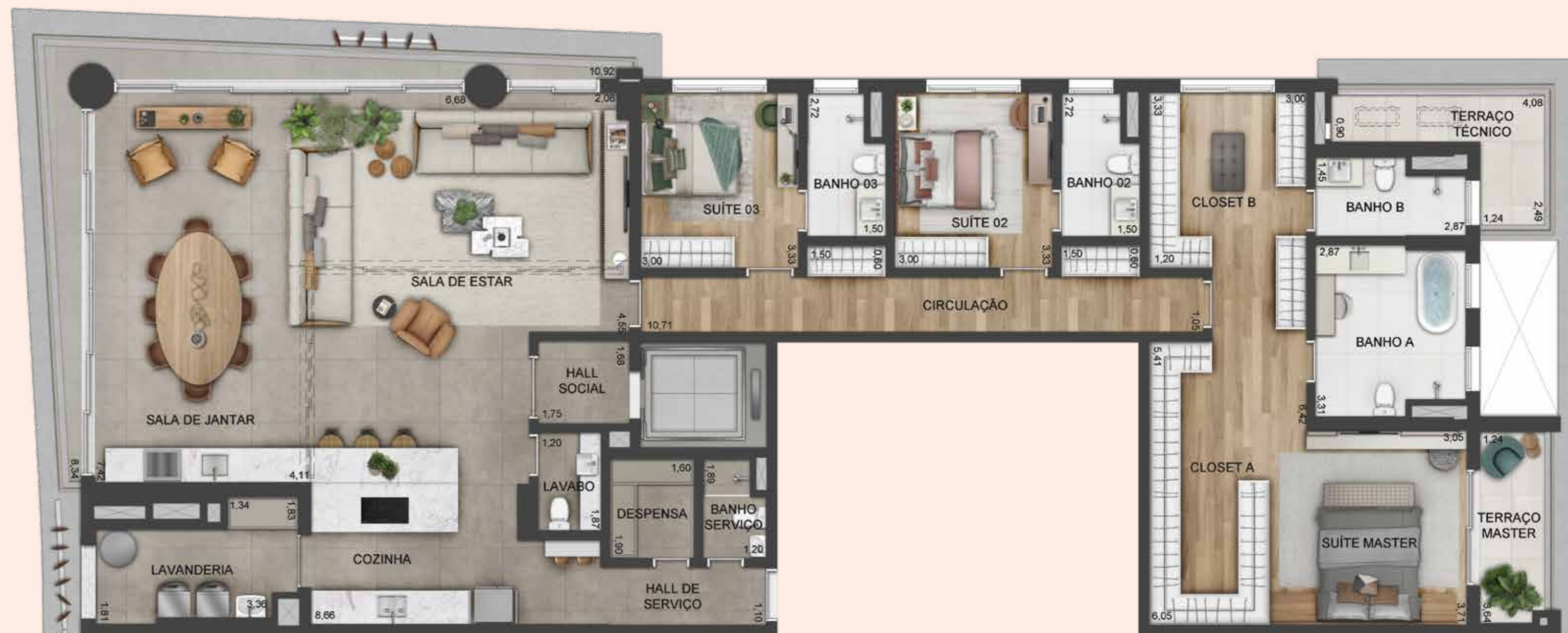
PLANTA OPÇÃO | 261 M 2 | 3 SUÍTES

SUGESTÃO DE DECORAÇÃO. EVENTUAIS ADEQUAÇÕES NAS INSTALAÇÕES ELÉTRICAS OU HIDRÁULICAS SERÃO POR CONTA DO CLIENTE. QUALQUER MODIFICAÇÃO NO APARTAMENTO QUE IMPLIQUE NA ALTERAÇÃO DO PROJETO QUE NÃO ESTEJA ESPECIFICADA NA CONVENÇÃO DE CONDOMÍNIO DEVERÁ SER APROVADA EM ASSEMBLEIA. PLANTA COM FECHAMENTO DE TERRAÇO NÃO INCLUSA NO MEMORIAL DESCRITIVO PADRÃO.