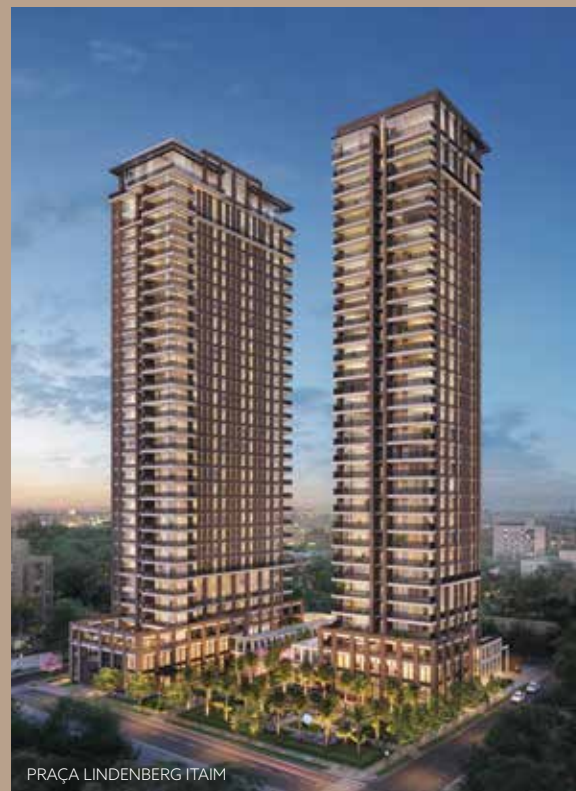
PRAÇA LINDENBERG ITAIM