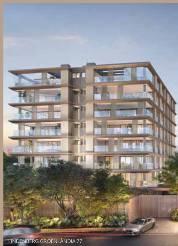
LINDENBERG GROENLÂNDIA 77