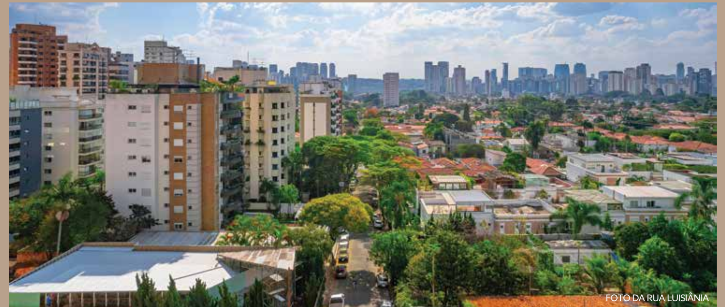
FOTO DA RUA LUISIÂNIA

O AUTÊNTICO BROOKLIN. R. LUISIÂNIA X AV. PORTUGAL