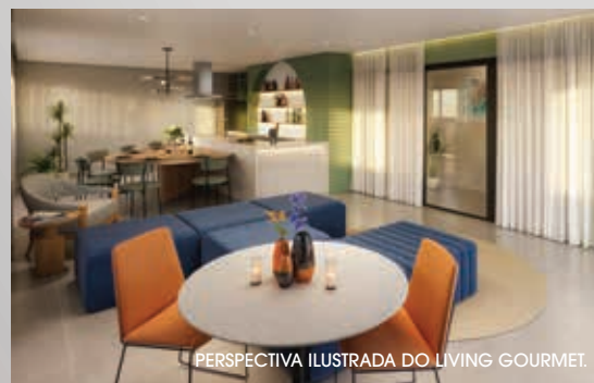
PERSPECTIVA ILUSTRADA DO LIVING GOURMET.