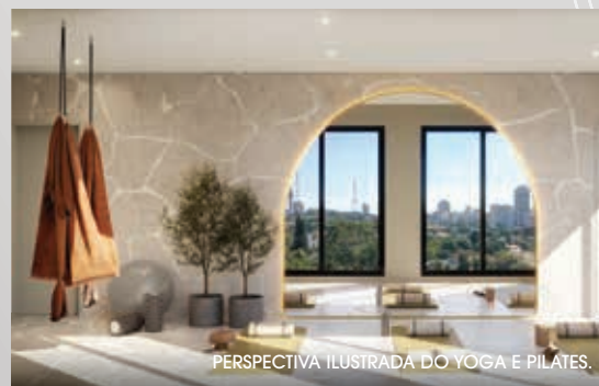
PERSPECTIVA ILUSTRADA DO YOGA E PILATES.