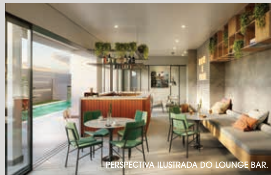
PERSPECTIVA ILUSTRADA DO LOUNGE BAR.