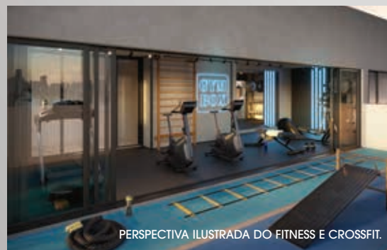
PERSPECTIVA ILUSTRADA DO FITNESS E CROSSFIT.