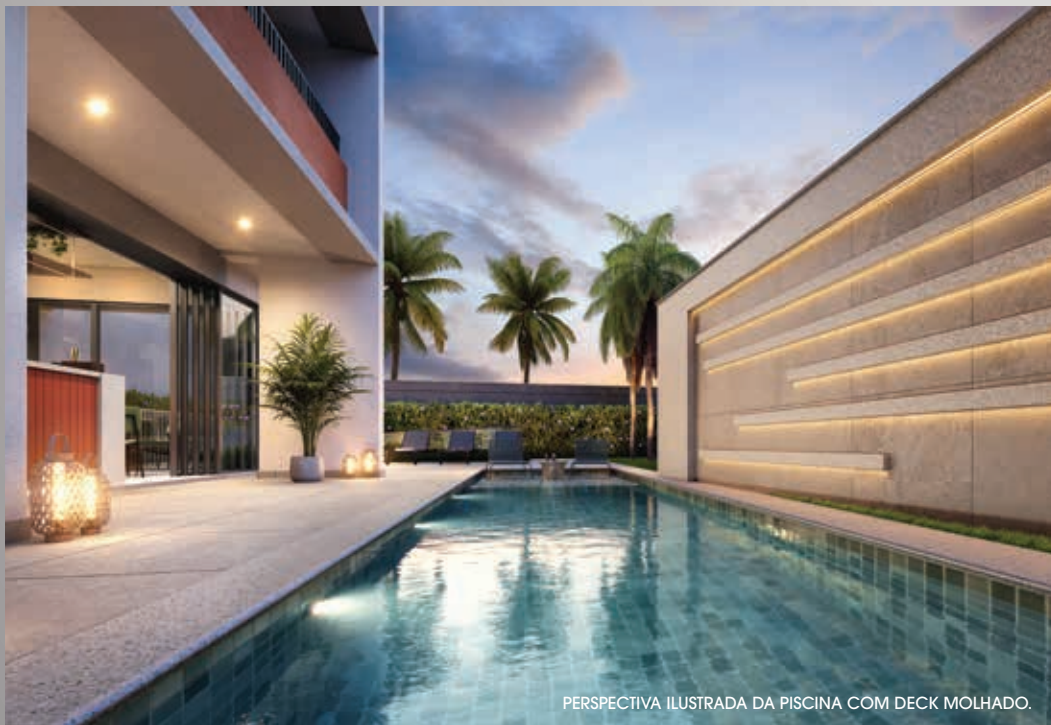
PERSPECTIVA ILUSTRADA DA PISCINA COM DECK MOLHADO.