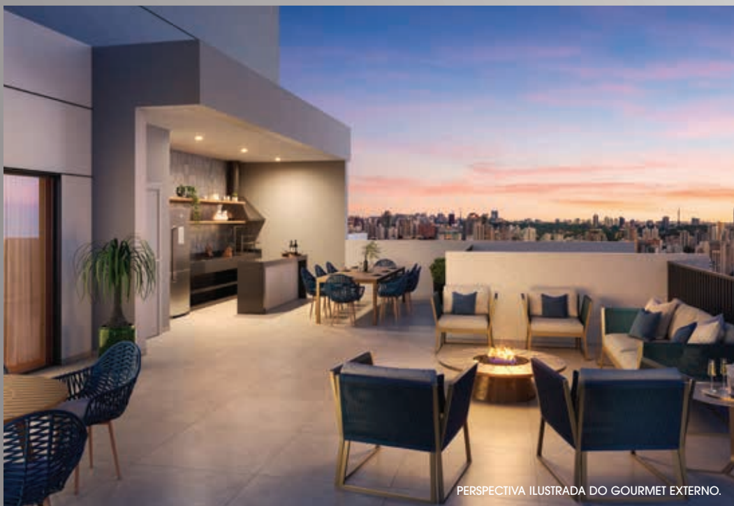
PERSPECTIVA ILUSTRADA DO GOURMET EXTERNO.