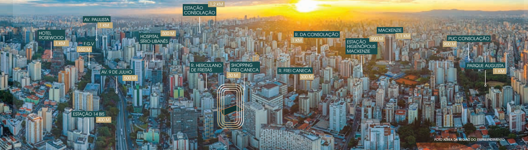
FOTO AÉREA DA REGIÃO DO EMPREENDIMENTO.