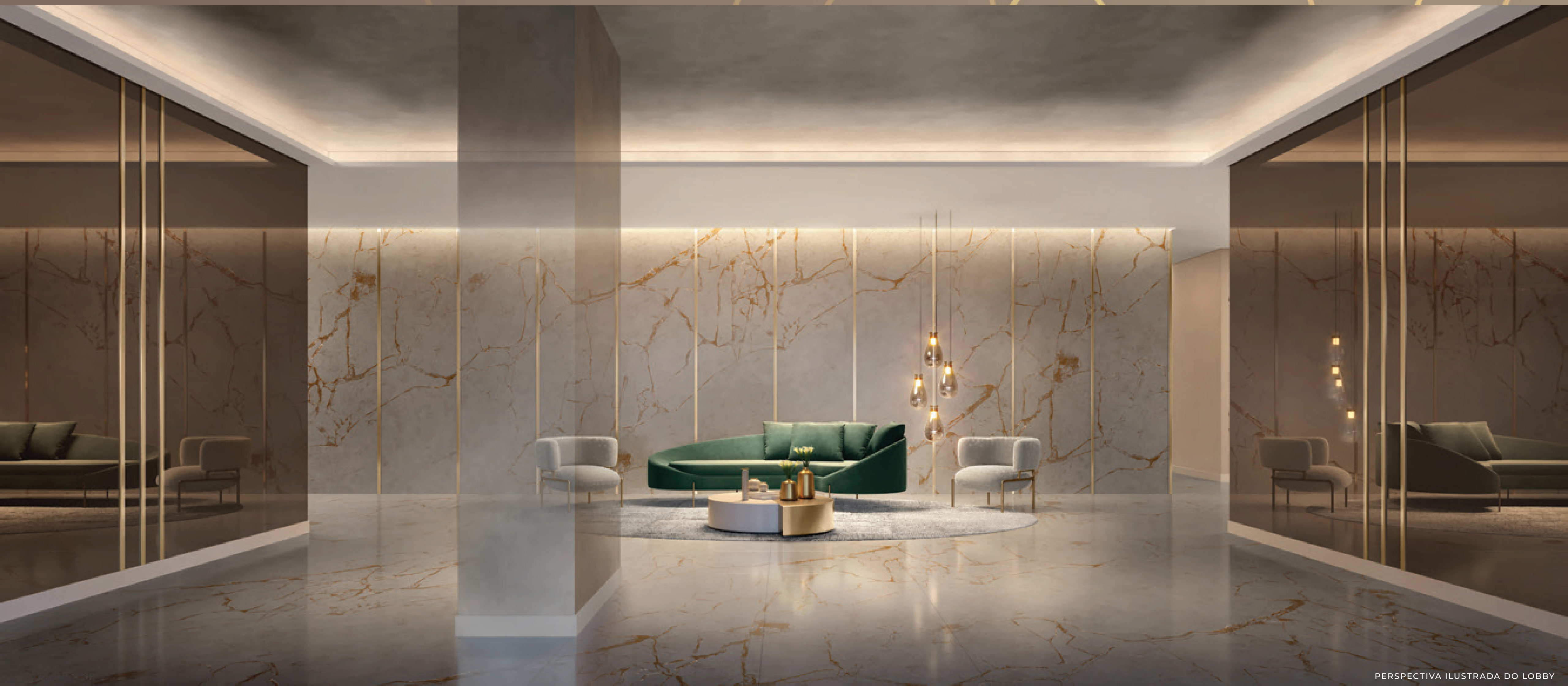
PERSPECTIVA ILUSTRADA DO LOBBY