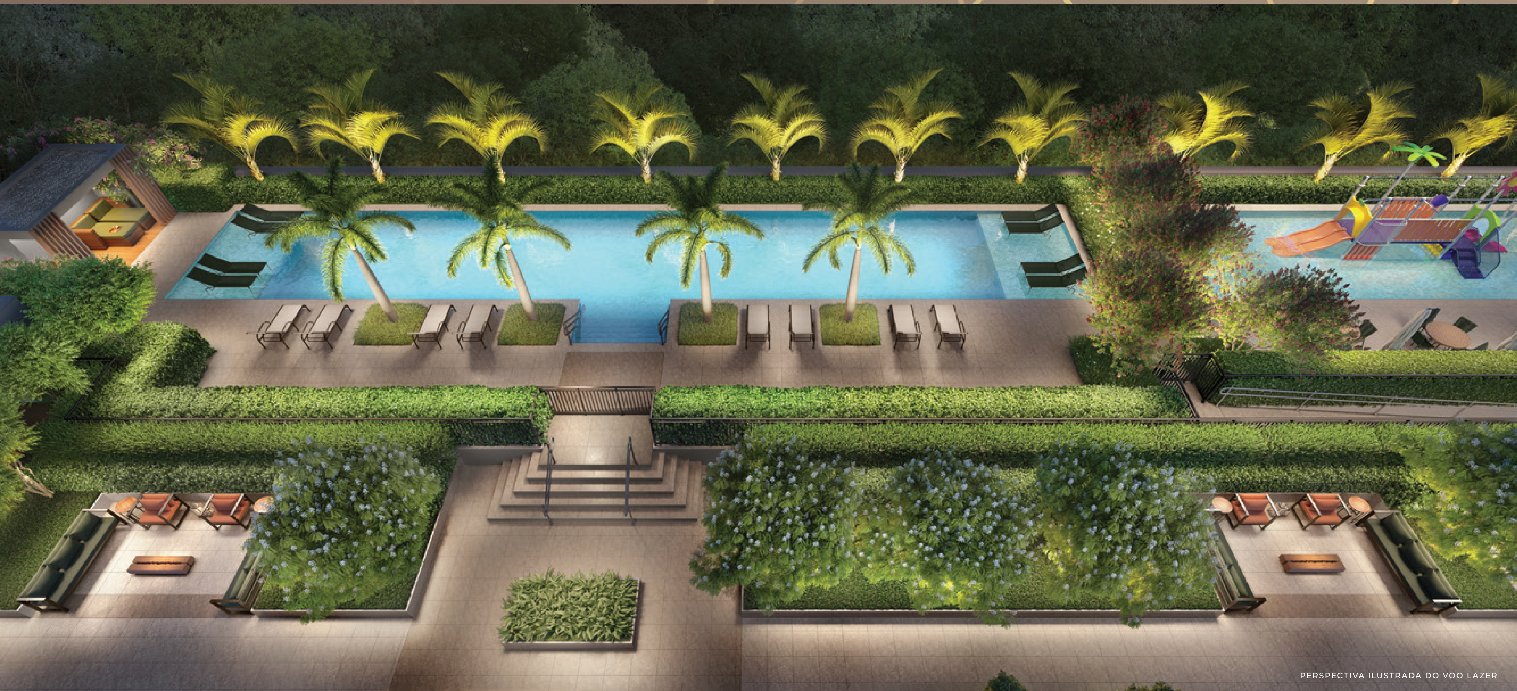
PERSPECTIVA ILUSTRADA DO VOO LAZER