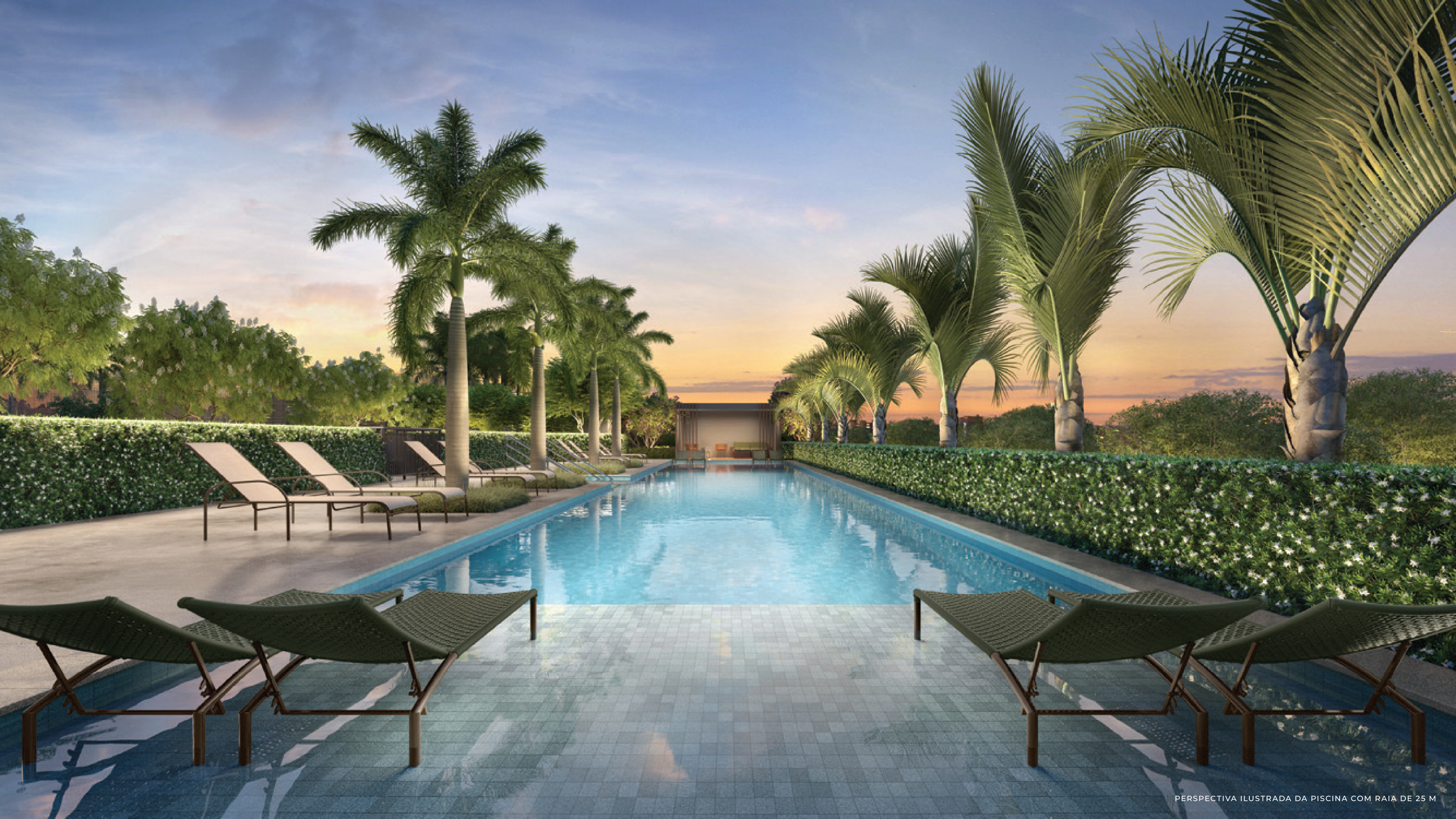
PERSPECTIVA ILUSTRADA DA PISCINA COM RAIA DE 25 M