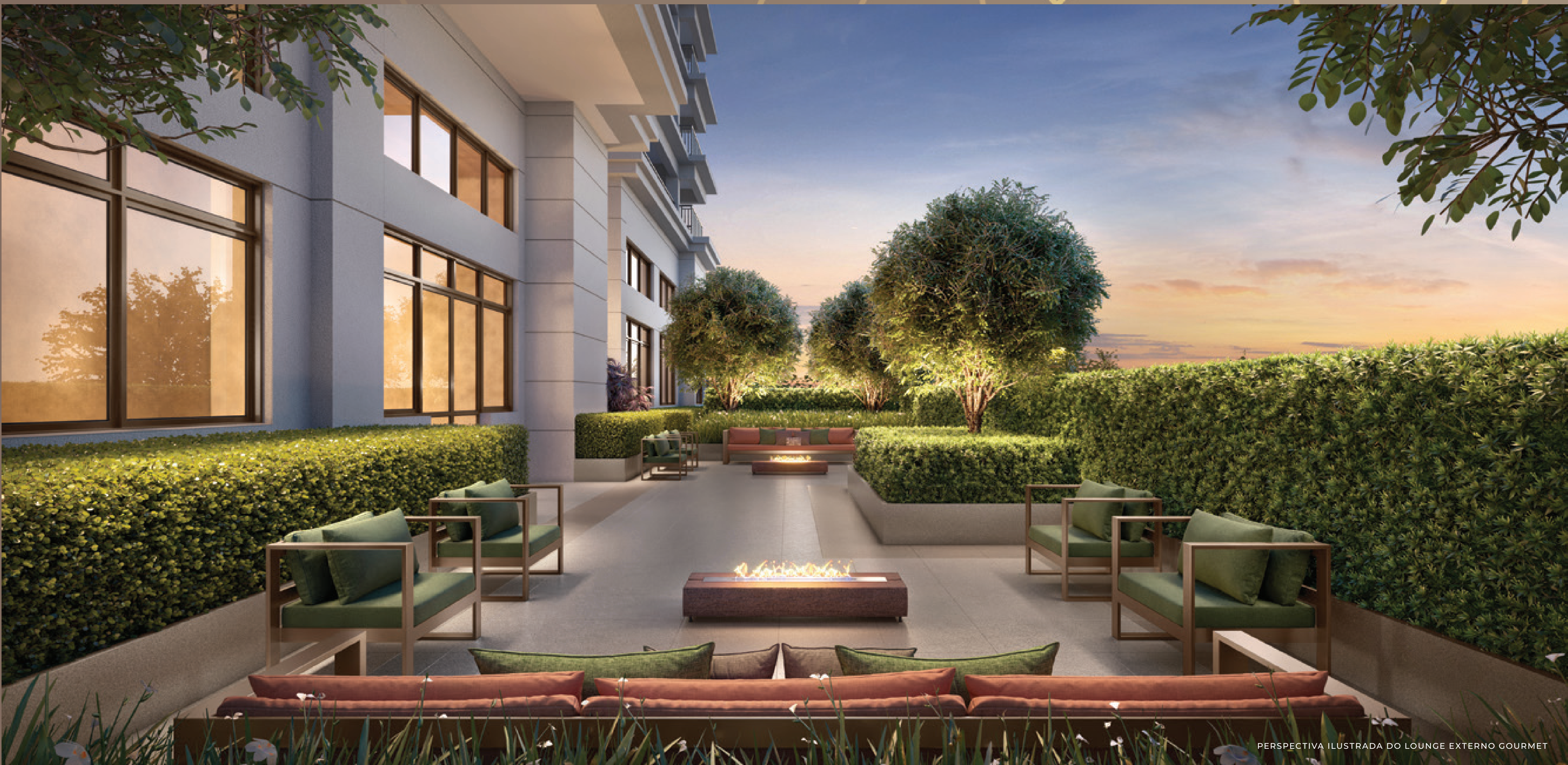
PERSPECTIVA ILUSTRADA DO LOUNGE EXTERNO GOURMET