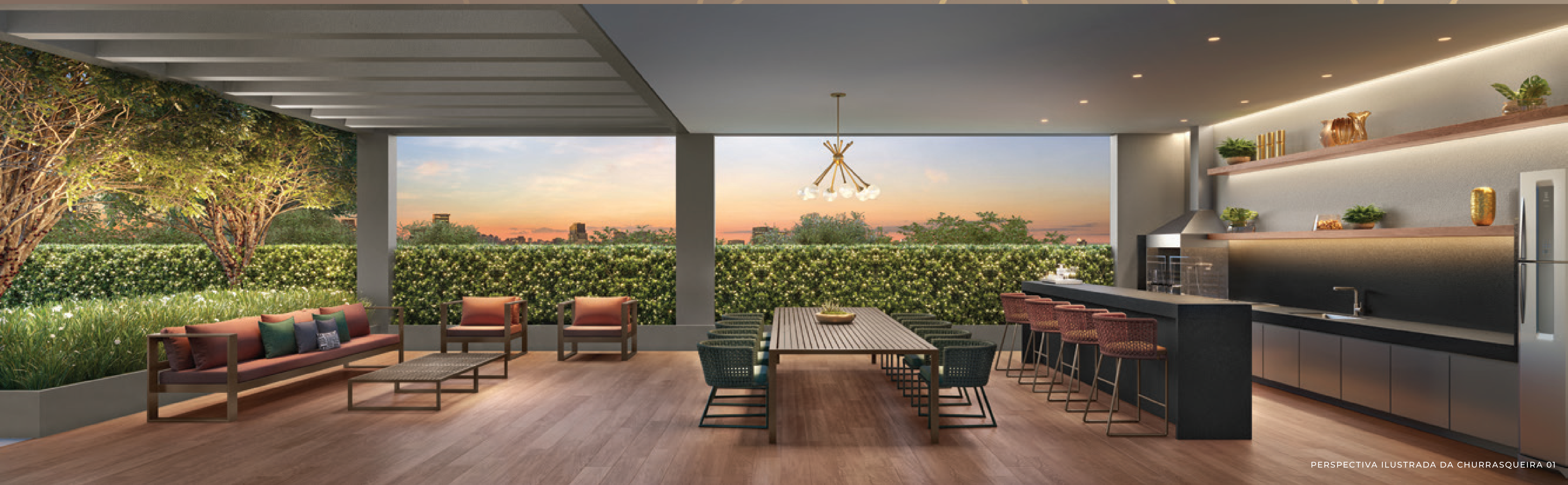
PERSPECTIVA ILUSTRADA DA CHURRASQUEIRA 01