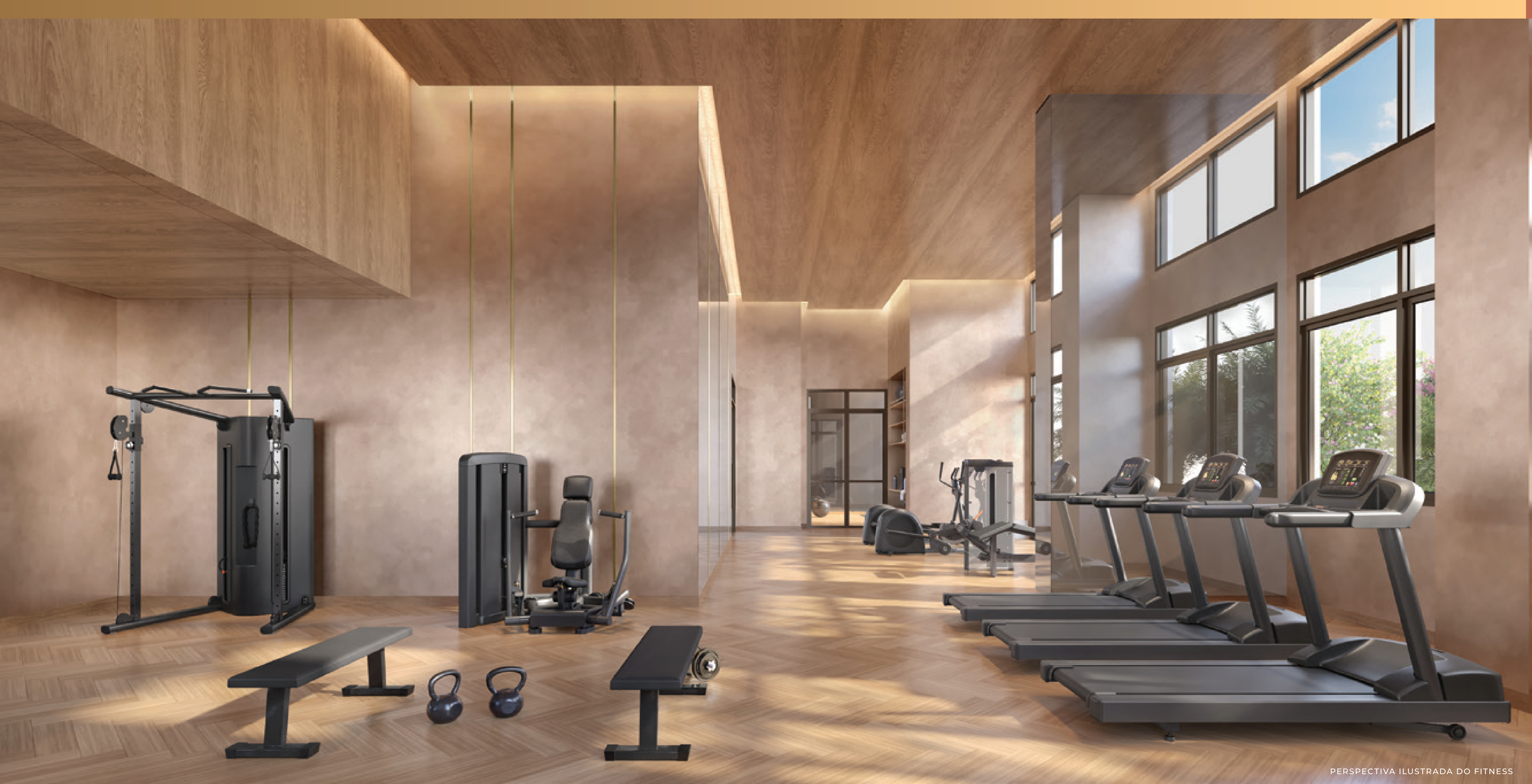
PERSPECTIVA ILUSTRADA DO FITNESS