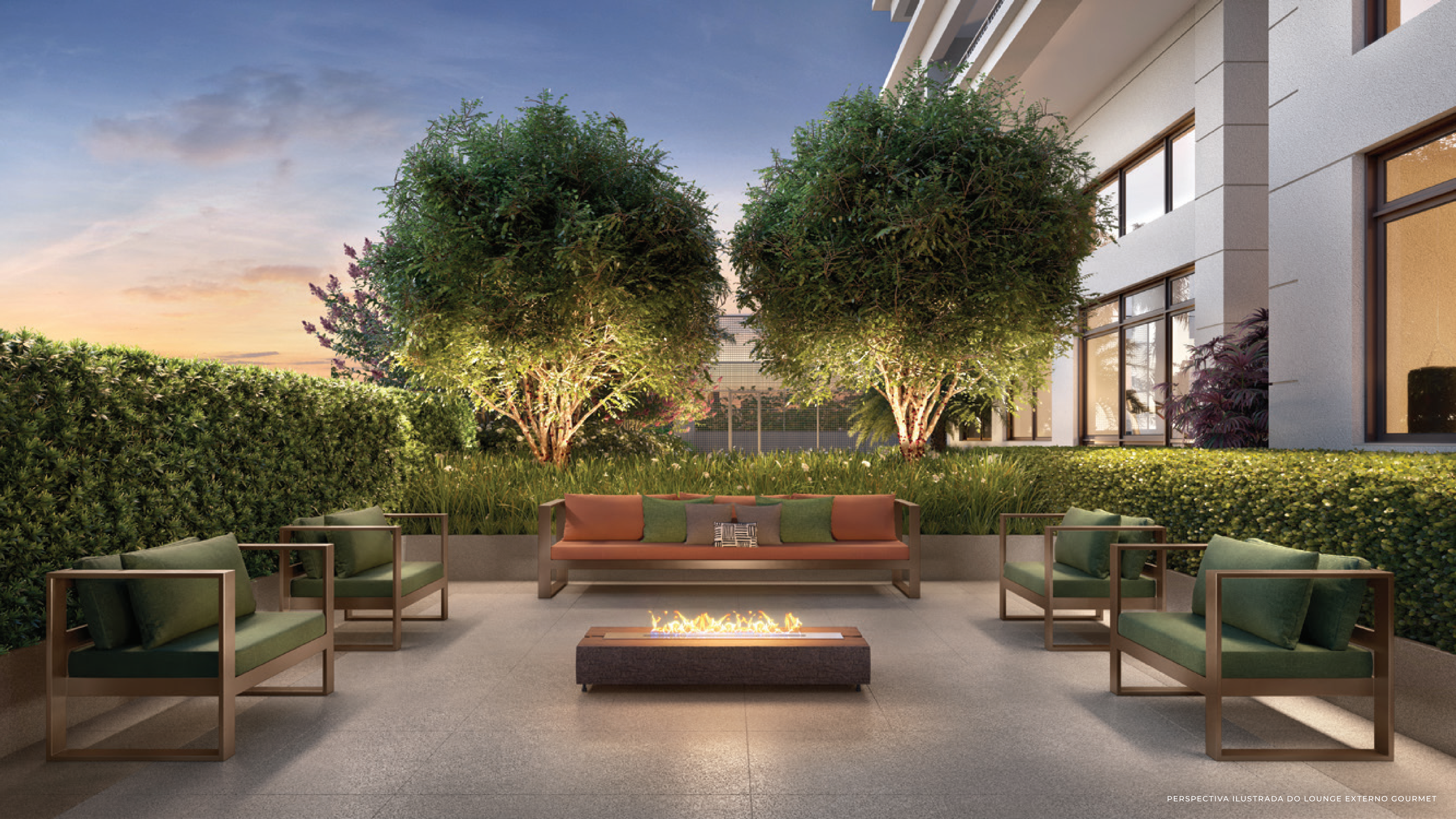
PERSPECTIVA ILUSTRADA DO LOUNGE EXTERNO GOURMET