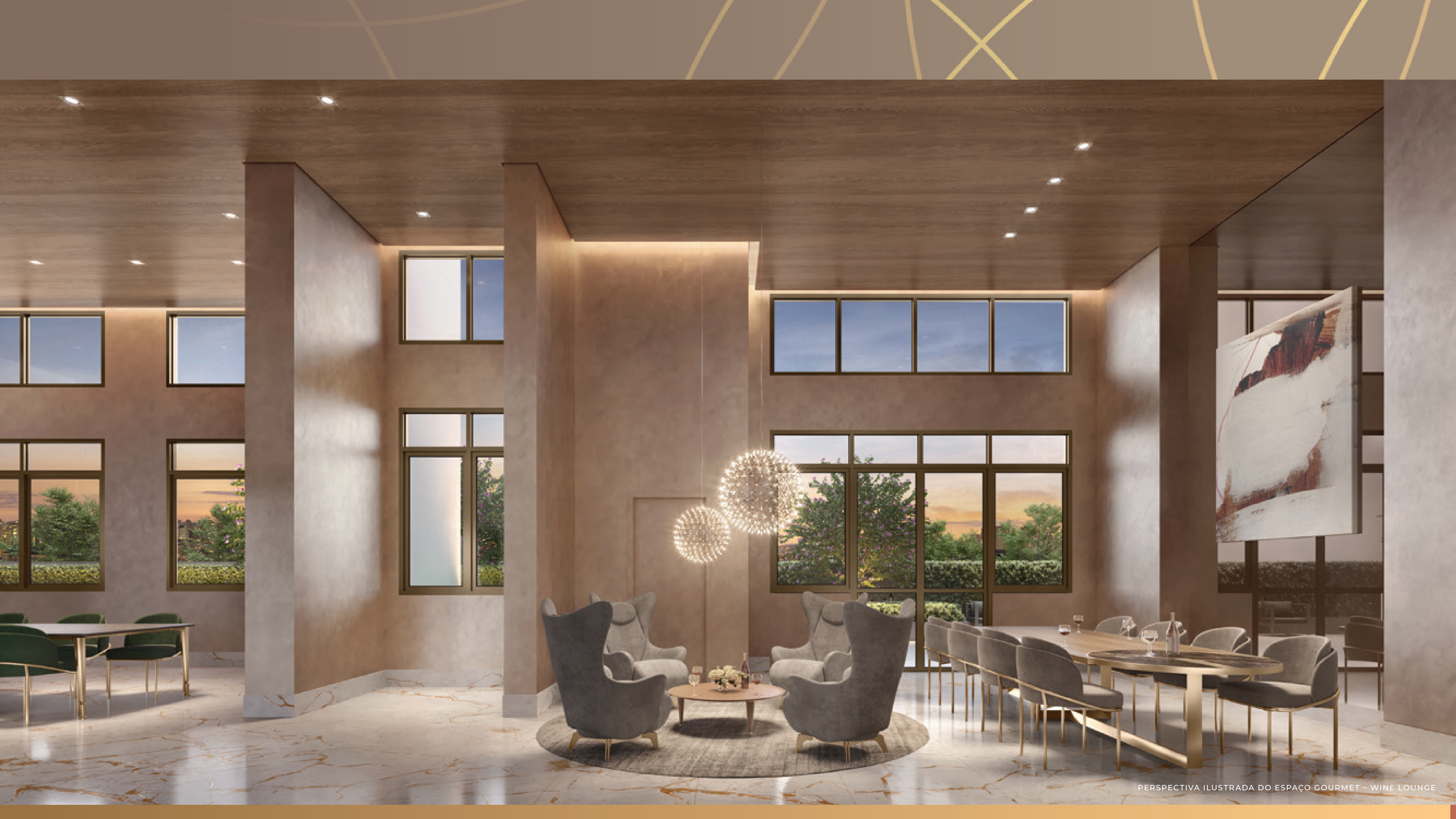
PERSPECTIVA ILUSTRADA DO ESPAÇO GOURMET - WINE LOUNGE