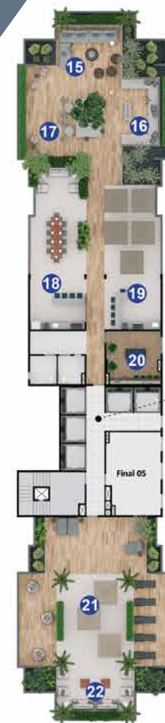
Torre 3 - Rooftop