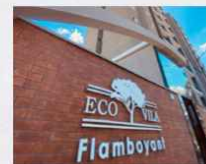
FLAMBOYANT • 100% ENTREGUE