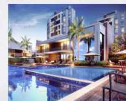
GENEBRA • ENTREGUE