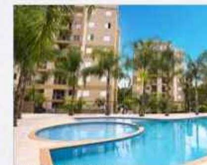
TIPIUANA • 100% ENTREGUE

Por meio de equipes capacitadas, exercemos com excelência o nosso papel, obtendo um histórico excepcional no que se refere ao cumprimento de prazos de entrega e êxito de vendas.