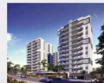
SANTA MARGARIDA • PREVISÃO DE ENTREGA 1ª FASE JANEIRO DE 2025