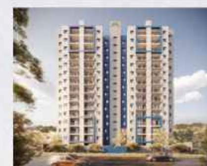
CEREJEIRA • PREVISÃO DE ENTREGA MAIO 2025