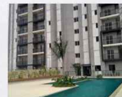
TALISIA • 100% ENTREGUE