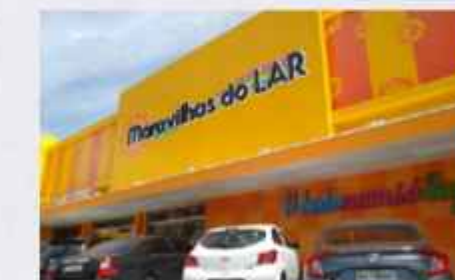
MARAVILHAS DO LAR