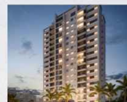
PRIMAVERA • PREVISÃO DE ENTREGA ABRIL DE 2025