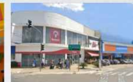
BRÁDESCO / BABY / MAGAZINE LUIZA