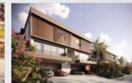
VILLAGE SAINTE HELENE