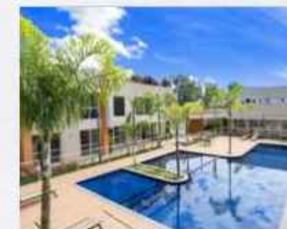
SUMARÉ • 100% ENTREGUE