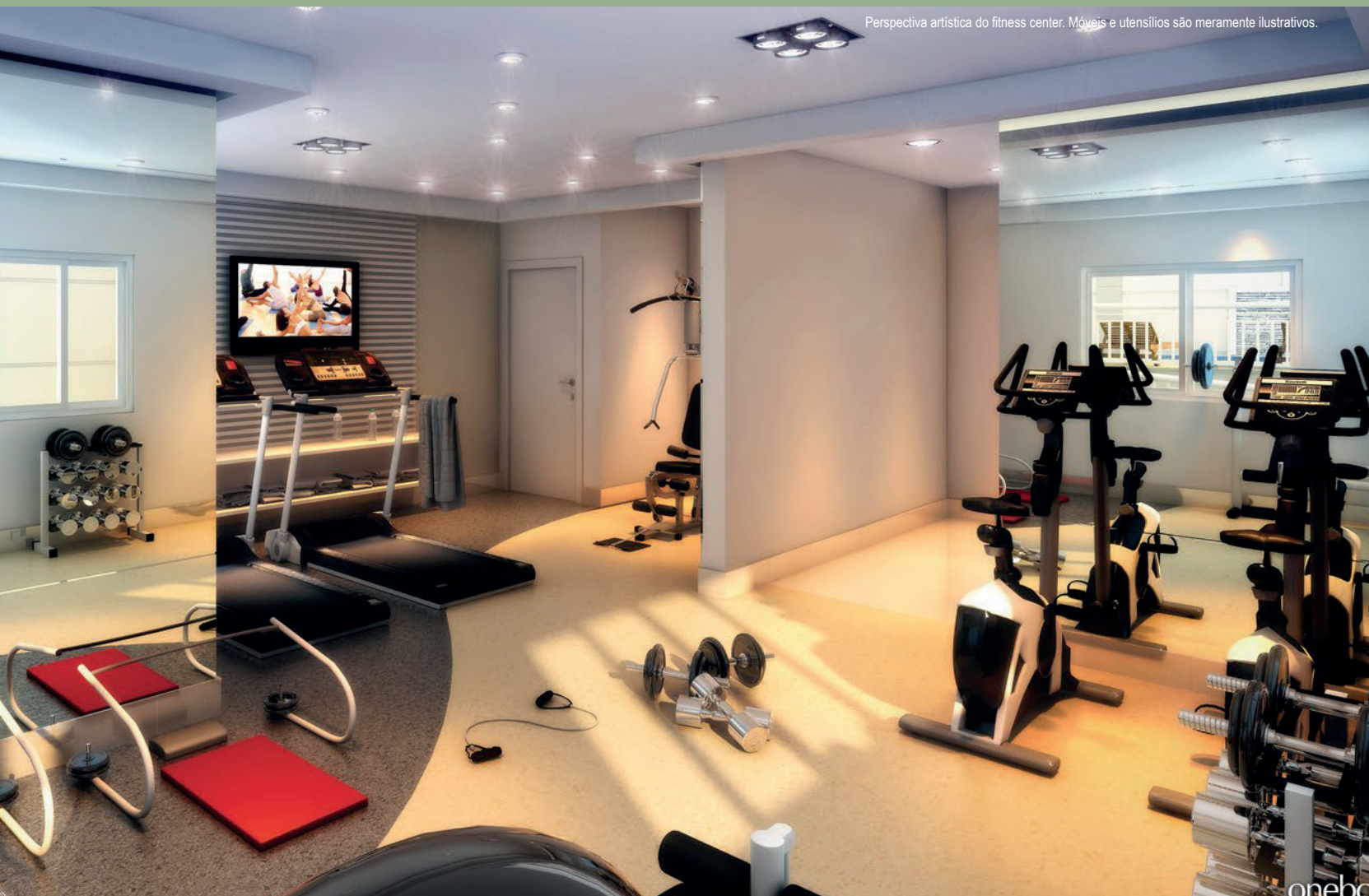
Perspectiva artística do fitness center. Móveis e utensílios são meramente ilustrativos.