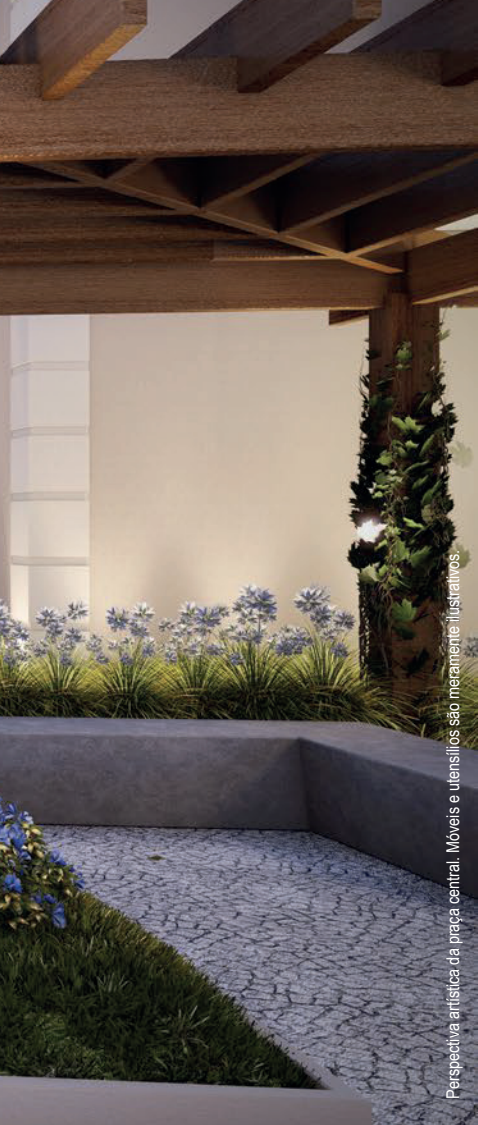
Perspectiva artística da praça central. Móveis e utensílios são meramente ilustrativos.