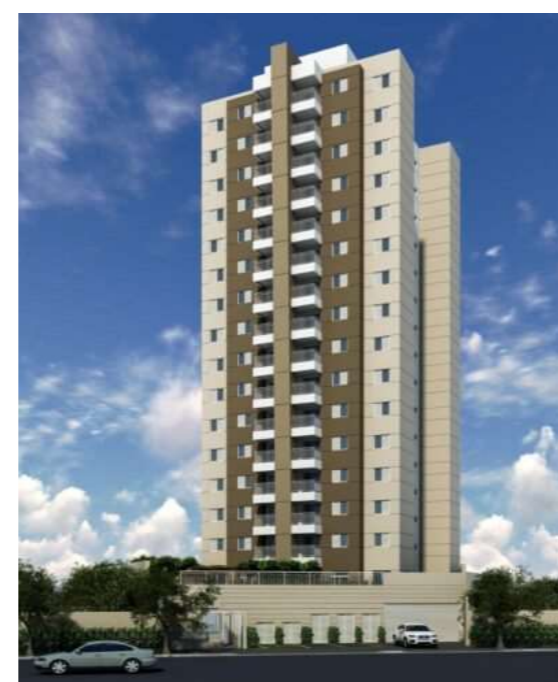
Vila Floresta/60 unidades