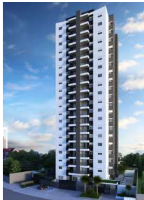
Vila Floresta/80 unidades