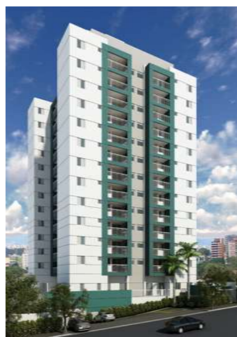
Parque das Nações/72 unidades