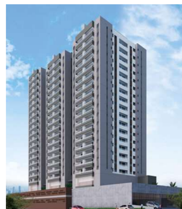
Centro (SBC)/276 unidades