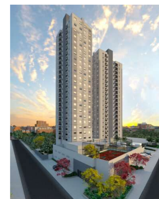
Centro (SBC)/247 unidades