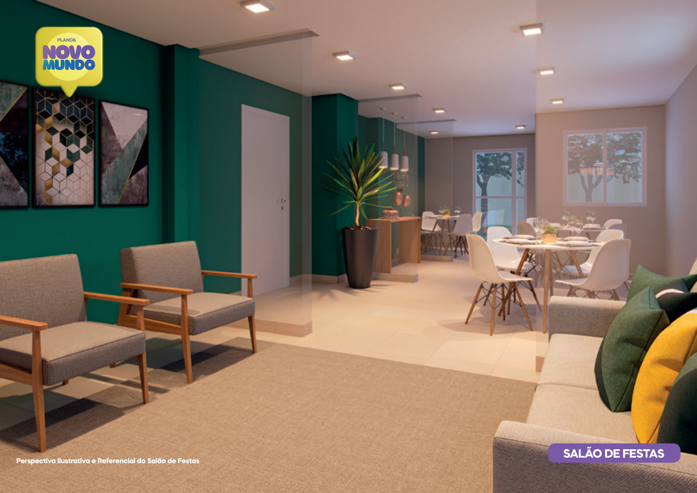
Perspectiva Ilustrativa e Referencial do Salão de Festas