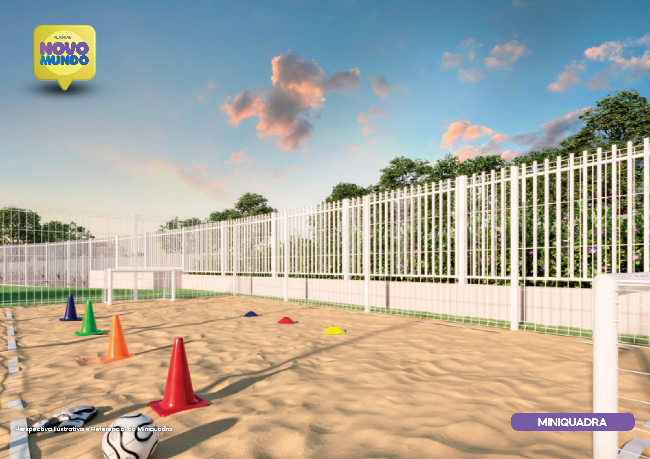
Perspectiva Ilustrativa e Referencial da Miniquadra