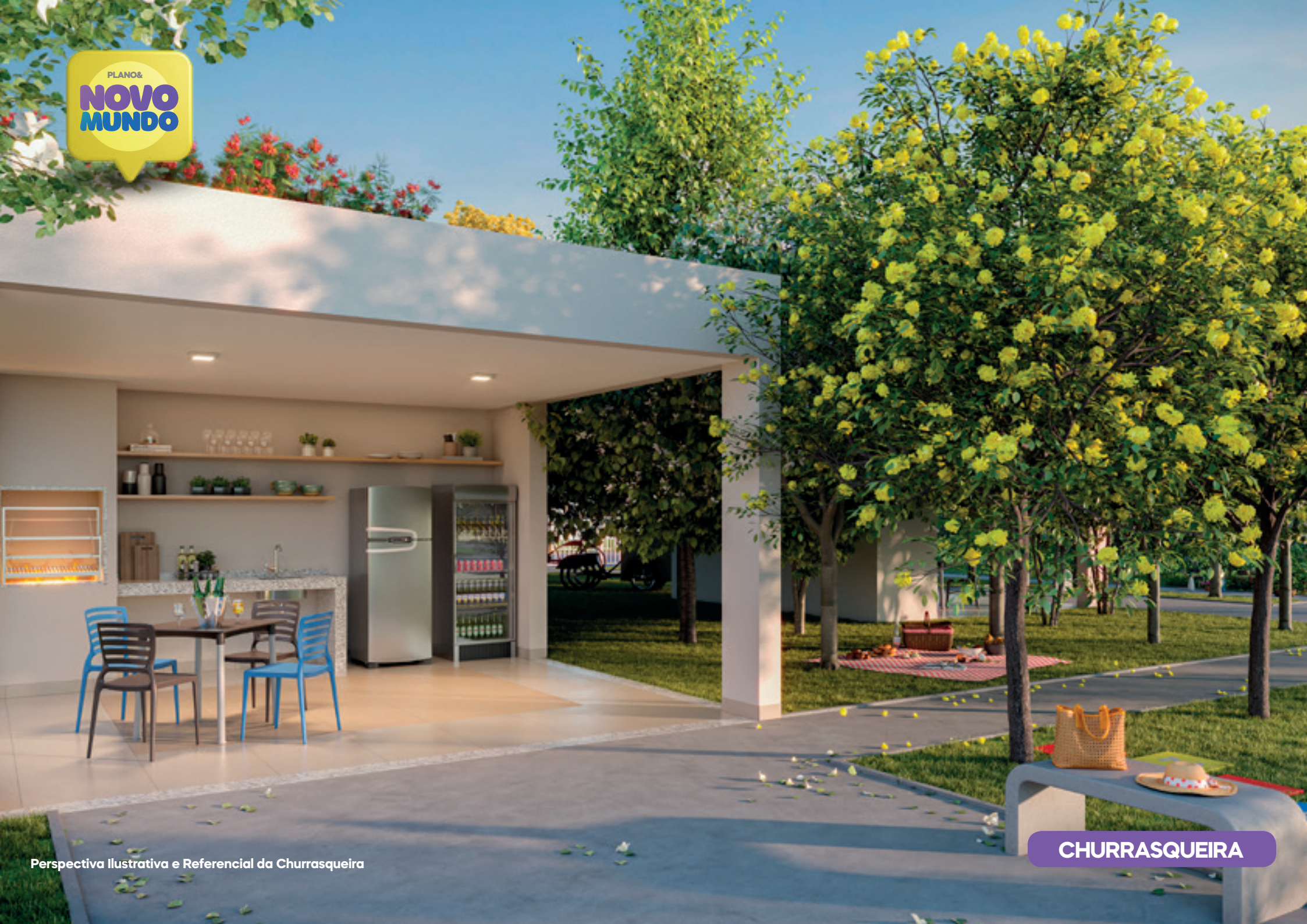
Perspectiva Ilustrativa e Referencial da Churrasqueira