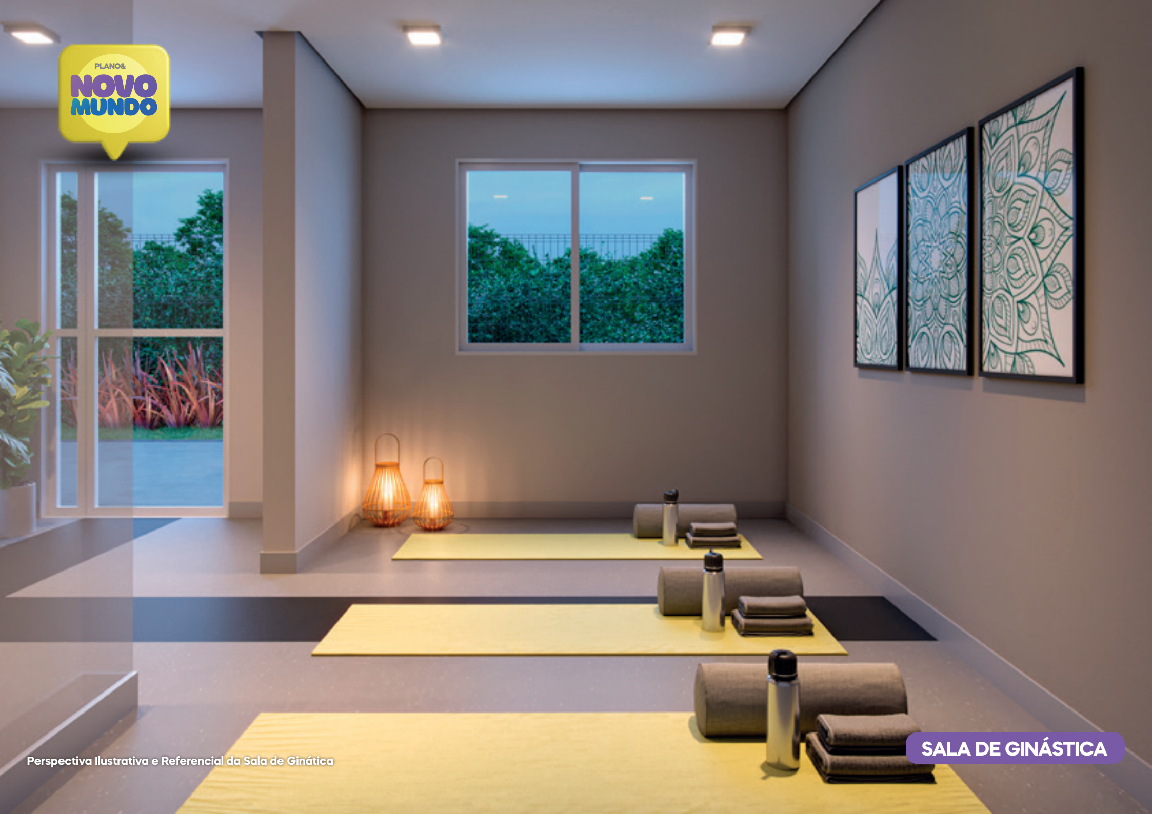
Perspectiva Ilustrativa e Referencial da Sala de Ginástica