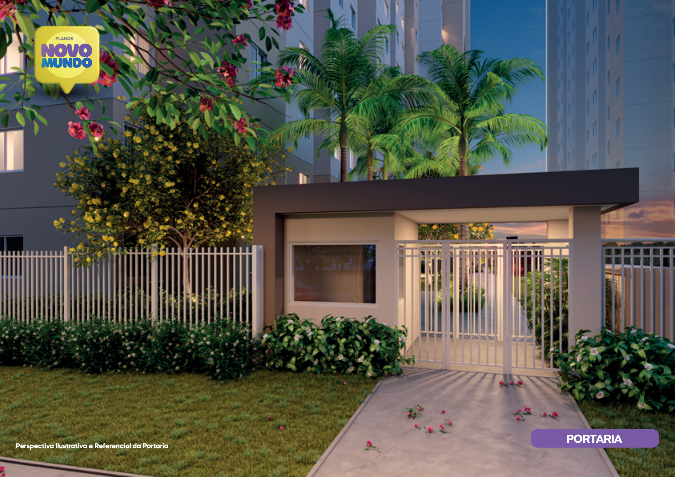
Perspectiva Ilustrativa e Referencial da Portaria