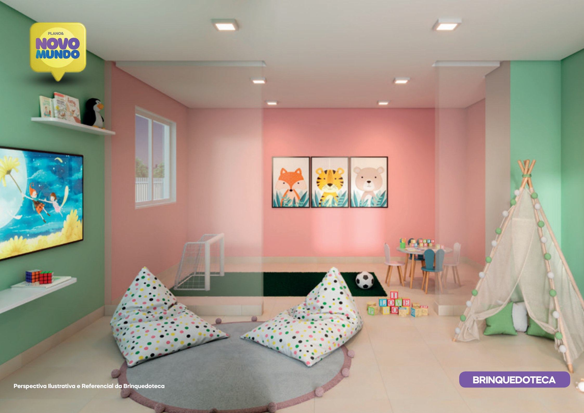
Perspectiva Ilustrativa e Referencial da Brinquedoteca