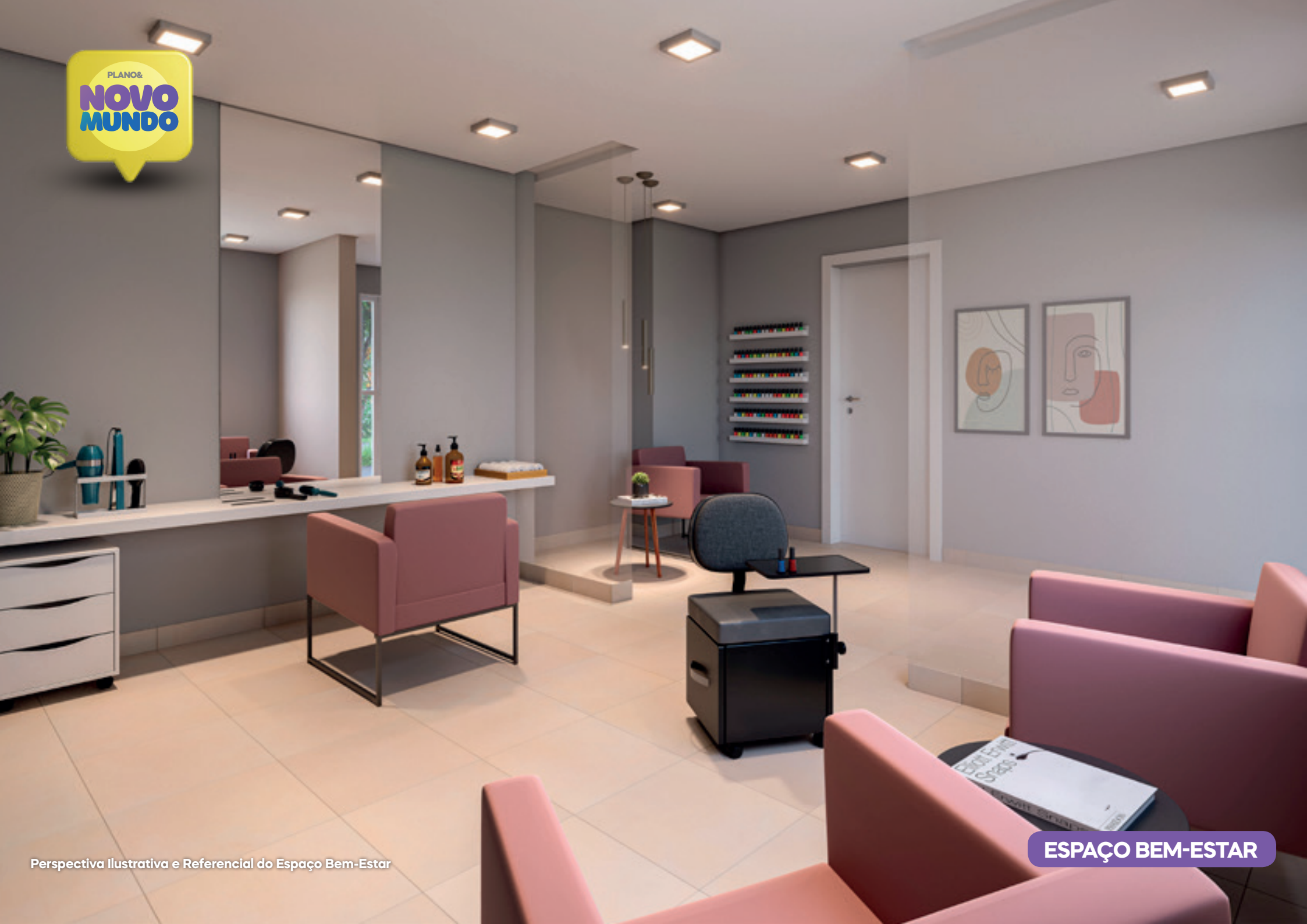
Perspectiva Ilustrativa e Referencial do Espaço Bem-Estar