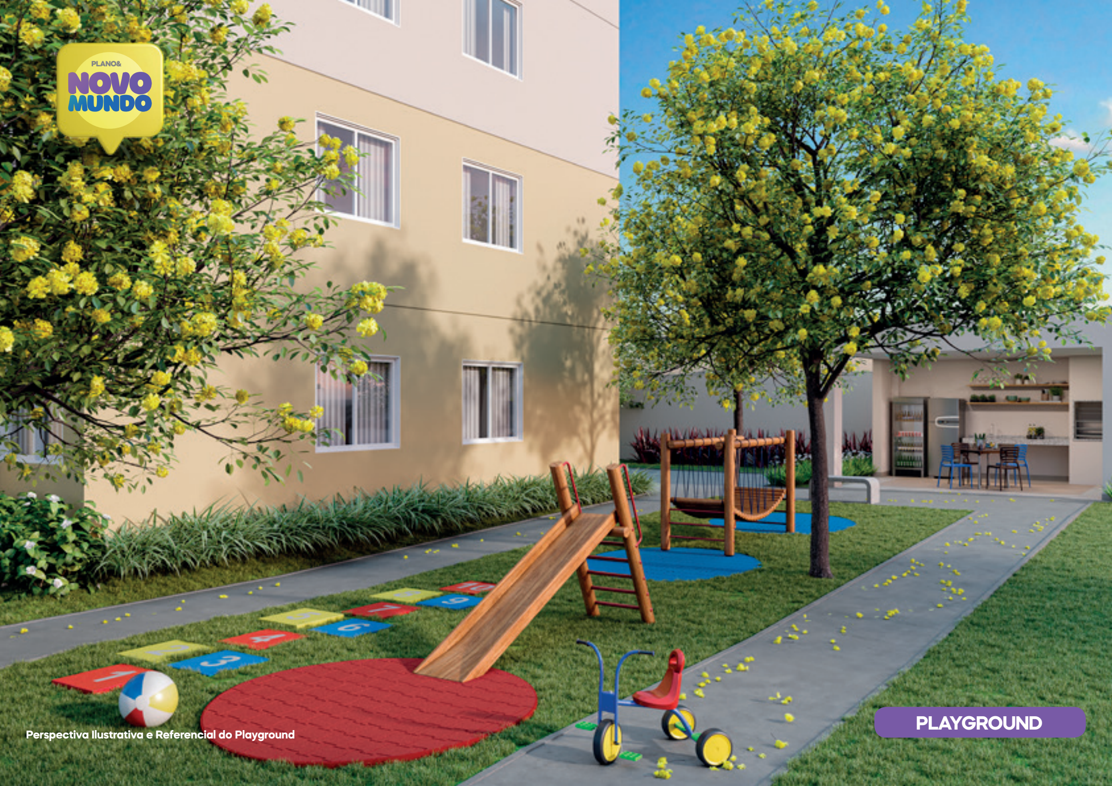
Perspectiva Ilustrativa e Referencial do Playground