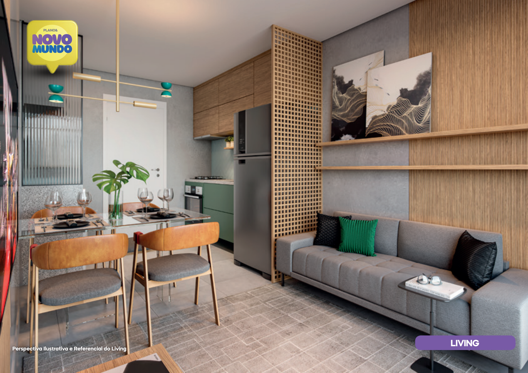
Perspectiva Ilustrativa e Referencial do Living