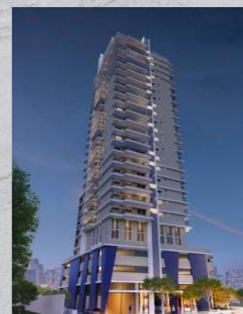
Modern Estação Butantã