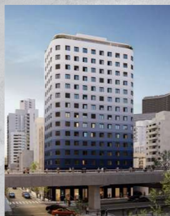
Bem Viver Marques de Itu