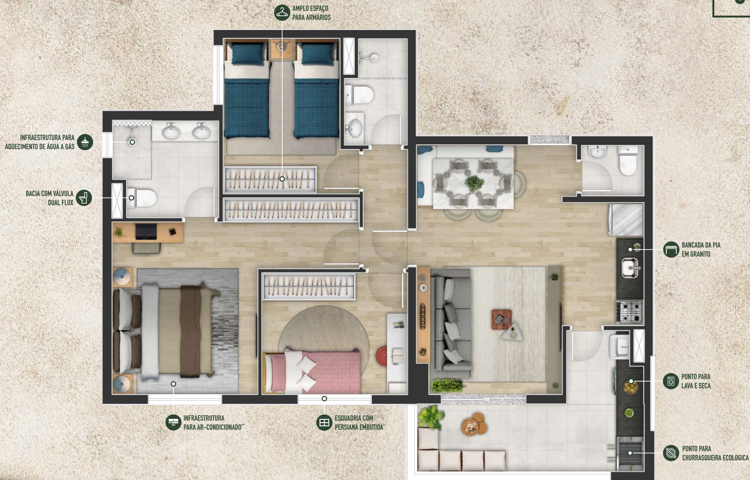
Ilustração artística da planta dos apartamentos finais 01, 02, 11 e 12 - do 1º ao 32º pavimento de 81,20m 2 privativos. Todos os móveis, objetos, pisos, rodapés, molduras, sanças e alguns pontos de iluminação estão dentro dos parâmetros comerciais e servem somente como sugestões de decoração, não integrando o imóvel comercializado. Todos os detalhamentos de equipamentos e acabamentos que farão parte deste empreendimento constam no memorial descritivo. *Janela com persiana de enrolar metálica integrada nos dormitórios. **Infraestrutura para ar-condicionado não contempla tubulação frigorígena.