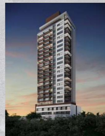
Sp Code Paulista