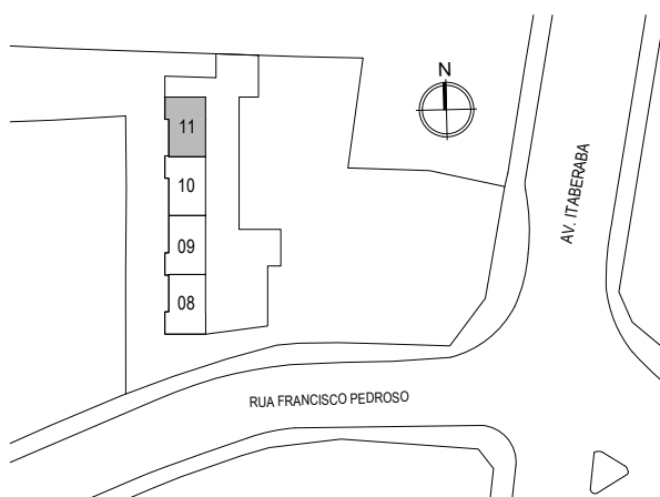
IMPLANTAÇÃO E LOCALIZAÇÃO DA UNIDADE

AS MEDIDAS NÃO CONSIDERAM OS REVESTIMENTOS; PEQUENAS VARIAÇÕES SÃO INERENTES AO PROCESSO DE CONSTRUÇÃO; A ÁREA PRIVATIVA DA UNIDADE INCLUI TODAS AS PAREDES, INTERNAS E EXTERNAS; MEDIDAS EM METROS;