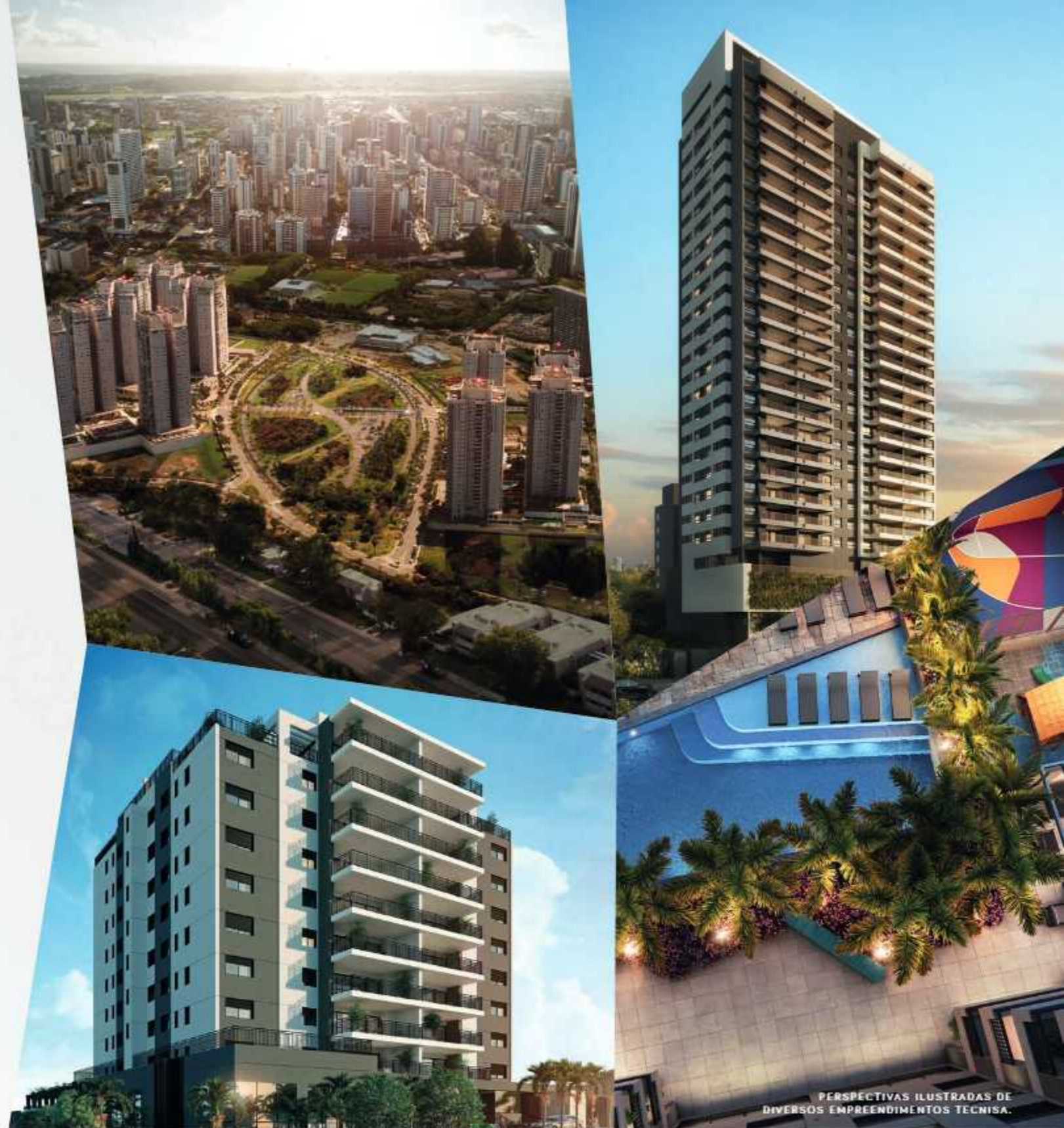
PERSPECTIVAS ILUSTRADAS DE DIVERSOS EMPREENDIMENTOS TECNISA.

Prêmio Best Innovator: A Tecnisa foi eleita a 3ª empresa mais inovadora do país.