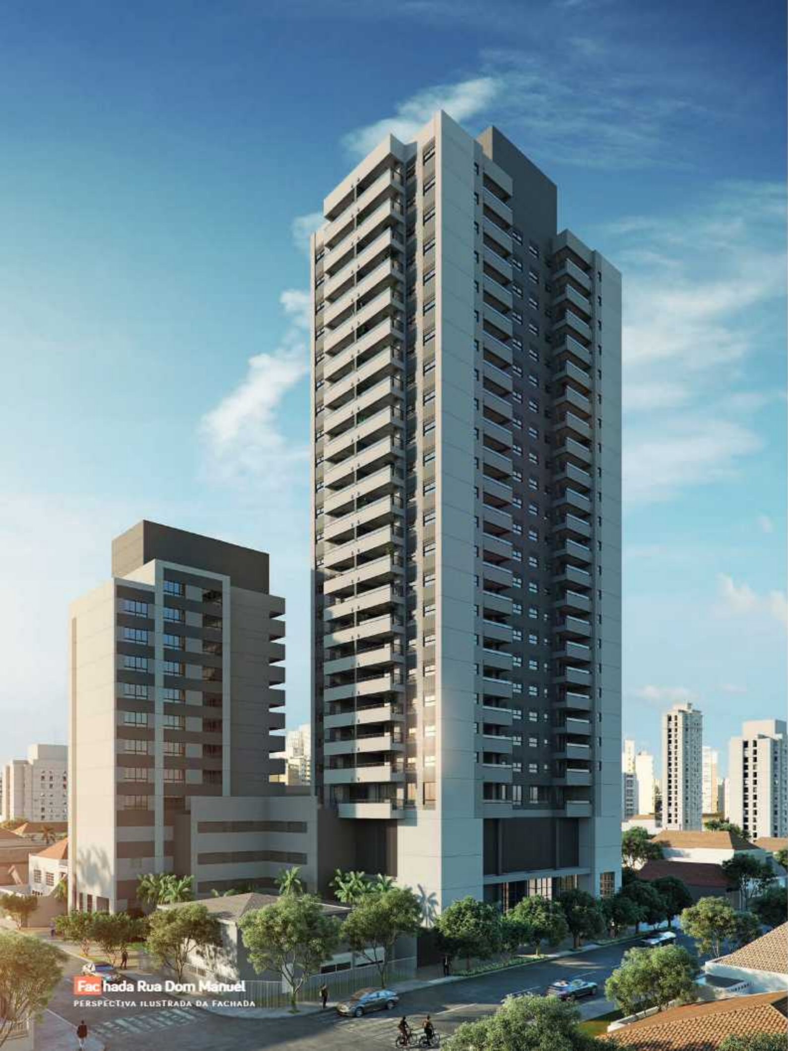
Fac hada Rua Dom Manuel PERSPECTIVA ILUSTRADA DA FACHADA