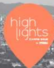
FOTO AÉREA DA REGIÃO