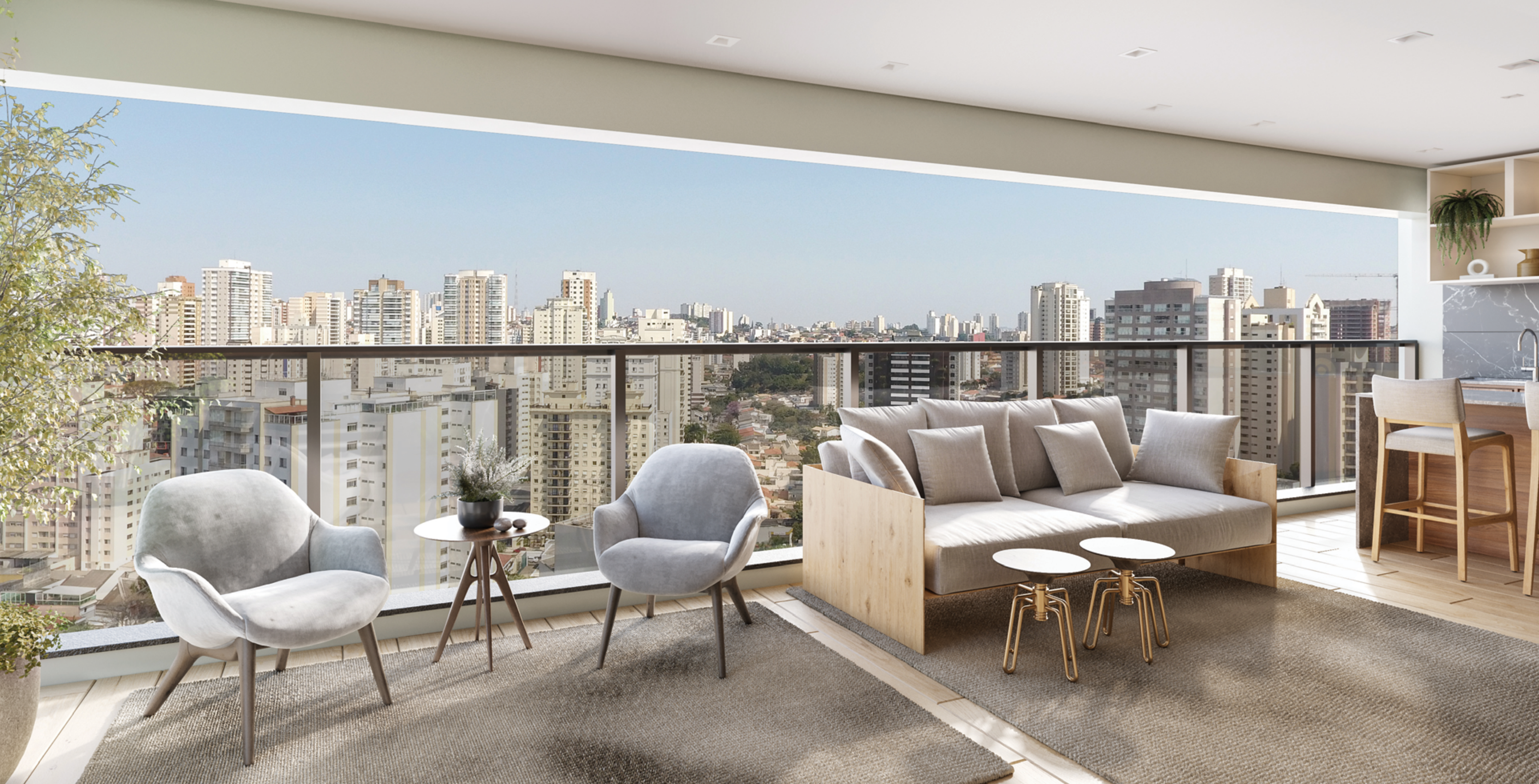
PERSPECTIVA ARTÍSTICA DA VARANDA