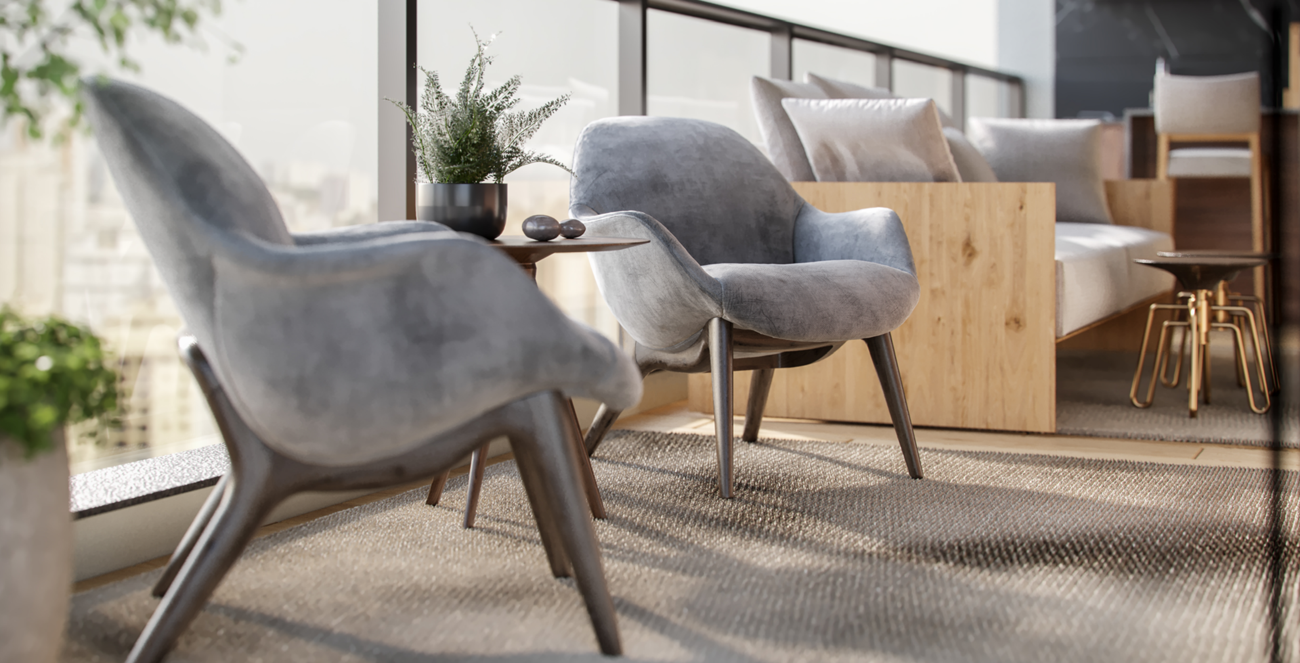
PERSPECTIVA ARTÍSTICA DO DETALHE DA VARANDA