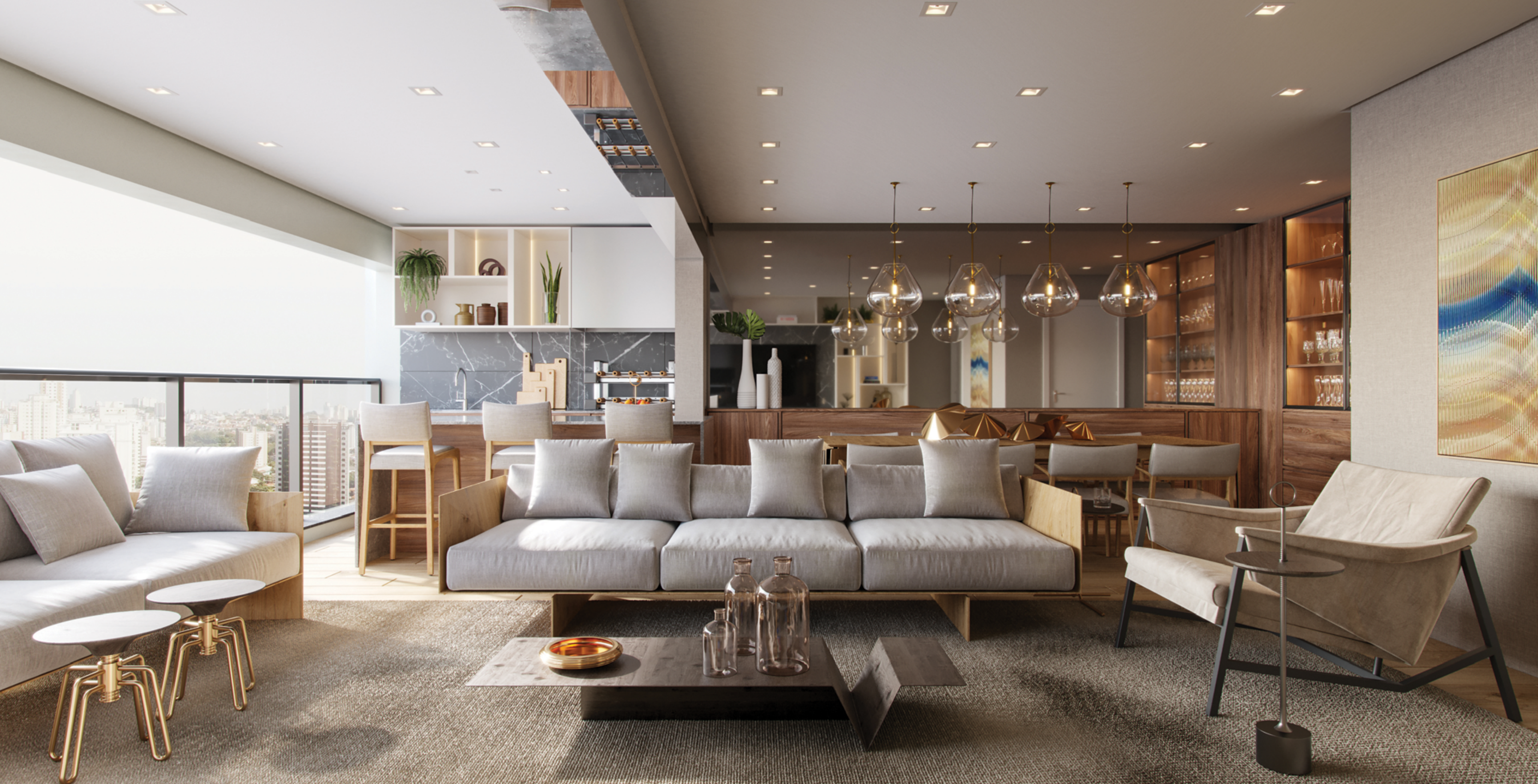
PERSPECTIVA ARTÍSTICA DO LIVING INTEGRADO COM A VARANDA