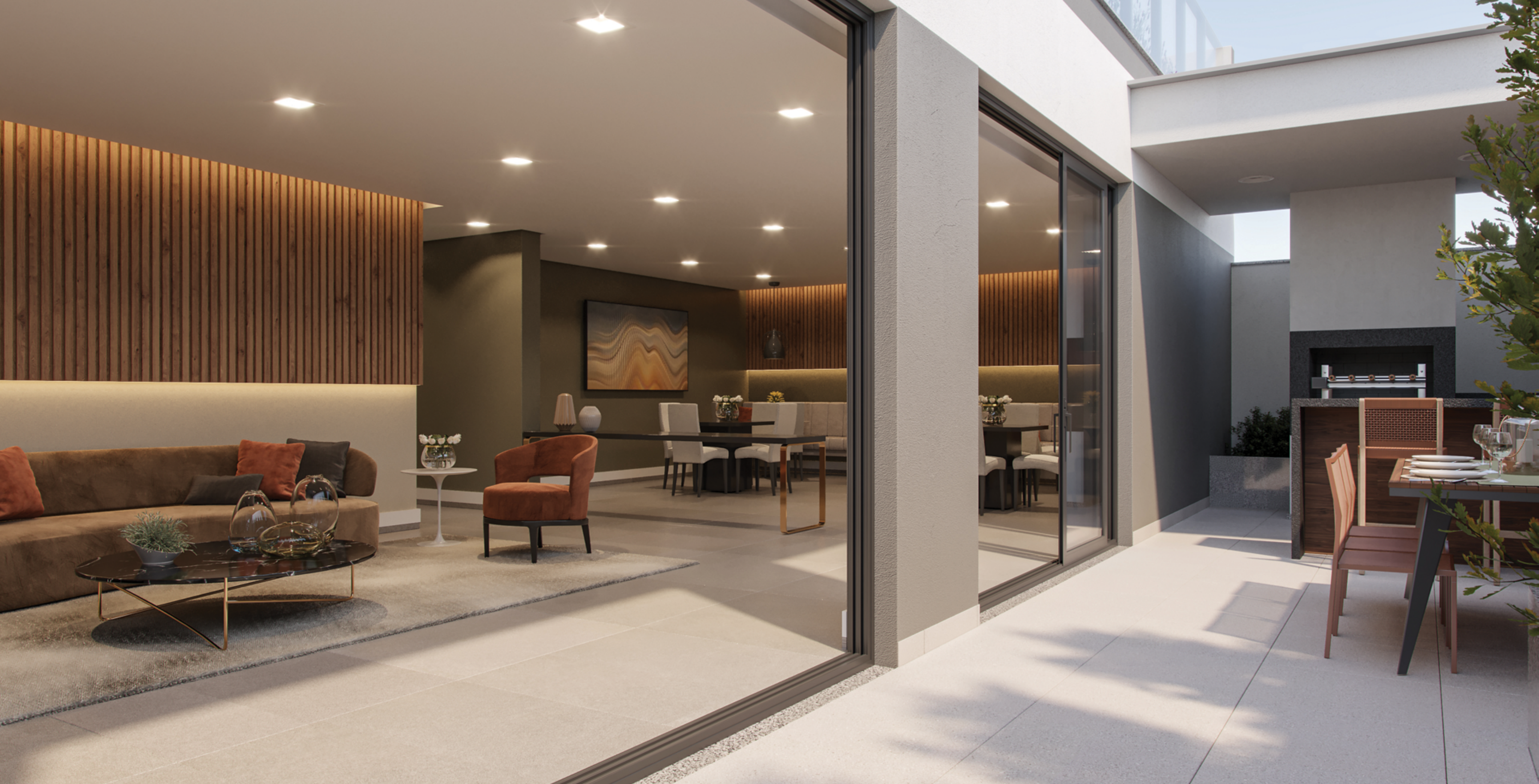
PERSPECTIVA ARTÍSTICA DO SALÃO DE FESTA COM CHURRASQUEIRA