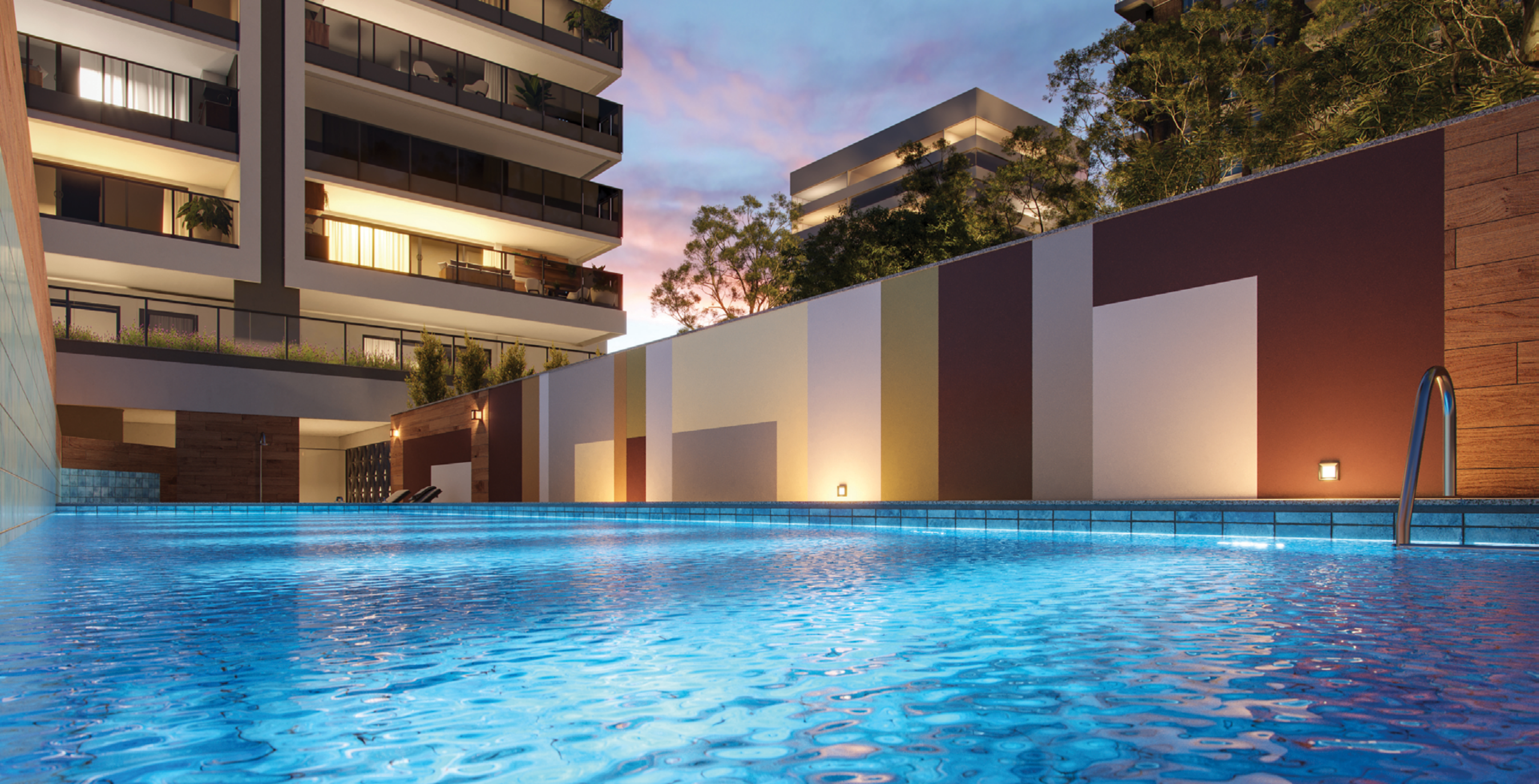
PERSPECTIVA ARTÍSTICA DA PISCINA