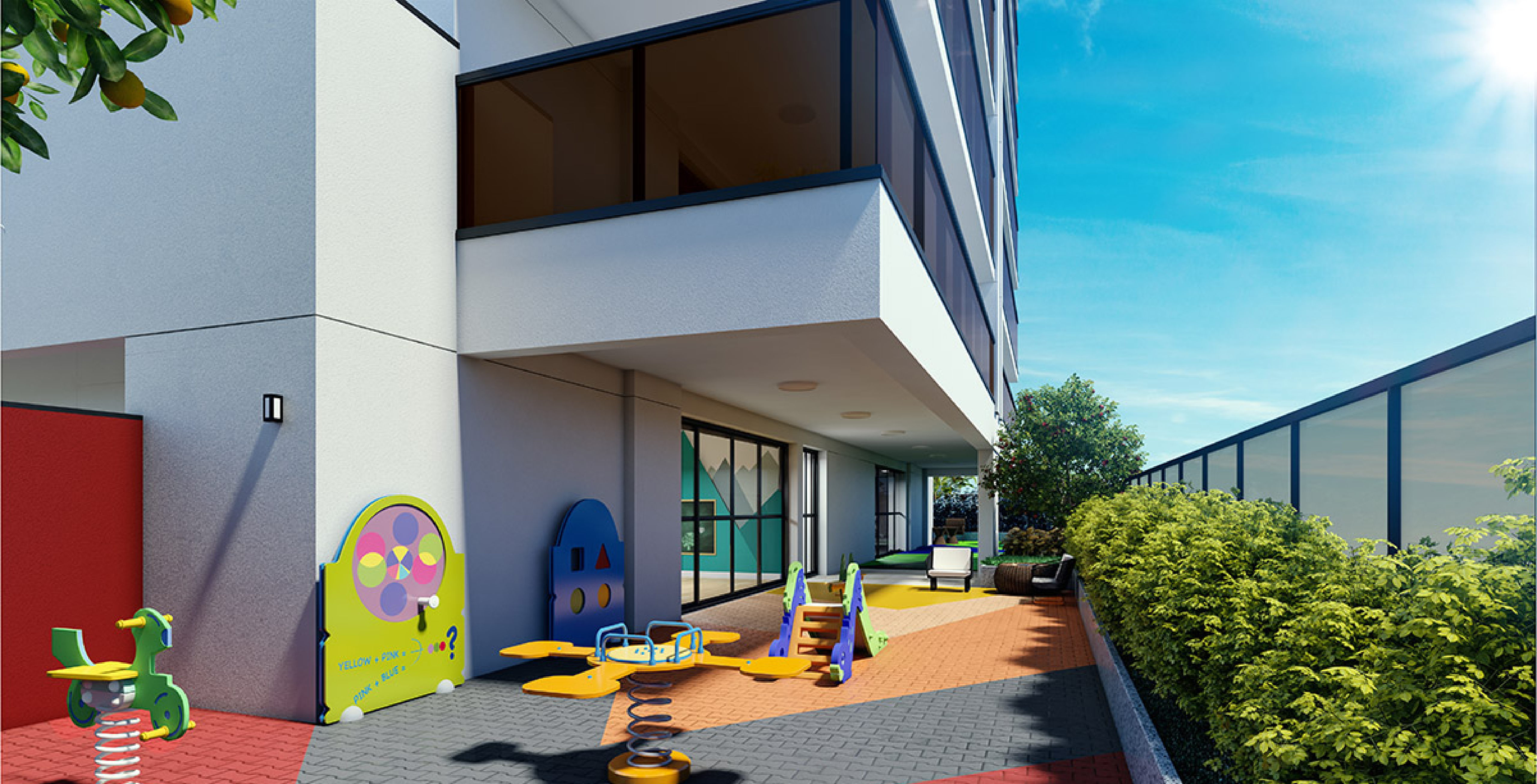
PERSPECTIVA ARTÍSTICA DO PLAYGROUND