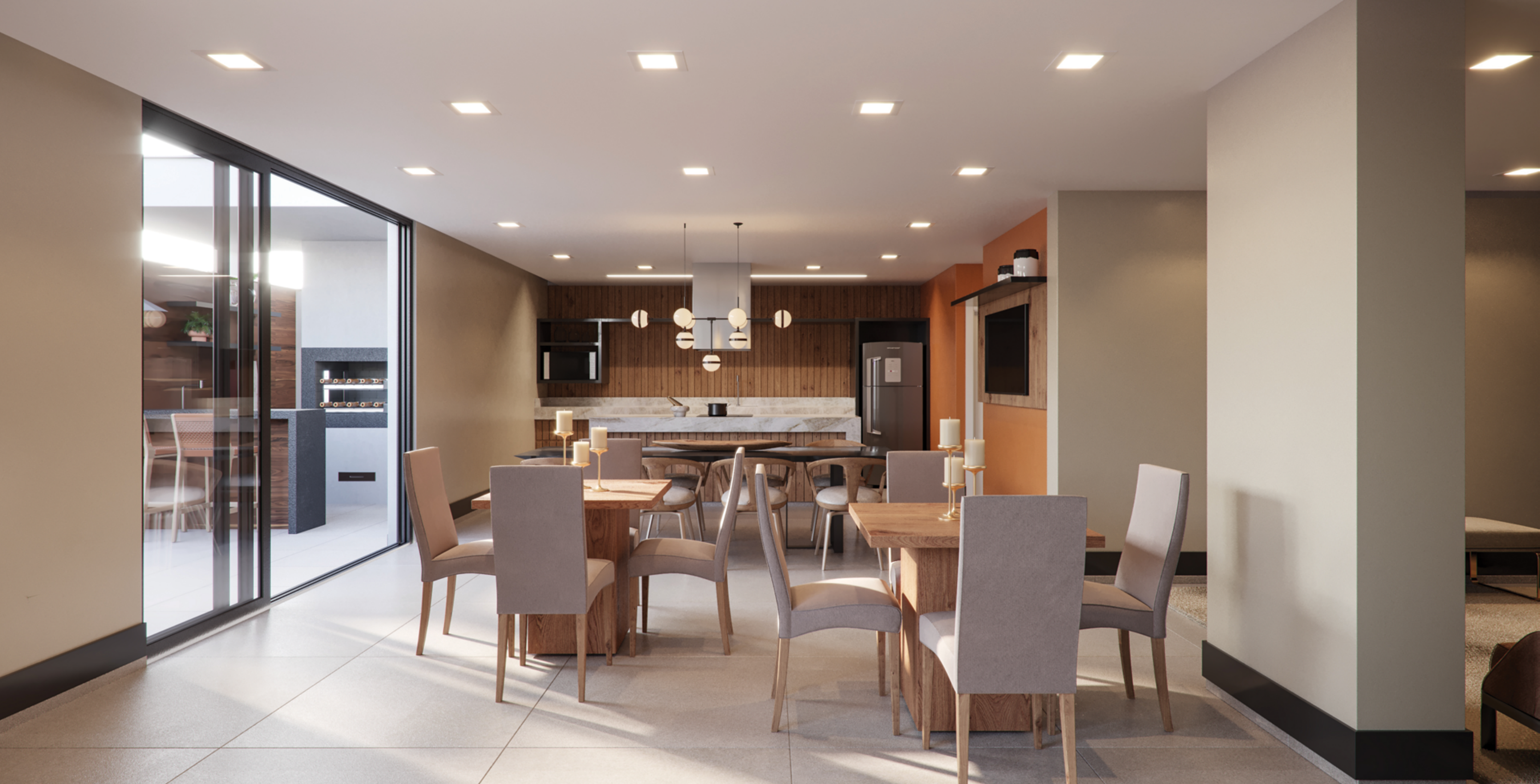
PERSPECTIVA ARTÍSTICA DO ESPAÇO GOURMET INTEGRADO COM A CHURRASQUEIRA