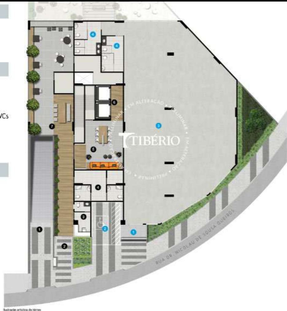
Ilustração artística do térreo