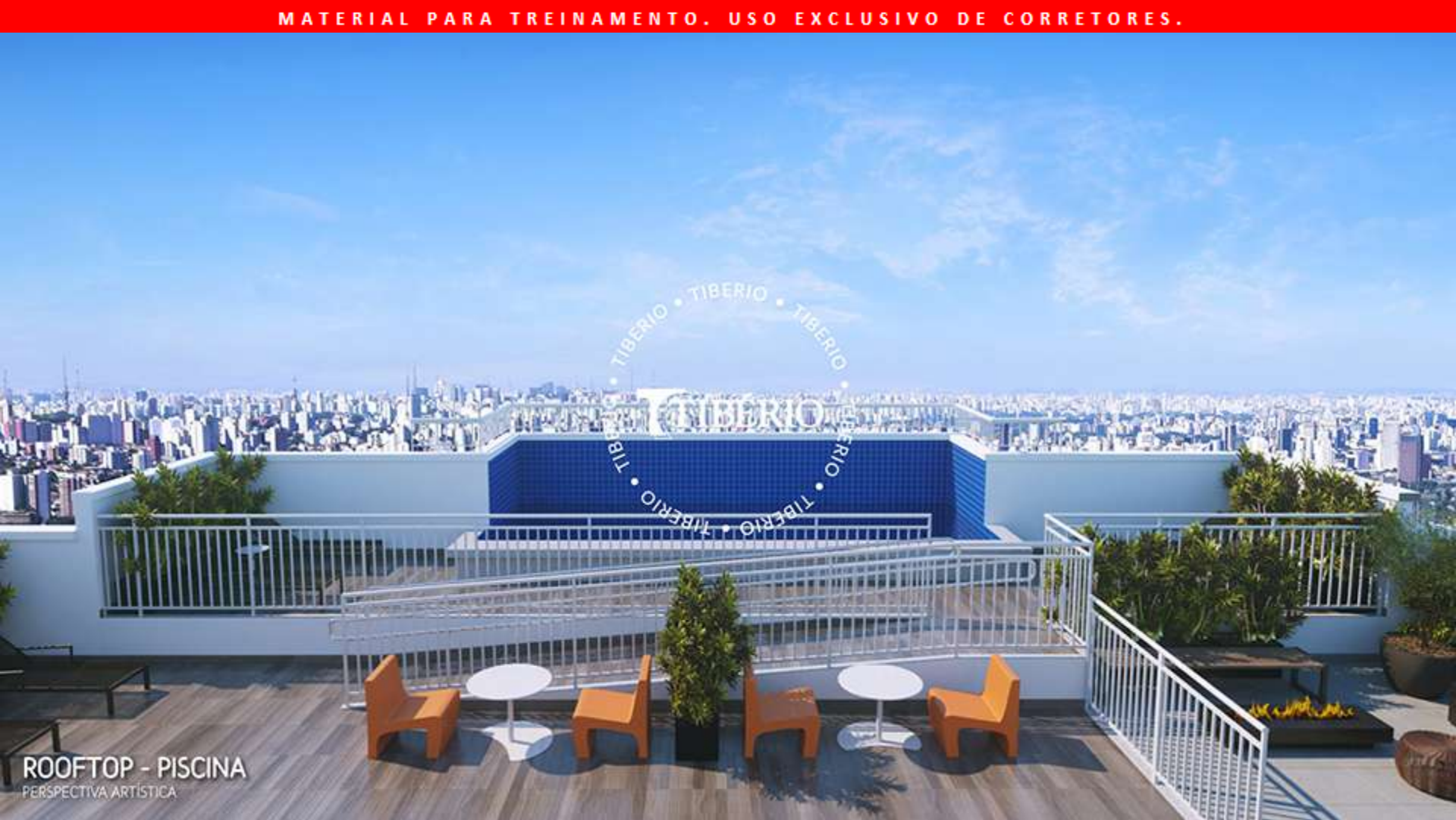
ROOFTOP - PISCINA PERSPECTIVA ARTÍSTICA