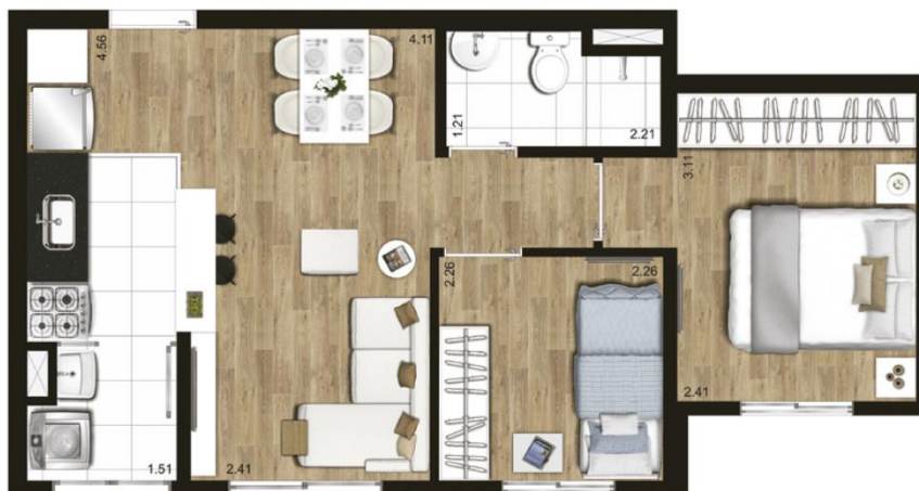
Planta ilustrativa de 40,90 m 2 - tipo, finais 3 e 6, com sugestão de decoração. Os móveis, objetos e equipamentos, assim como os materiais de acabamento apresentados na planta, têm dimensões comerciais e não são parte integrante do contrato.