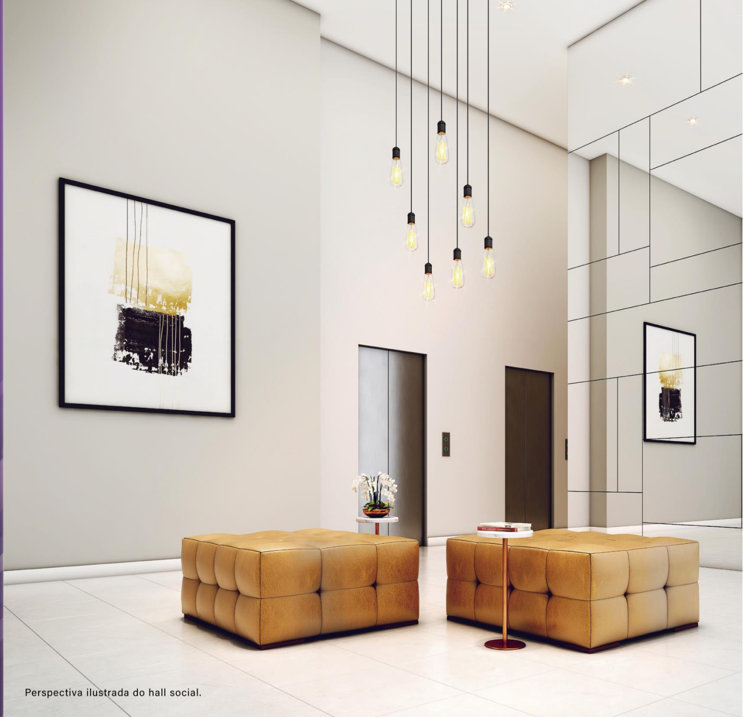
Perspectiva ilustrada do hall social.