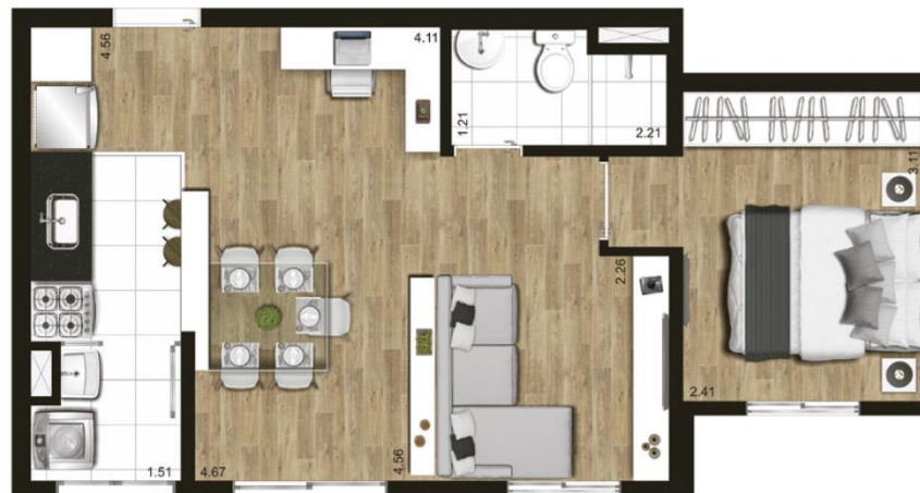
Planta ilustrativa de 40,90 m 2 - opção com sala ampliada - finais 3 e 6, com sugestão de decoração. Os móveis, objetos e equipamentos, assim como os materiais de acabamento apresentados na planta, têm dimensões comerciais e não são parte integrante do contrato.