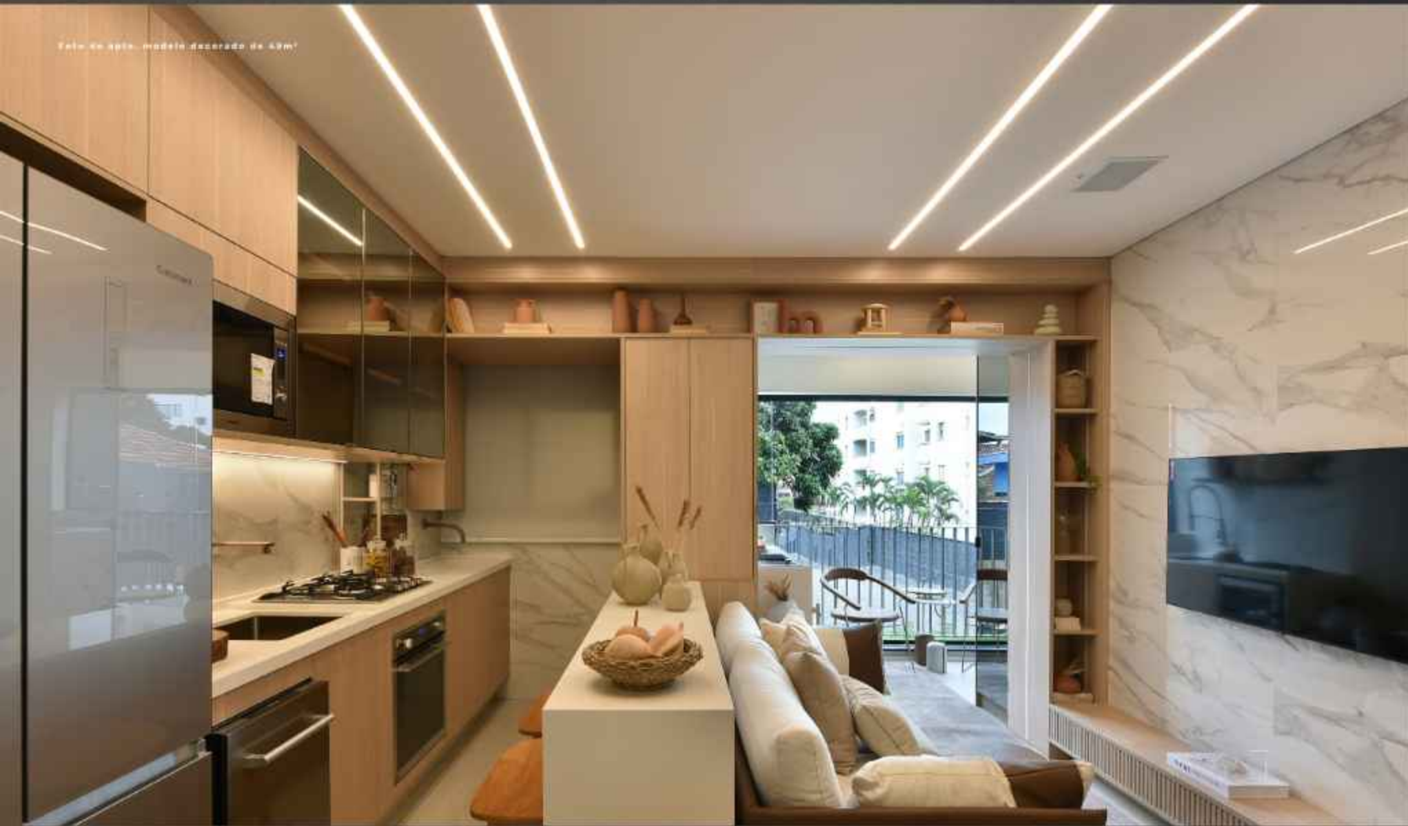
Foto de apto. modelo decorado de 49m 2