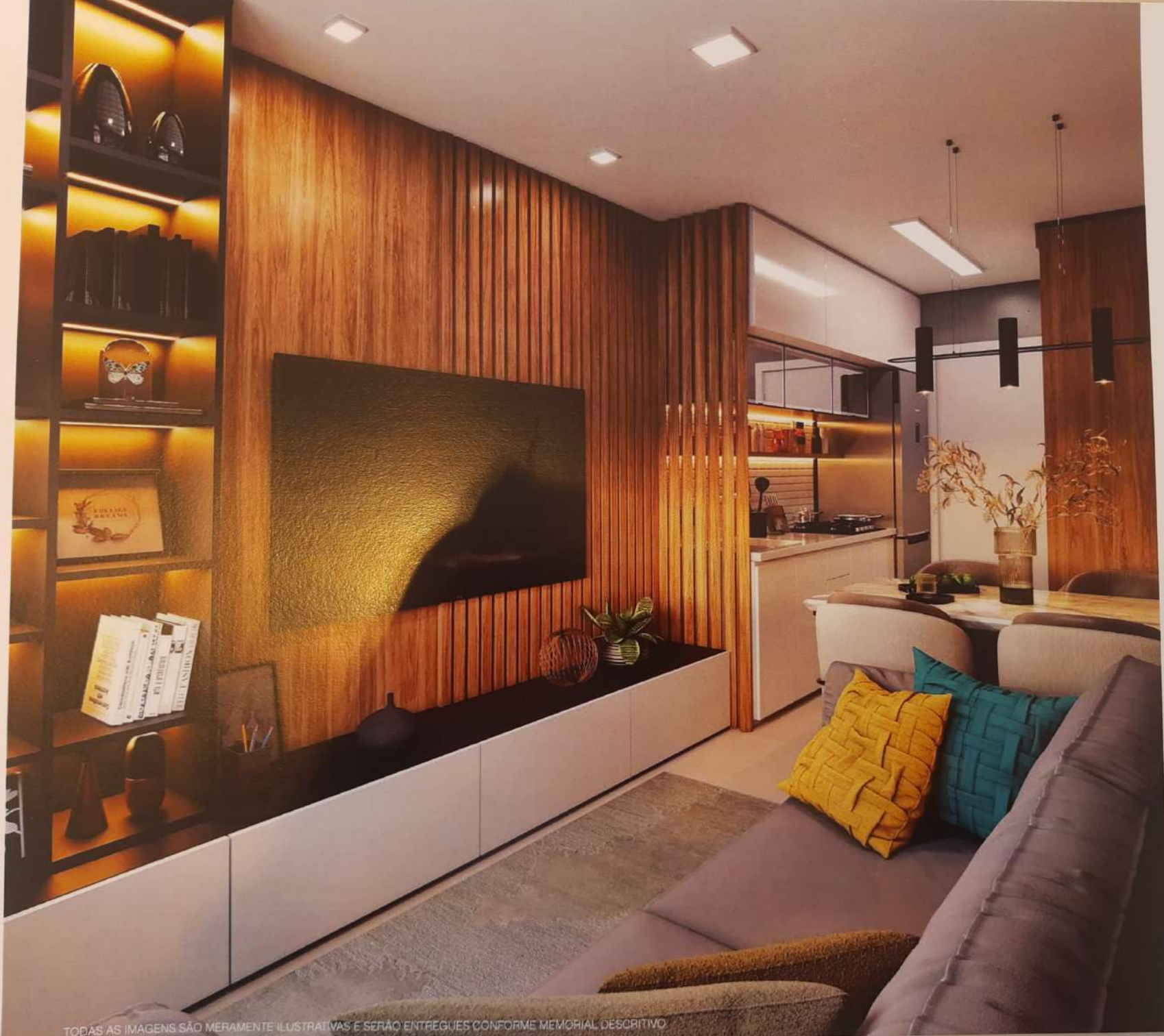
Perspectiva artística do LIVING (APTO. TIPO 2)

TODAS AS IMAGENS SÃO MERAMENTE ILUSTRATIVAS E SERÃO ENTREGUES CONFORME MEMORIAL DESCRITIVO