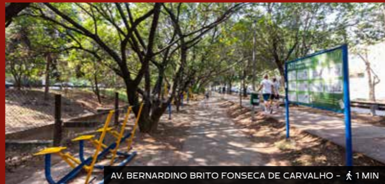
AV. BERNARDINO BRITO FONSECA DE CARVALHO - 1 MIN