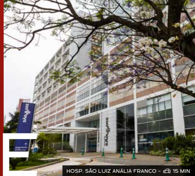
HOSP. SÃO LUIZ ANÁLIA FRANCO - 15 MIN

PARA VOCÊ MORAR COM TRANQUILIDADE E, AO MESMO TEMPO, VIVER CONECTADO AO MELHOR DA CIDADE.