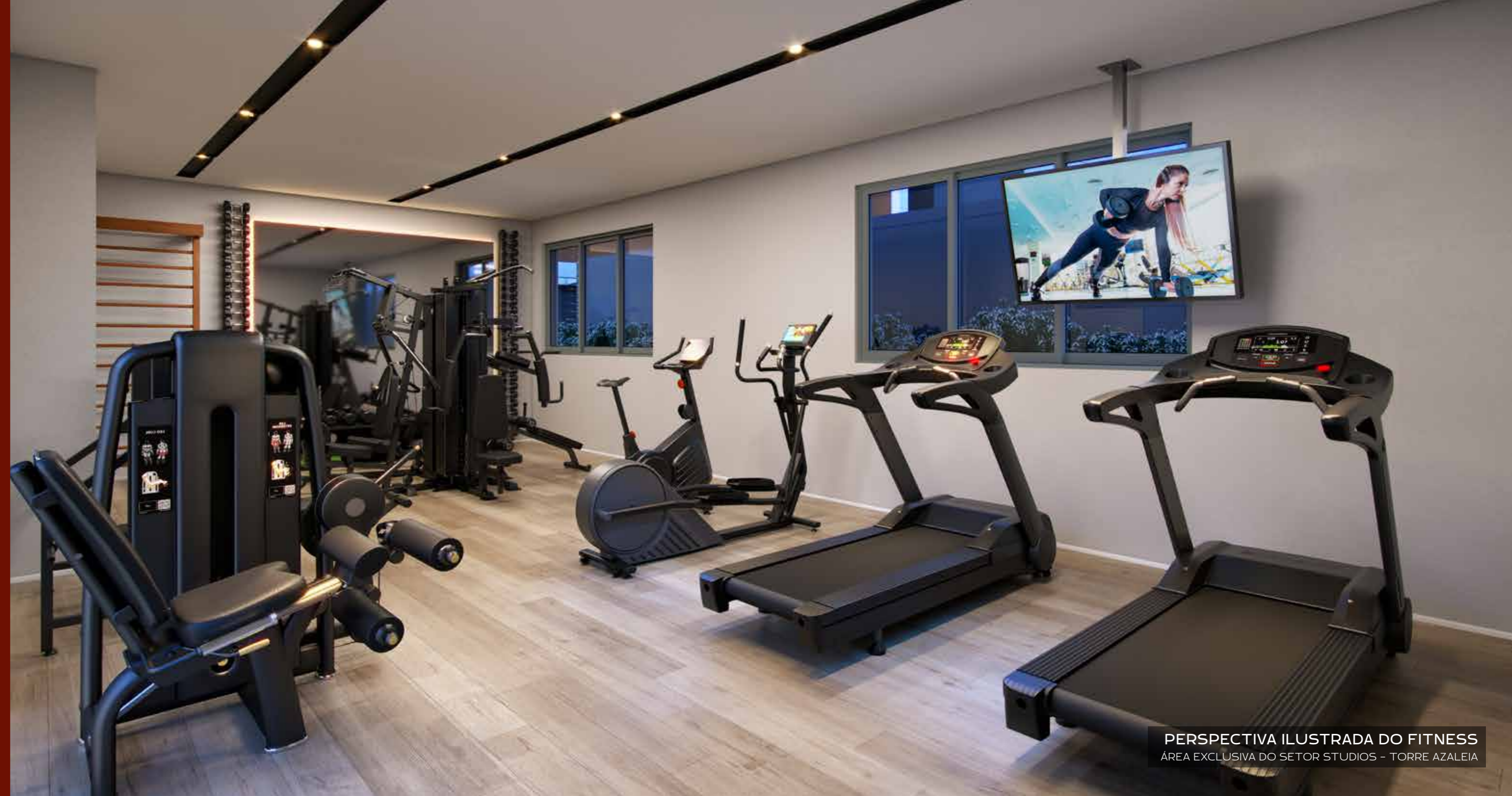
PERSPECTIVA ILUSTRADA DO FITNESS ÁREA EXCLUSIVA DO SETOR STUDIOS - TORRE AZALEIA