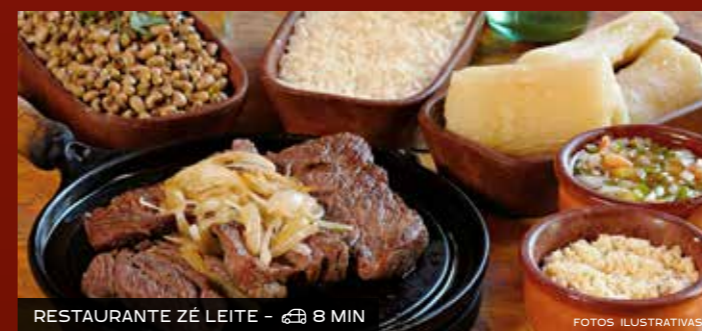
RESTAURANTE ZÉ LEITE - 8 MIN