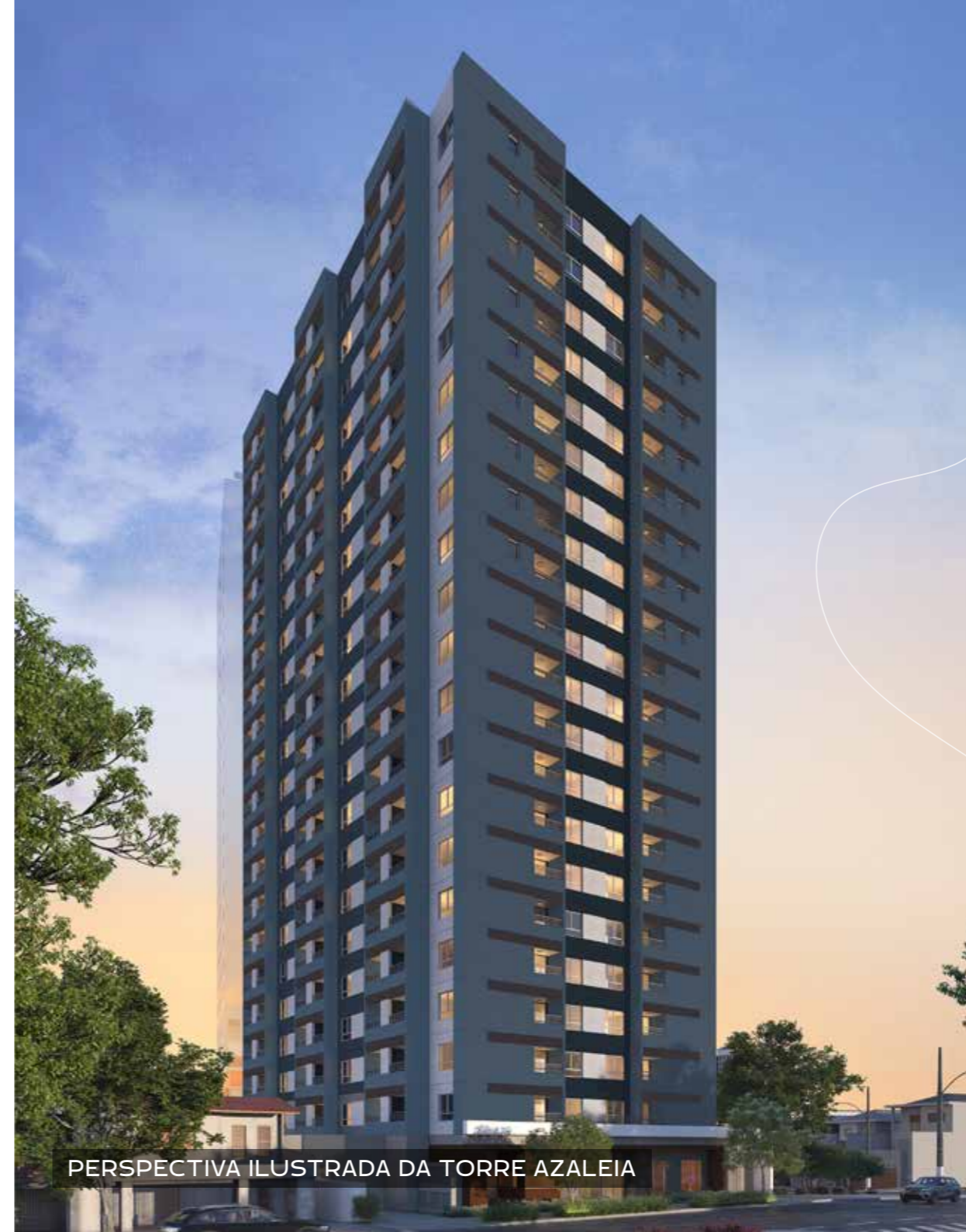
PERSPECTIVA ILUSTRADA DA TORRE AZALEIA

Escritório de arquitetura paisagística, planejamento urbano e ambiental, atuando no planejamento de áreas externas de edifícios residenciais, comerciais e institucionais, loteamentos, praças, parques e áreas livres, desde Março de 1999. A Núcleo Arquitetura da Paisagem tem refletido em seu trabalho a união entre meio ambiente, arte e paisagismo potencializando as vocações de cada projeto em um conjunto harmonioso e integrado à arquitetura e à paisagem.