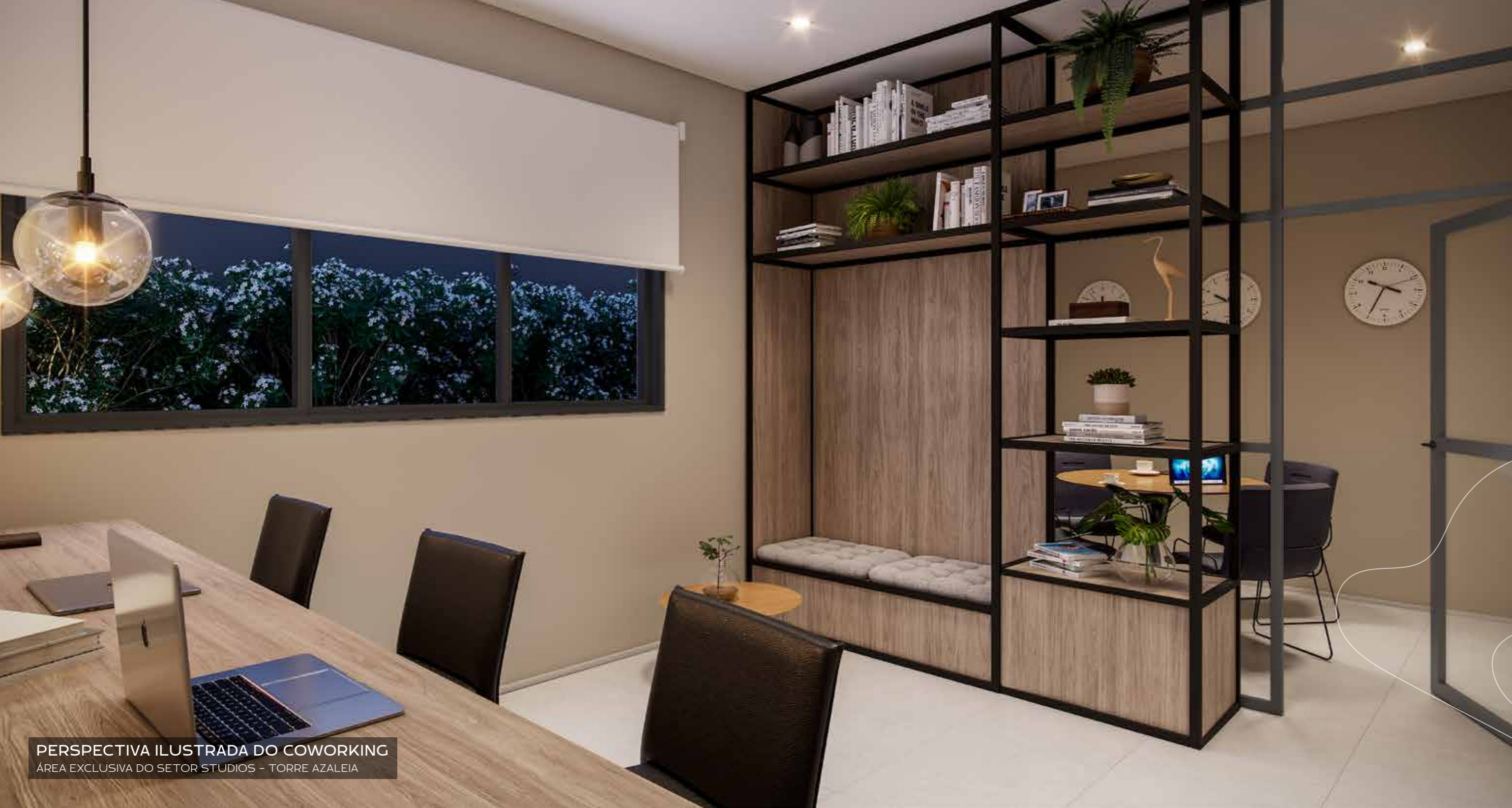
PERSPECTIVA ILUSTRADA DO COWORKING ÁREA EXCLUSIVA DO SETOR STUDIOS - TORRE AZALEIA