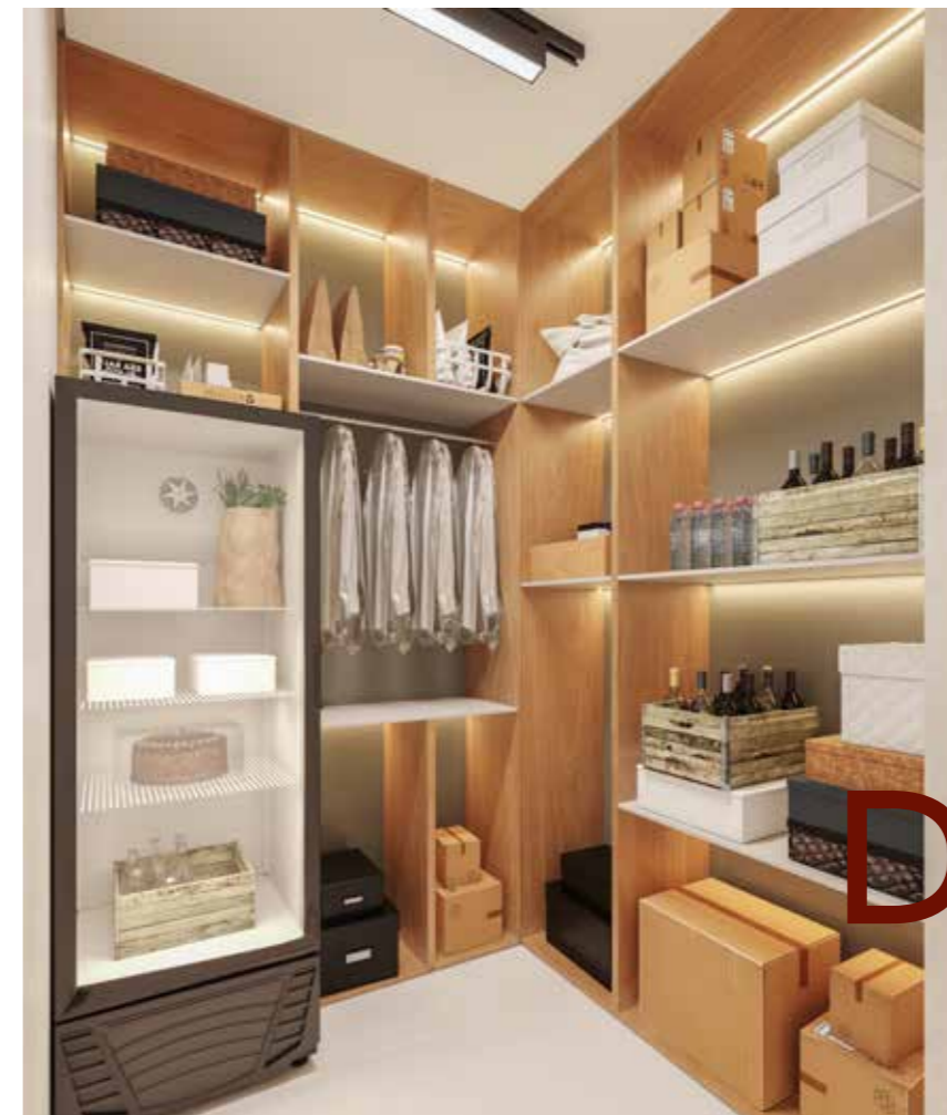
PERSPECTIVA ILUSTRADA DO DELIVERY ÁREA EXCLUSIVA DO SETOR STUDIOS - TORRE AZALEIA

O MAQUINÁRIO DA ÁREA DA LAVANDERIA SERÁ ENTREGUE PELA OMO LAVANDERIA COMPARTILHADA OU POR OUTRA EMPRESA ESPECIALIZADA DO RAMO, A QUAL SERÁ FUTURAMENTE CONTRATADA PELO CONDOMÍNIO, FICANDO CERTO QUE OS SERVIÇOS RELACIONADOS SERÃO REMUNERADOS PELO CONDÔMINO NO SISTEMA PAY-PER-USE.