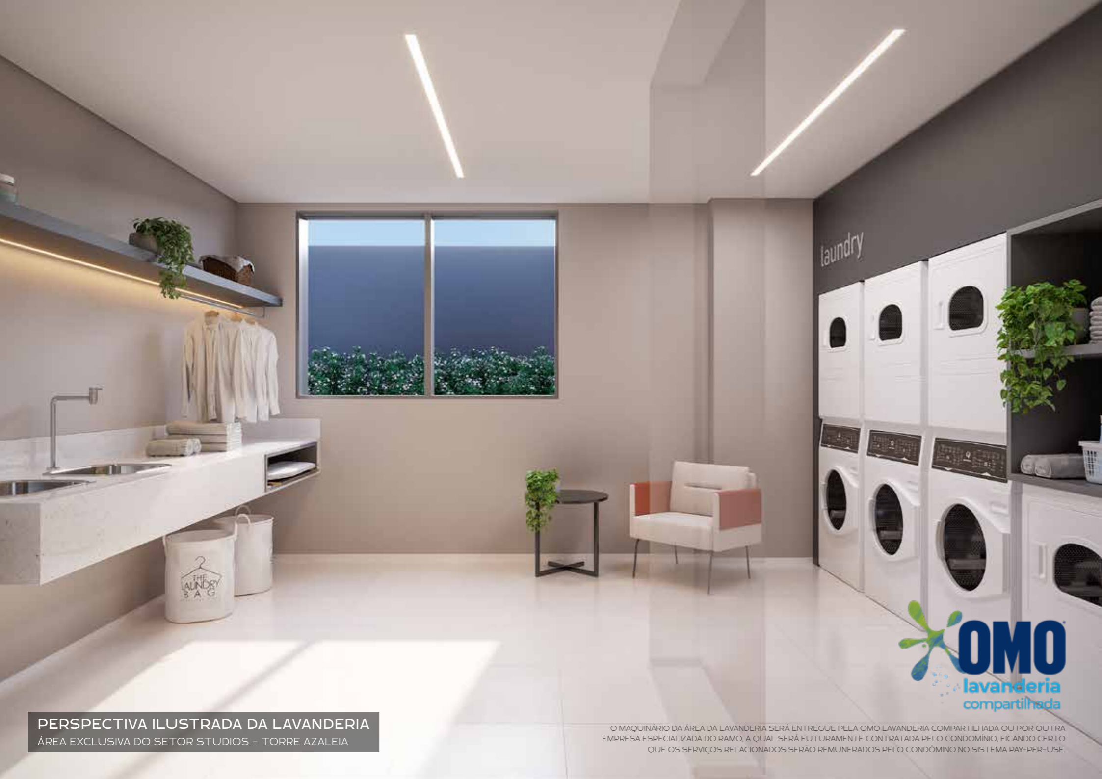
PERSPECTIVA ILUSTRADA DA LAVANDERIA ÁREA EXCLUSIVA DO SETOR STUDIOS - TORRE AZALEIA