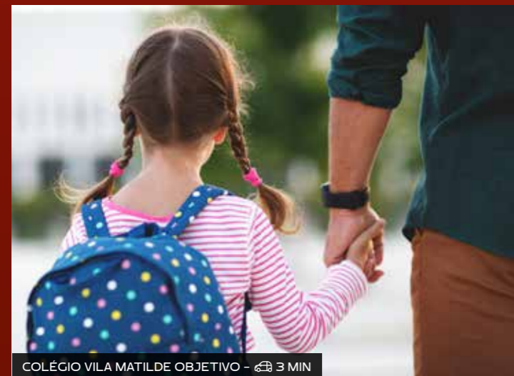
COLÉGIO VILA MATILDE OBJETIVO - 3 MIN