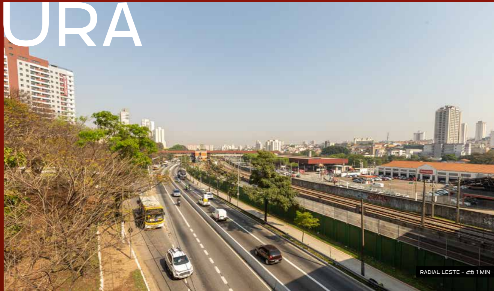
RADIAL LESTE - 1 MIN