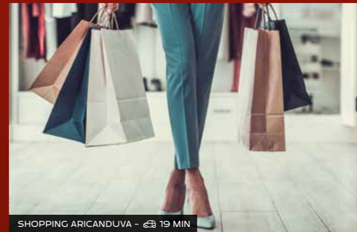
SHOPPING ARICANDUVA - 19 MIN