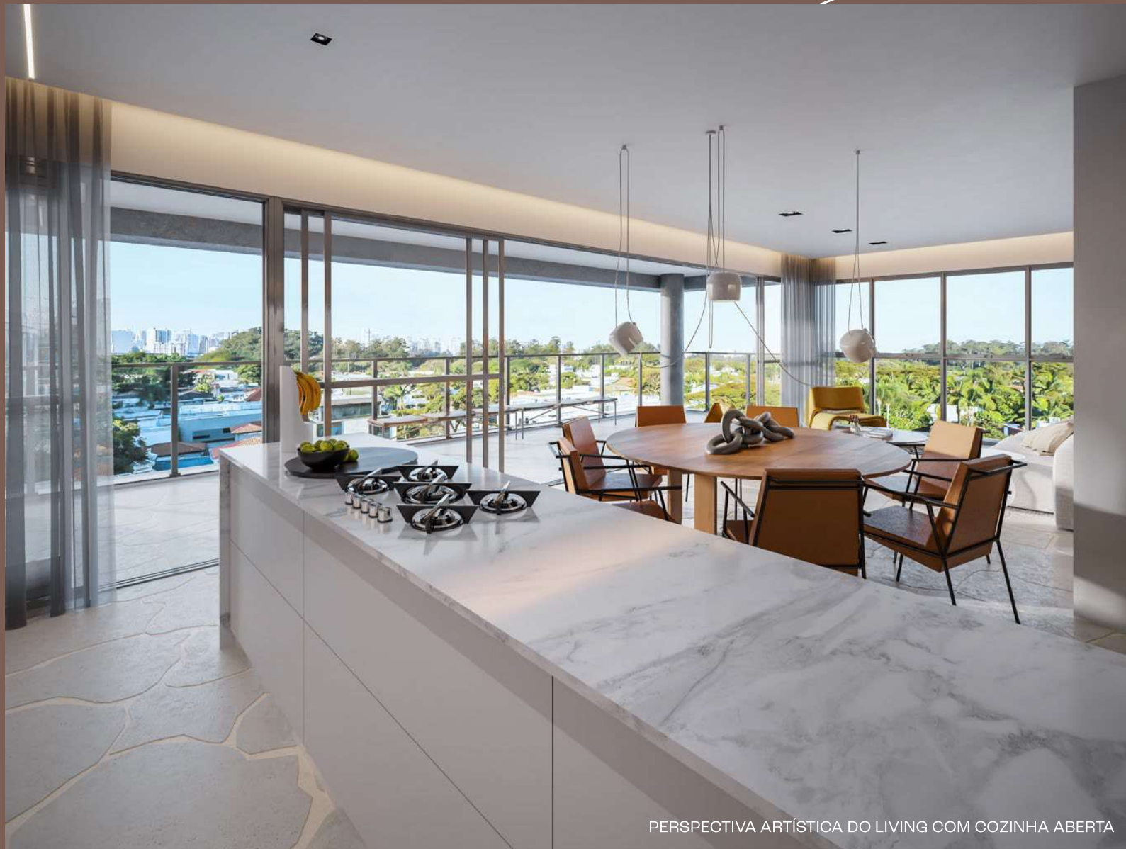
PERSPECTIVA ARTÍSTICA DO LIVING COM COZINHA ABERTA