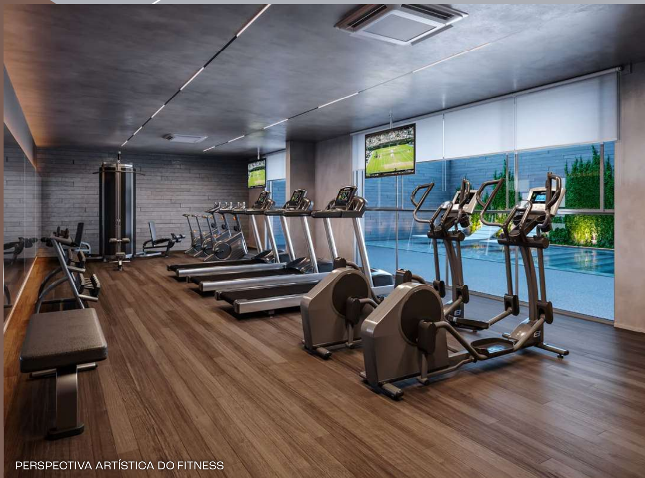
PERSPECTIVA ARTÍSTICA DO FITNESS

CORPO EM DIA E MENTE EM FORMA, O CARPE DIEM DA LONGEVIDADE.