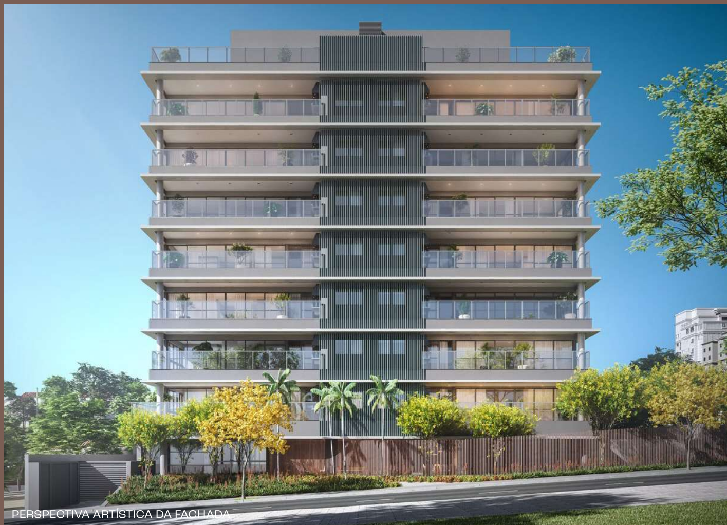
PERSPECTIVA ARTÍSTICA DA FACHADA