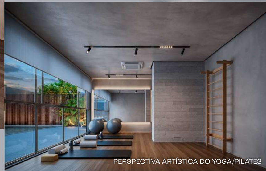
PERSPECTIVA ARTÍSTICA DO YOGA/PILATES

CORPO EM DIA E MENTE EM FORMA, O CARPE DIEM DA LONGEVIDADE.