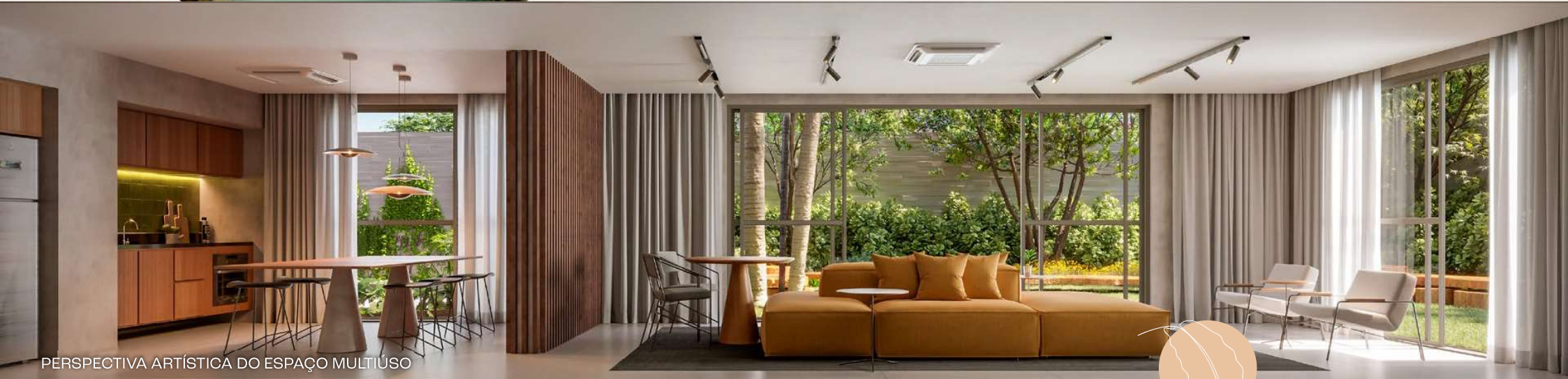
PERSPECTIVA ARTÍSTICA DO ESPAÇO MULTIUSO