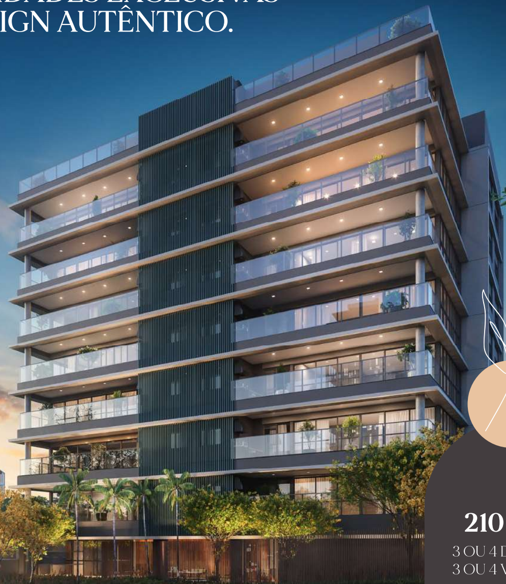
PERSPECTIVA ARTÍSTICA DA FACHADA