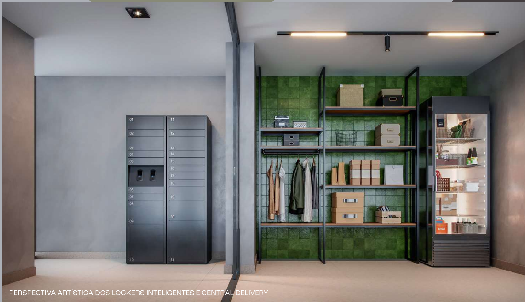
PERSPECTIVA ARTÍSTICA DOS LOCKERS INTELIGENTES E CENTRAL DELIVERY