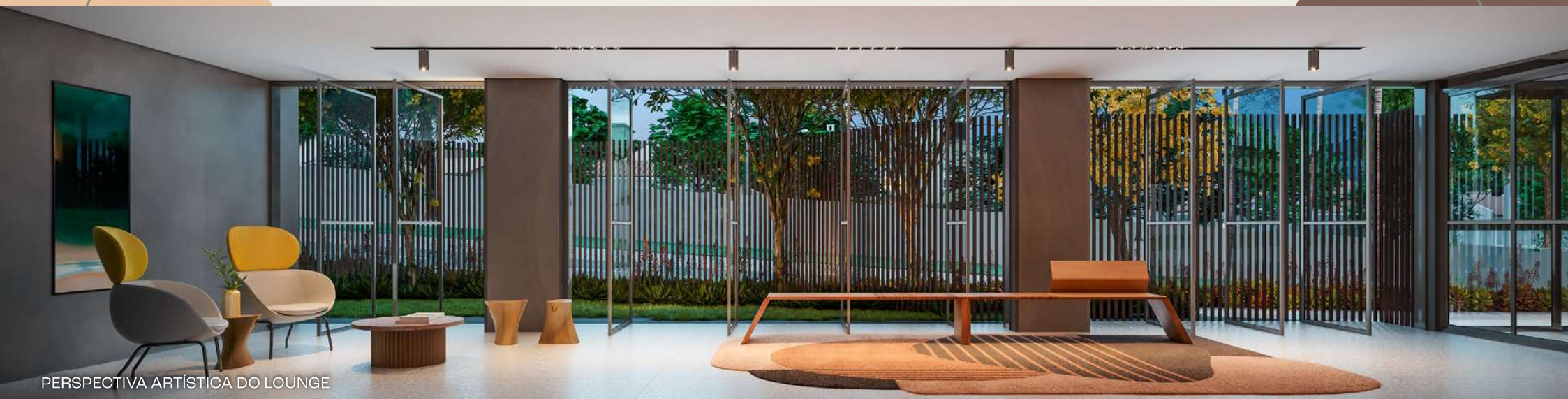
PERSPECTIVA ARTÍSTICA DO LOUNGE