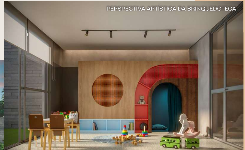
PERSPECTIVA ARTÍSTICA DA BRINQUEDOTECA