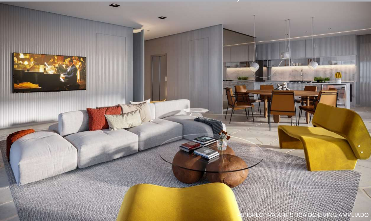
PERSPECTIVA ARTÍSTICA DO LIVING AMPLIADO