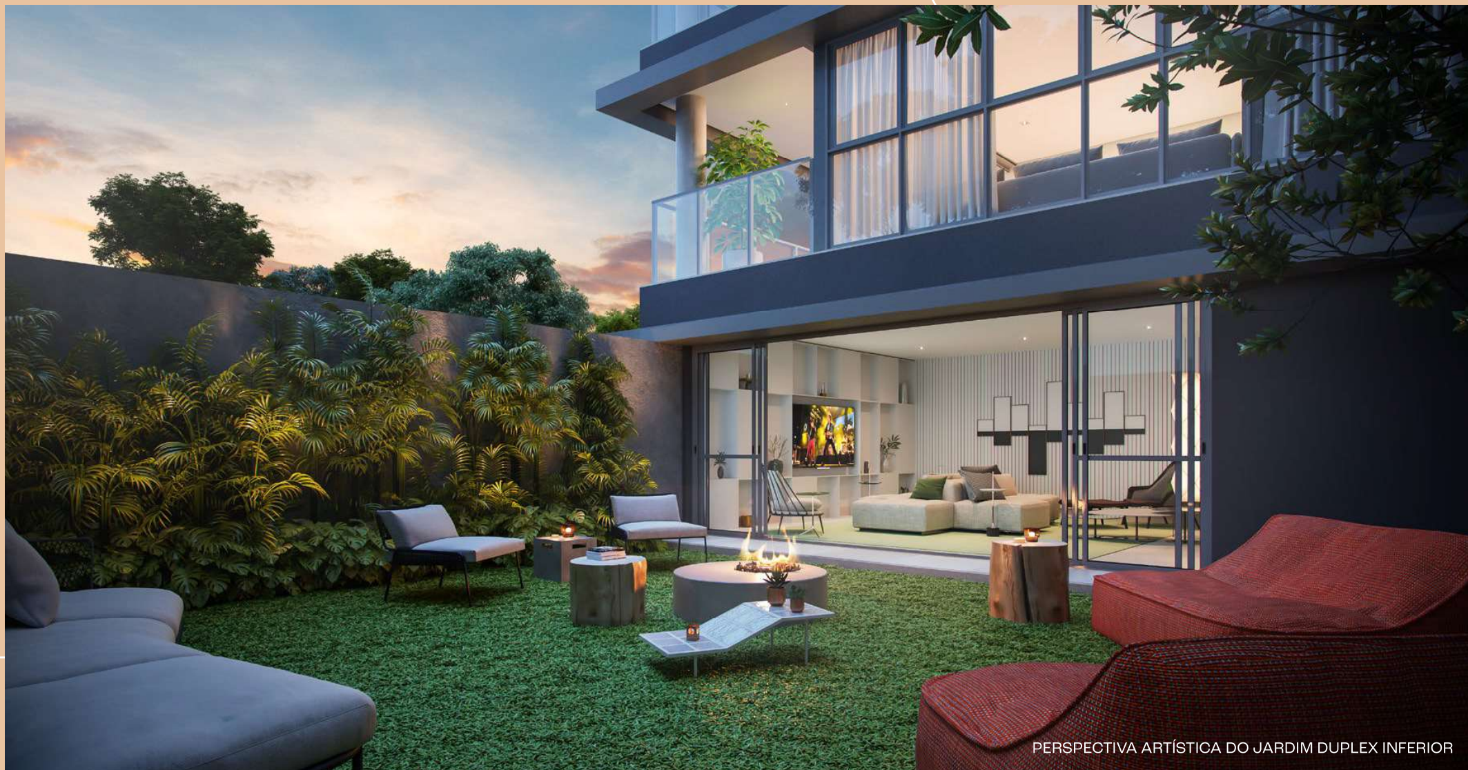
PERSPECTIVA ARTÍSTICA DO JARDIM DUPLEX INFERIOR