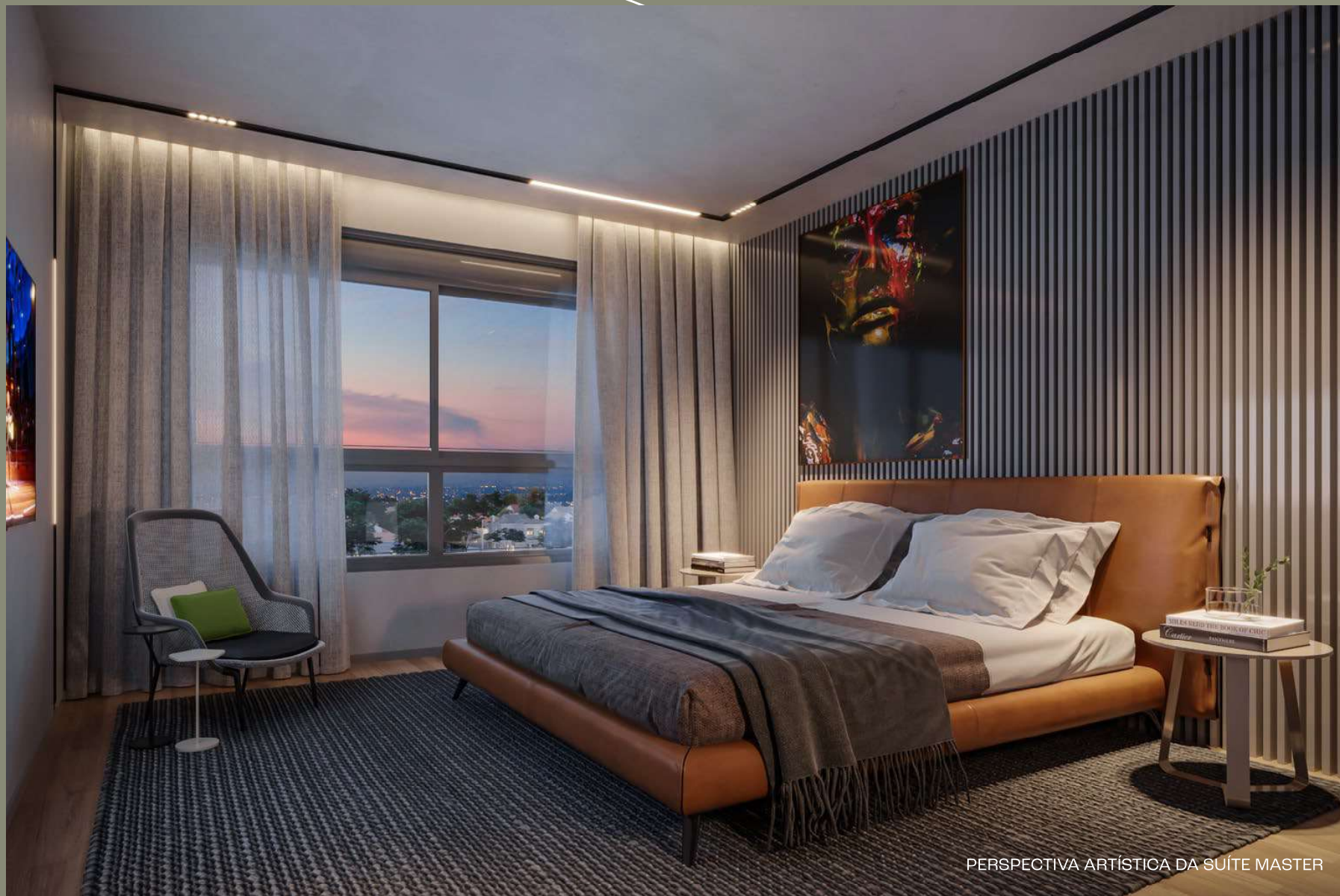
PERSPECTIVA ARTÍSTICA DA SUÍTE MASTER