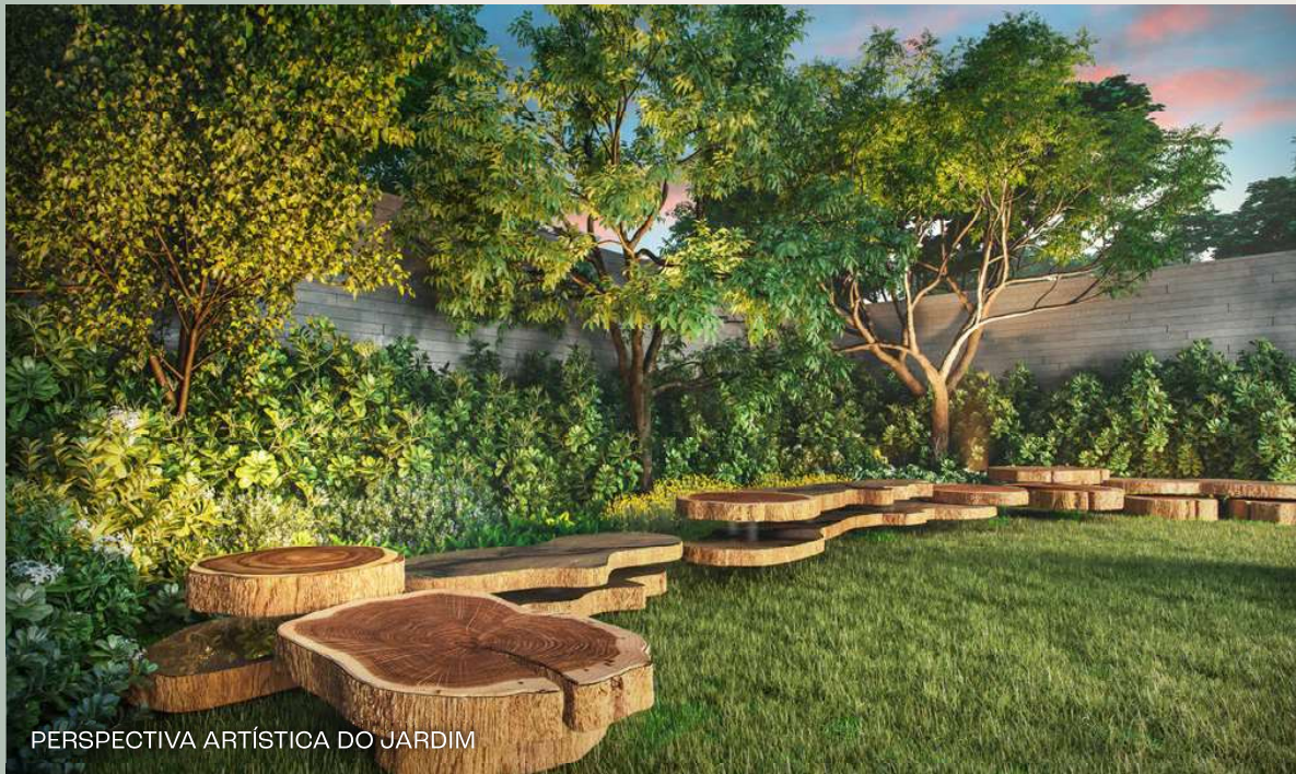
PERSPECTIVA ARTÍSTICA DO JARDIM

LUGARES QUE INSPIRAM, MOMENTOS QUE ABRAÇAM.