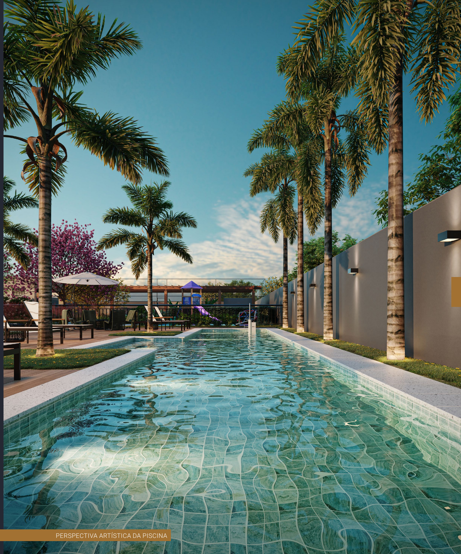
PERSPECTIVA ARTÍSTICA DA PISCINA