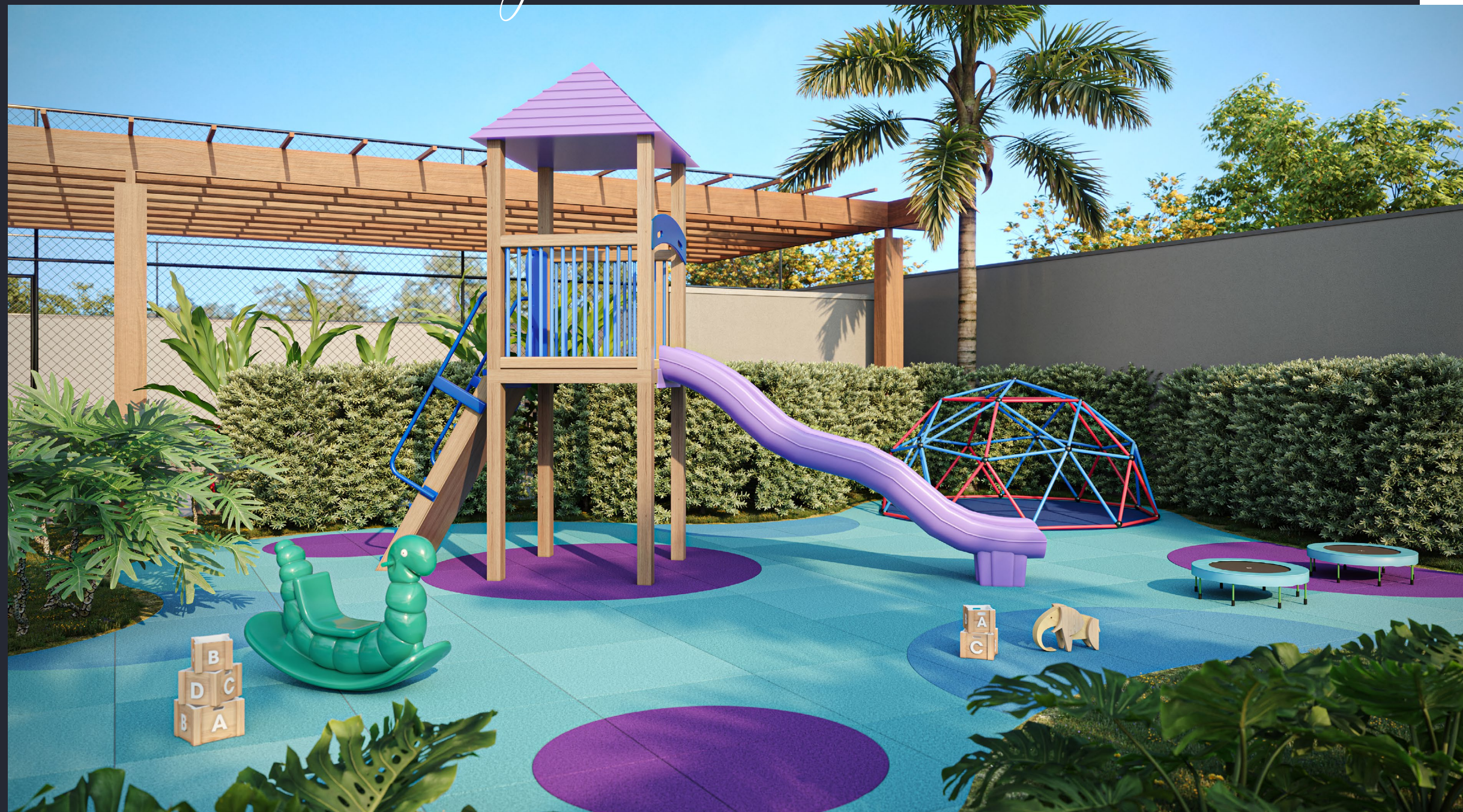
PERSPECTIVA ARTÍSTICA DO PLAYGROUND