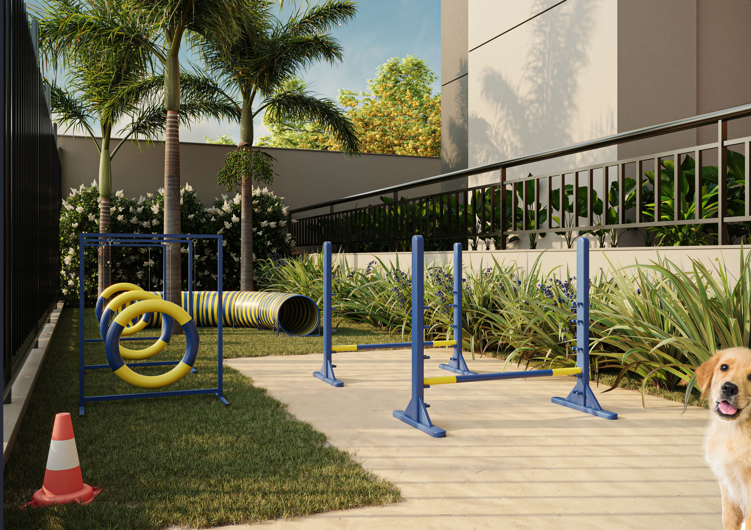
PERSPECTIVA ARTÍSTICA DA ÁREA PET