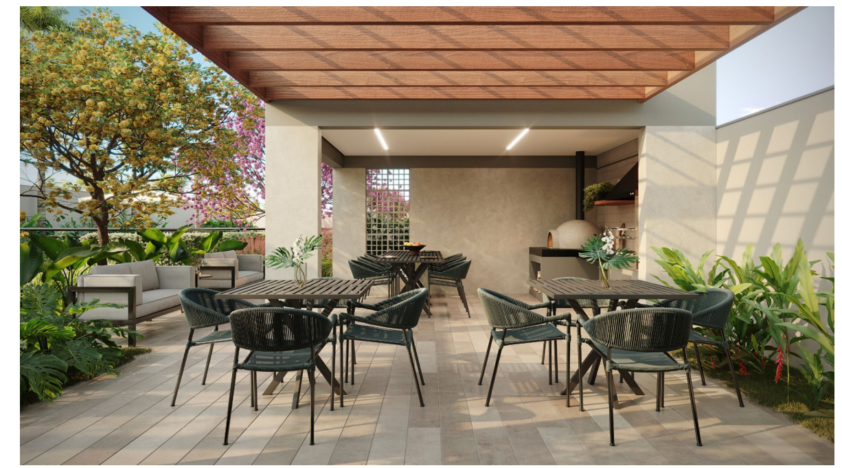
PERSPECTIVA ARTÍSTICA DA CHURRASQUEIRA

Terreno com mais de 3.000 M 2 , o Palatium Ipiranga tem áreas de convivência e lazer de sobra para toda sua família.