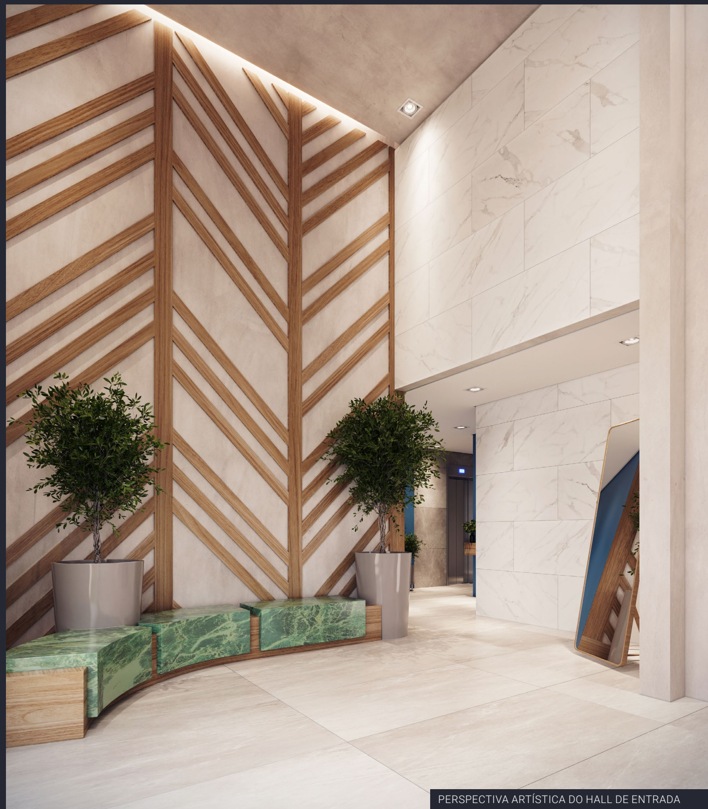
PERSPECTIVA ARTÍSTICA DO HALL DE ENTRADA