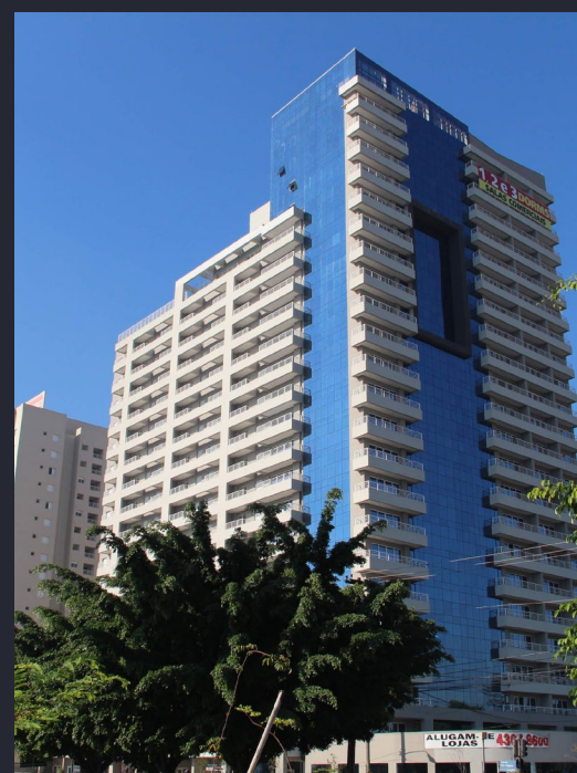
MARCO ZERO HOME MBIGUCCI