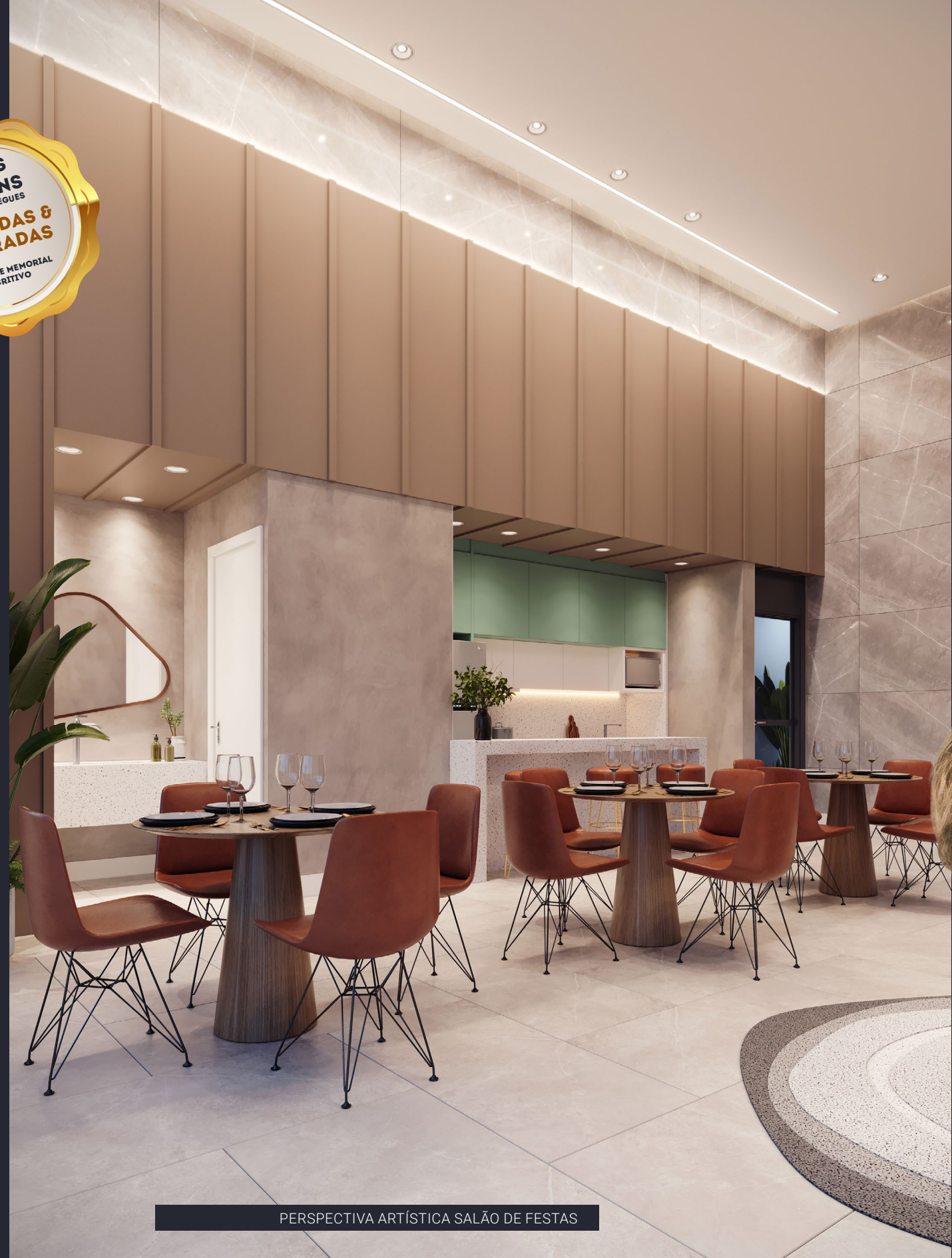
PERSPECTIVA ARTÍSTICA SALÃO DE FESTAS

ÁREAS COMUNS SERÃO ENTREGUES EQUIPADAS & DECORADAS *CONFORME MEMORIAL DESCRITIVO