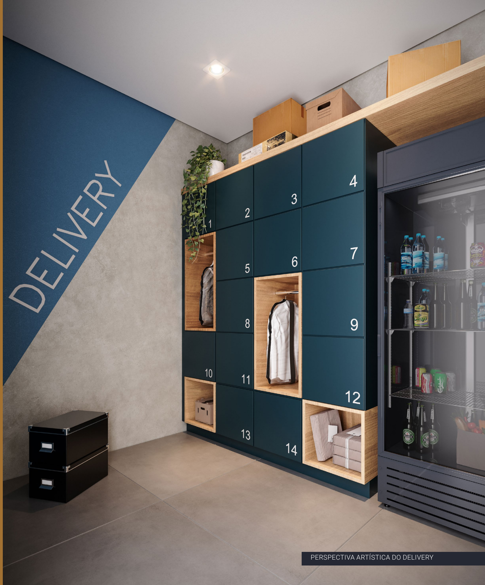
PERSPECTIVA ARTÍSTICA DO DELIVERY