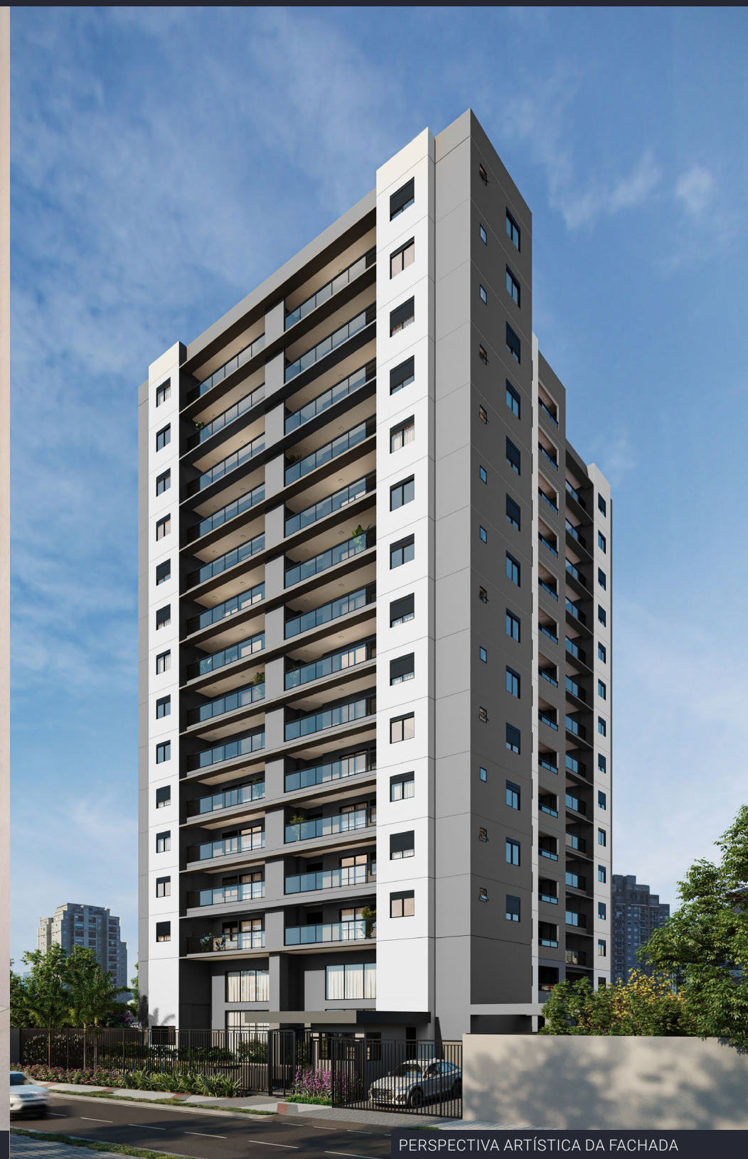
PERSPECTIVA ARTÍSTICA DA FACHADA