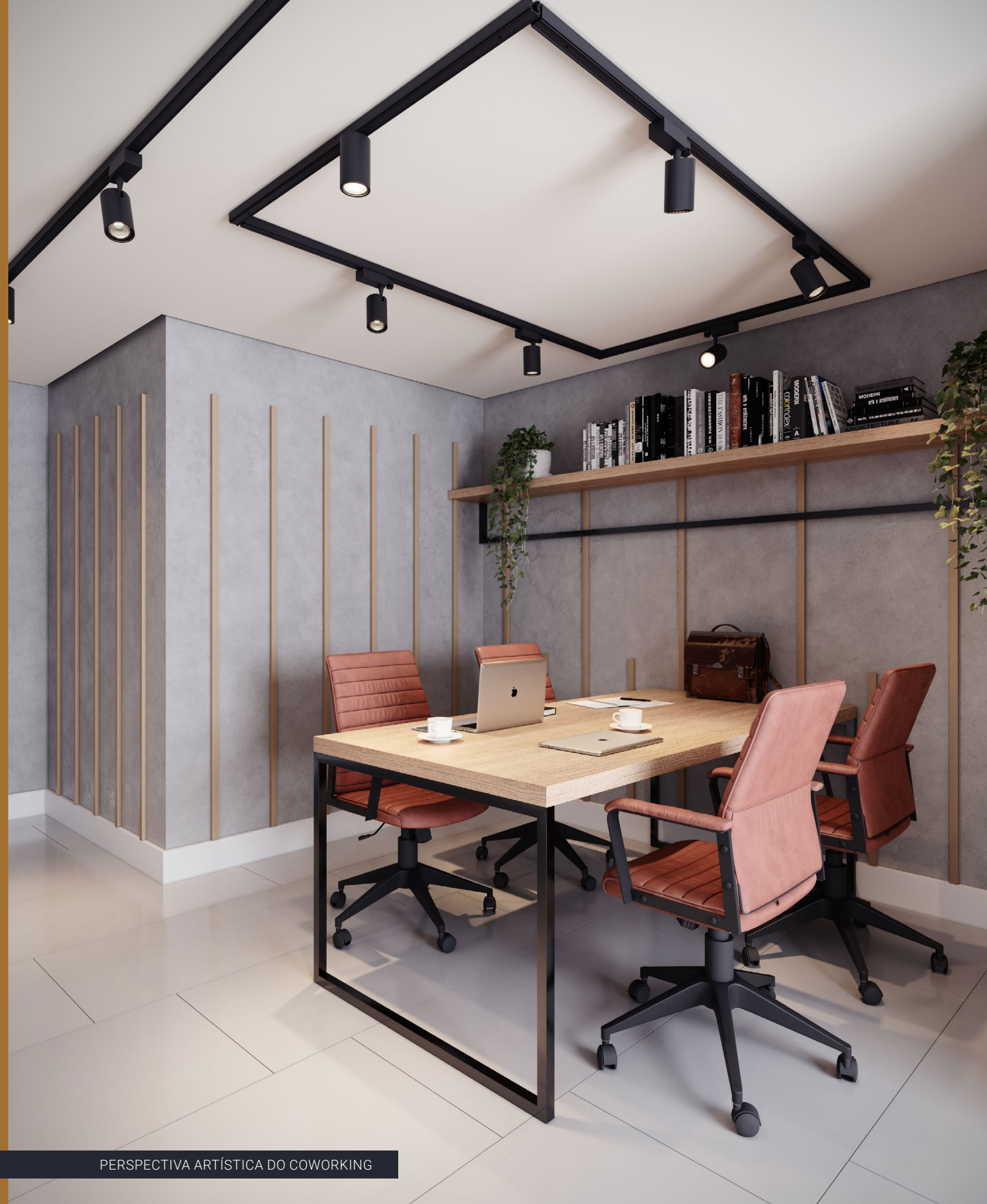
PERSPECTIVA ARTÍSTICA DO COWORKING