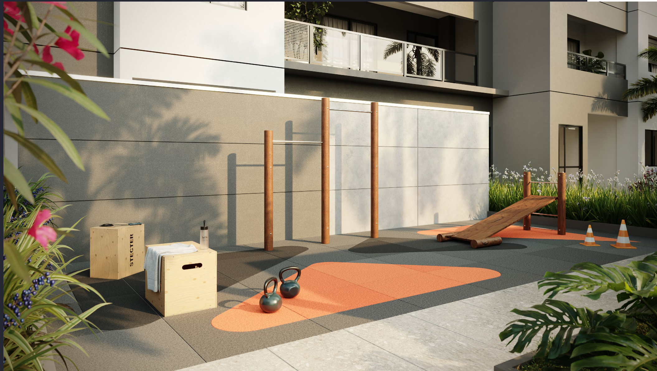
PERSPECTIVA ARTÍSTICA DA ÁREA FITNESS EXTERNO

Bem-estar e saúde ao seu alcance a qualquer momento. Duas opções de área fitness: indoor e ao ar livre.