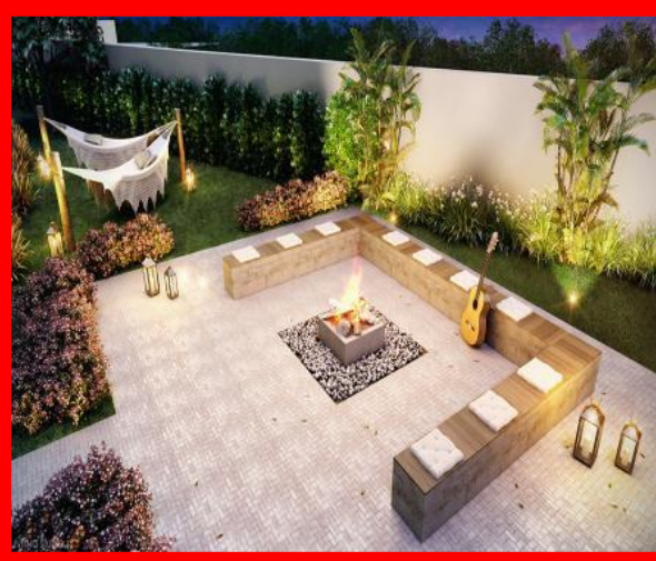
PRAÇA DO FOGO