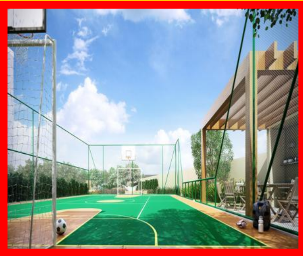
QUADRA DE FUTEBOL