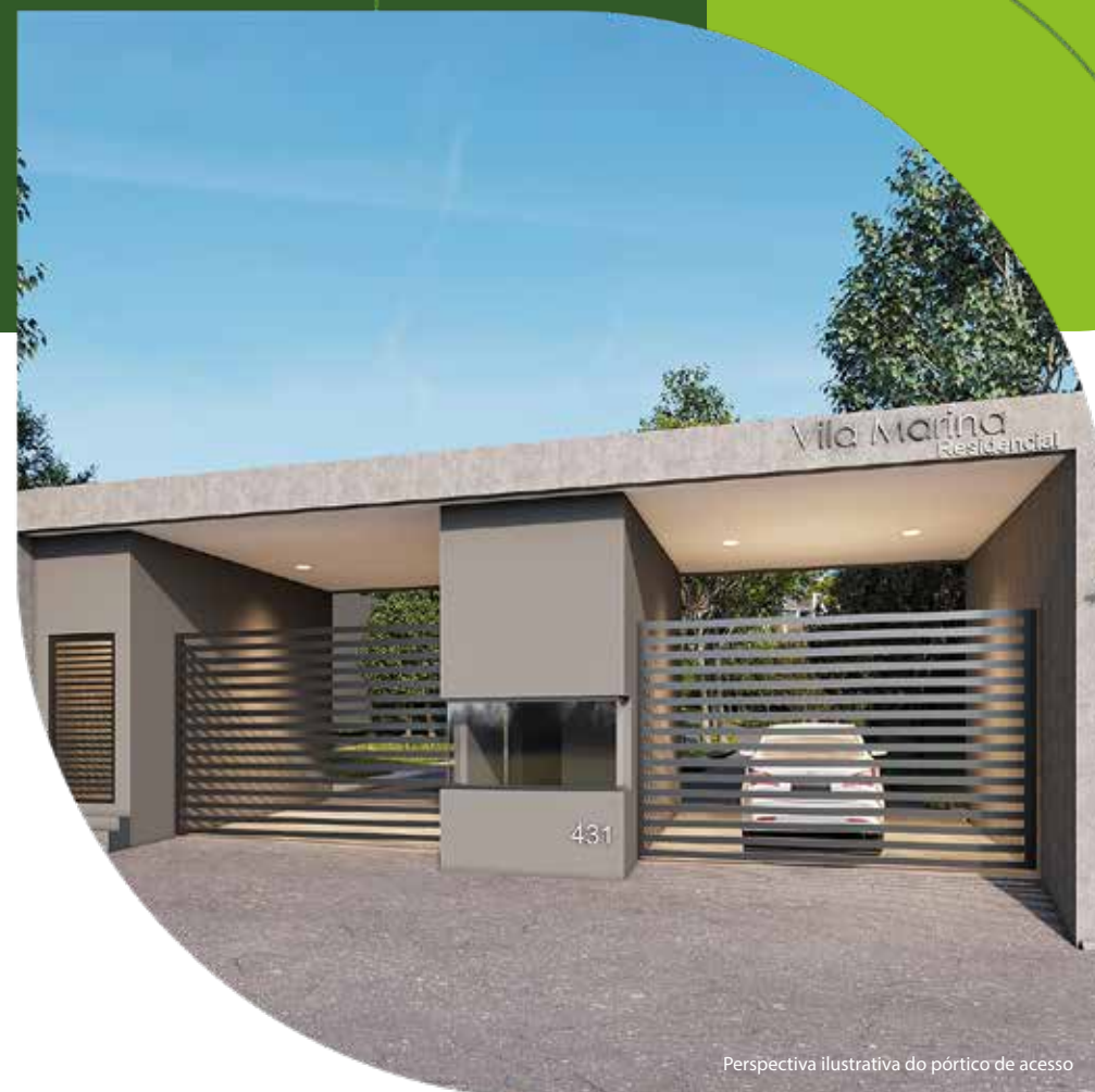
Perspectiva ilustrativa do pórtico de acesso