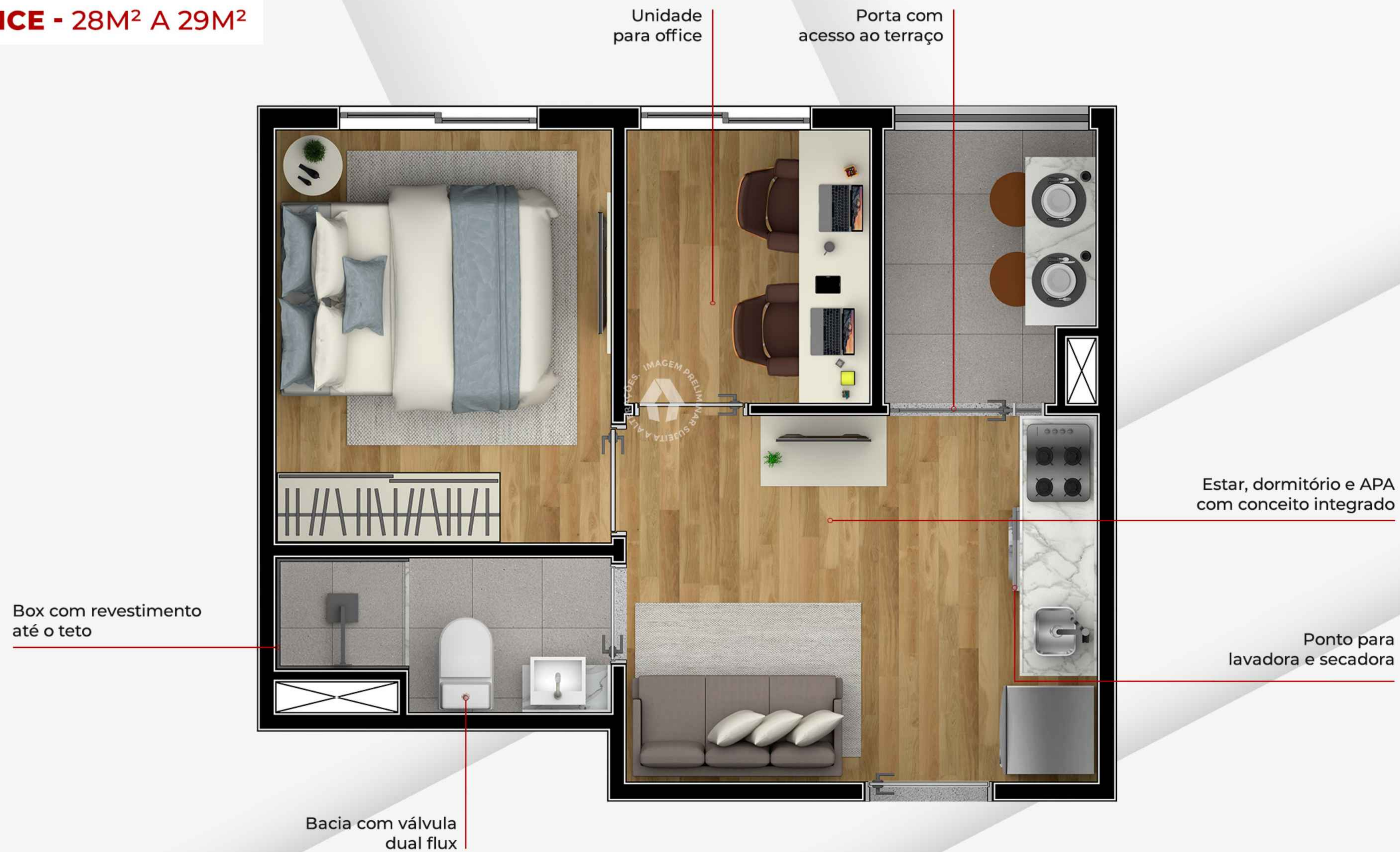
Ilustração artística da planta com sugestão de decoração. Os móveis, utensílios, adornos e equipamentos não fazem parte do contrato de venda e compra. Acabamentos e revestimentos serão entregues conforme memorial descritivo específico. Esta planta poderá sofrer variações decorrentes do atendimento de postura de órgãos públicos e concessionárias.