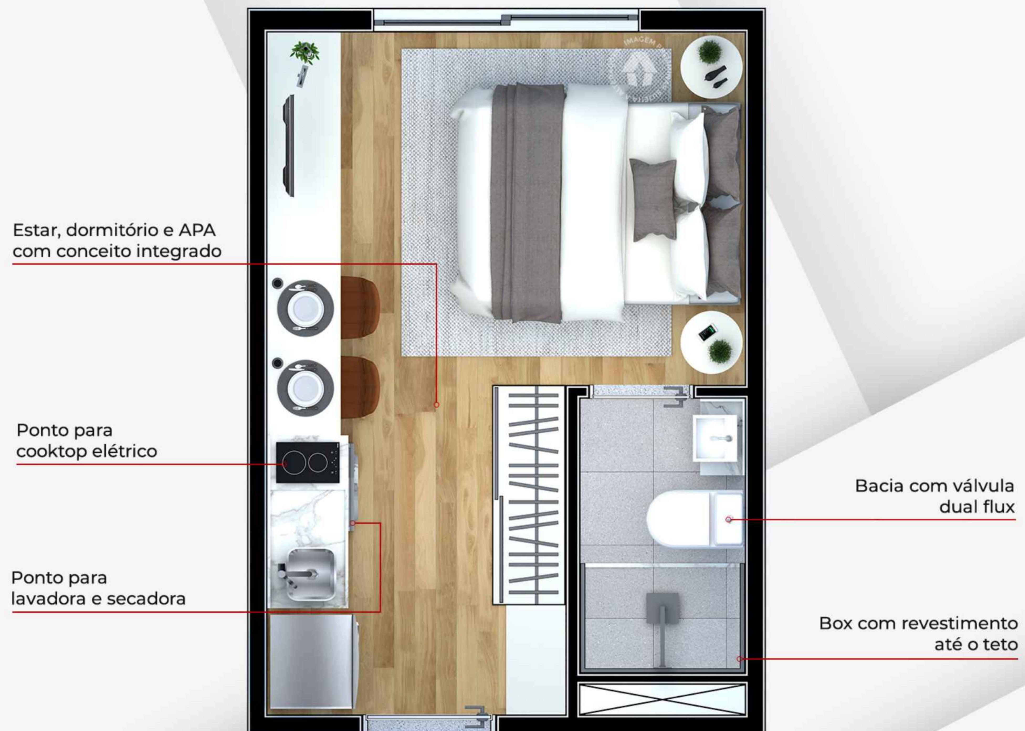
Ilustração artística da planta com sugestão de decoração. Os móveis, utensílios, adornos e equipamentos não fazem parte do contrato de venda e compra. Acabamentos e revestimentos serão entregues conforme memorial descritivo específico. Esta planta poderá sofrer variações decorrentes do atendimento de postura de órgãos públicos e concessionárias.