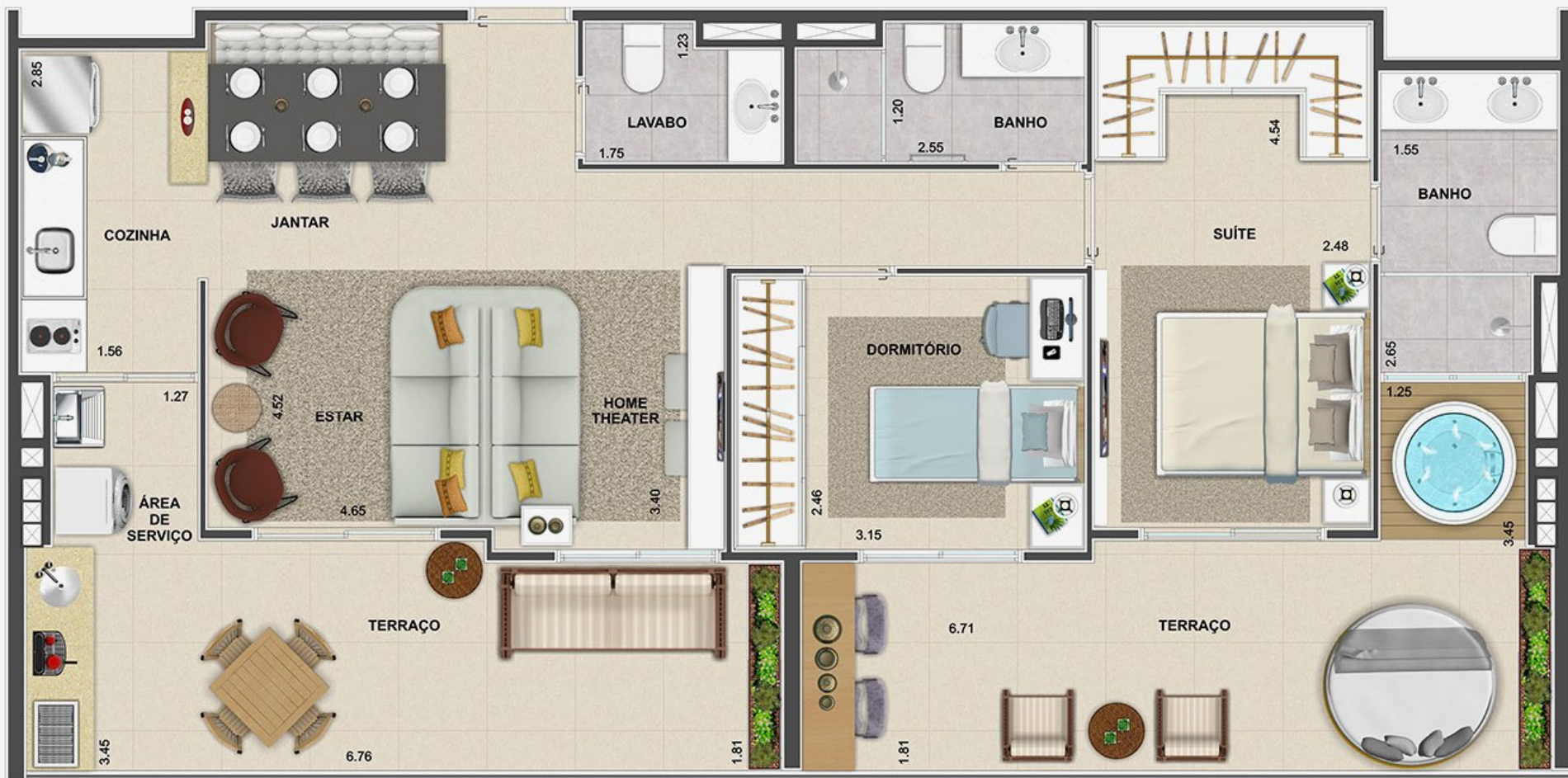
APARTAMENTO JUNÇÃO 2 DORMITÓRIOS (1 SUÍTE) FINAL 2 + FINAL 3