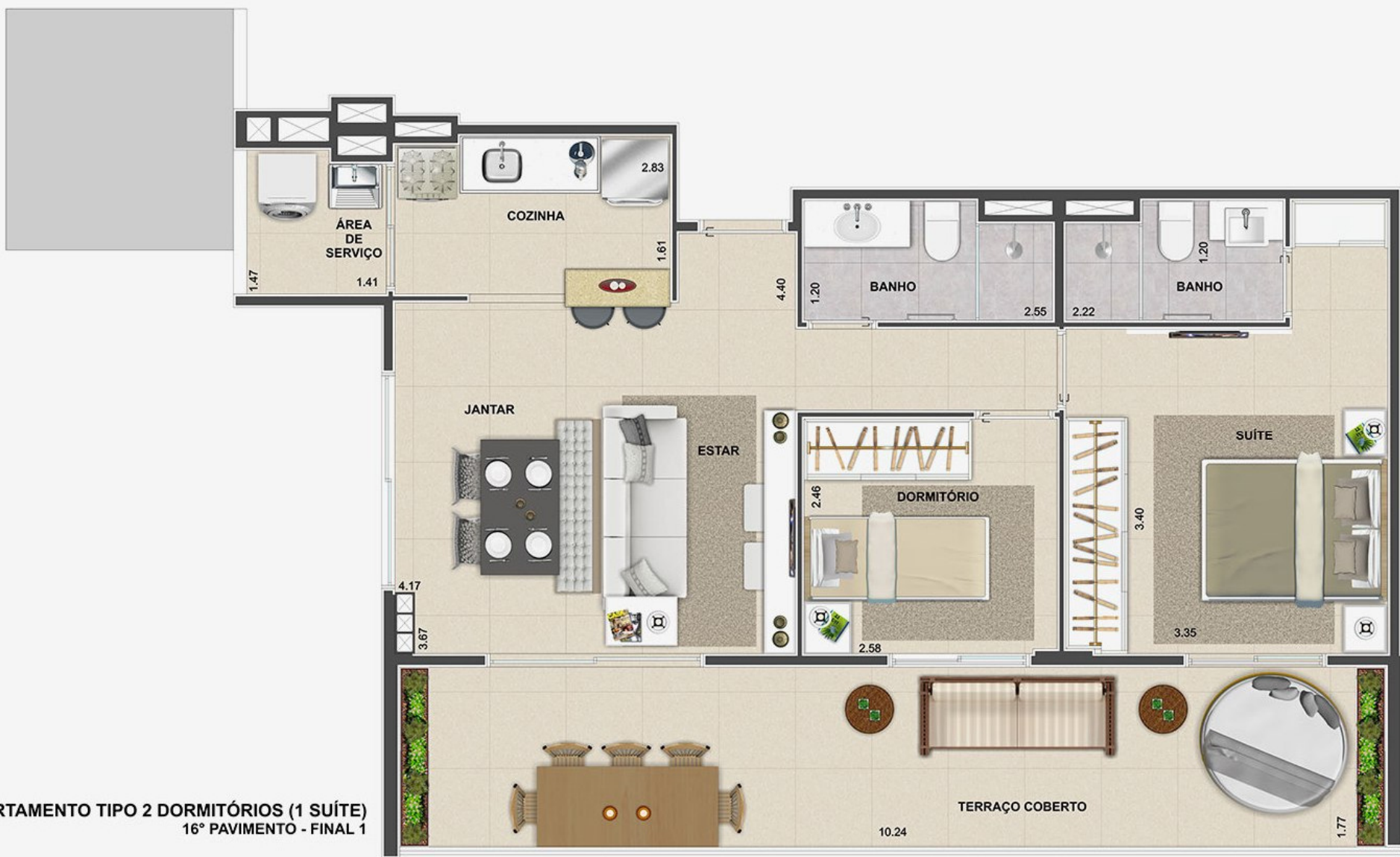
APARTAMENTO TIPO 2 DORMITÓRIOS (1 SUÍTE) 16° PAVIMENTO - FINAL 1