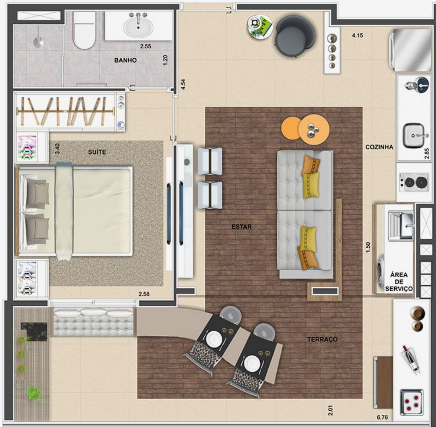
APARTAMENTO TIPO FINAL 3