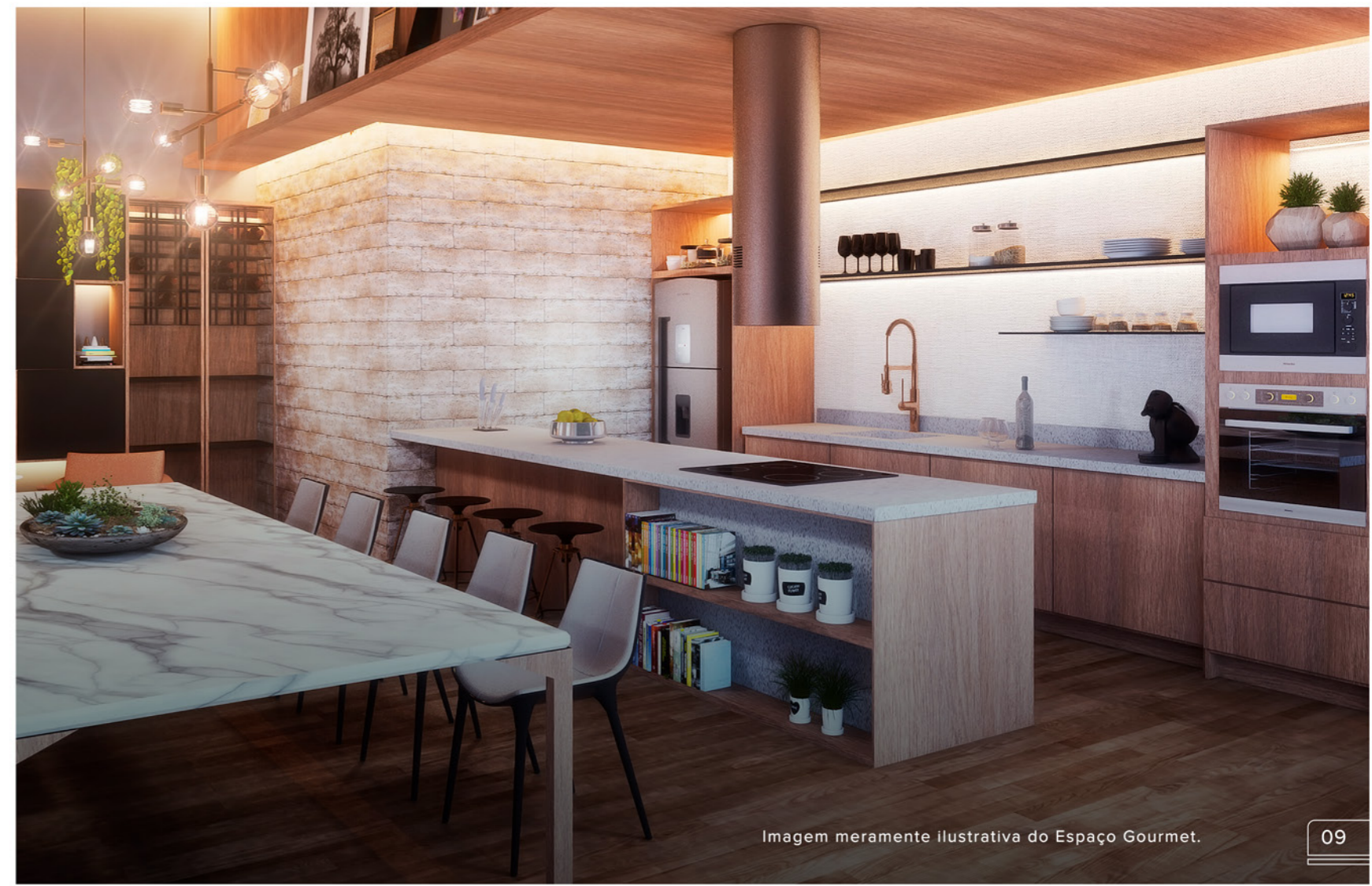
Imagem meramente ilustrativa do Espaço Gourmet.