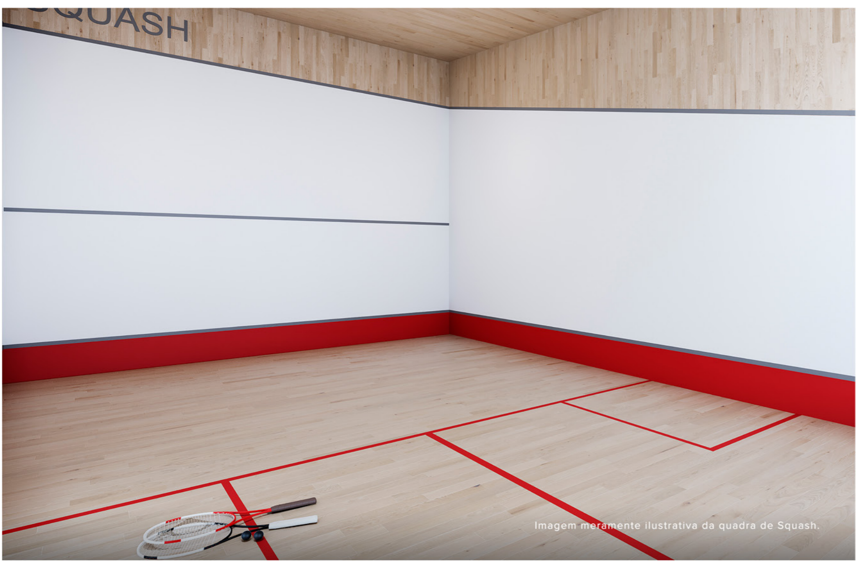
Imagem meramente ilustrativa da quadra de Squash.