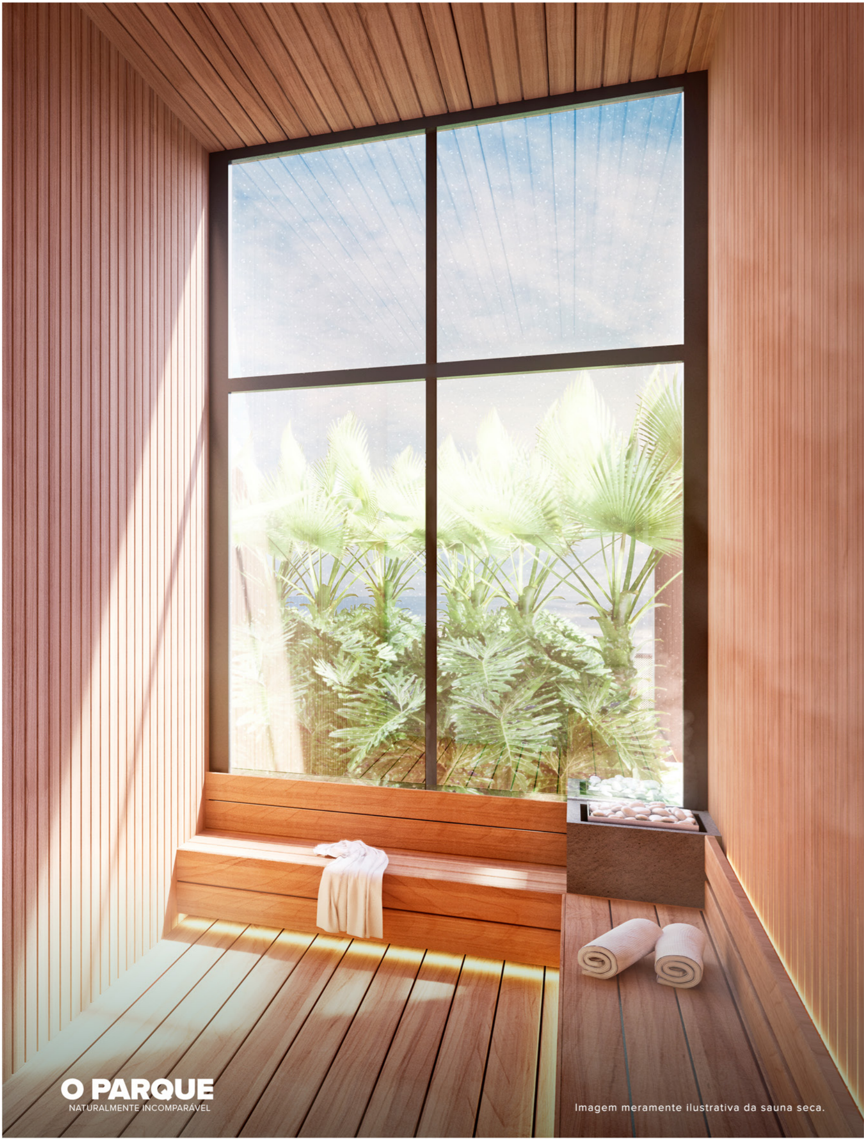
Imagem meramente ilustrativa da sauna seca.