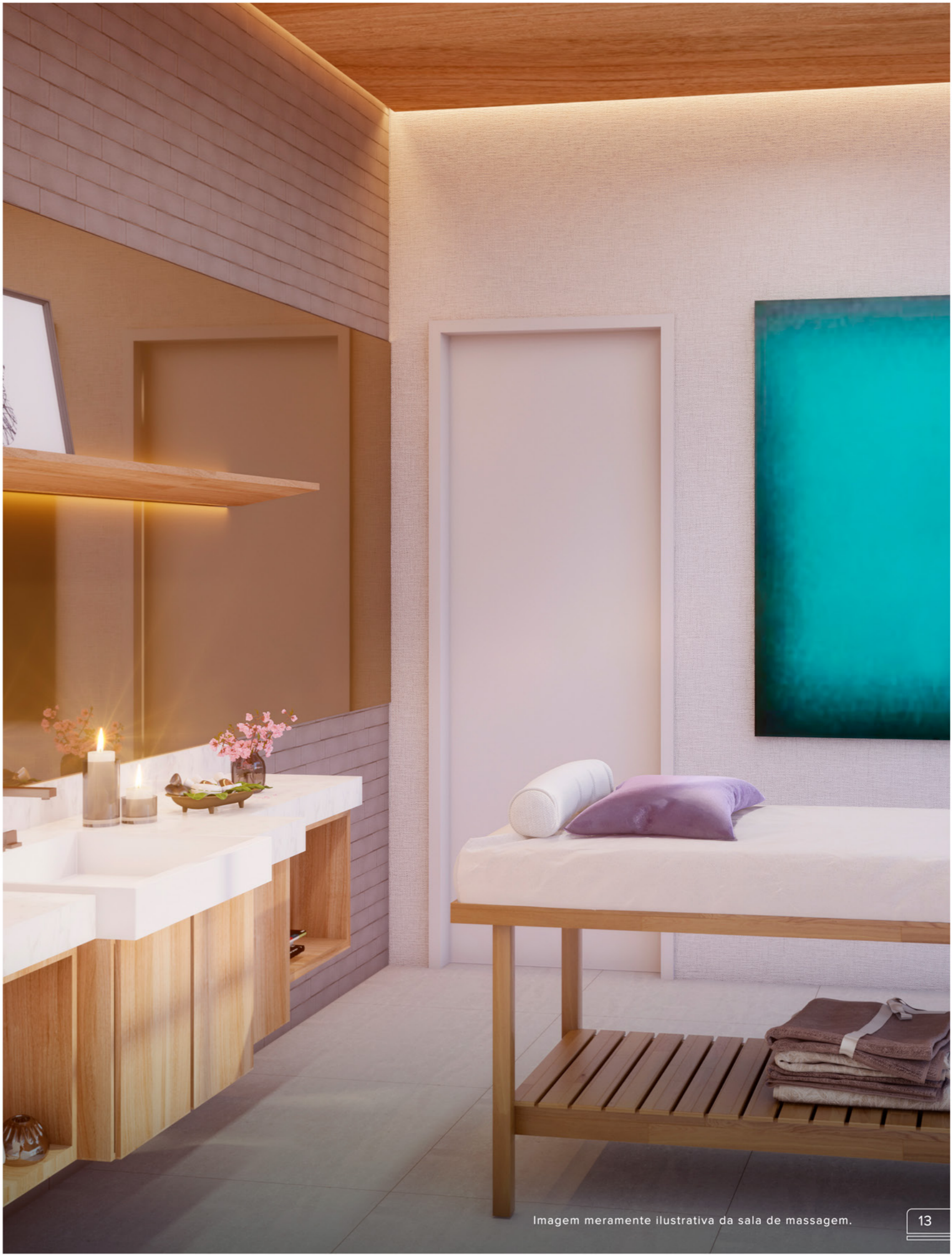
Imagem meramente ilustrativa da sala de massagem.