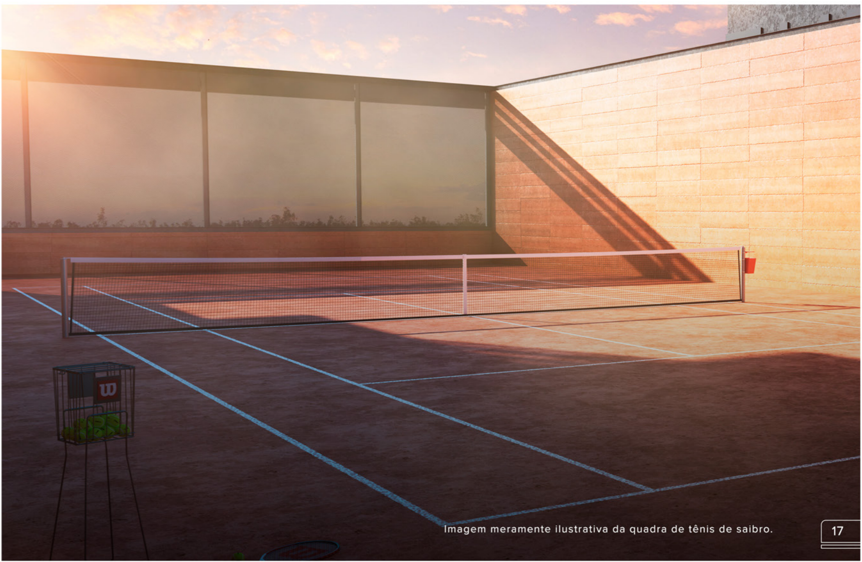
Imagem meramente ilustrativa da quadra de tênis de saibro.