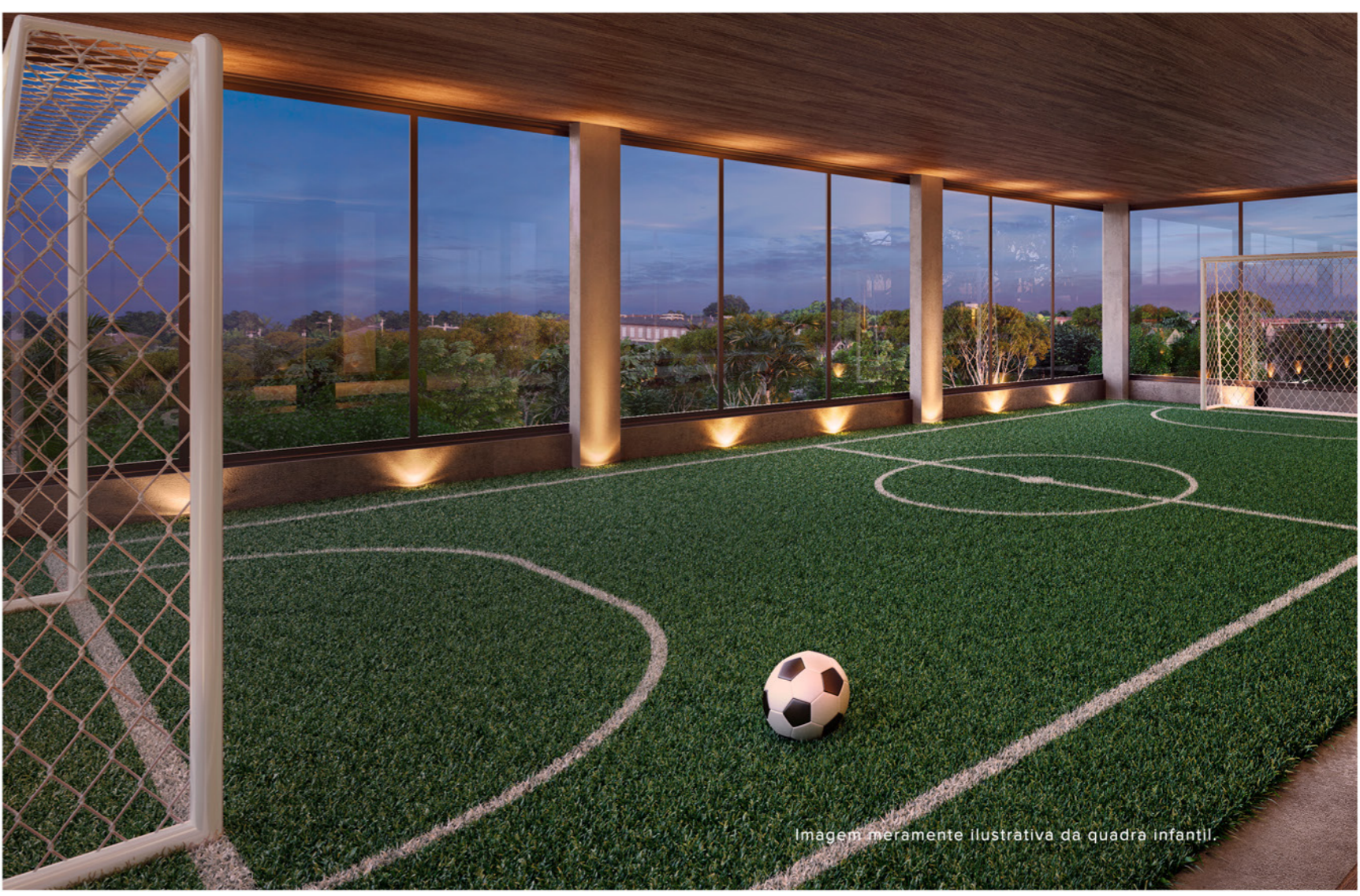
Imagem meramente ilustrativa da quadra infantil.