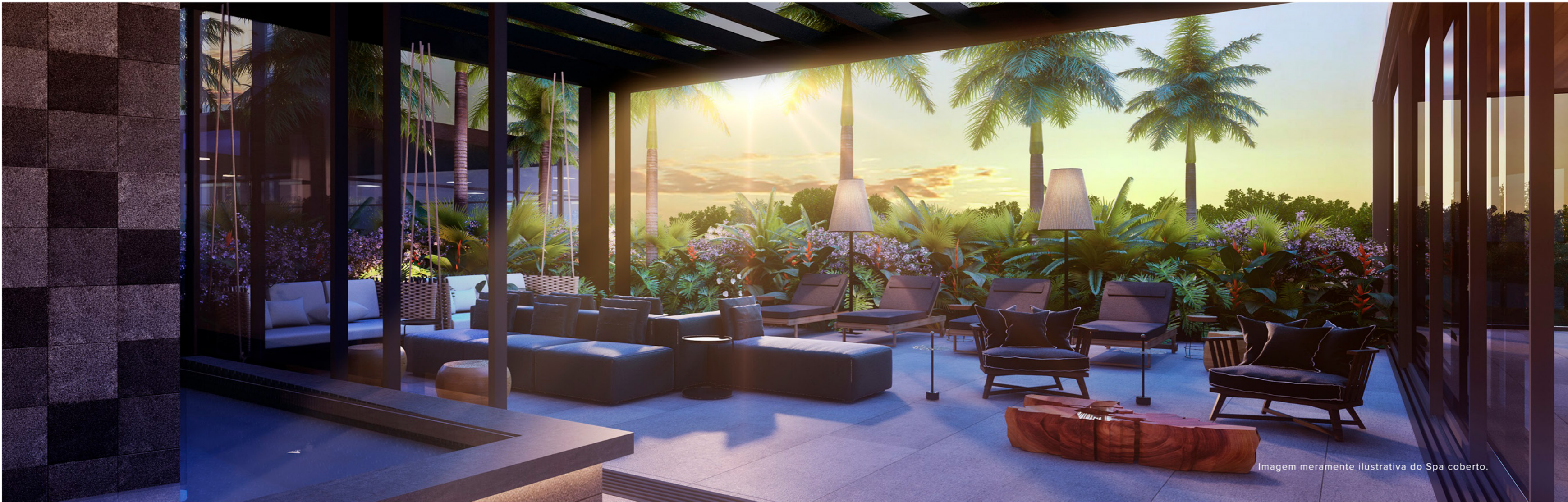
Imagem meramente ilustrativa do Spa coberto.