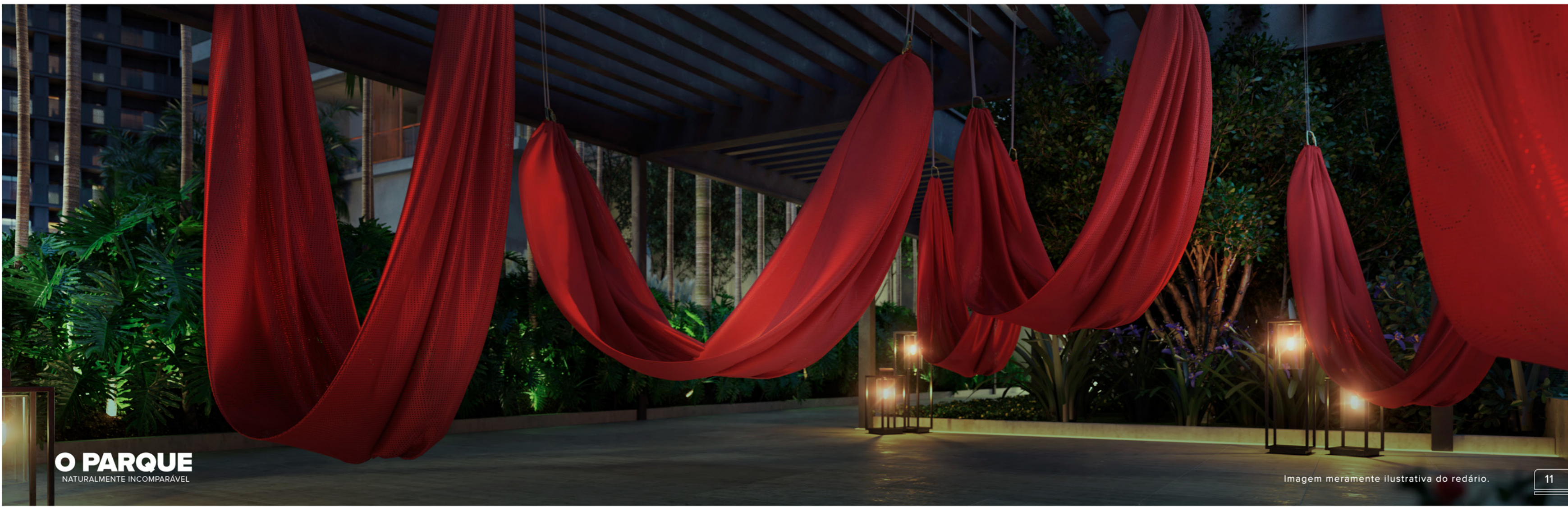
Imagem meramente ilustrativa do redário.