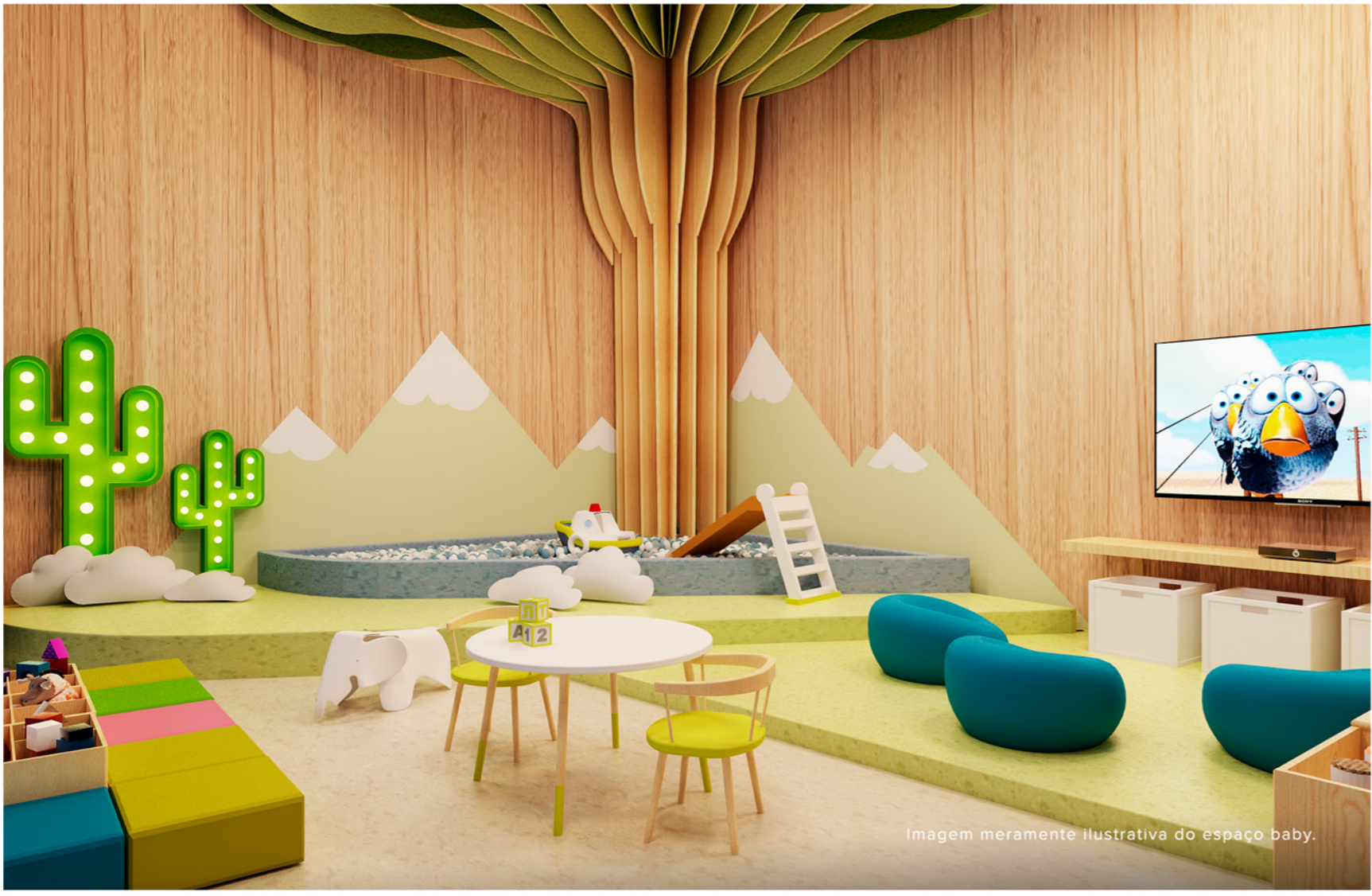
Imagem meramente ilustrativa do espaço baby.