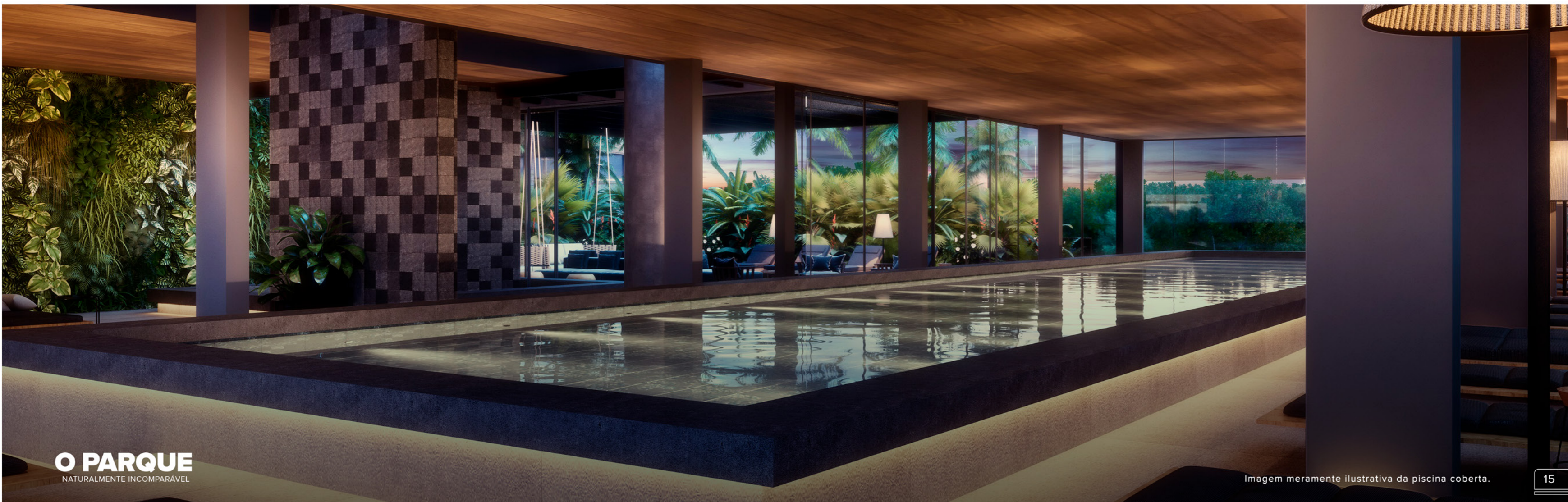
Imagem meramente ilustrativa da piscina coberta.