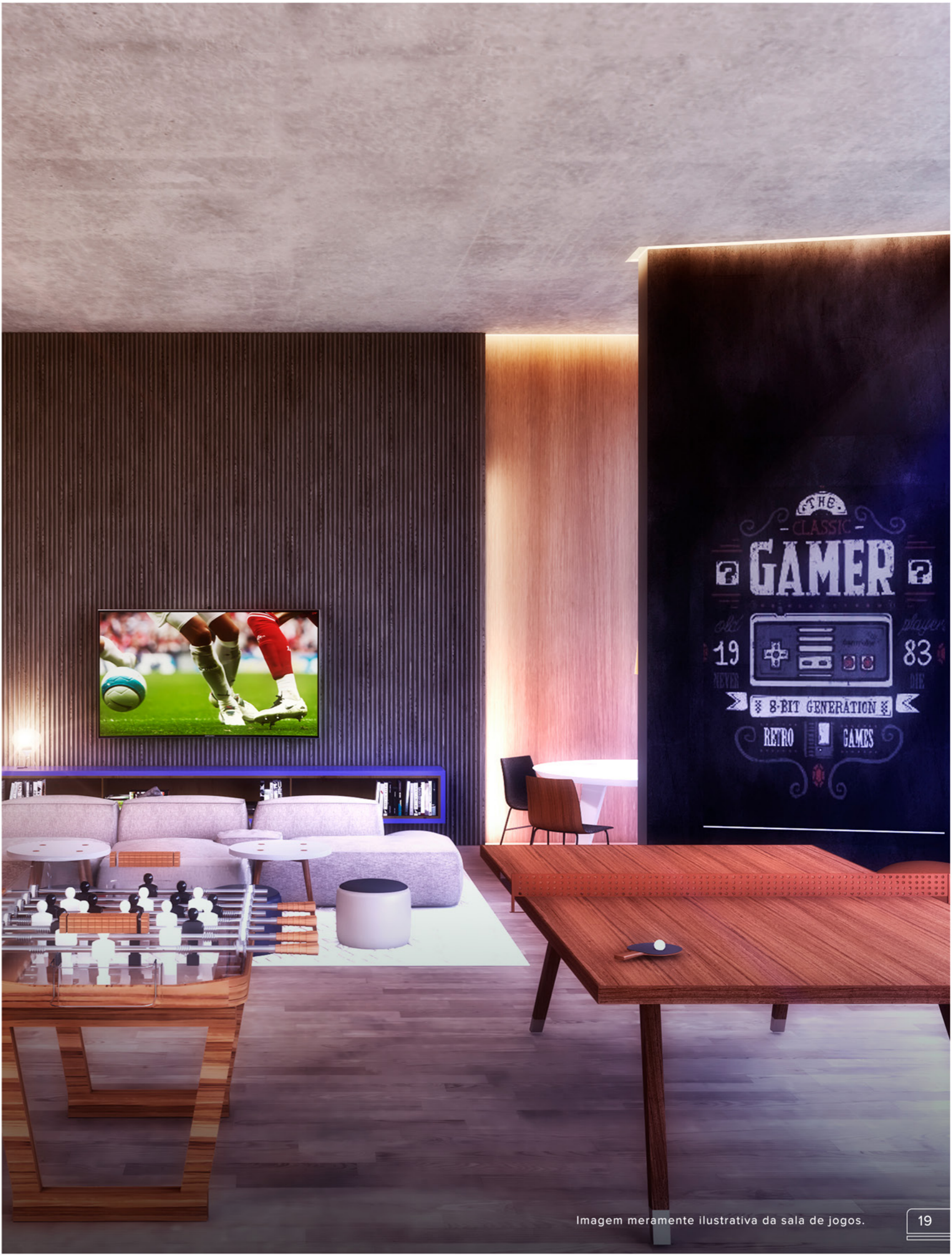
Imagem meramente ilustrativa da sala de jogos.