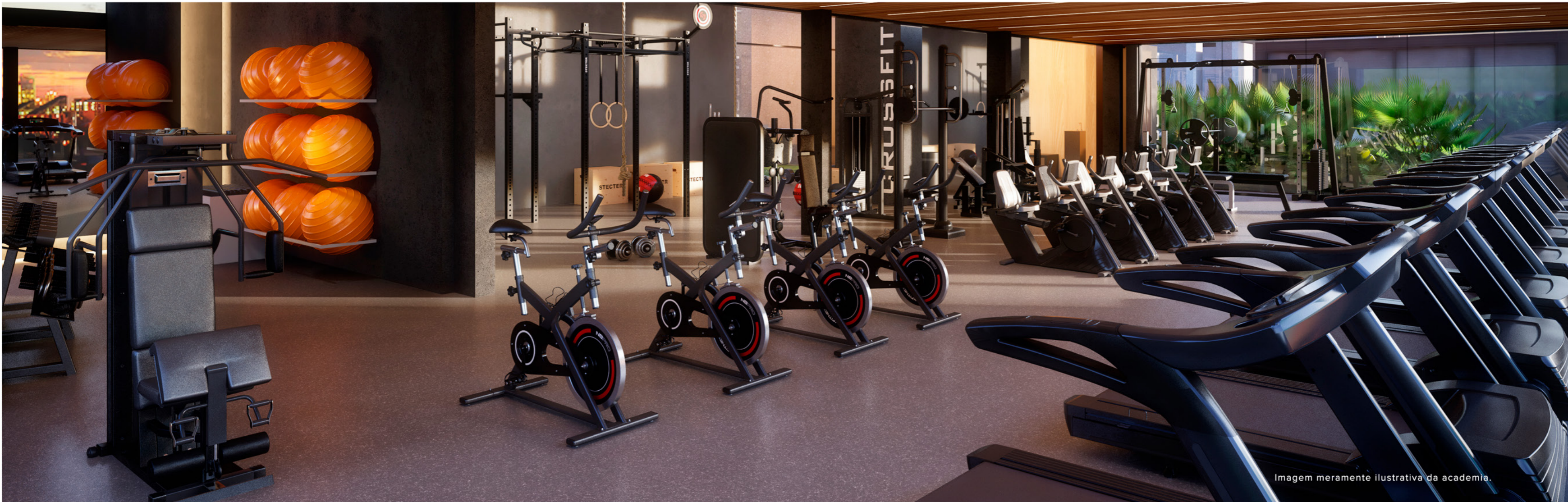
Imagem meramente ilustrativa da academia.