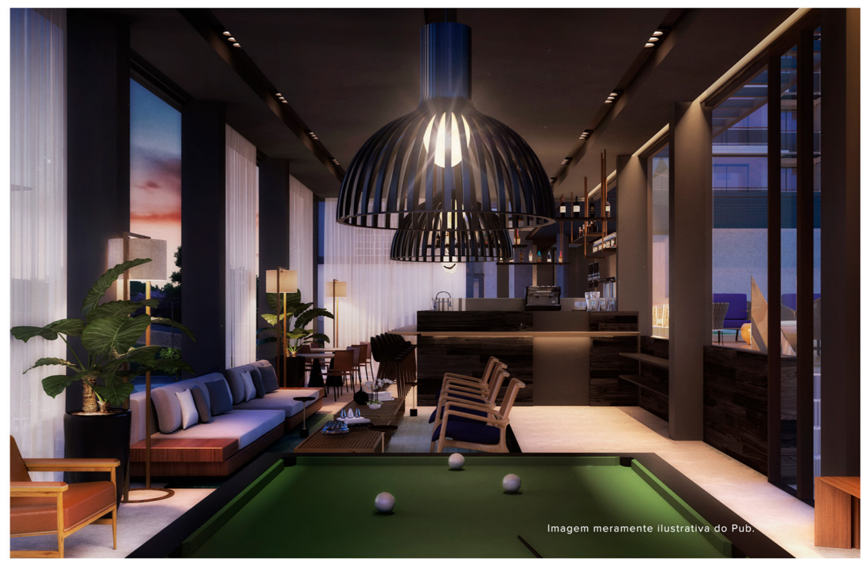
Imagem meramente ilustrativa do Pub.