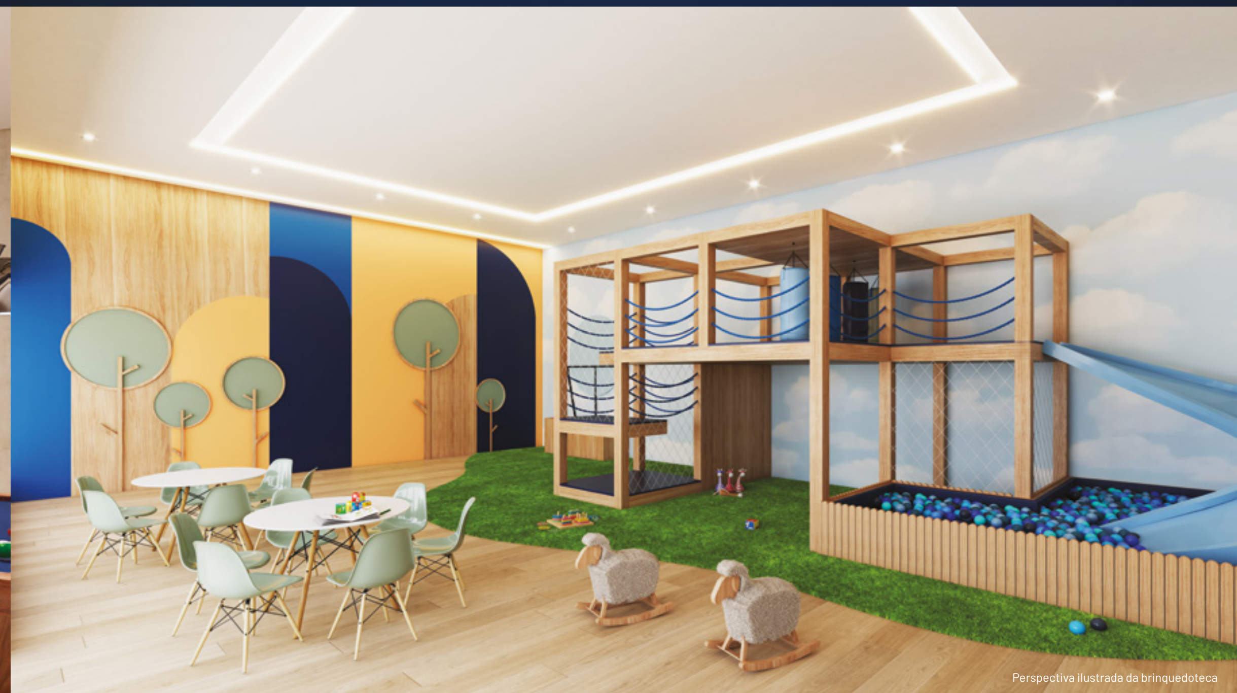
Perspectiva ilustrada da brinquedoteca