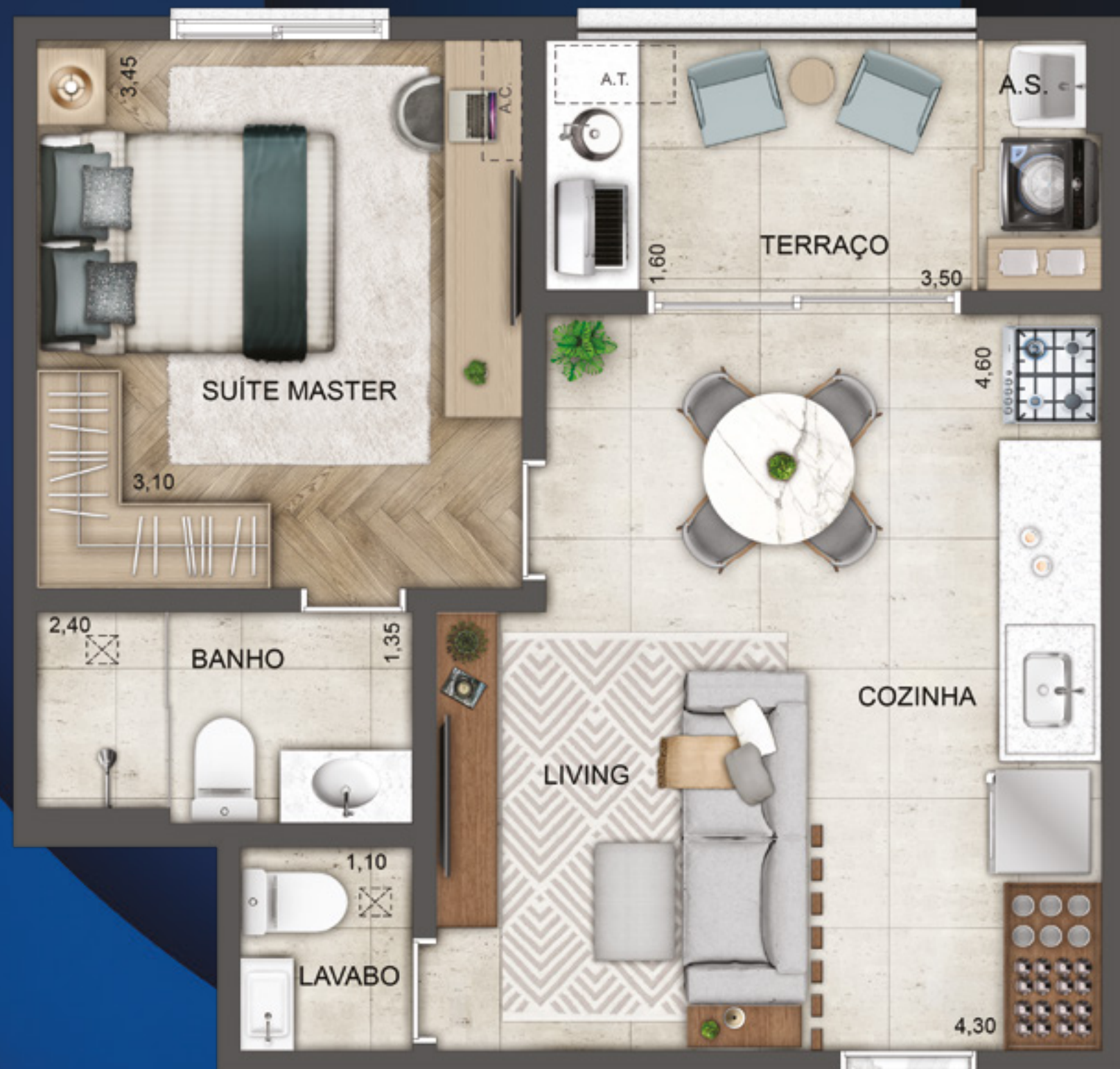
SUÍTE | LAVABO

A MEDIDA CERTA PARA QUEM QUER PRATICIDADE SEM ABRIR MÃO DA PRIVACIDADE.