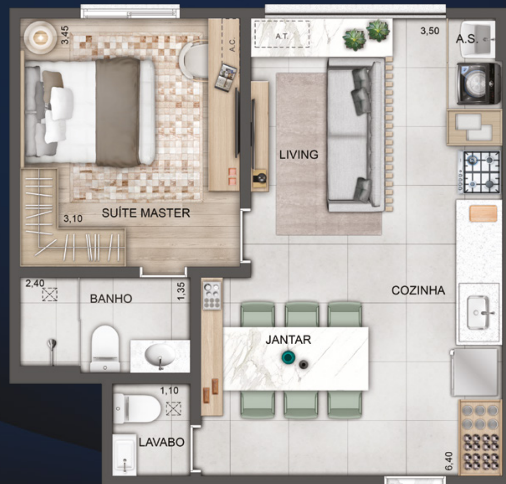
SUÍTE | LAVABO | LIVING AMPLIADO