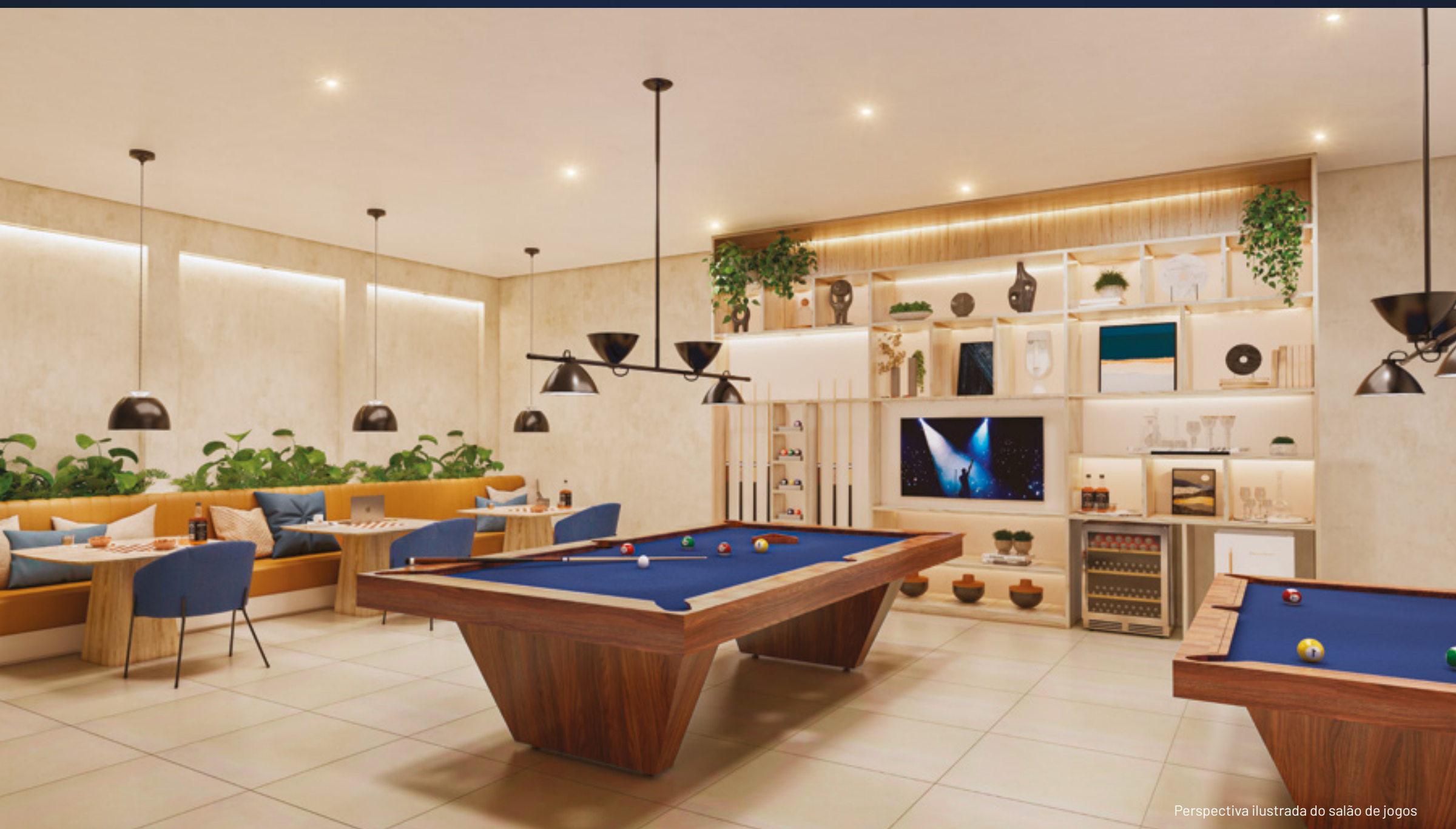
Perspectiva ilustrada do salão de jogos