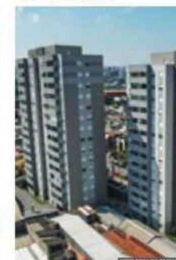
Vibra Vila Guilherme