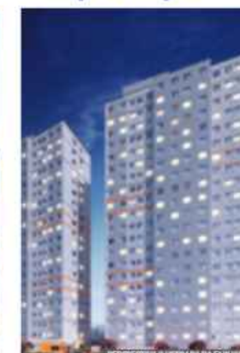
Vibra Campo Limpo