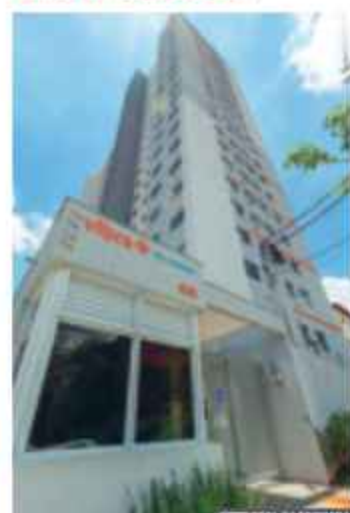
Vibra Vila Mascote