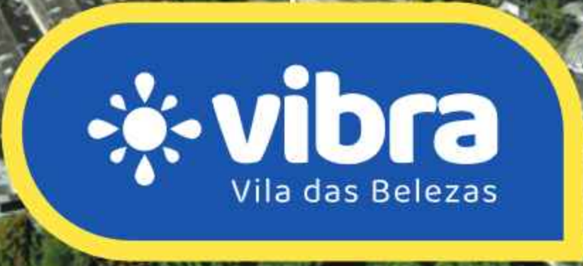
FOTO AÉREA DA REGIÃO