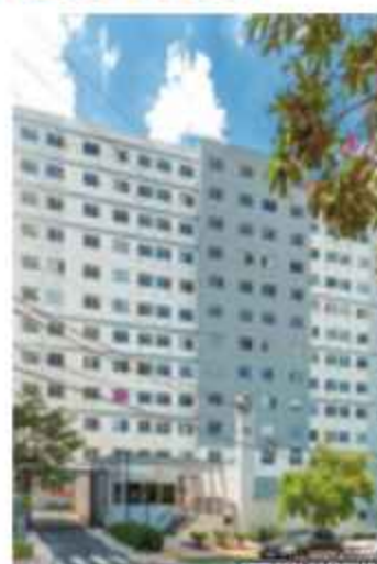
Vibra Casa Verde