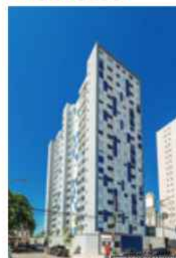
Vibra Barra Funda