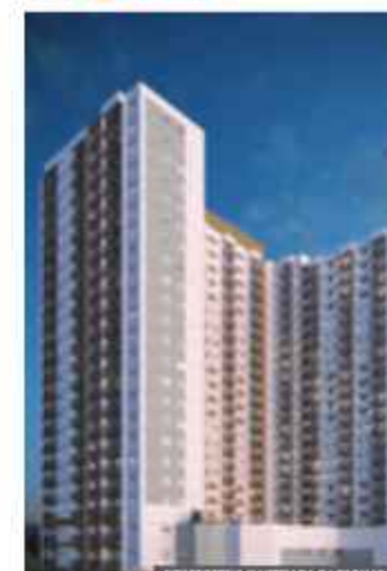
Vibra Estação Freguesia