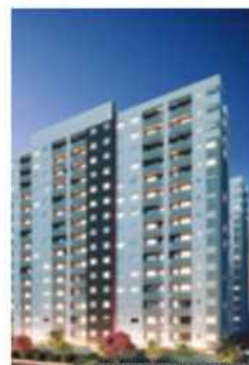
Vibra Parque Vila Guilherme