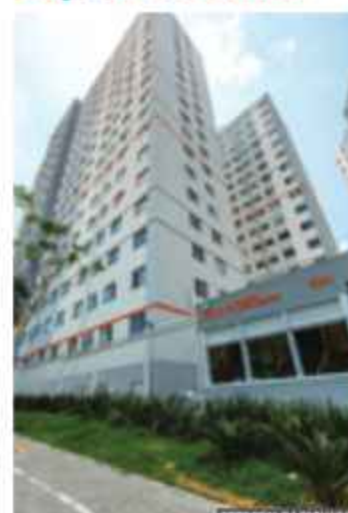
Vibra Estação Capão Redondo