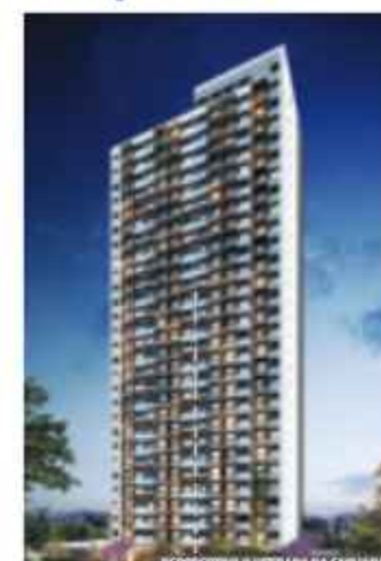
Vibe Campo Belo