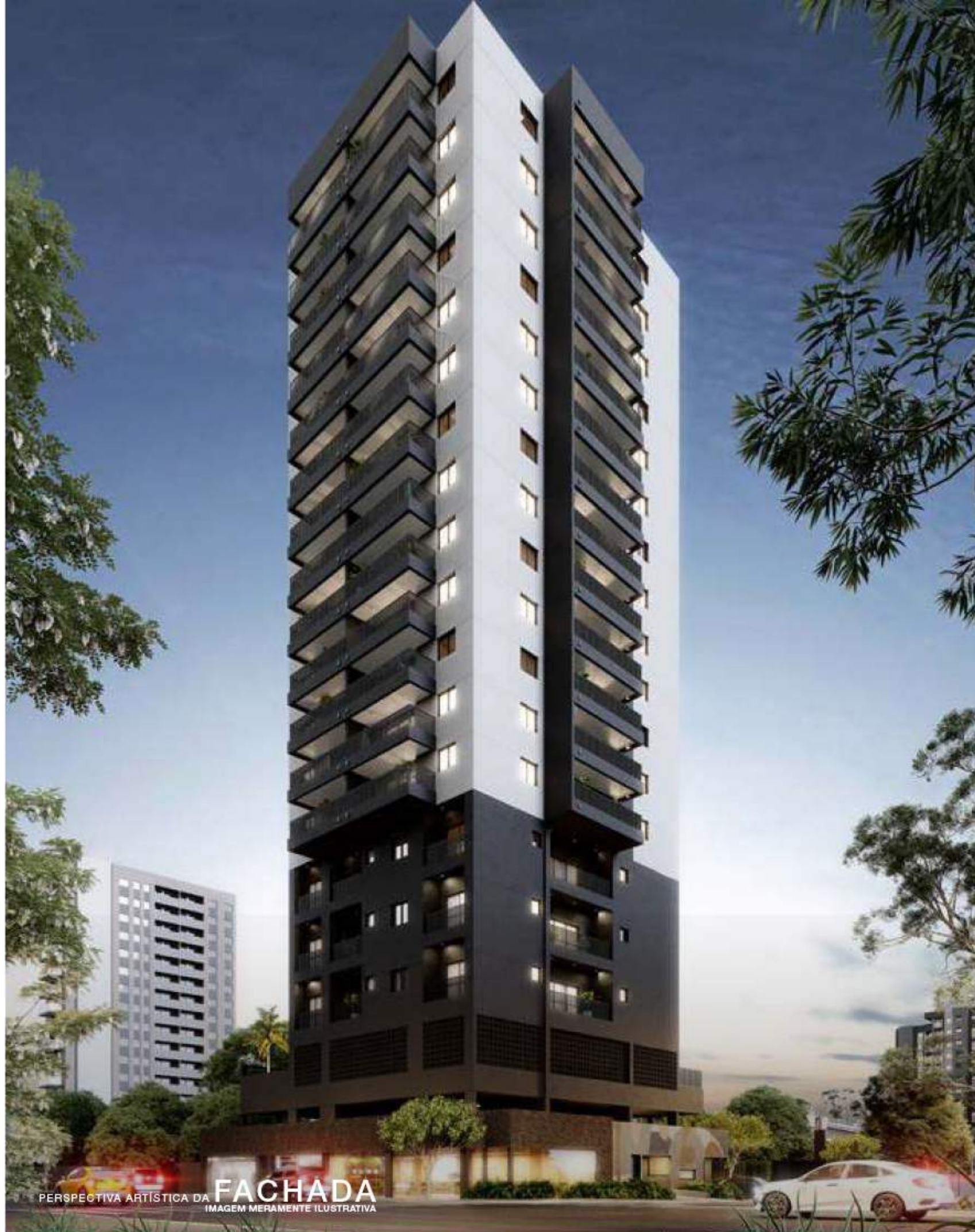
PERSPECTIVA ARTÍSTICA DA FACHADA IMAGEM MERAMENTE ILUSTRATIVA