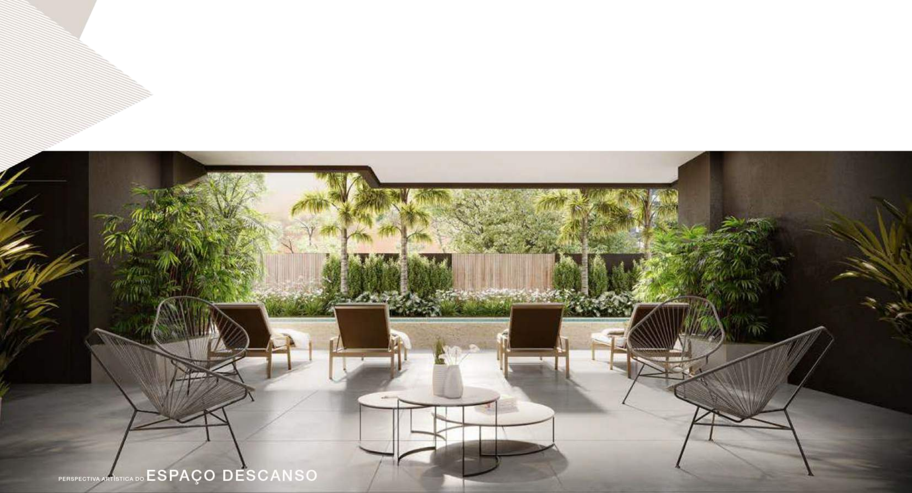
PERSPECTIVA ARTÍSTICA DO ESPAÇO DESCANSO