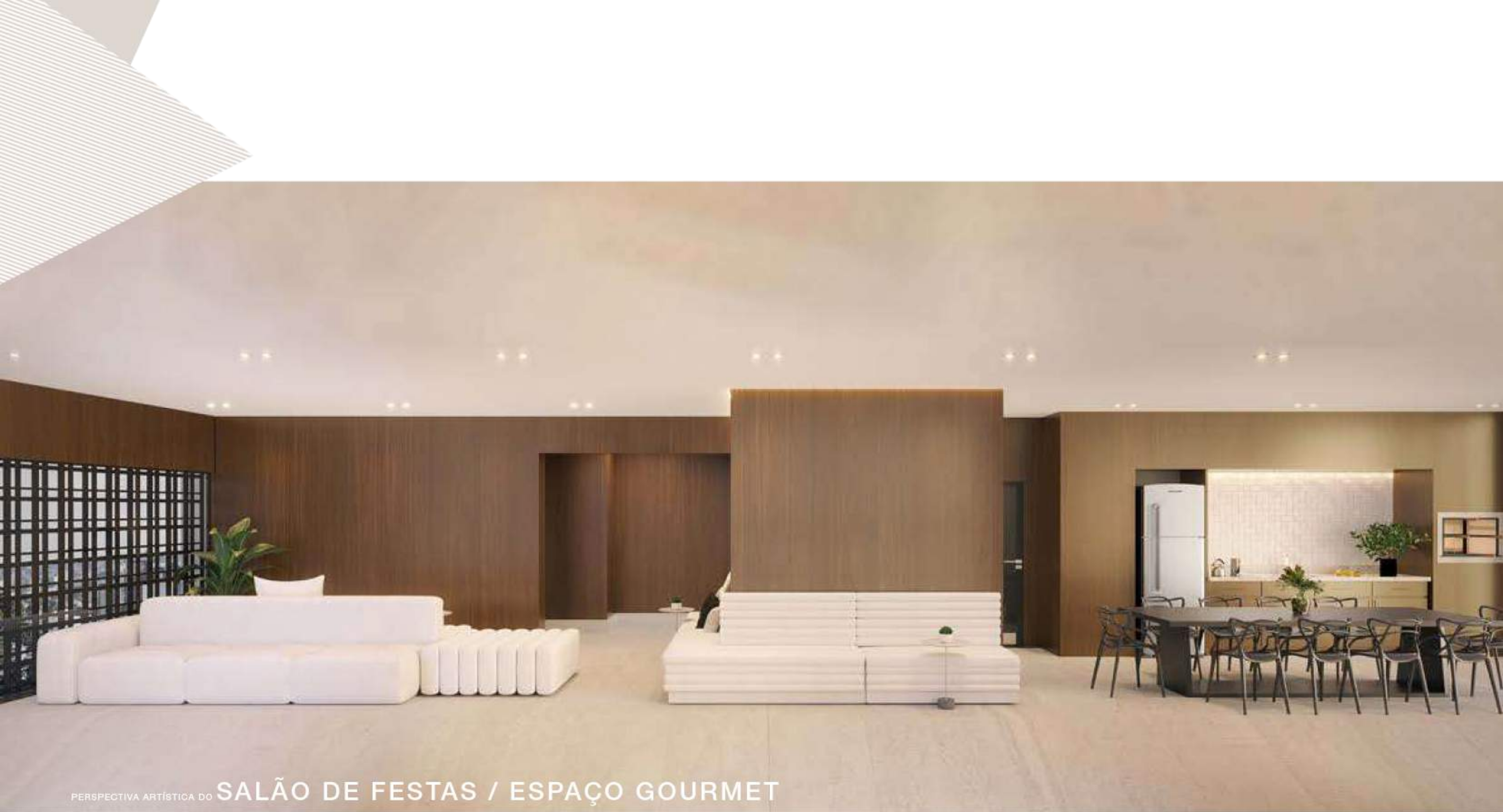
PERSPECTIVA ARTÍSTICA DO SALÃO DE FESTAS / ESPAÇO GOURMET