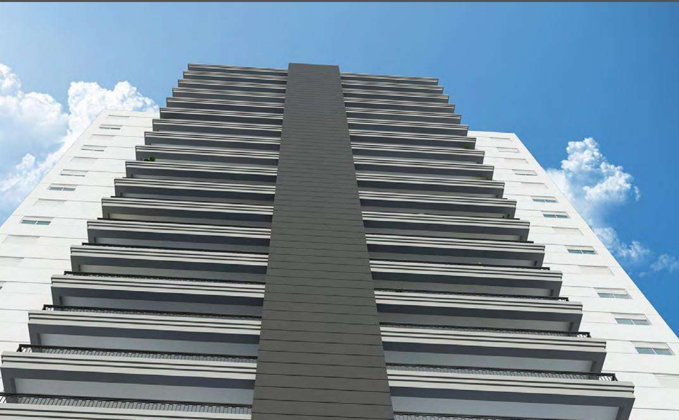
Perspectiva ilustrada do detalhe da fachada da torre C