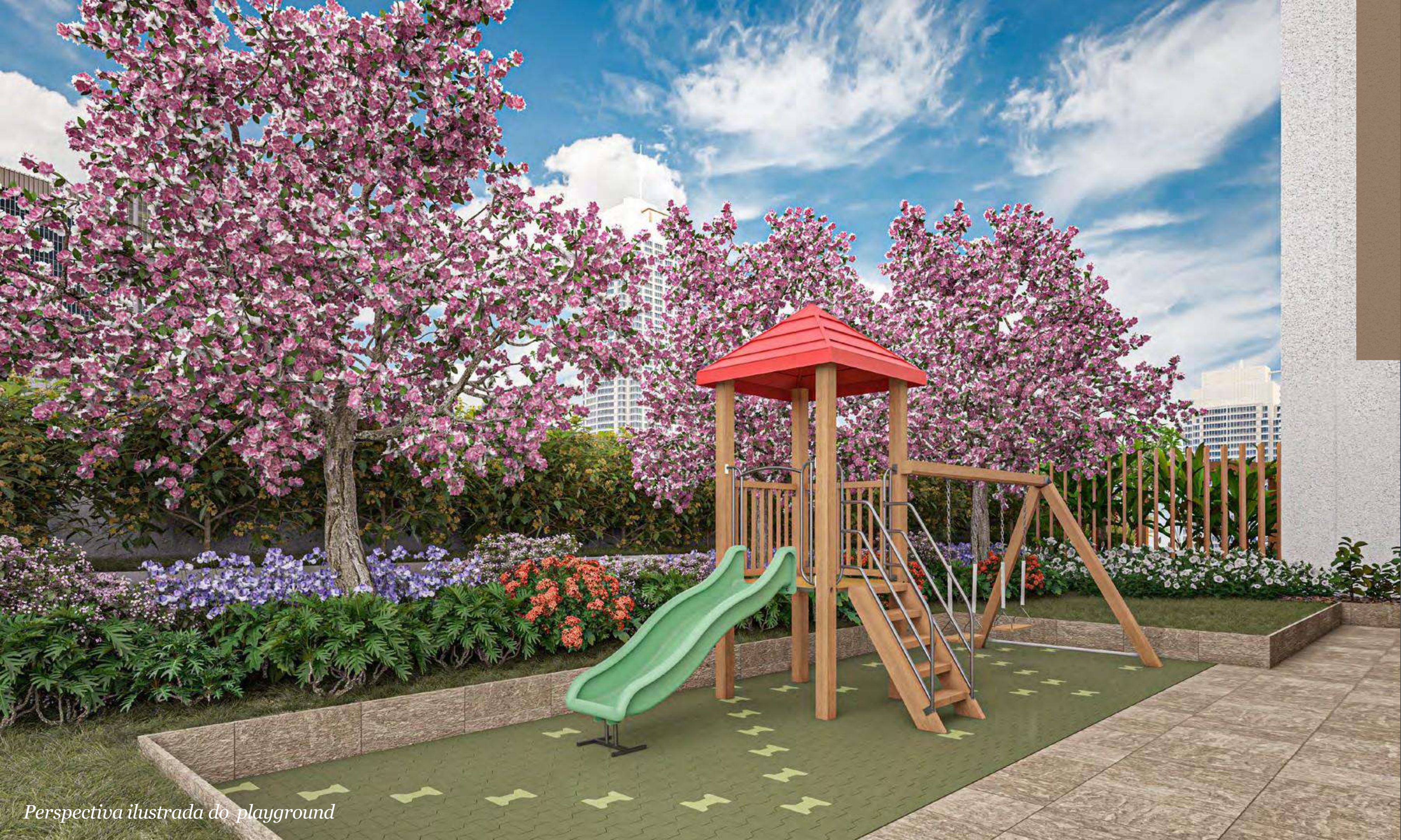
Perspectiva ilustrada do playground