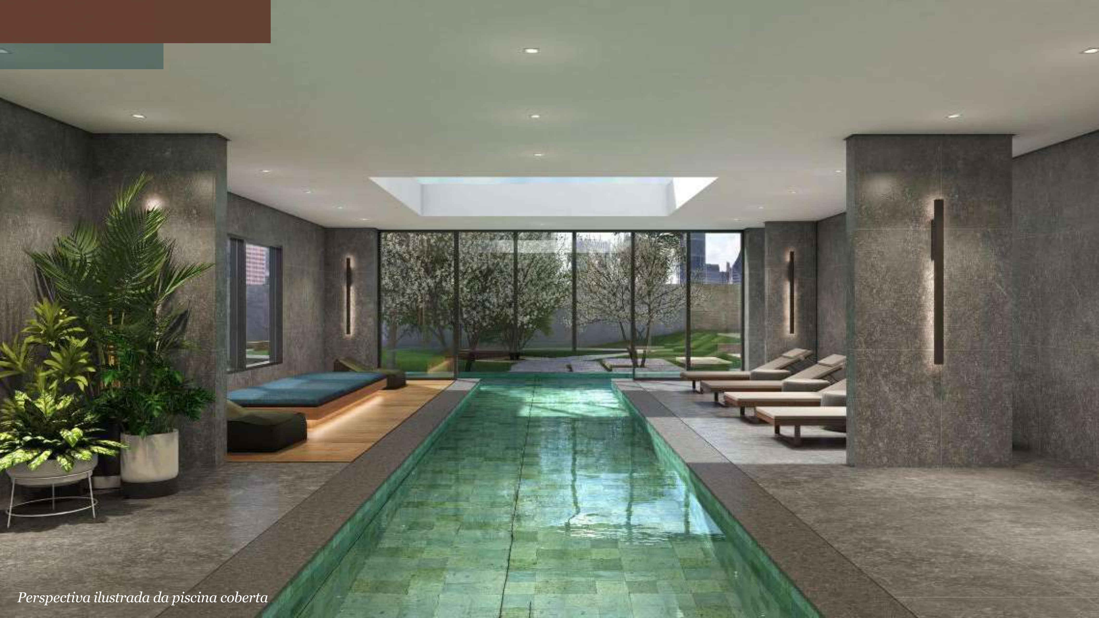
Perspectiva ilustrada da piscina coberta