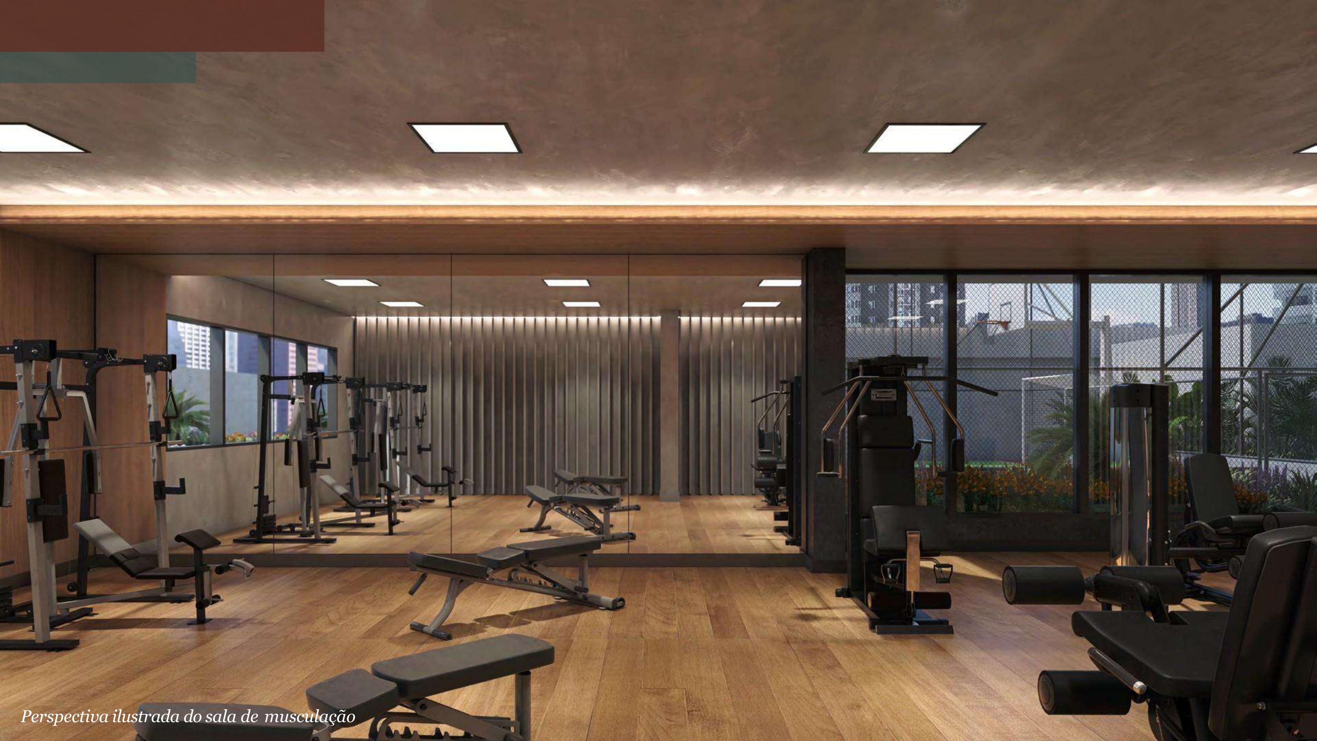
Perspectiva ilustrada do sala de musculação