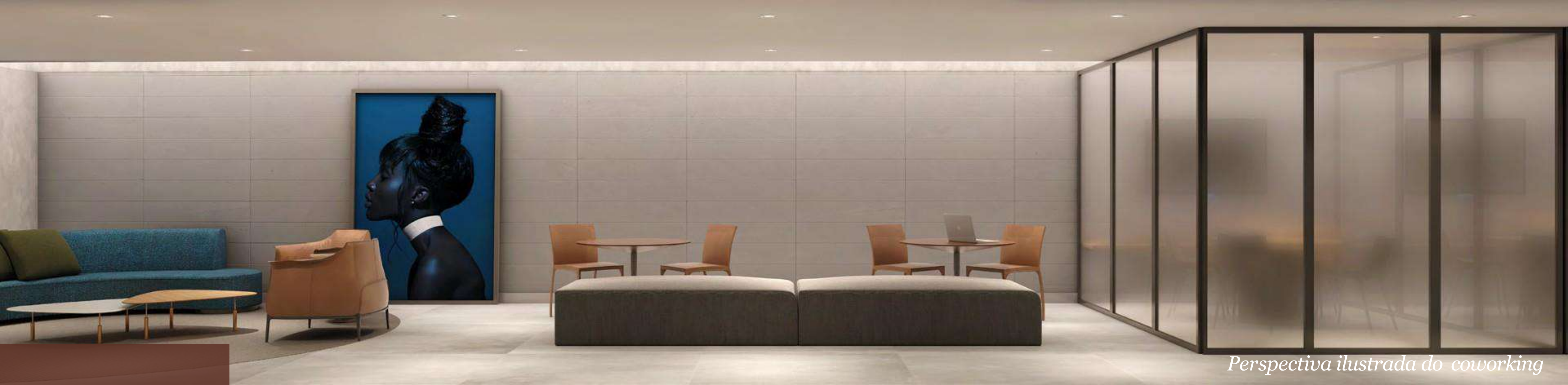
Perspectiva ilustrada do coworking

Coworking de padrão profissional. A praticidade vai dar expediente no seu dia a dia.