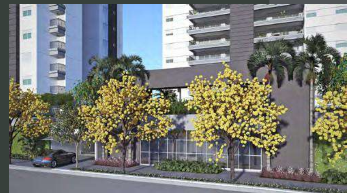
Perspectiva ilustrada do acesso

Um refúgio de sofisticação na tranquila Rua Madre Cabrini.