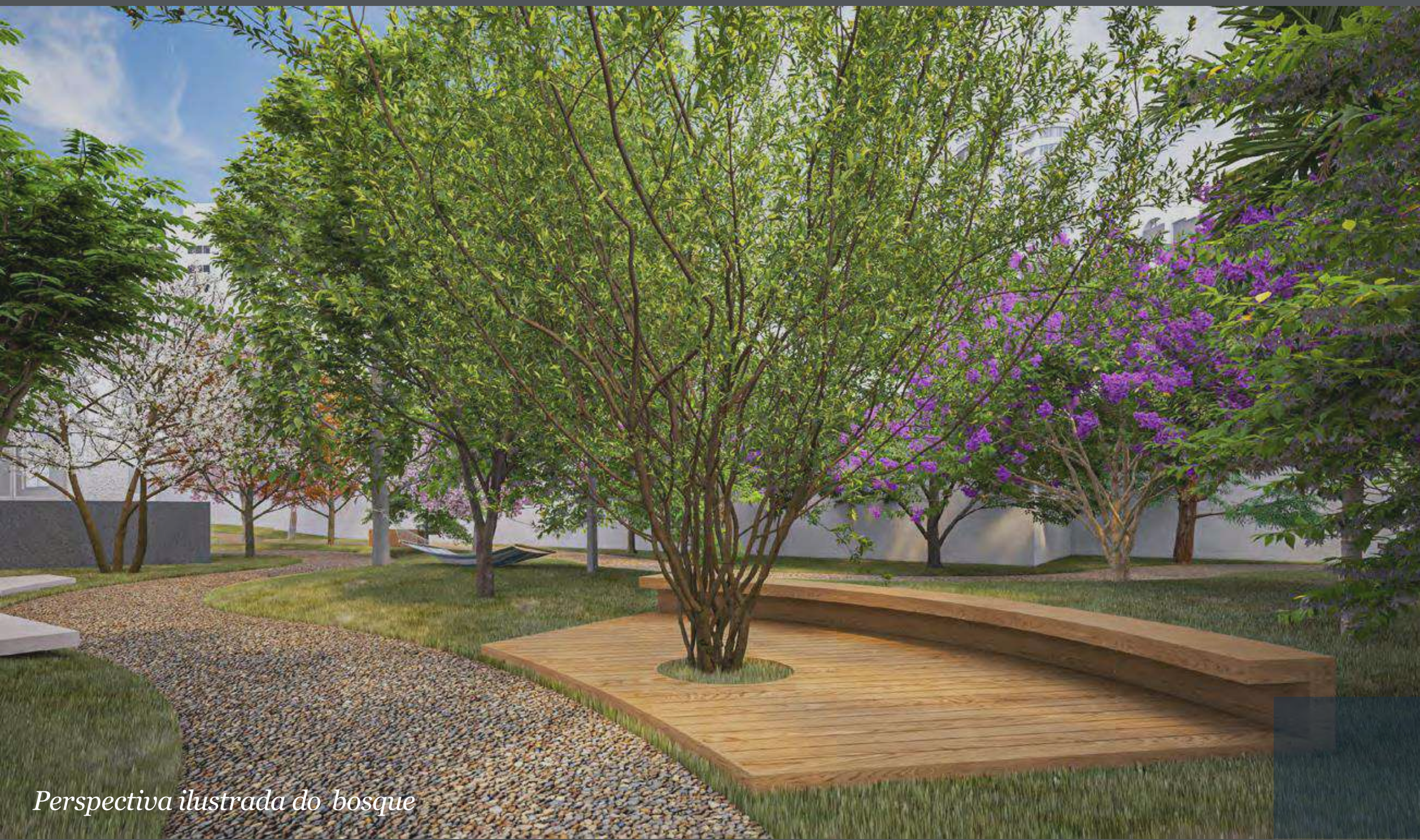
Perspectiva ilustrada do bosque

Ter um pedaço da natureza dentro do próprio condomínio é um privilégio raro. Exclusividade de quem agora pode encontrar diariamente o seu oásis particular em meio à Vila Mariana. Para contemplar, ouvir o canto dos pássaros e sentir-se distante da cidade, mesmo com todas as facilidades ao redor.