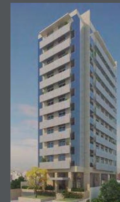
CONCEPT OFFICES PINHEIROS