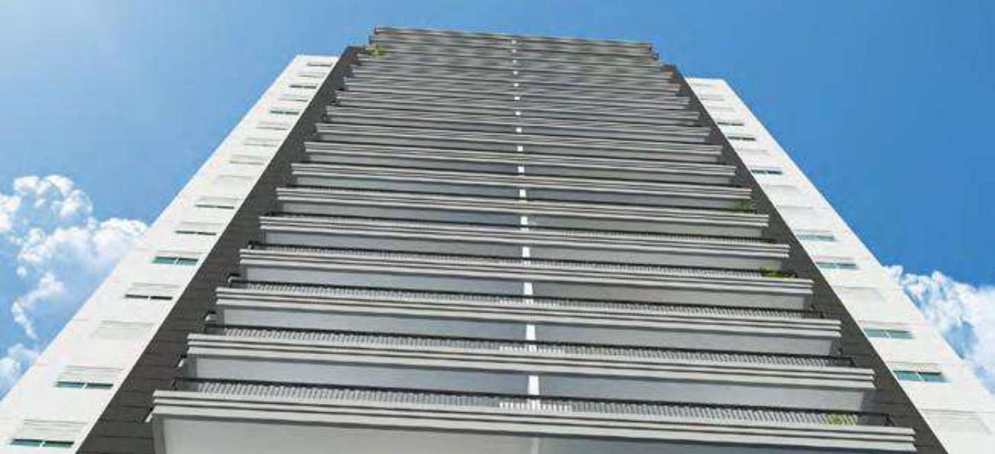
Perspectiva ilustrada do detalhe da fachada da torre A