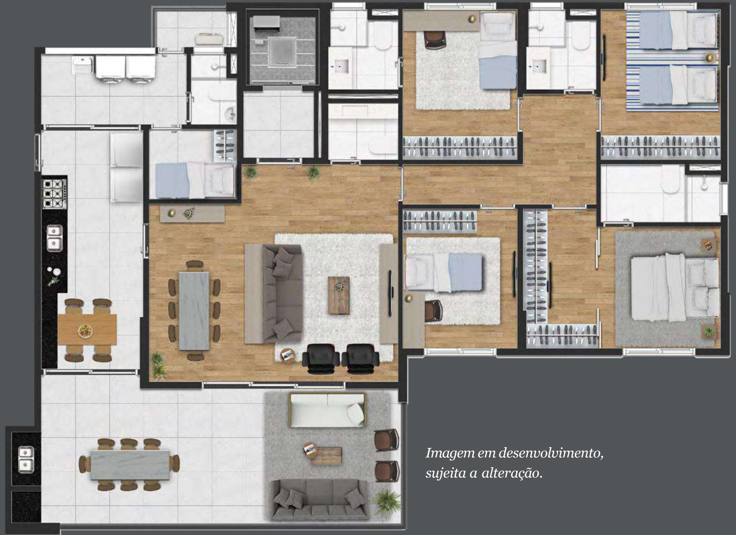
Imagem em desenvolvimento, sujeita a alteração.

4 dorms. | 2 suítes Opção com 3 suítes 2 vagas