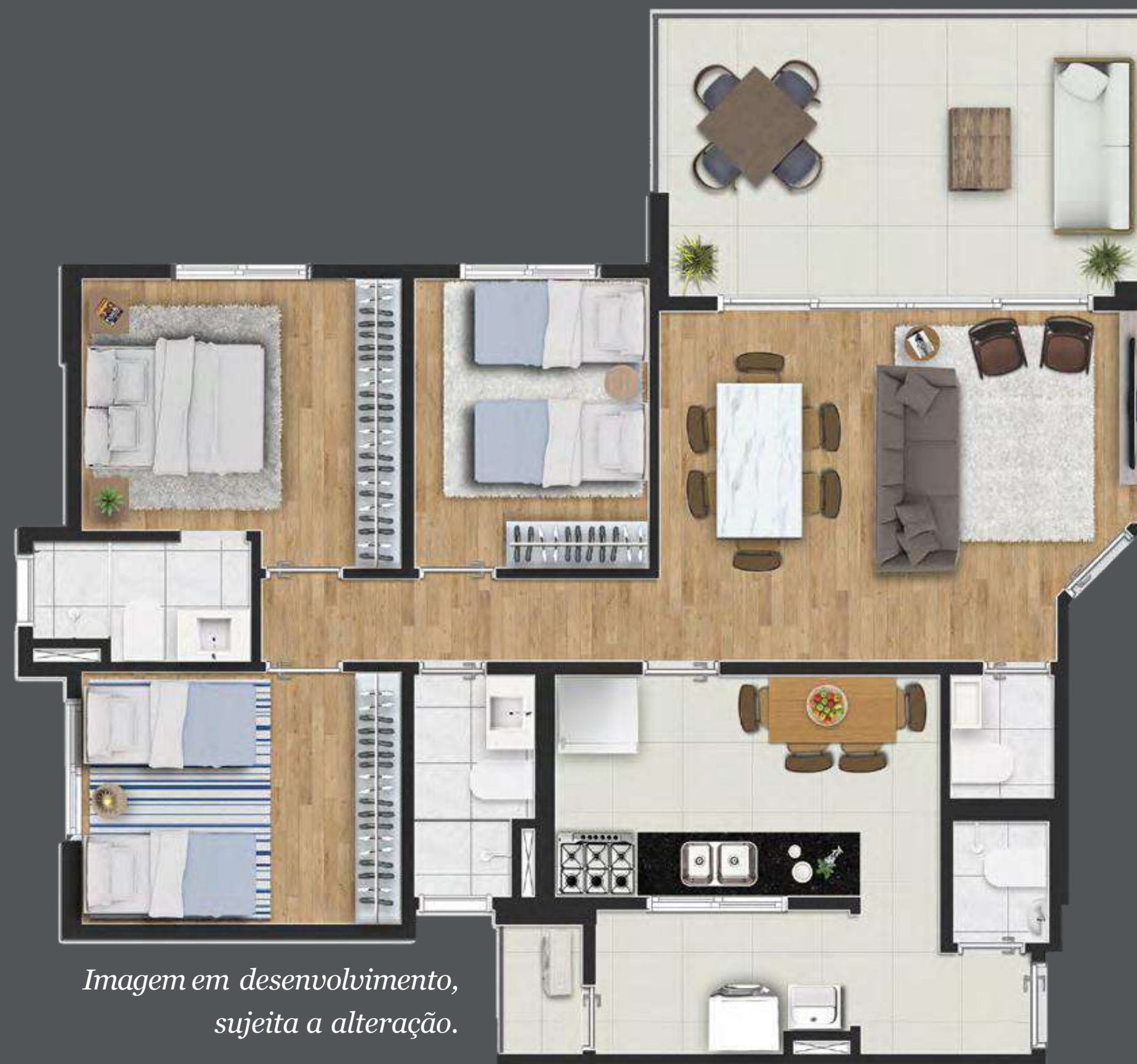
Imagem em desenvolvimento, sujeita a alteração.

Planta do apto. de 95 m 2 3 dorms. / 1 suíte Opção com 2 suítes 2 vagas