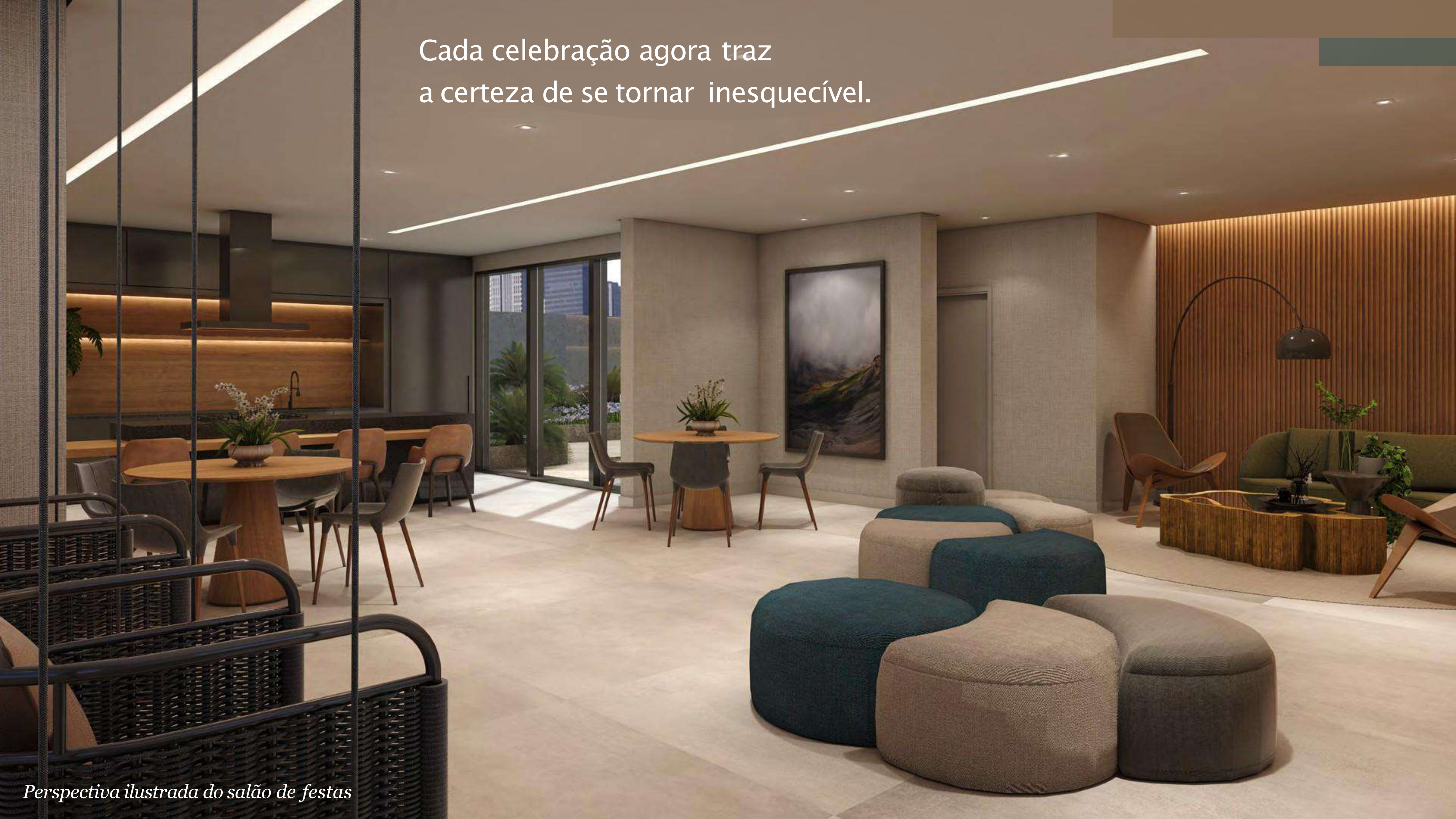
Perspectiva ilustrada do salão de festas

Cada celebração agora traz a certeza de se tornar inesquecível.