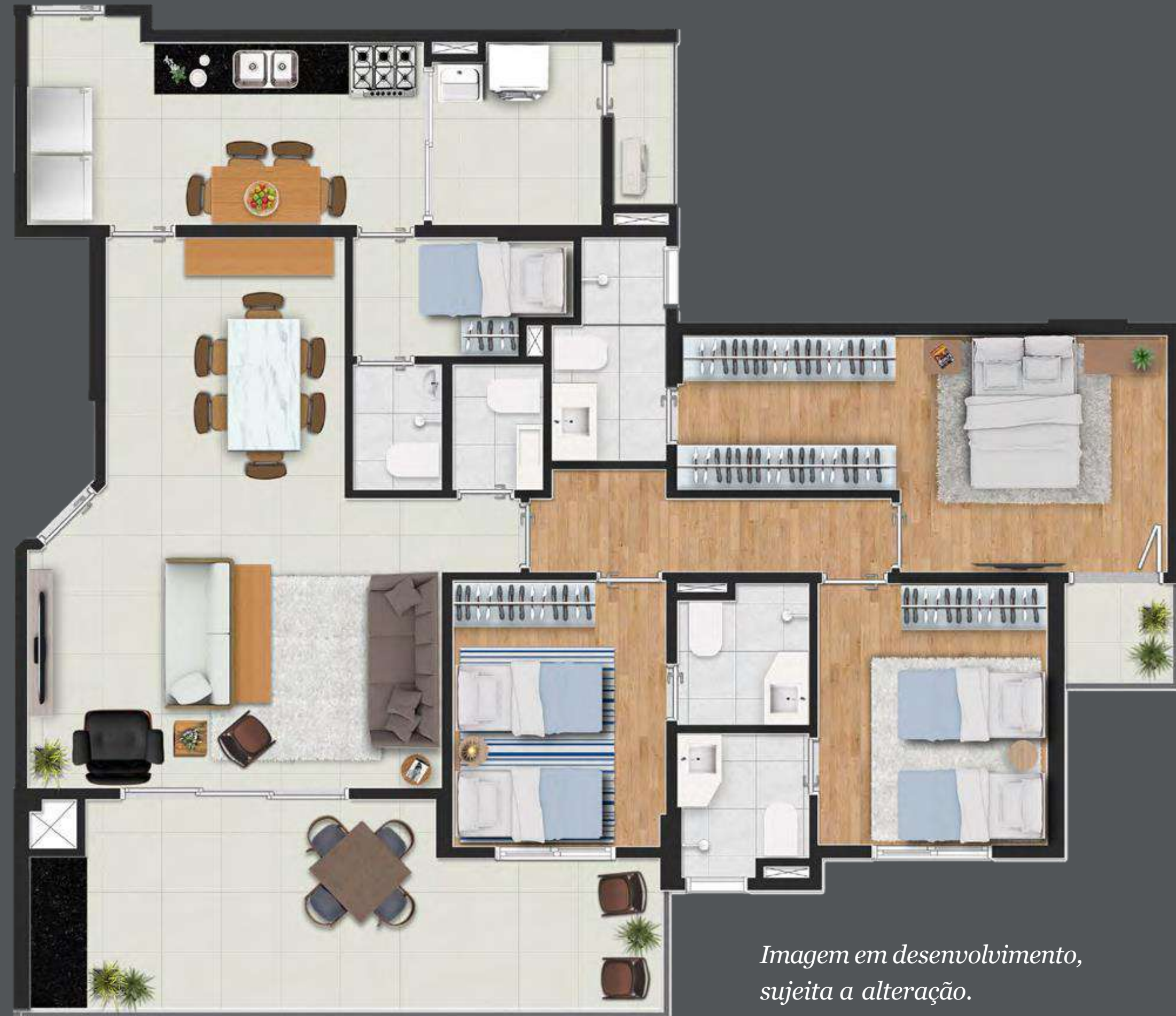
Imagem em desenvolvimento, sujeita a alteração.

Planta do apto. de 128 m 2 3 suítes / 2 vagas