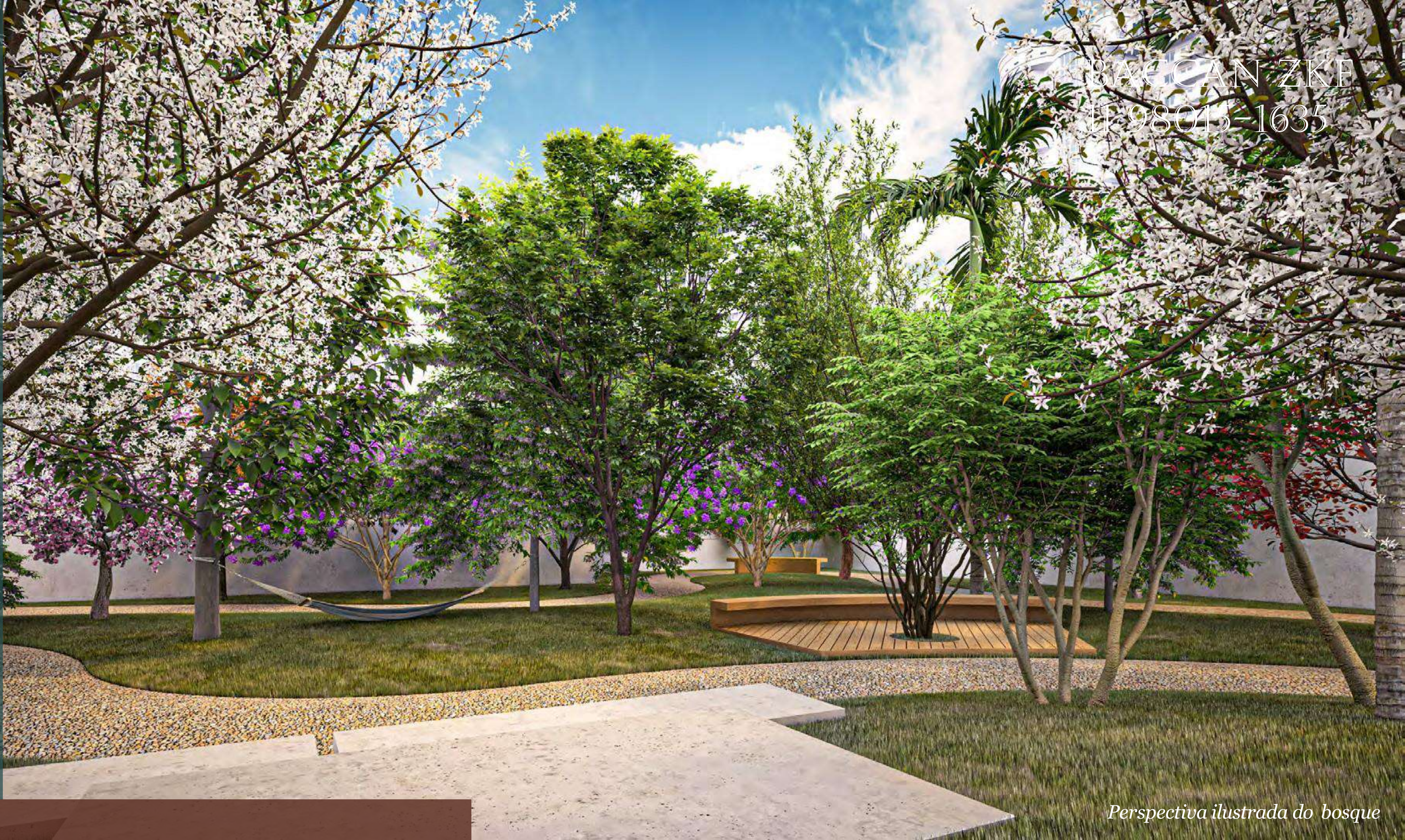
Perspectiva ilustrada do bosque