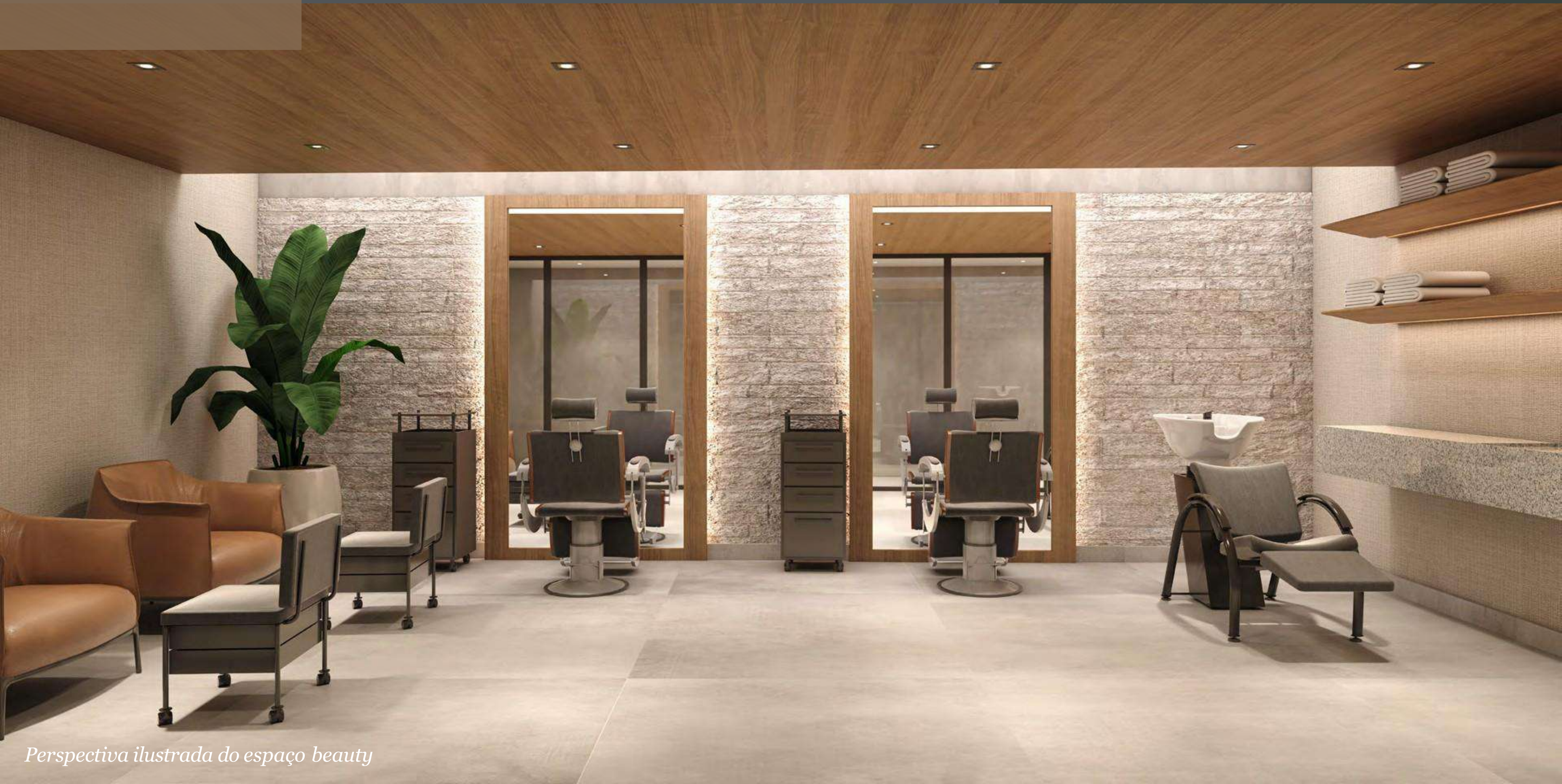
Perspectiva ilustrada do espaço beauty