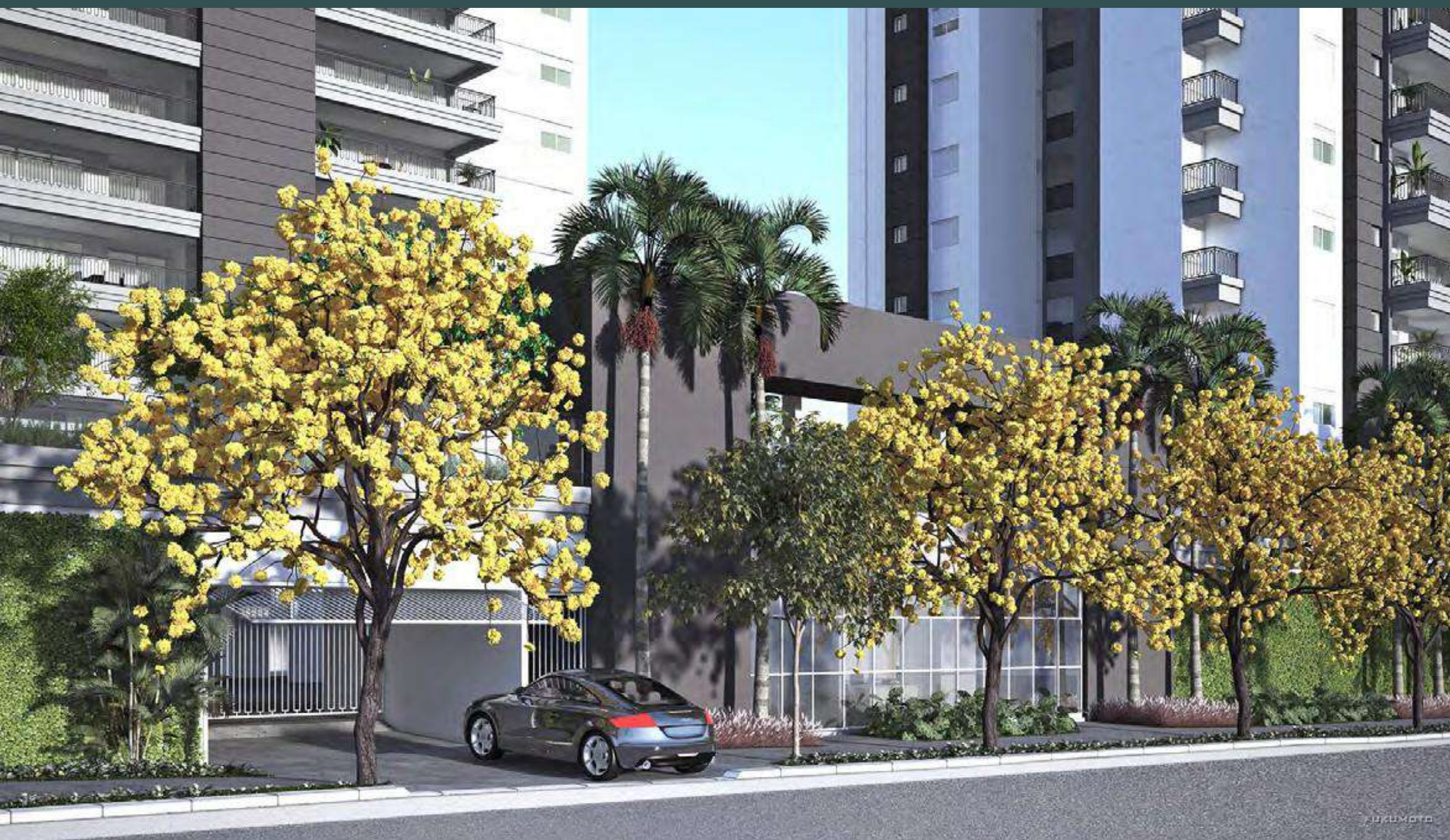
Perspectiva ilustrada do acesso

Um refúgio de sofisticação na tranquila Rua Madre Cabrini.