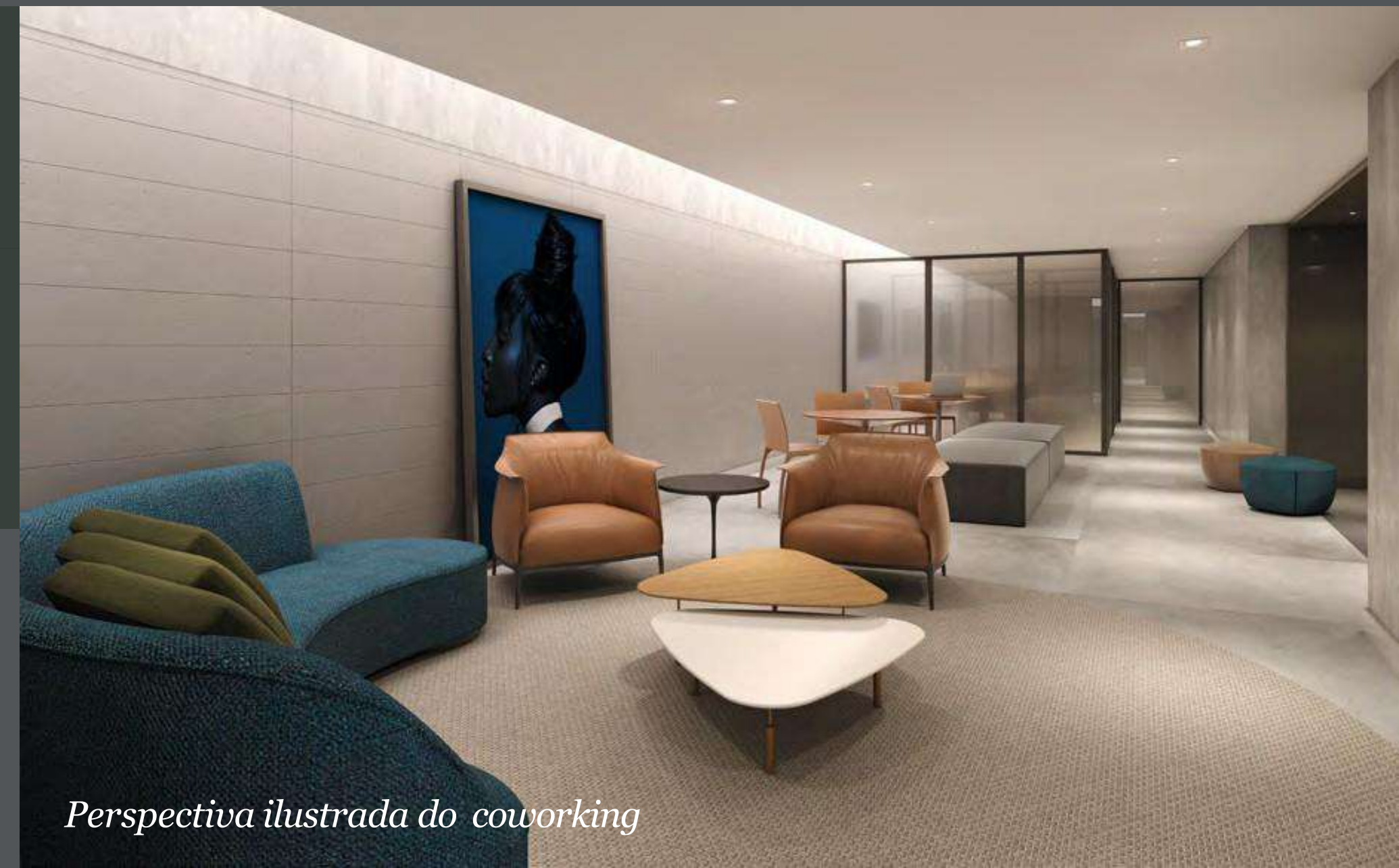
Perspectiva ilustrada do coworking

Coworking de padrão profissional. A praticidade vai dar expediente no seu dia a dia.