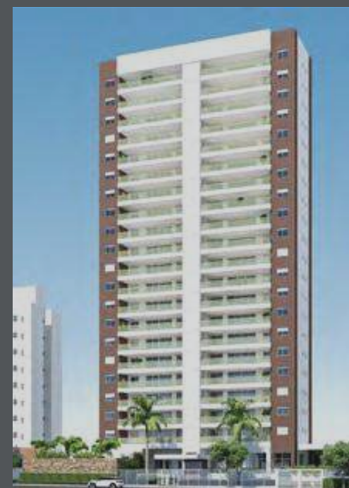
NY LIVING BROOKLIN