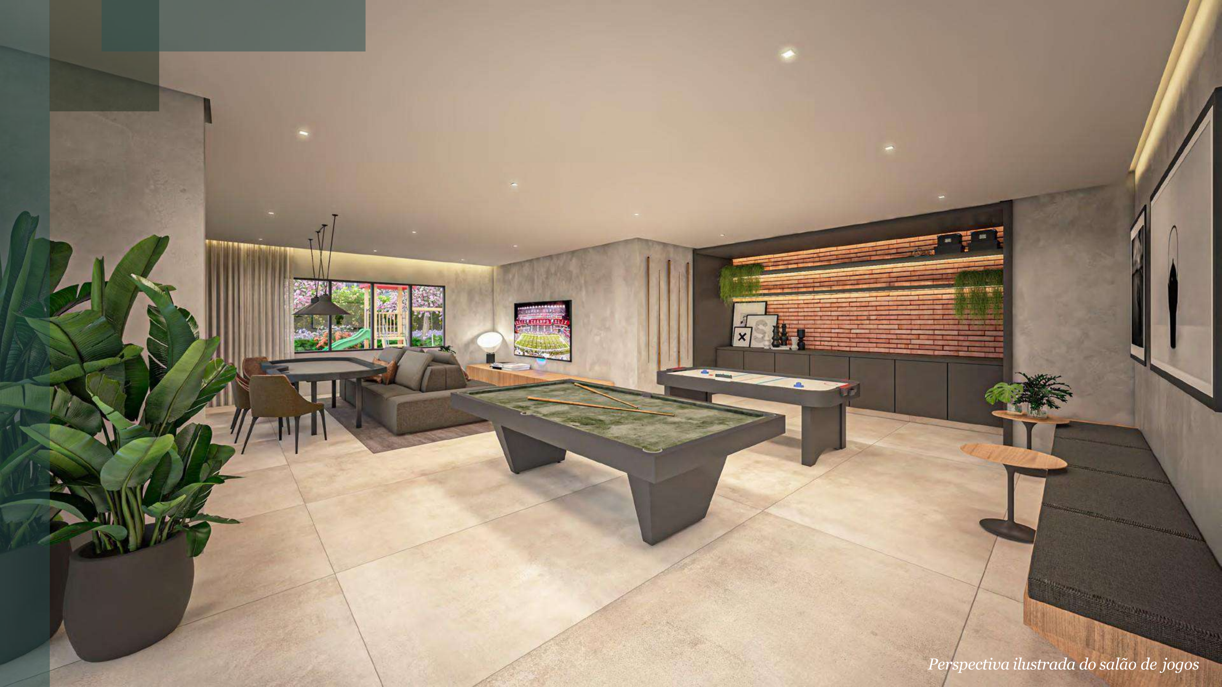
Perspectiva ilustrada do salão de jogos