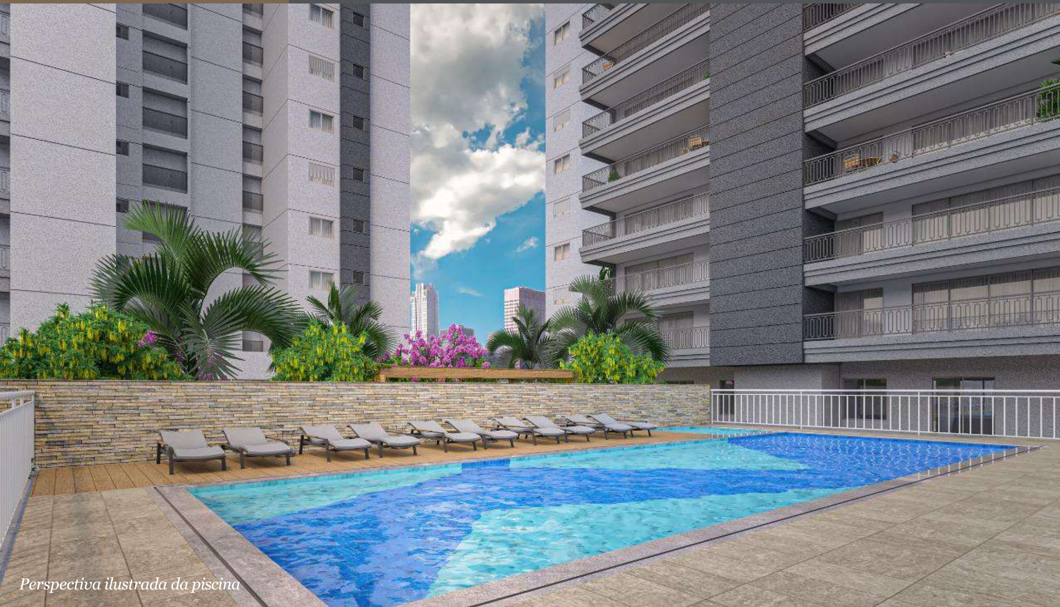
Perspectiva ilustrada da piscina