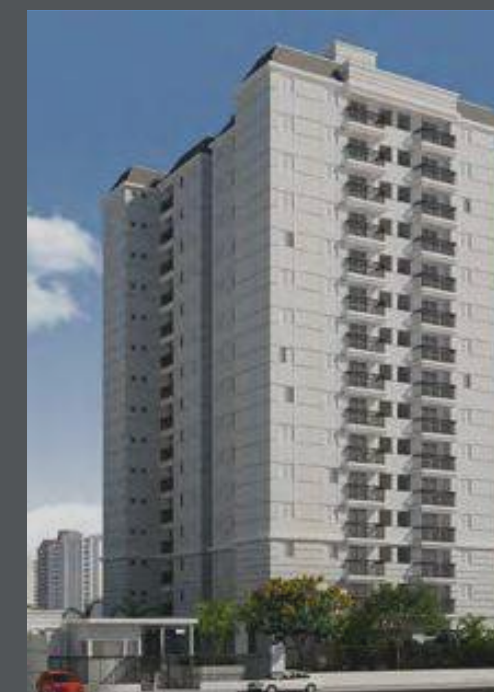
OASIS CURSINO CURSINO