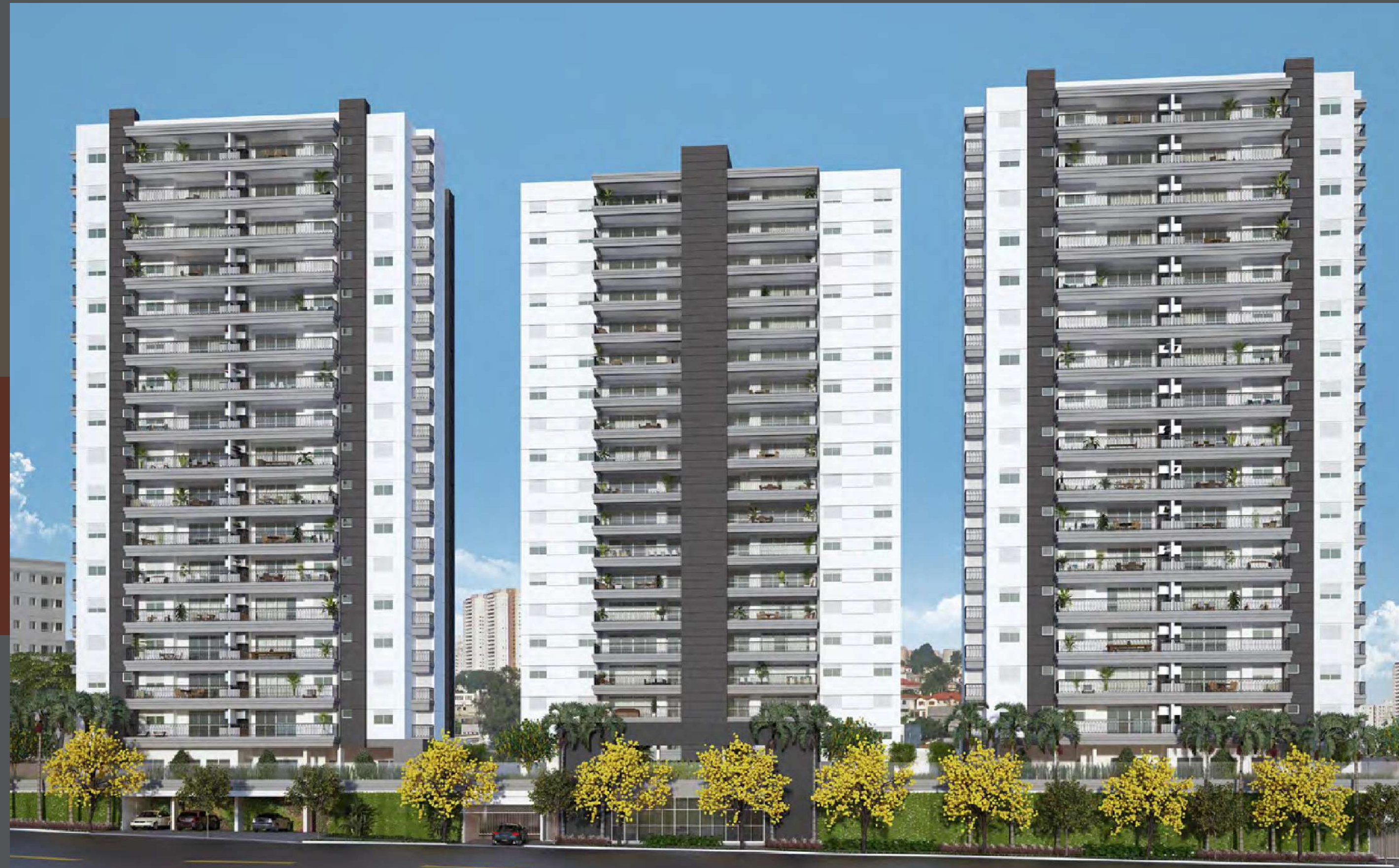
Perspectiva ilustrada das fachadas