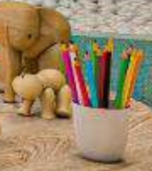
Perspectiva ilustrada da brinquedoteca