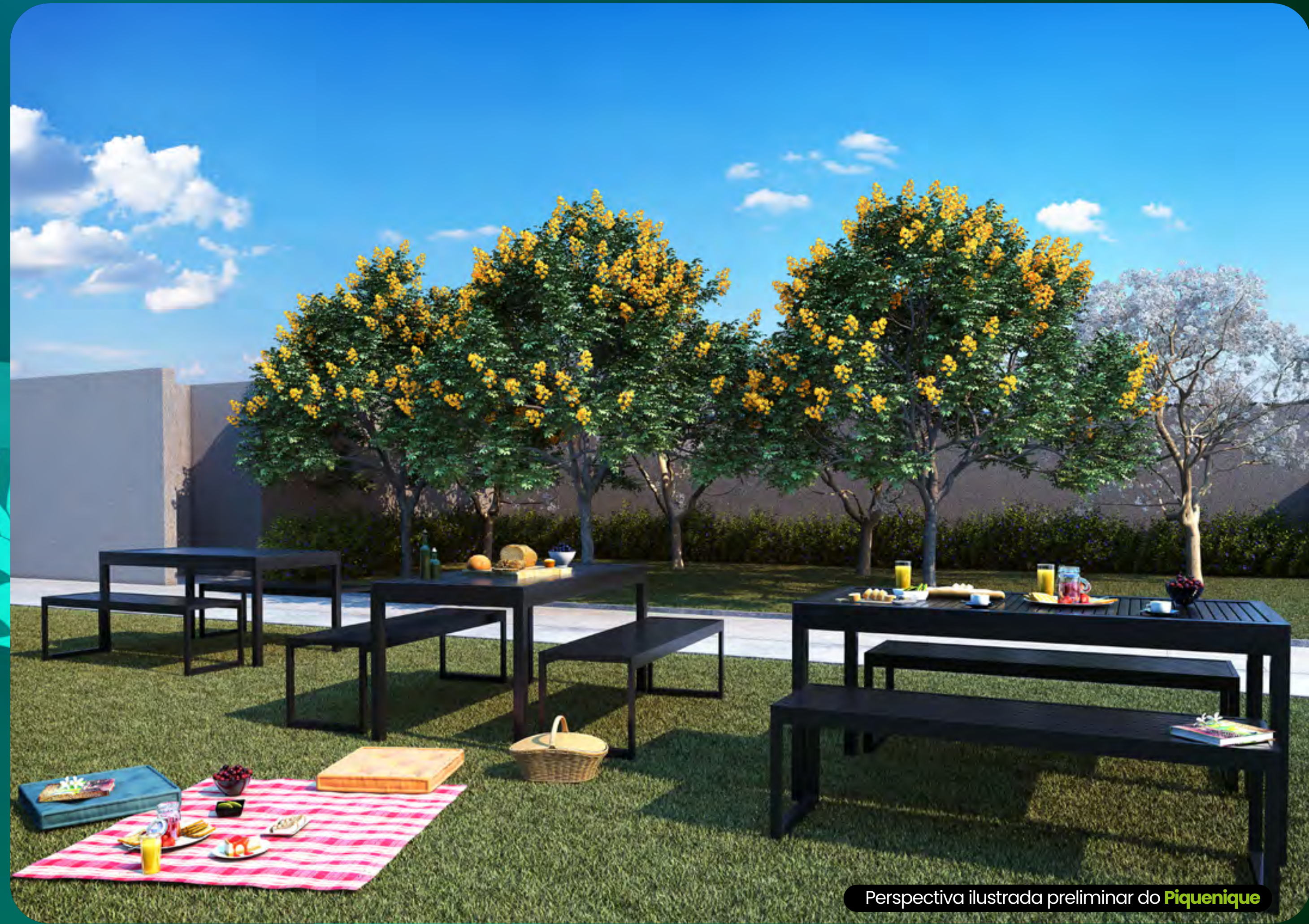
Perspectiva ilustrada preliminar do Piquenique