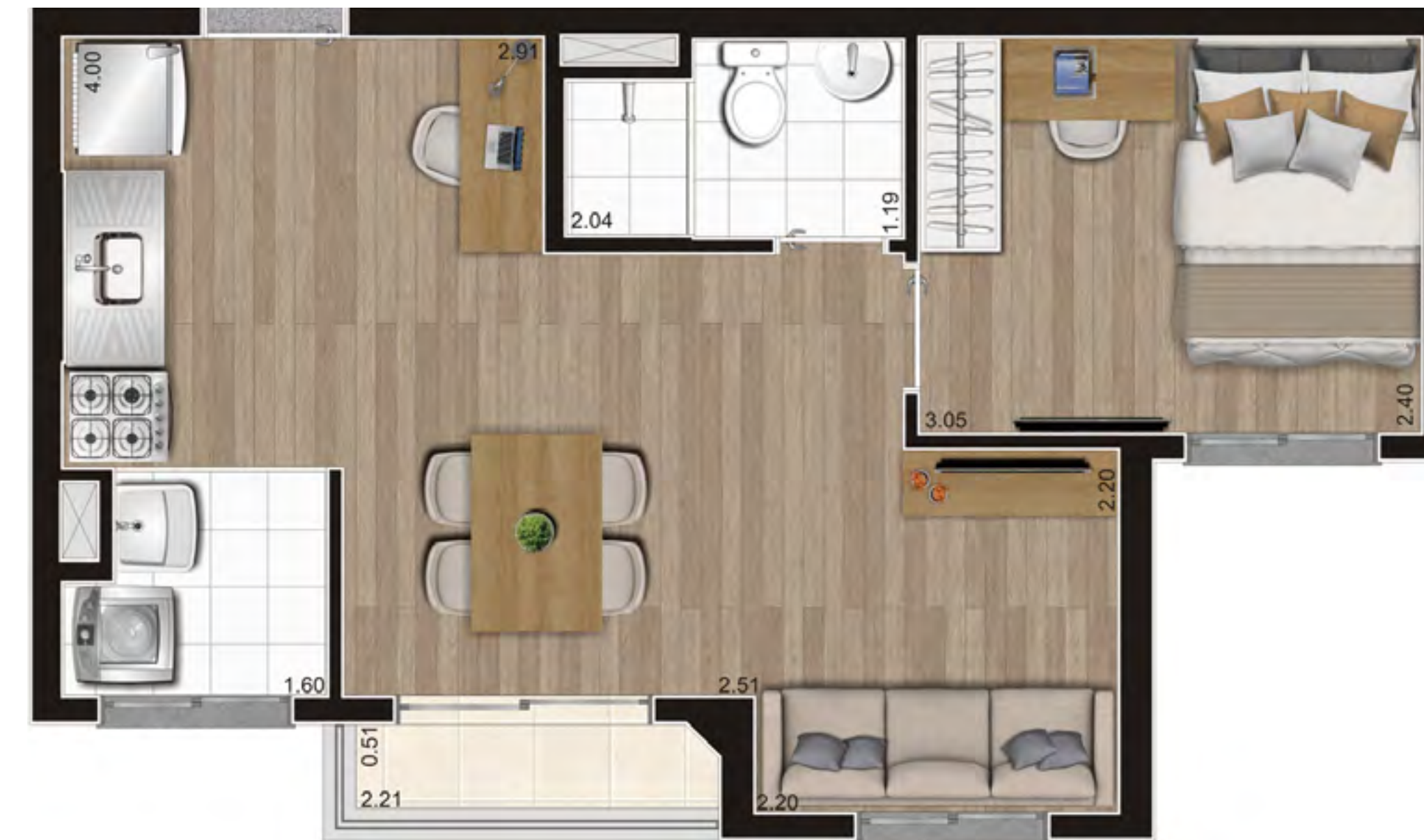
Perspectiva ilustrada preliminar

Planta ilustrativa preliminar de 37,43m 2 – Planta D Meio - Opção Ampliada – Final 3 do pav. tipo da Torre A – com sugestão de decoração. Os móveis, objetos e equipamentos, assim como os materiais de acabamento apresentados na planta, têm dimensões comerciais e não são parte integrante do contrato.