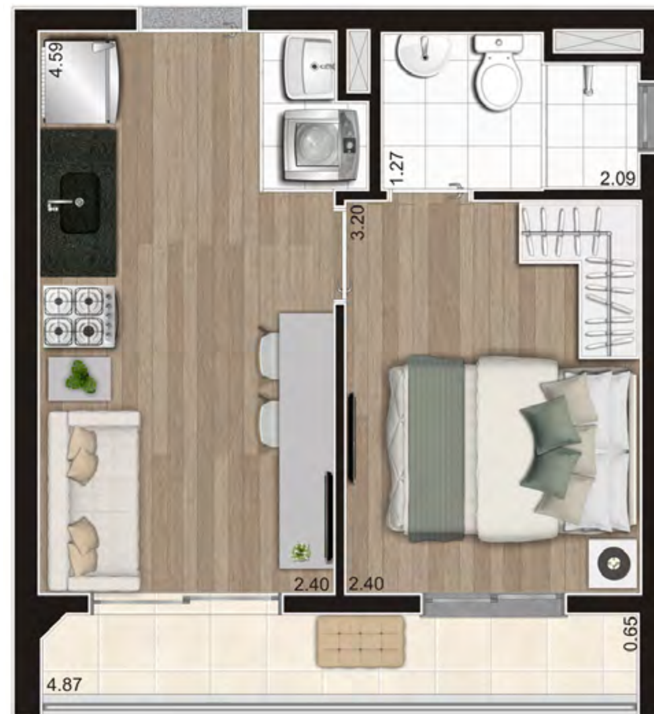
Perspectiva ilustrada preliminar