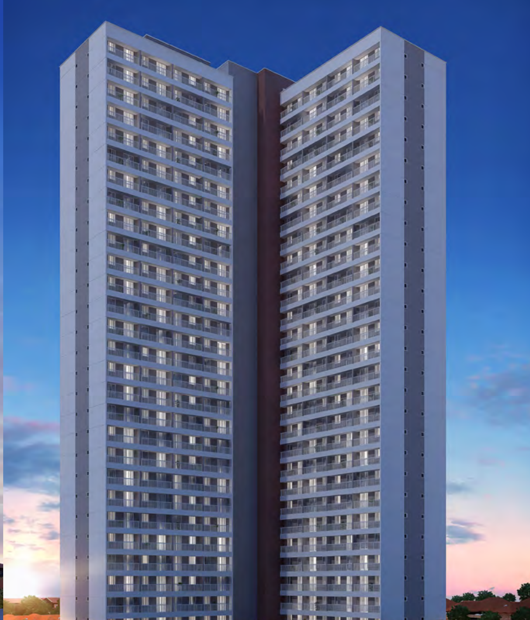
Perspectiva ilustrada preliminar da Fachada Torre B