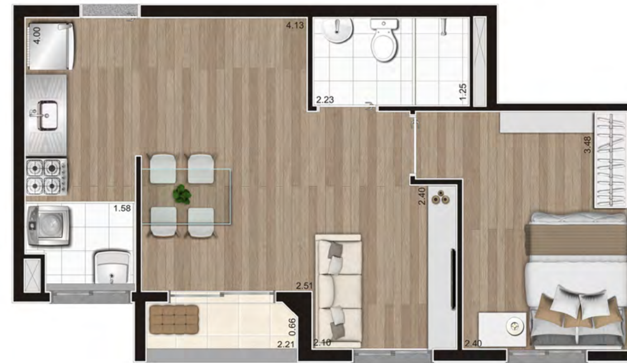
Perspectiva ilustrada preliminar

Planta ilustrativa preliminar de 43,00m 2 – Planta B Meio NR - Opção Ampliada – Final 3 do pav. tipo da Torre A – com sugestão de decoração. Os móveis, objetos e equipamentos, assim como os materiais de acabamento apresentados na planta, têm dimensões comerciais e não são parte integrante do contrato.