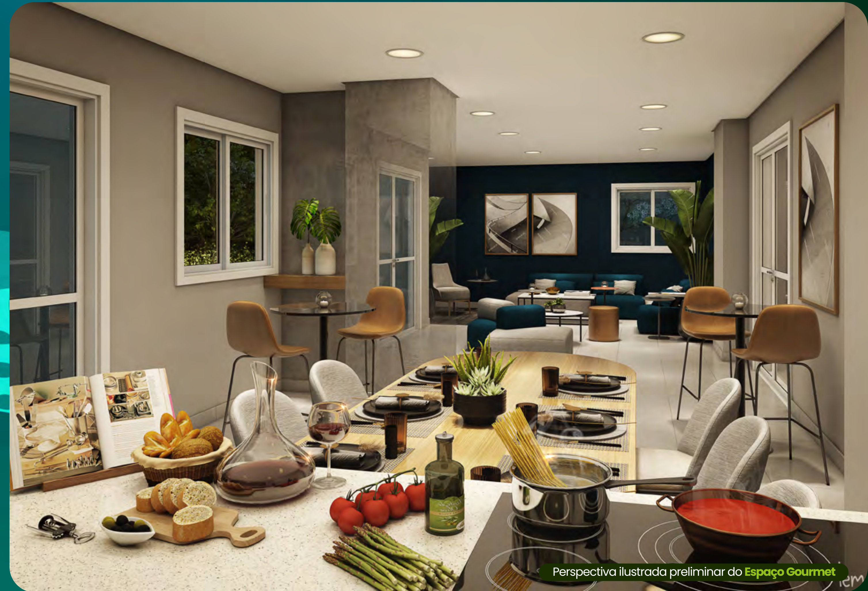
Perspectiva ilustrada preliminar do Espaço Gourmet