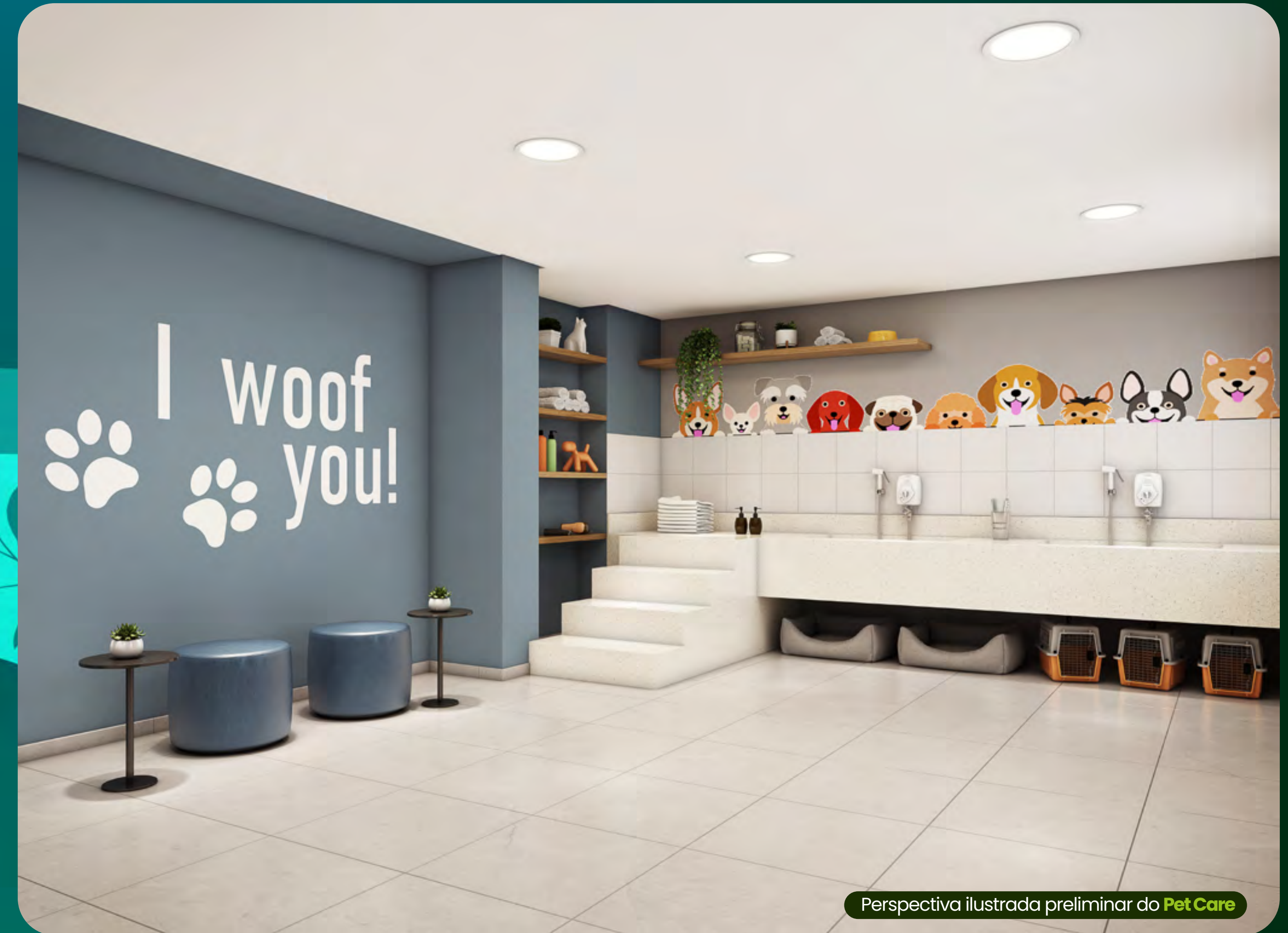
Perspectiva ilustrada preliminar do Pet Care