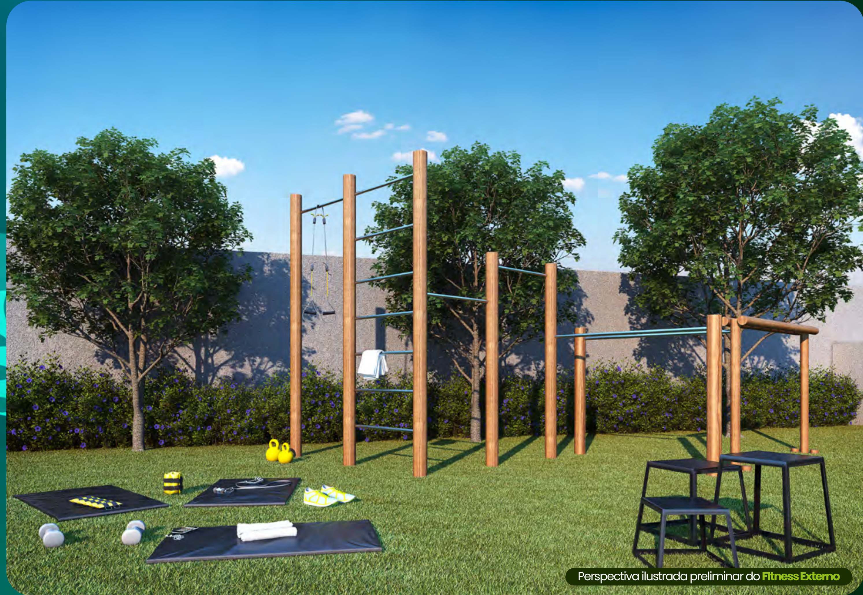
Perspectiva ilustrada preliminar do Fitness Externo