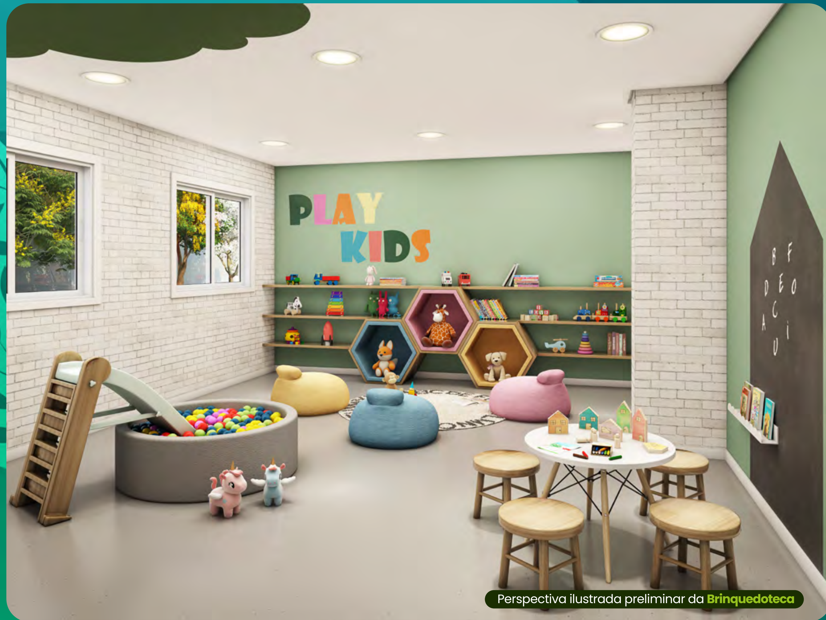
Perspectiva ilustrada preliminar da Brinquedoteca