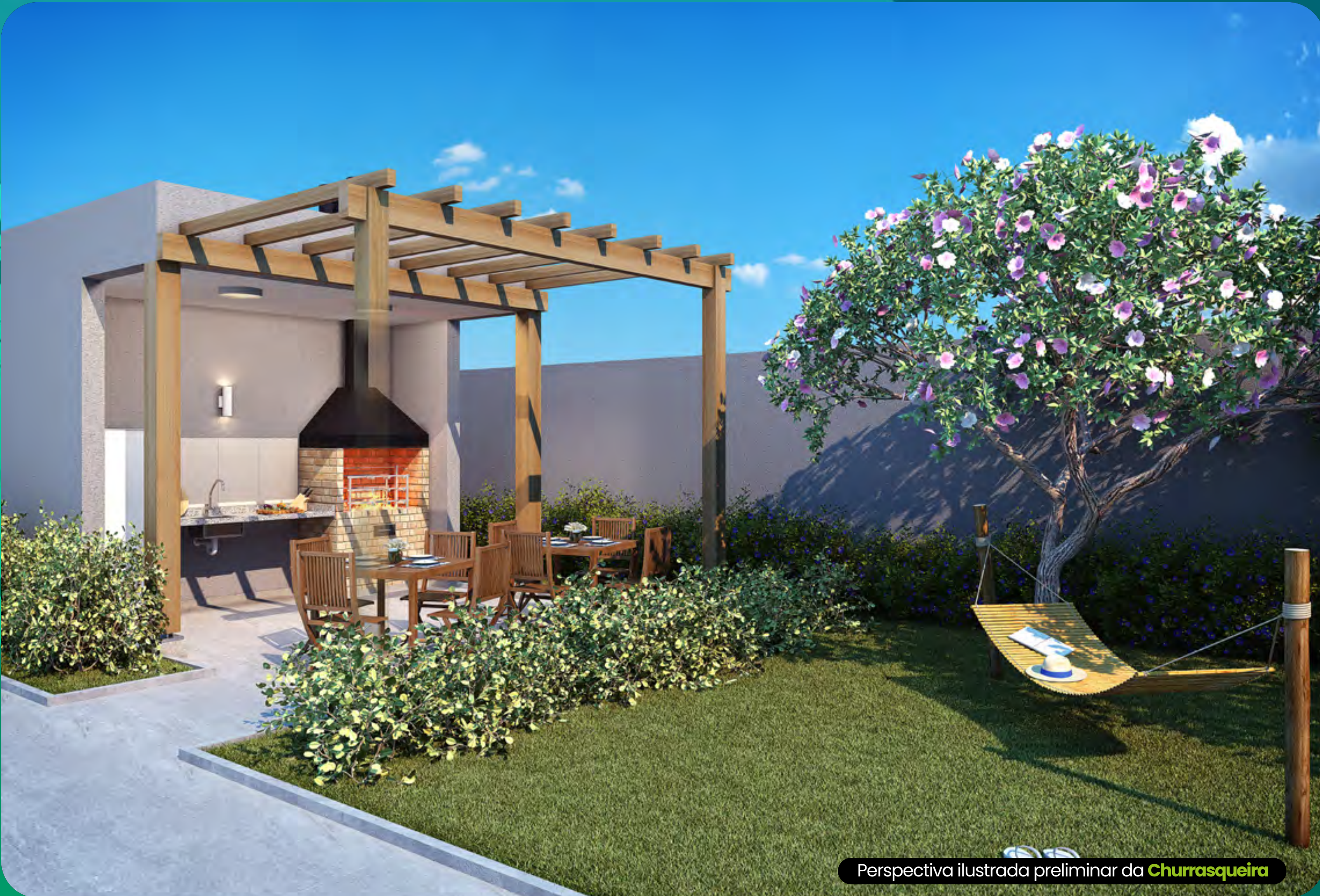
Perspectiva ilustrada preliminar da Churrasqueira