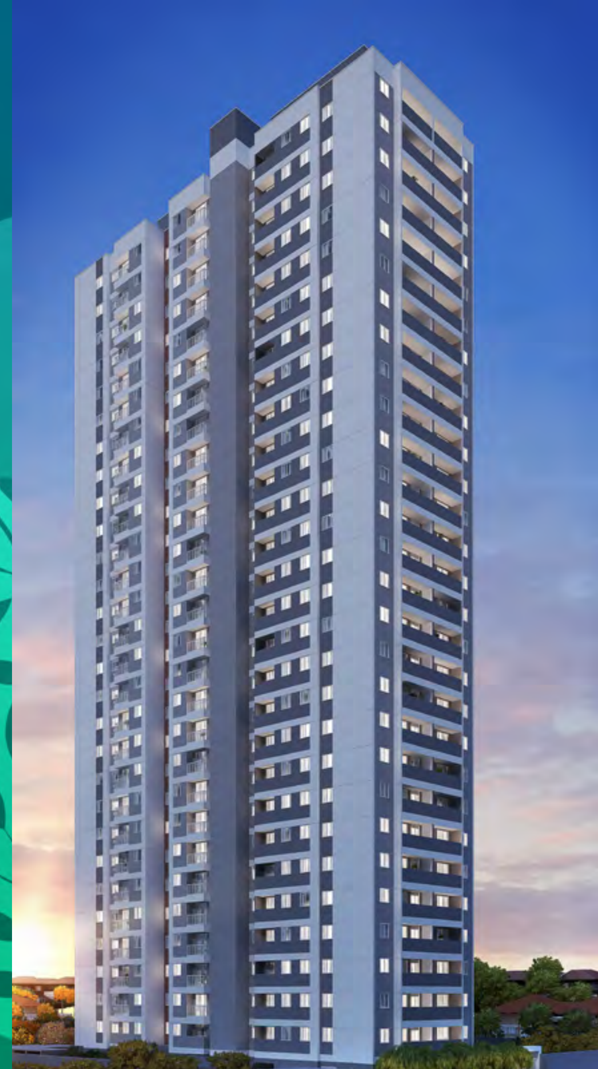
Perspectiva ilustrada preliminar da Fachada Torre A