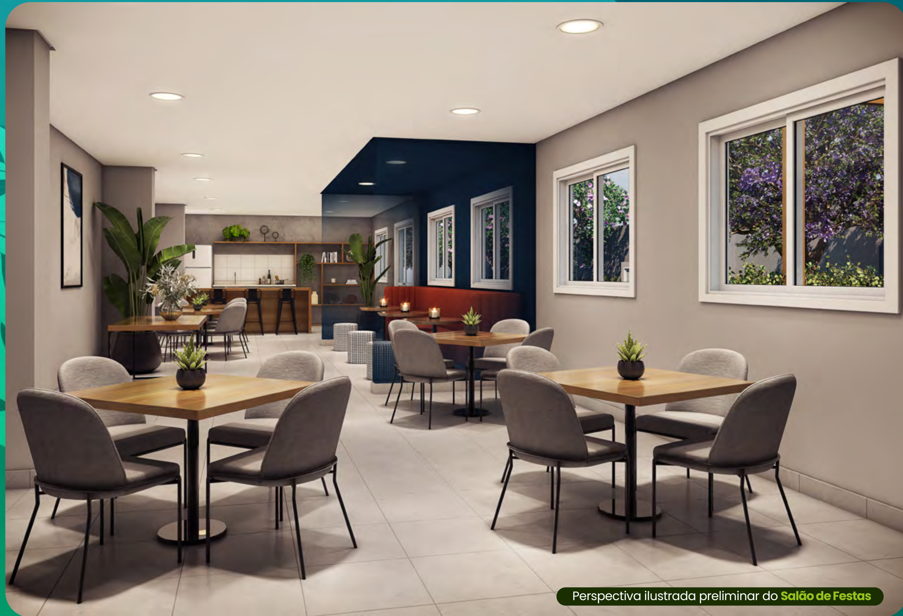
Perspectiva ilustrada preliminar do Salão de Festas