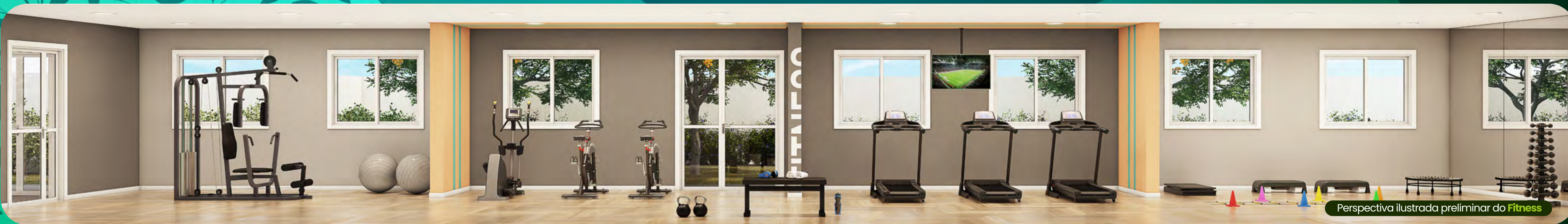
Perspectiva ilustrada preliminar do Fitness

Um espaço completo para um treino cada dia melhor.