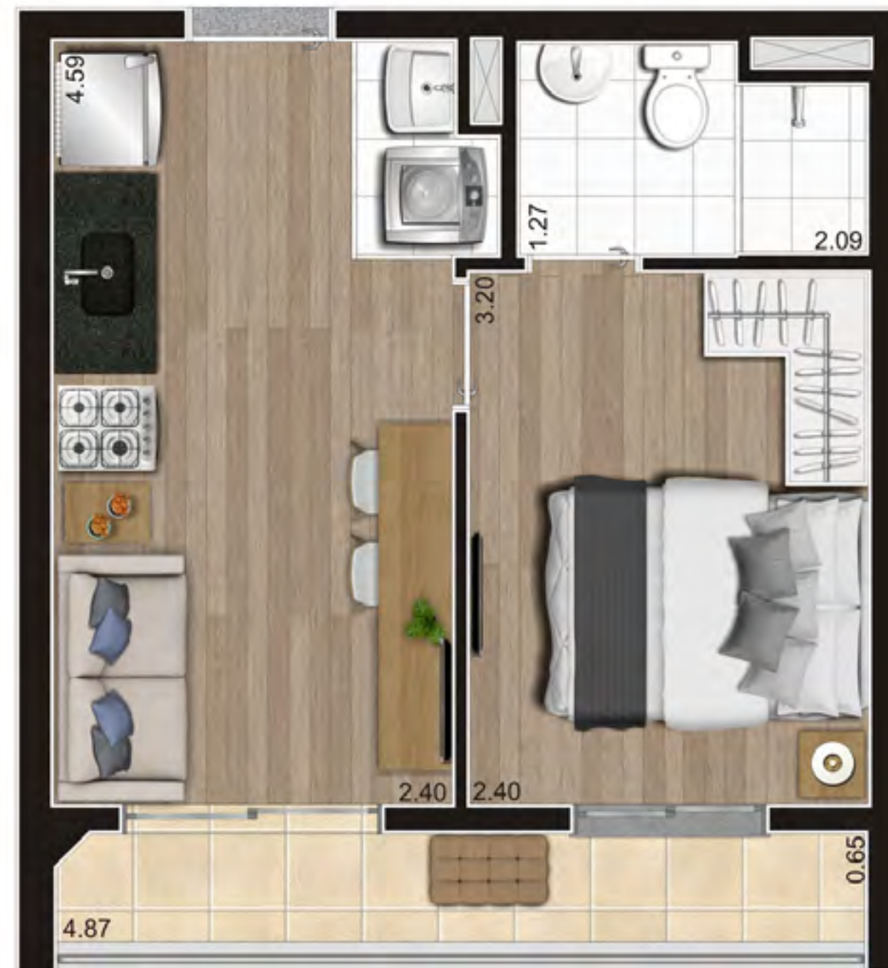
Perspectiva ilustrada preliminar