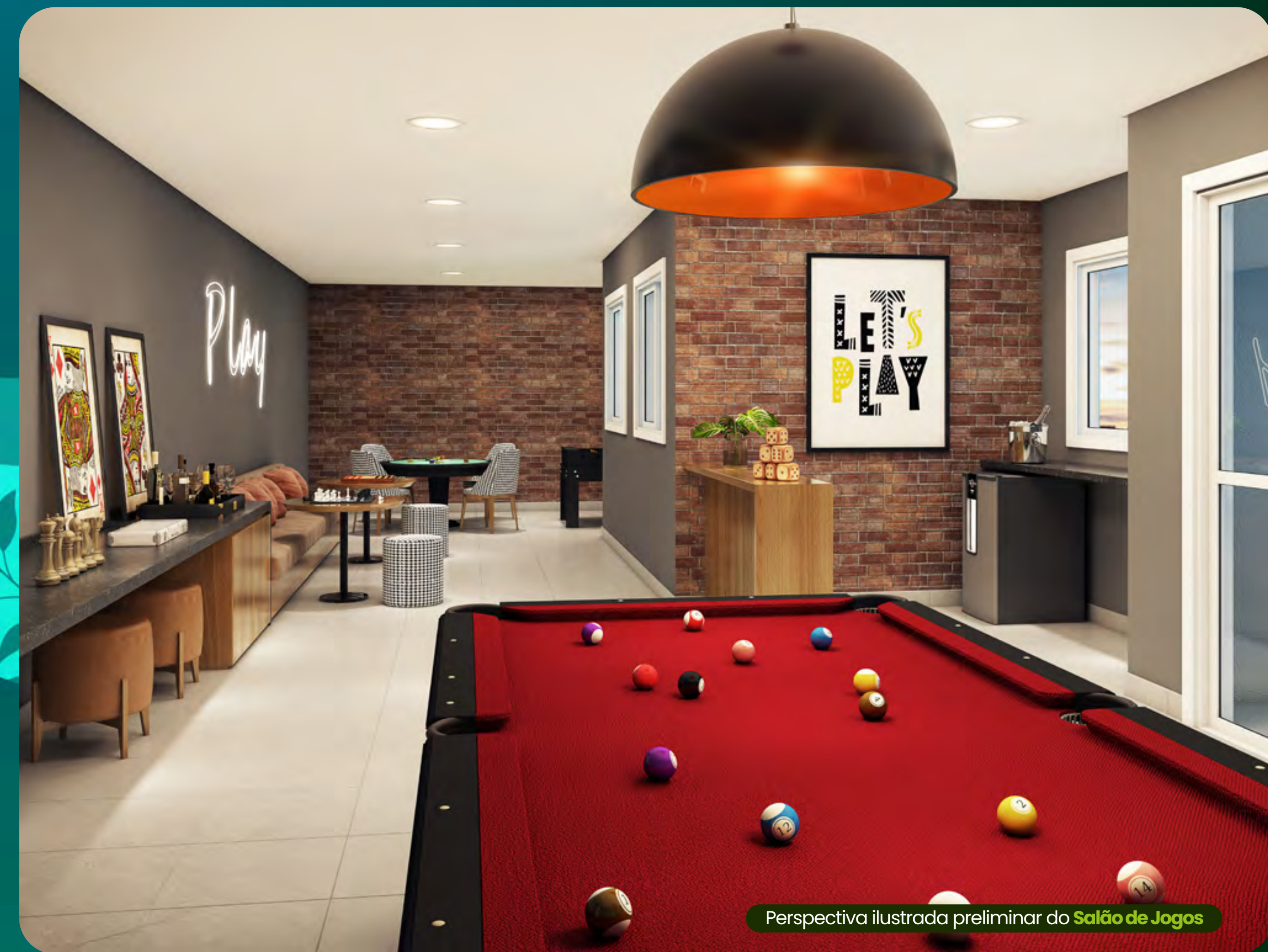
Perspectiva ilustrada preliminar do Salão de Jogos