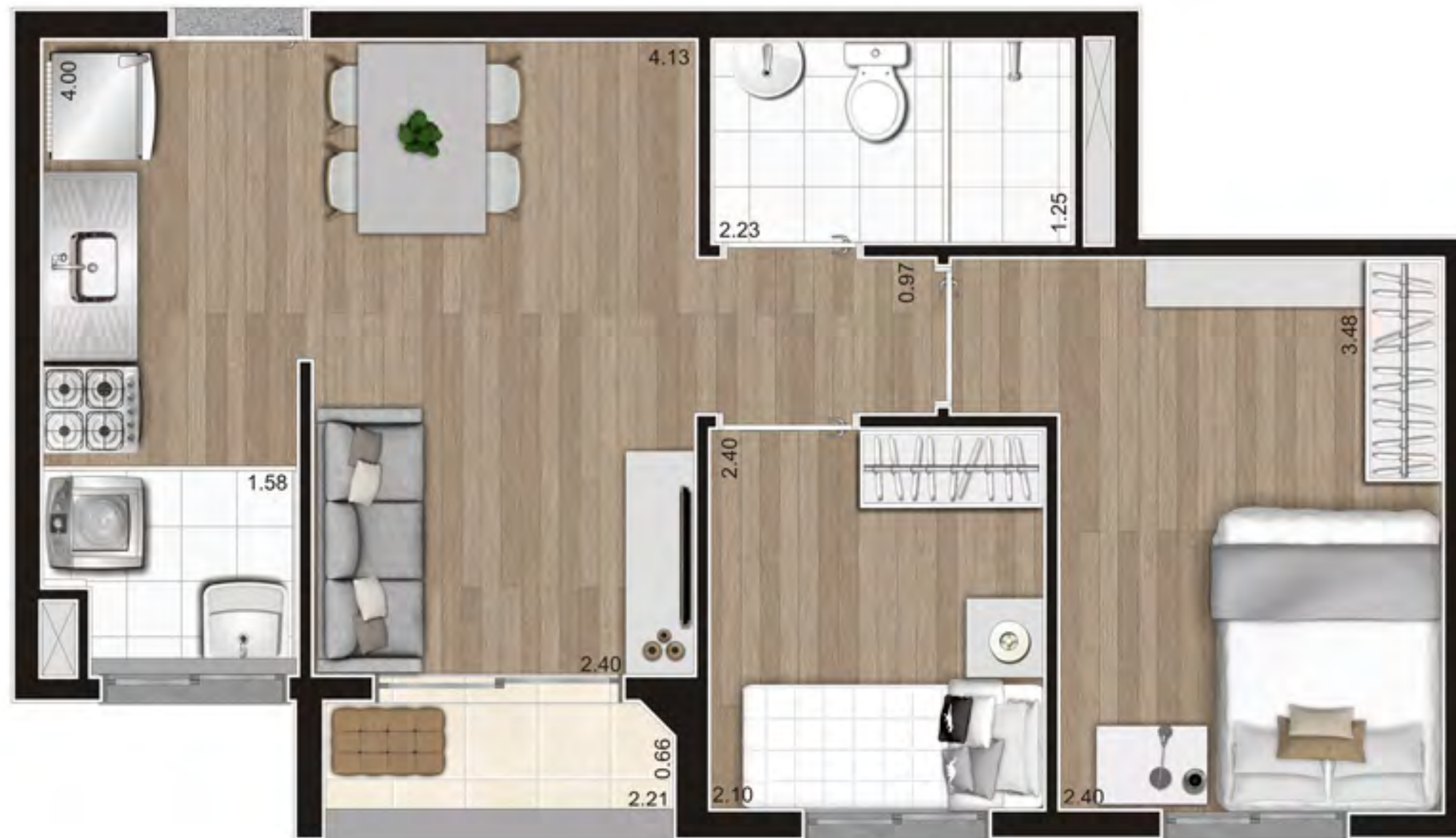
Perspectiva ilustrada preliminar

Planta ilustrativa preliminar de 43,00m 2 – Planta Tipo B Meio NR – Final 3 do pav. tipo da Torre A – com sugestão de decoração. Os móveis, objetos e equipamentos, assim como os materiais de acabamento apresentados na planta, têm dimensões comerciais e não são parte integrante do contrato.