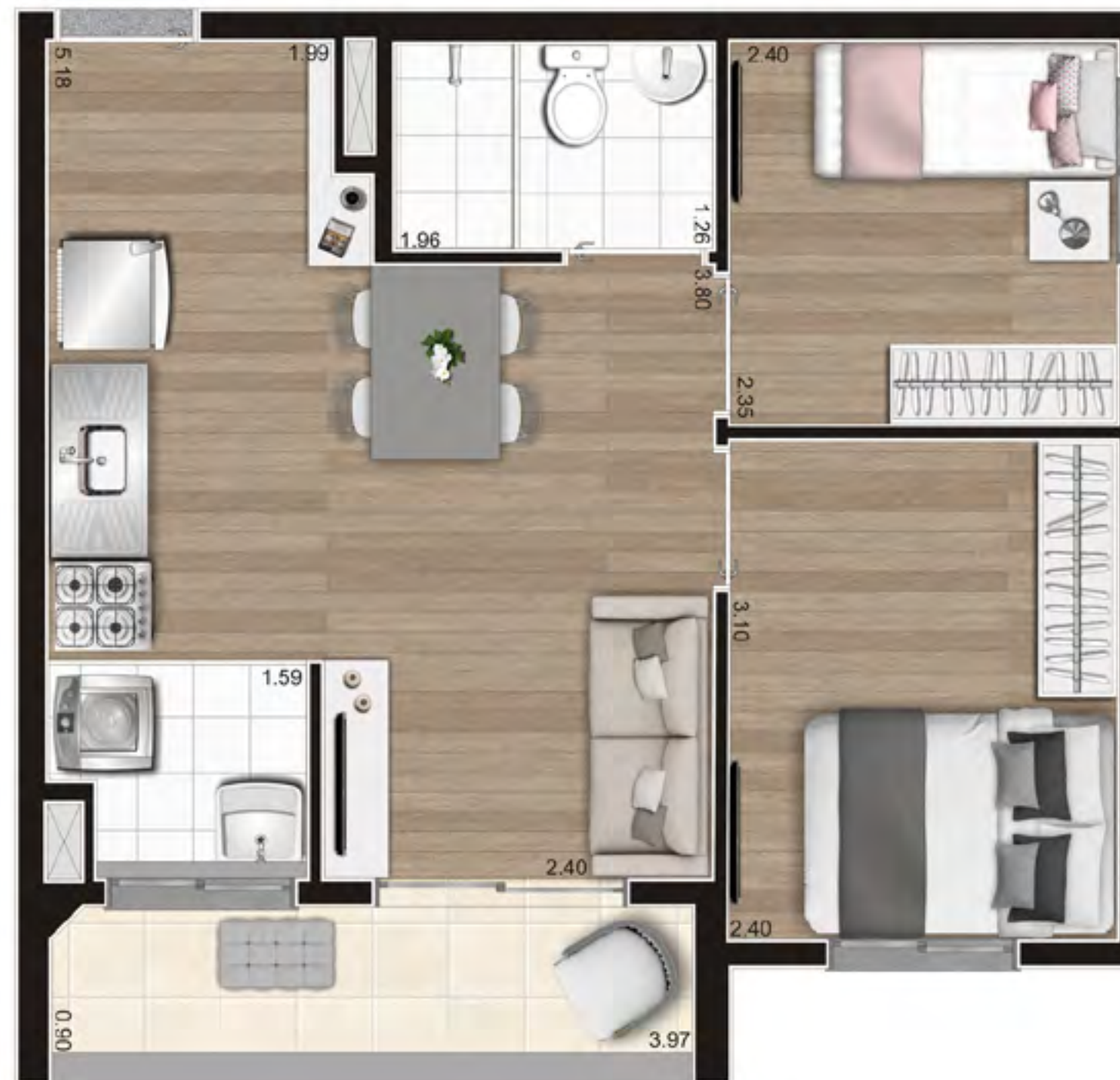
Perspectiva ilustrada preliminar

Planta ilustrativa preliminar de 43,25m 2 – Planta Tipo A Ponta NR – Final 2 do pav. tipo da Torre A – com sugestão de decoração. Os móveis, objetos e equipamentos, assim como os materiais de acabamento apresentados na planta, têm dimensões comerciais e não são parte integrante do contrato.