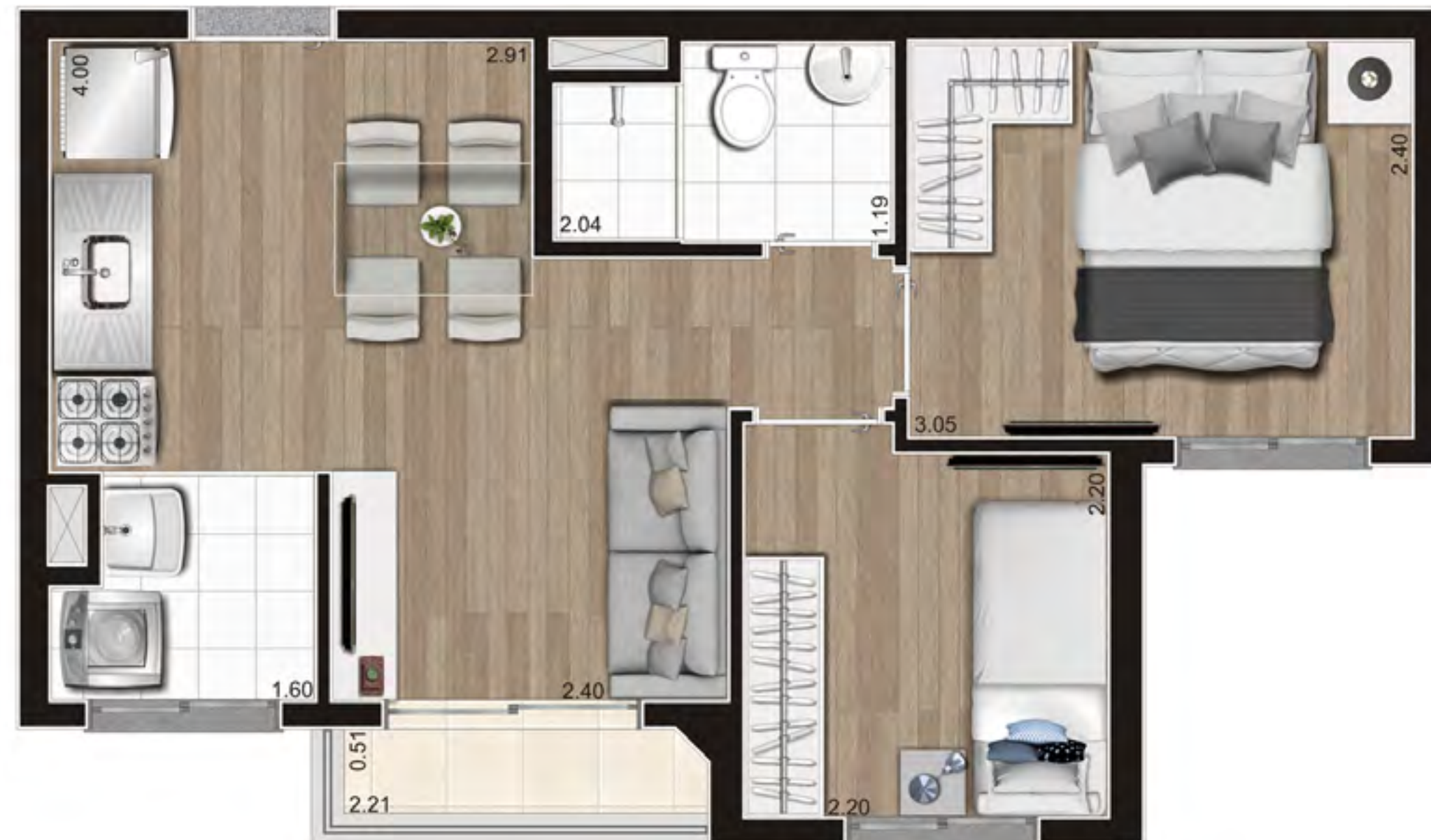
Perspectiva ilustrada preliminar

Planta ilustrativa preliminar de 37,43m 2 – Planta Tipo D Meio – Final 3 do pav. tipo da Torre A – com sugestão de decoração. Os móveis, objetos e equipamentos, assim como os materiais de acabamento apresentados na planta, têm dimensões comerciais e não são parte integrante do contrato.