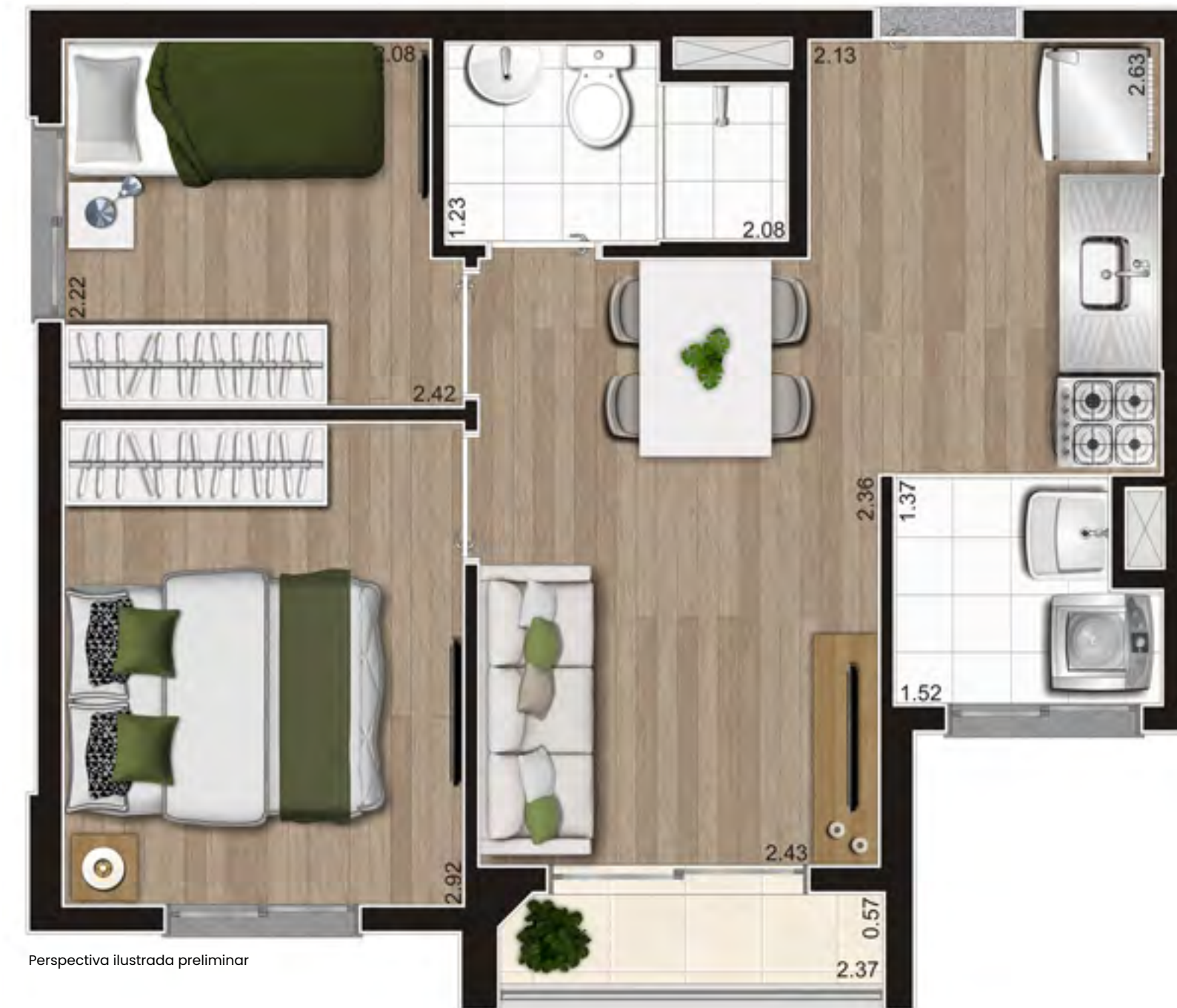
Perspectiva ilustrada preliminar