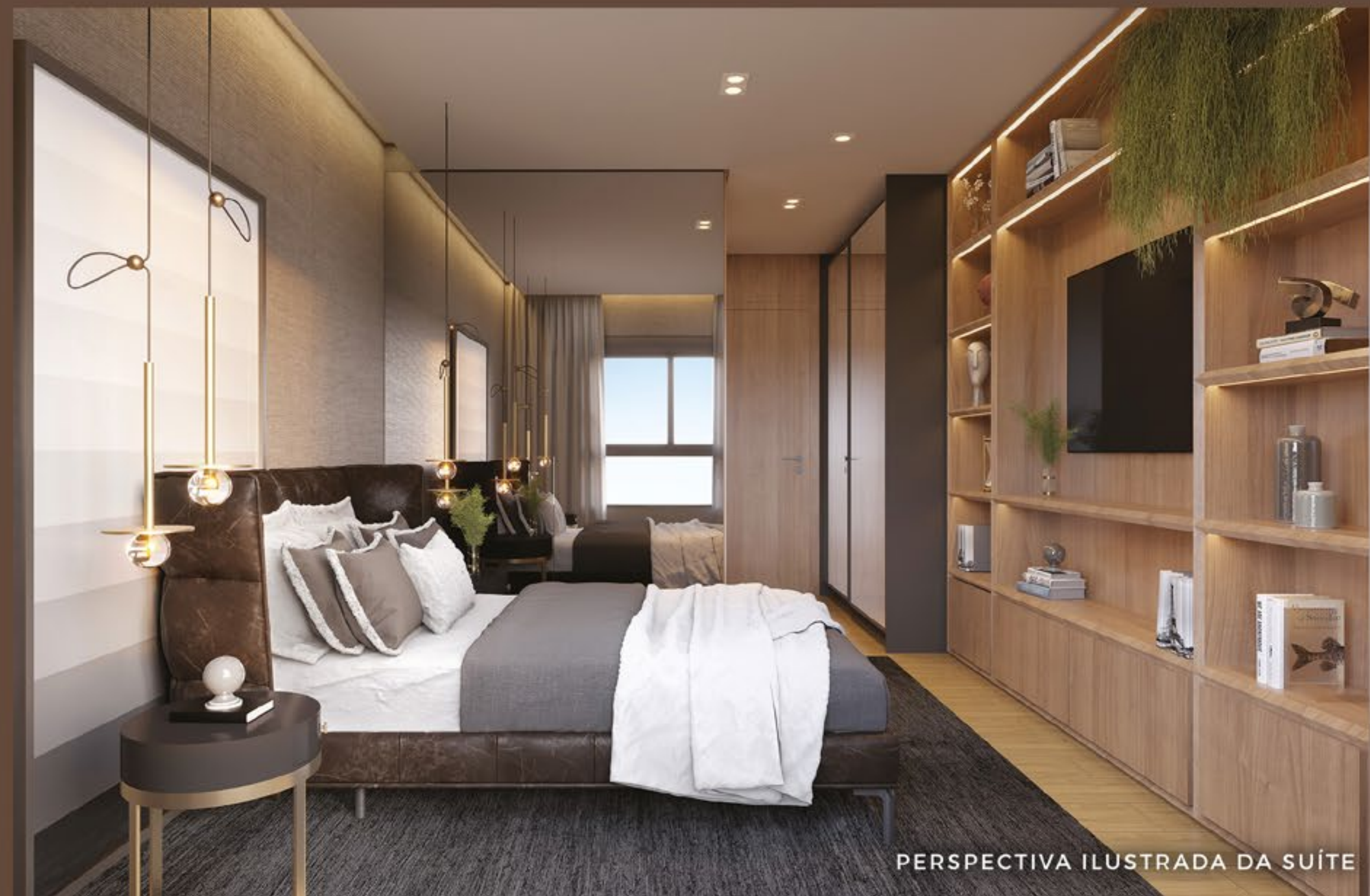
Ilustração artística da planta decorado do apartamento tipo de 94 m 2 . Móveis, utensílios e objetos de decoração são apenas sugestivos e não fazem parte do Contrato e Memorial Descritivo. Medidas de face a face das paredes, que poderão sofrer alterações.