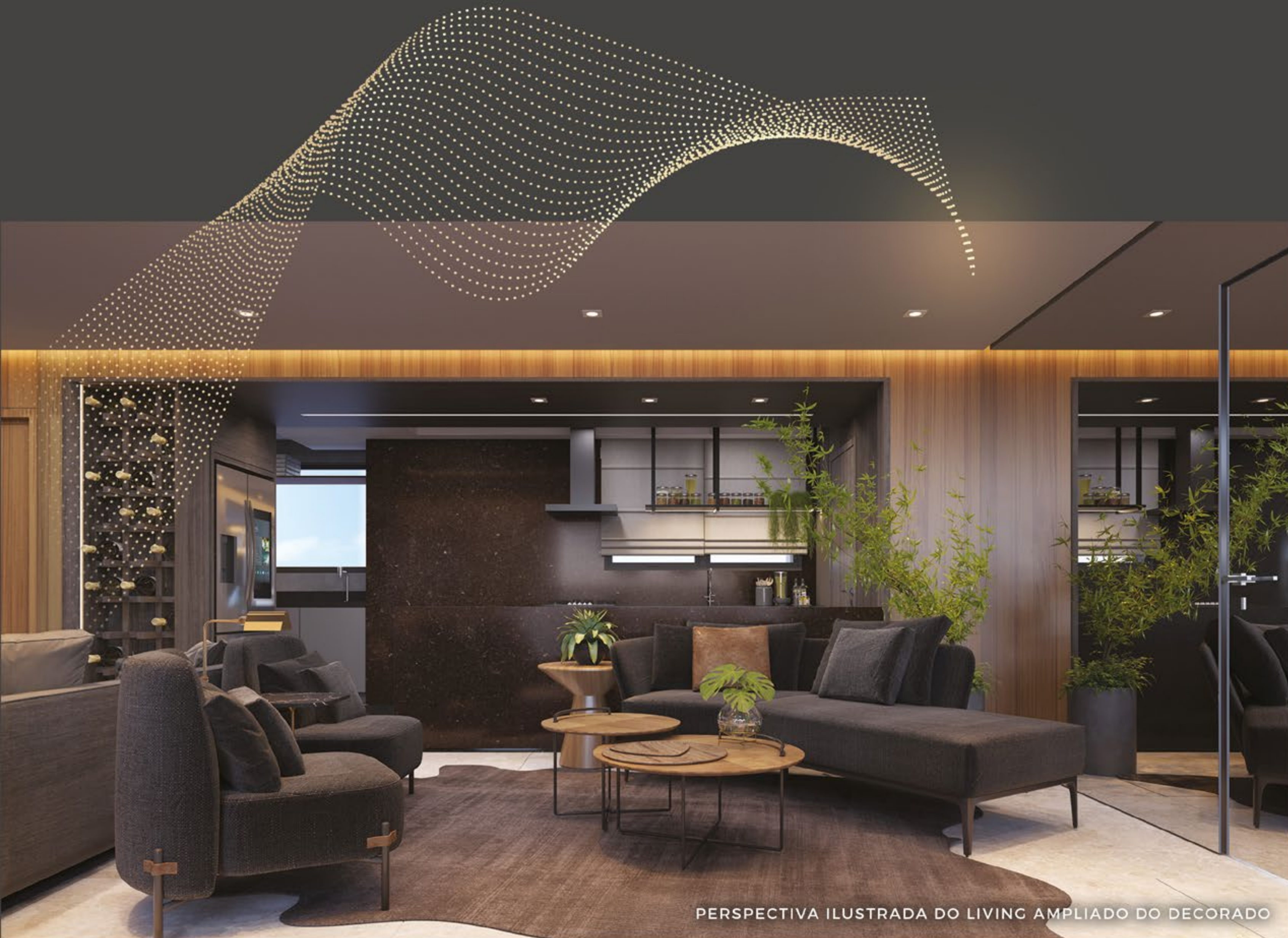
PERSPECTIVA ILUSTRADA DO LIVING AMPLIADO DO DECORADO