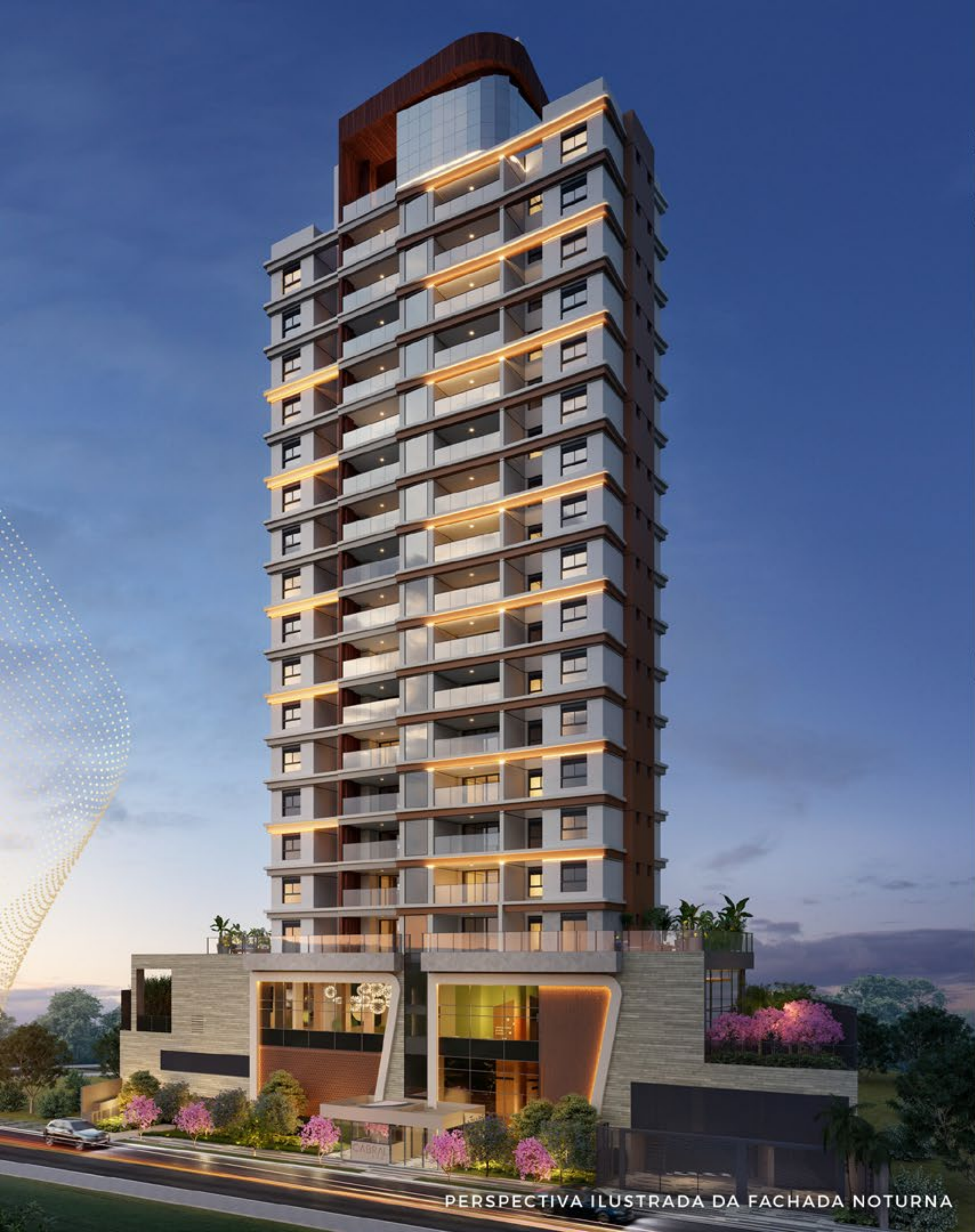
PERSPECTIVA ILUSTRADA DA FACHADA NOTURNA