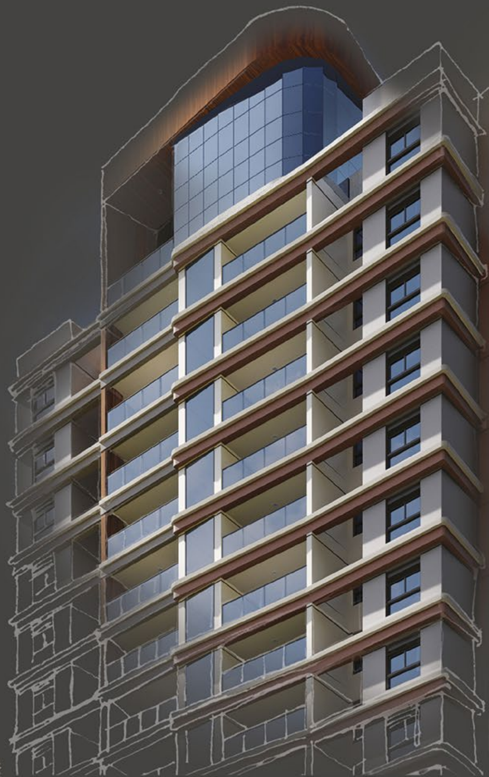
ILUSTRAÇÃO DA FACHADA

Na definição de Vilanova Artigas, arquiteto, urbanista e idealizador do movimento arquitetônico conhecido como Escola Paulista, a casa é a “sede” do espaço humano e base para novas conquistas, numa ação que amplia a habitação e a estende pela cidade.