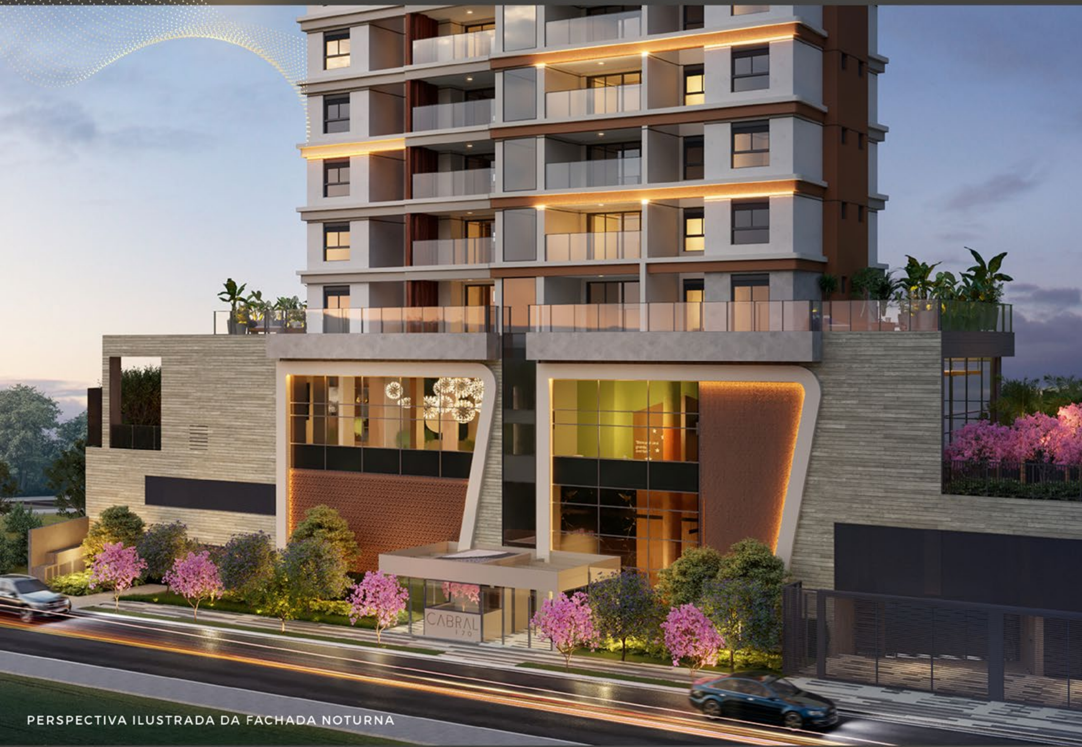
PERSPECTIVA ILUSTRADA DA FACHADA NOTURNA

CONHEÇA O PROJETO COM ARQUITETURA DE MARCANTE PERSONALIDADE.