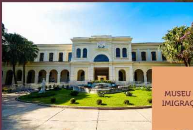
MUSEU DA IMIGRAÇÃO