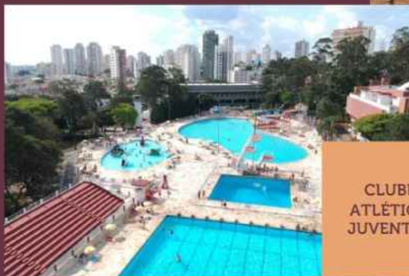
CLUBE ATLÉTICO JUVENTUS