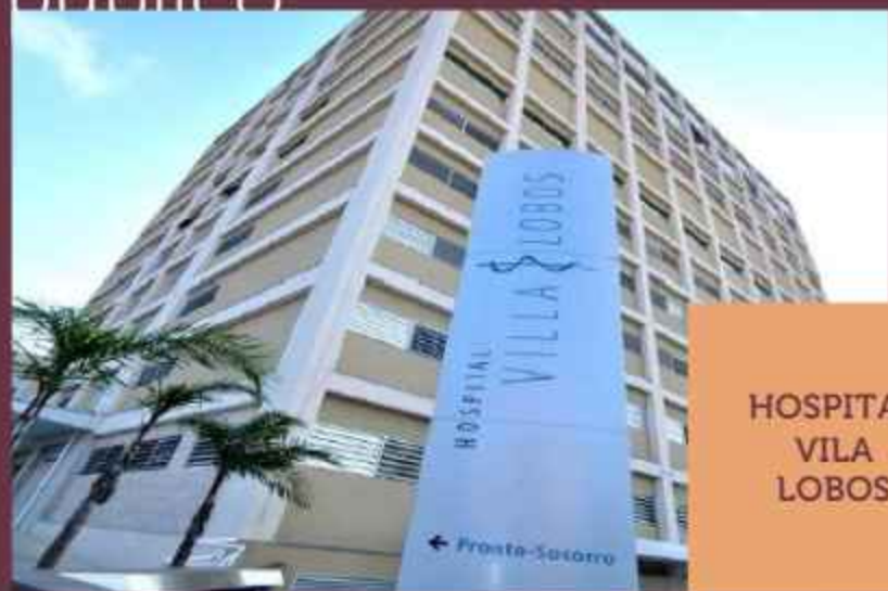
HOSPITAL VILA LOBOS