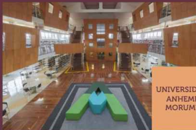
UNIVERSIDADE ANHEMBI MORUMBI