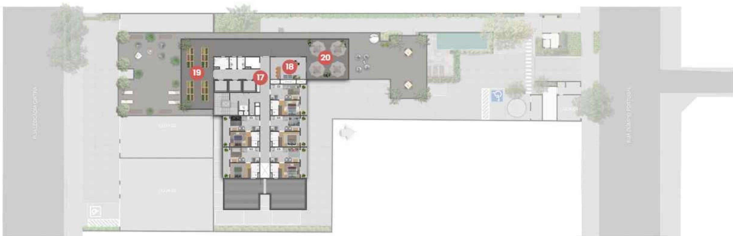
Planta 14º PAVIMENTO