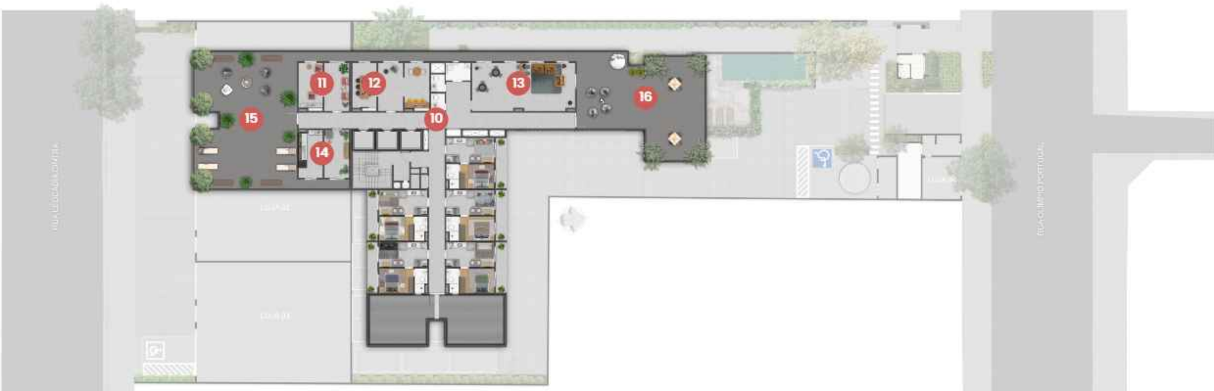
Planta 13º PAVIMENTO