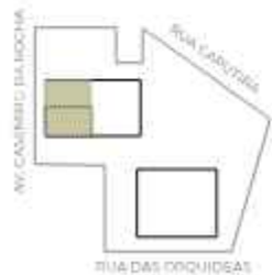
PLANTA REFERENTE AO FINAL 03