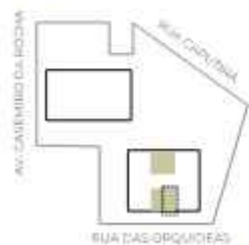
PLANTA REFERENTE AO FINAL 06

Janela em alumínio com bandeira inferior e persiana integrada. *motorização pelo ID Tarjab