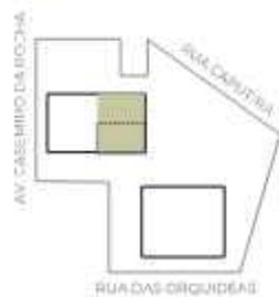
PLANTA REFERENTE AO FINAL 02.