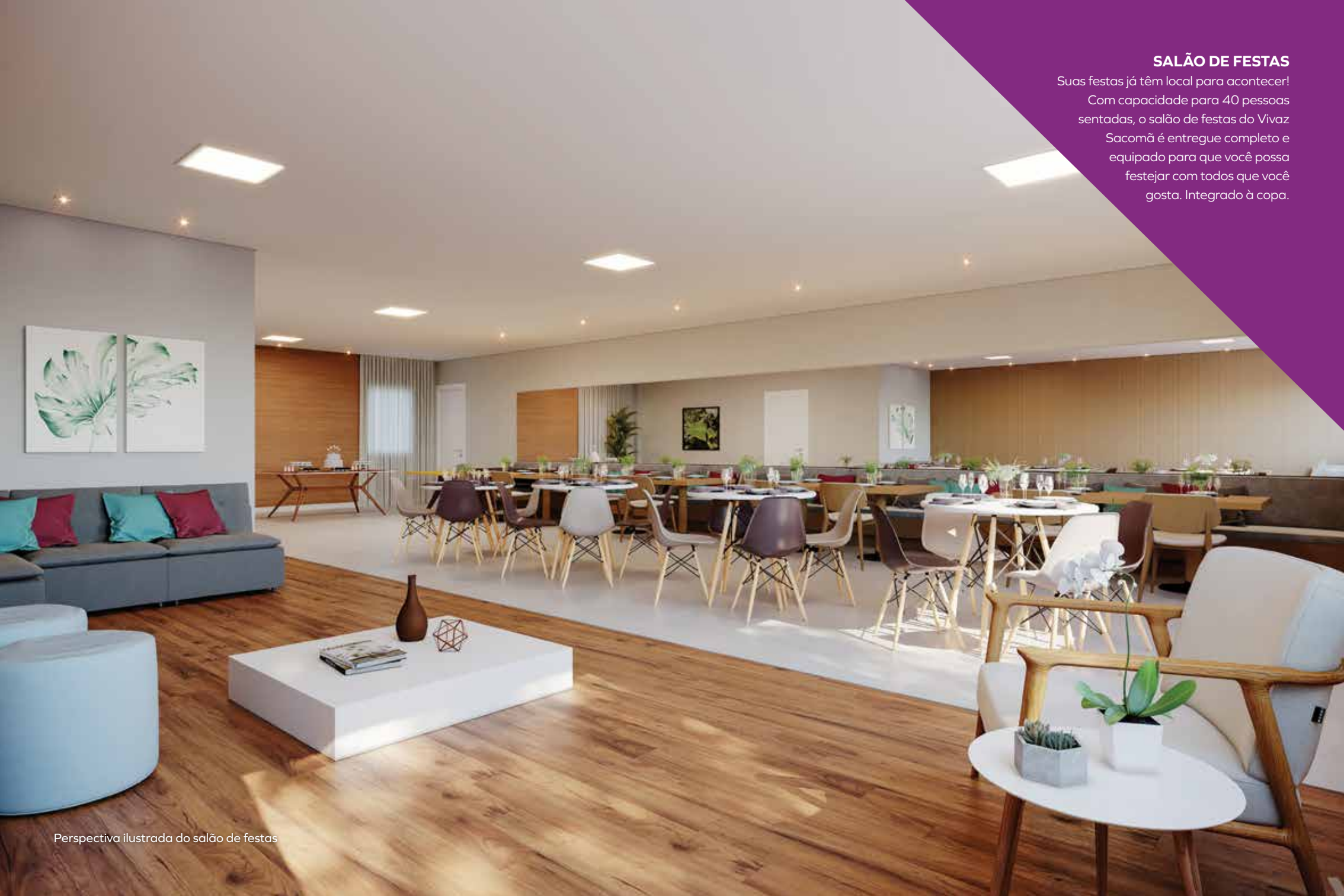
Perspectiva ilustrada do salão de festas

Suas festas já têm local para acontecer! Com capacidade para 40 pessoas sentadas, o salão de festas do Vivaz Sacomã é entregue completo e equipado para que você possa festejar com todos que você gosta. Integrado à copa.