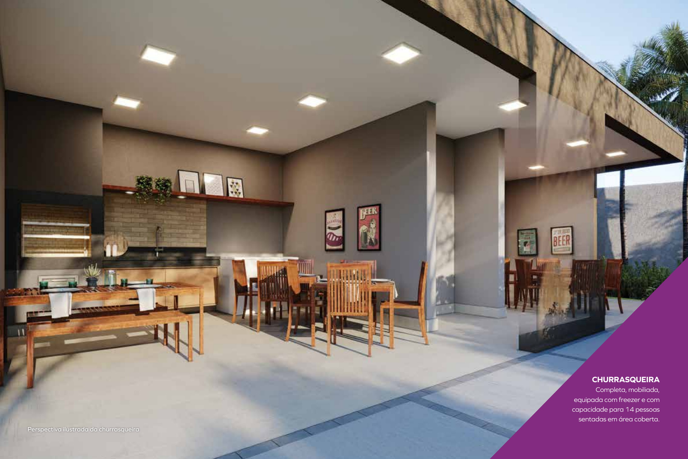
Perspectiva ilustrada da churrasqueira