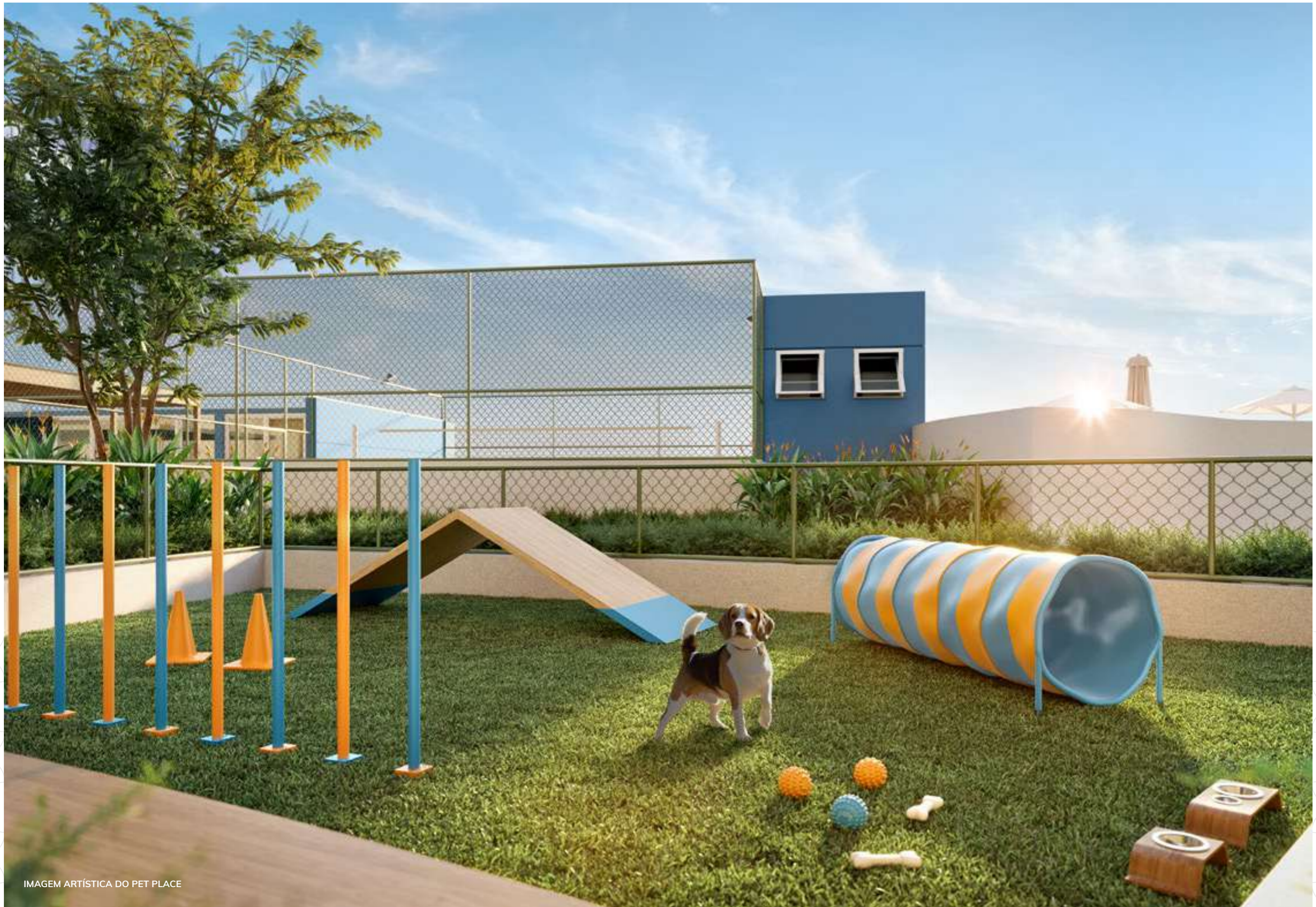
IMAGEM ARTÍSTICA DO PET PLACE