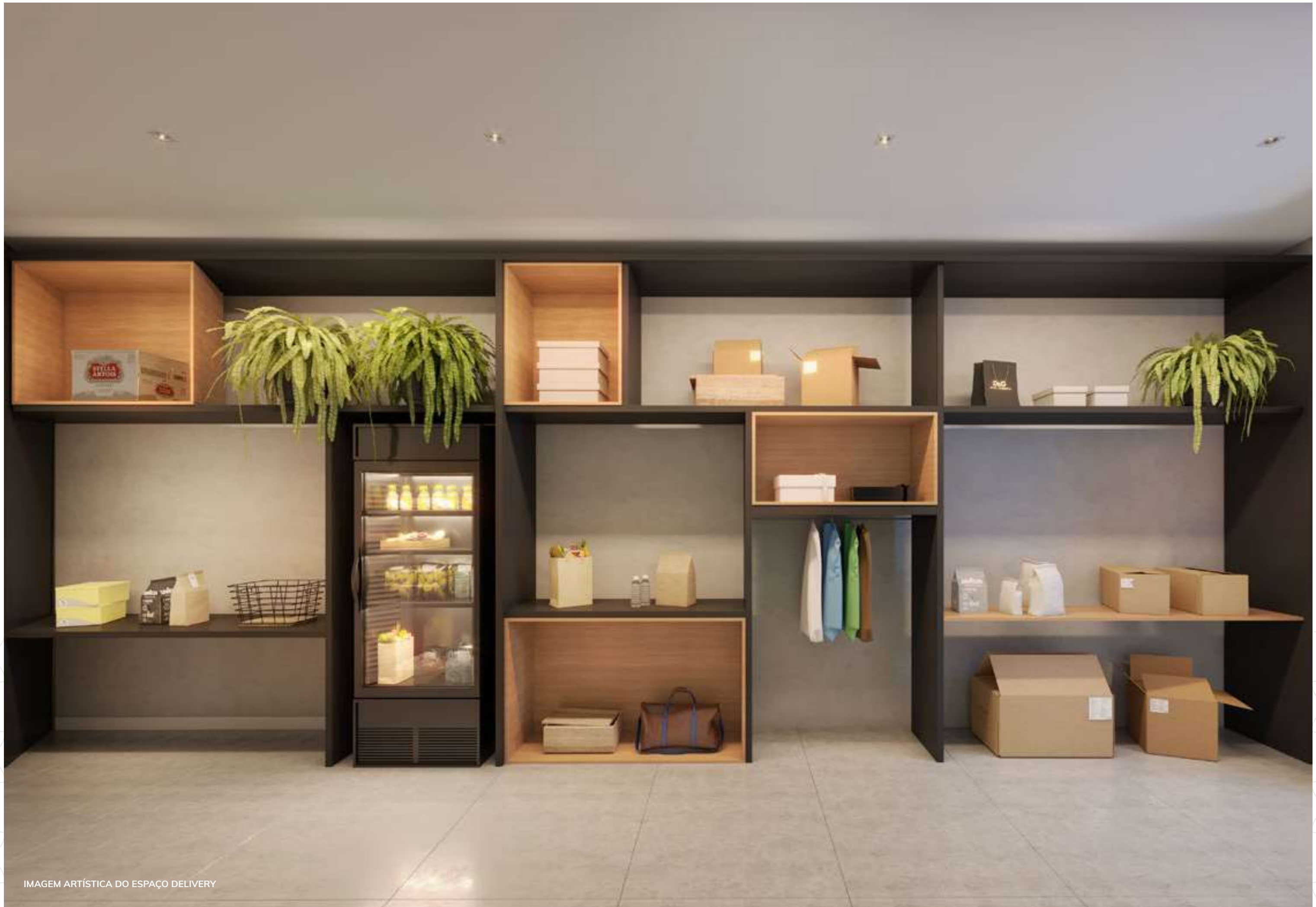
IMAGEM ARTÍSTICA DO ESPAÇO DELIVERY