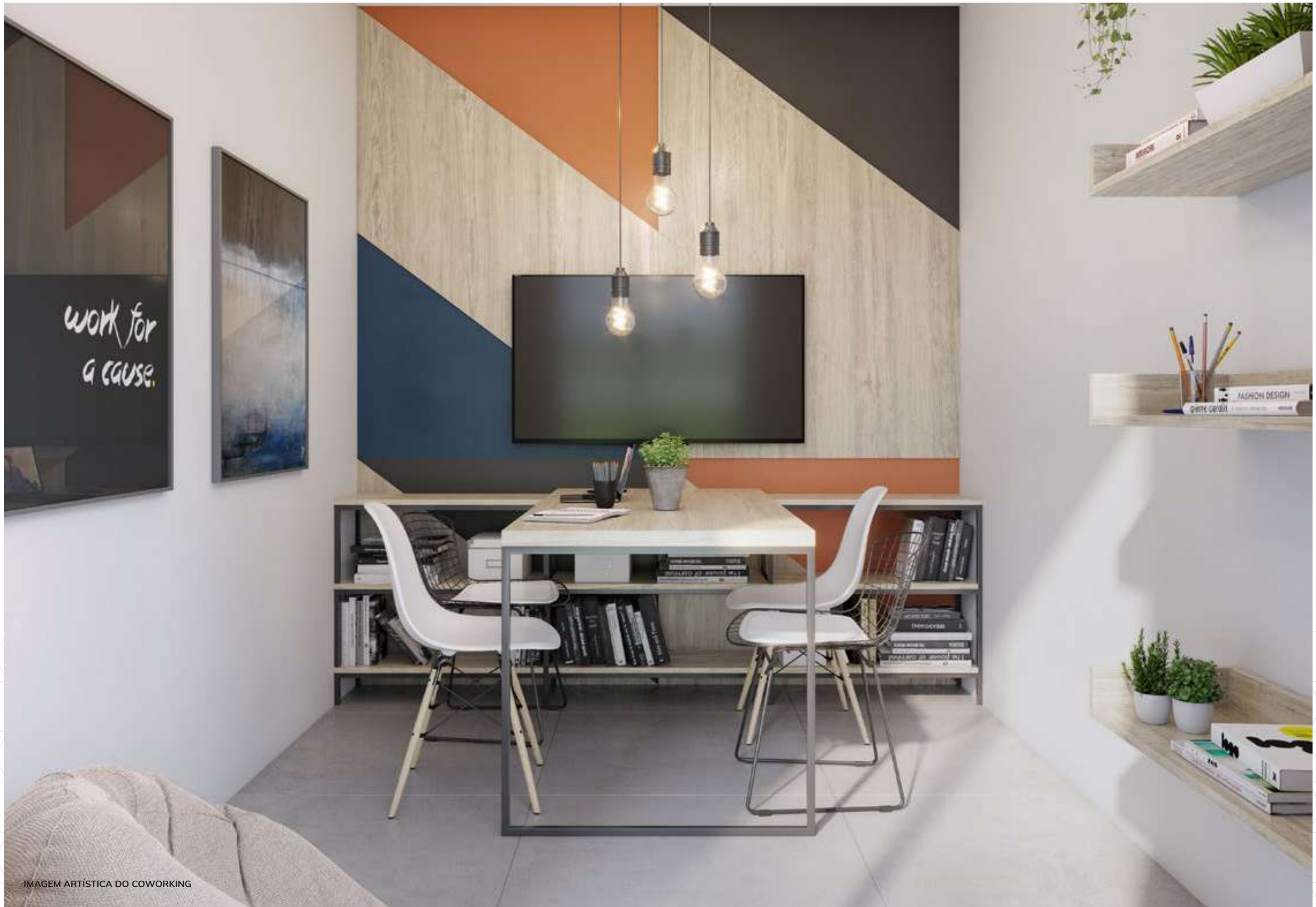
IMAGEM ARTÍSTICA DO COWORKING