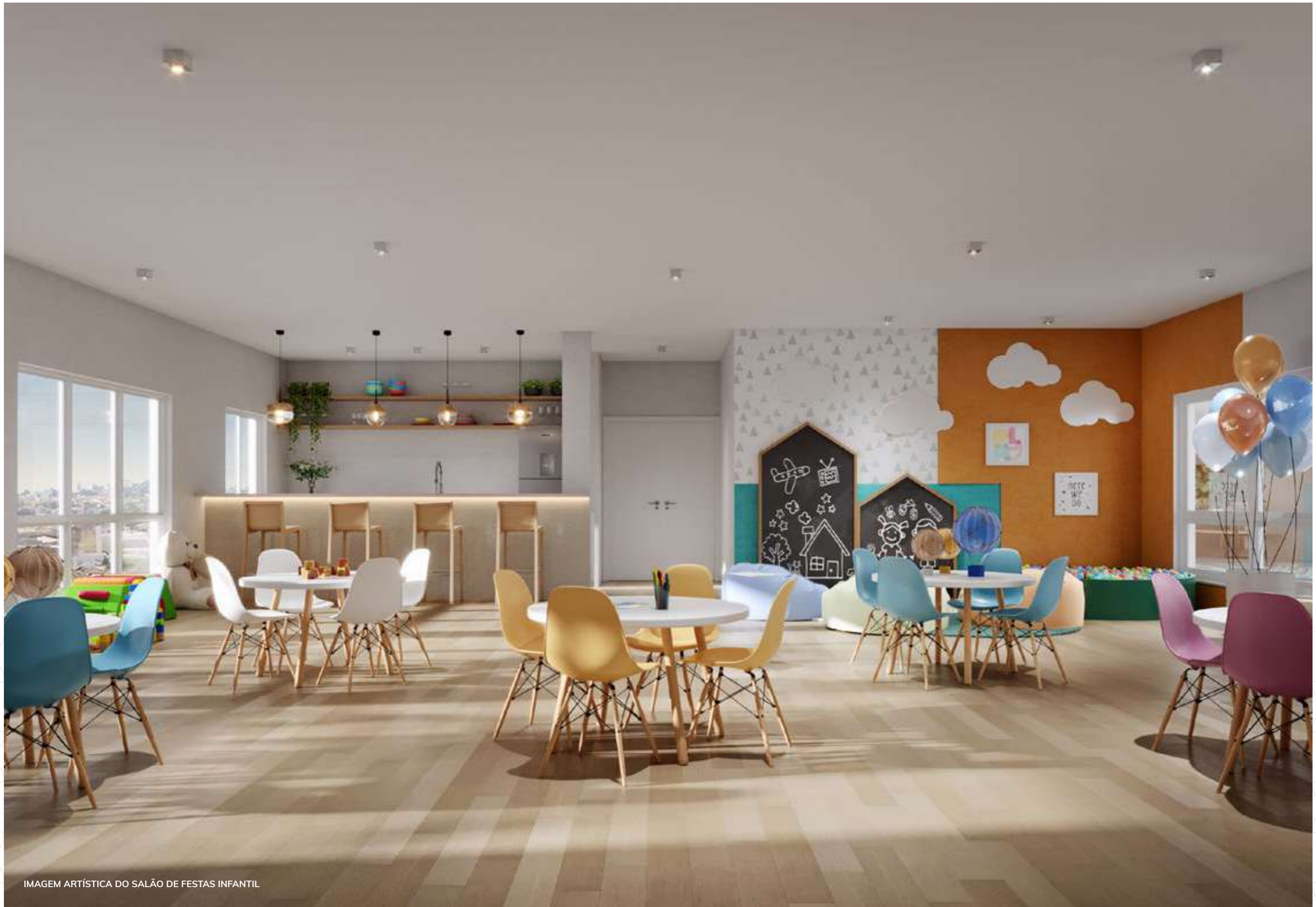
IMAGEM ARTÍSTICA DO SALÃO DE FESTAS INFANTIL