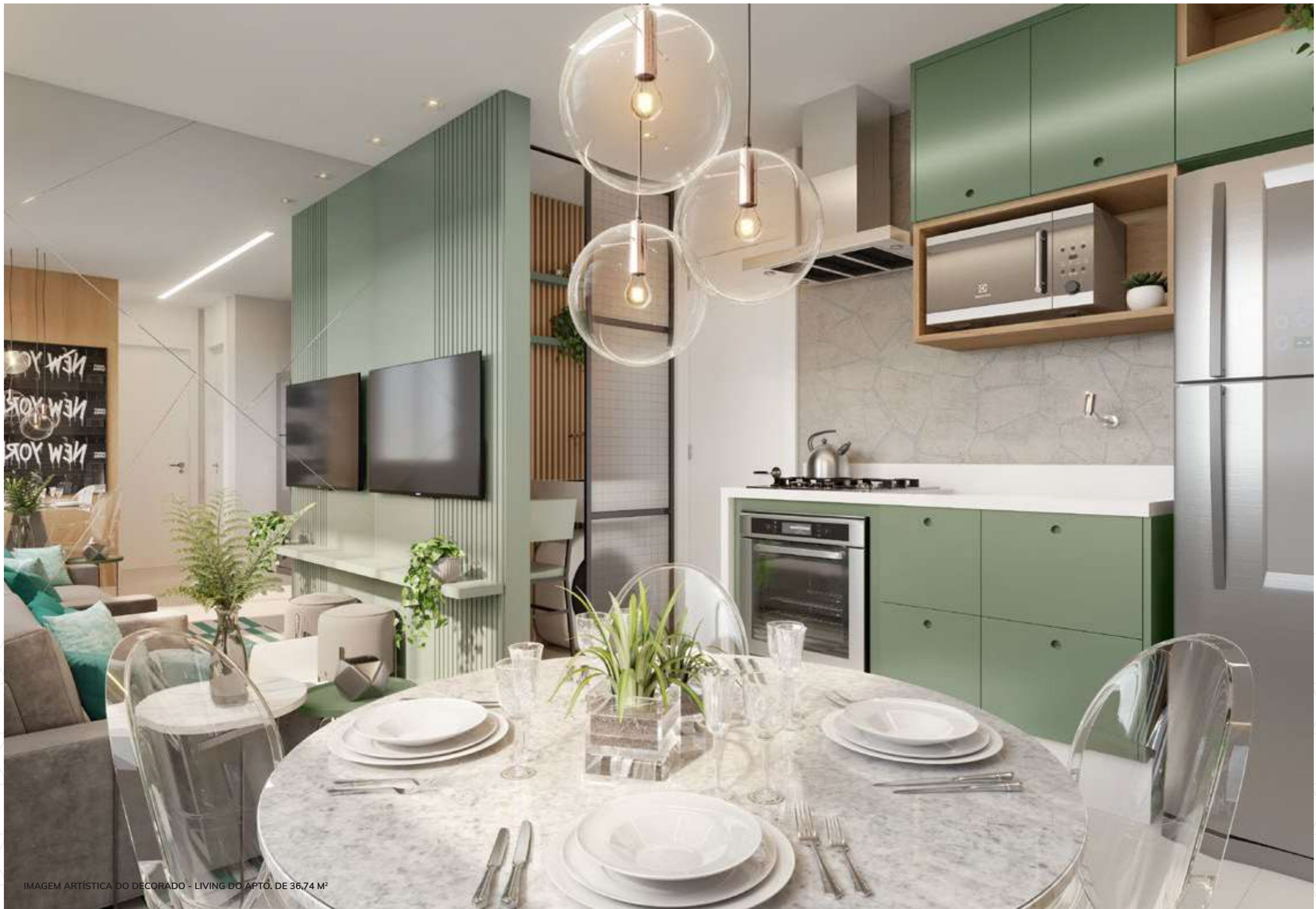
IMAGEM ARTÍSTICA DO DECORADO - LIVING DO APTO. DE 36,74 M 2