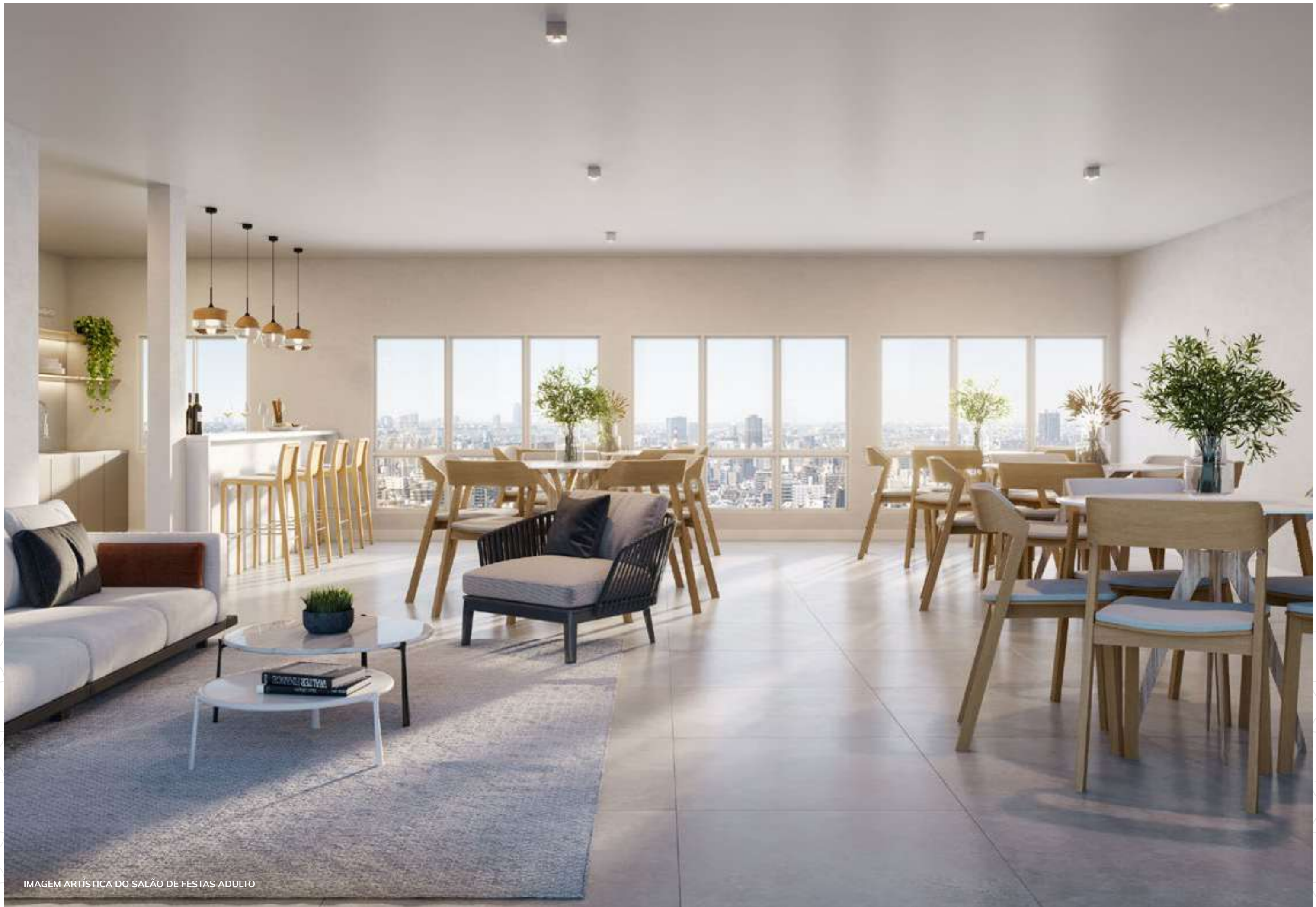
IMAGEM ARTÍSTICA DO SALÃO DE FESTAS ADULTO