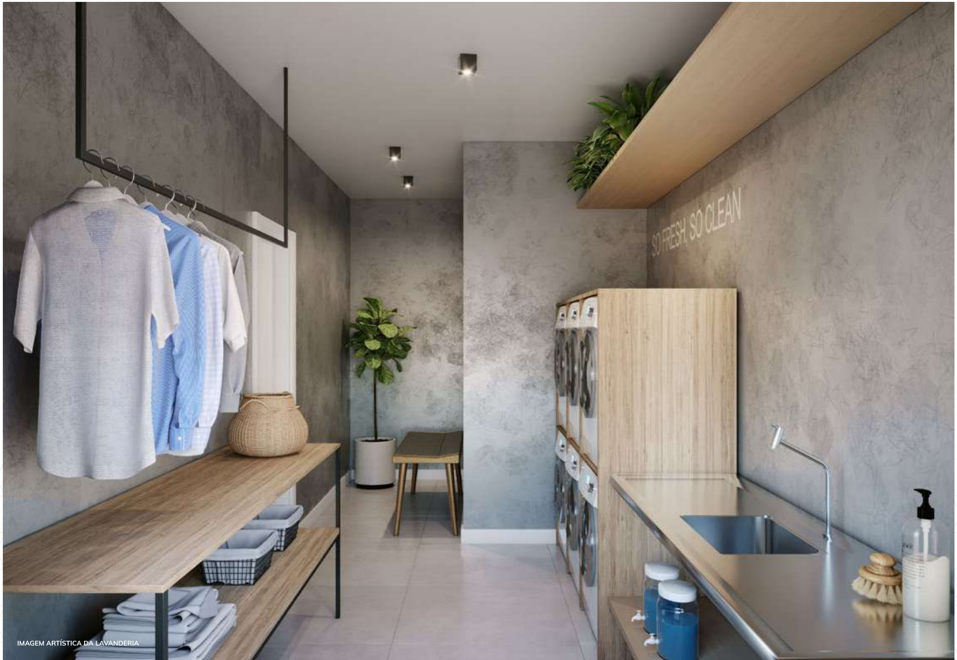
IMAGEM ARTÍSTICA DA LAVANDERIA