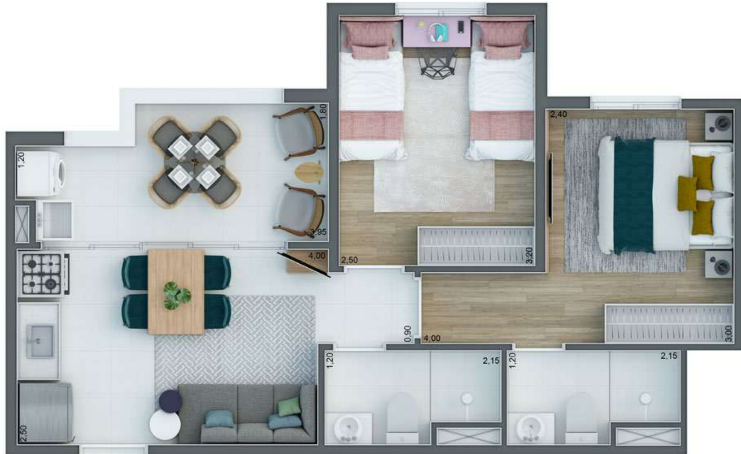
Planta Ilustrada do apartamento de 44,26 m 2 privativos, finais 3 e 5. Térreo ao 20º pavimento referente as torres 4, 5, 6 e 7, com sugestão de Decoração.