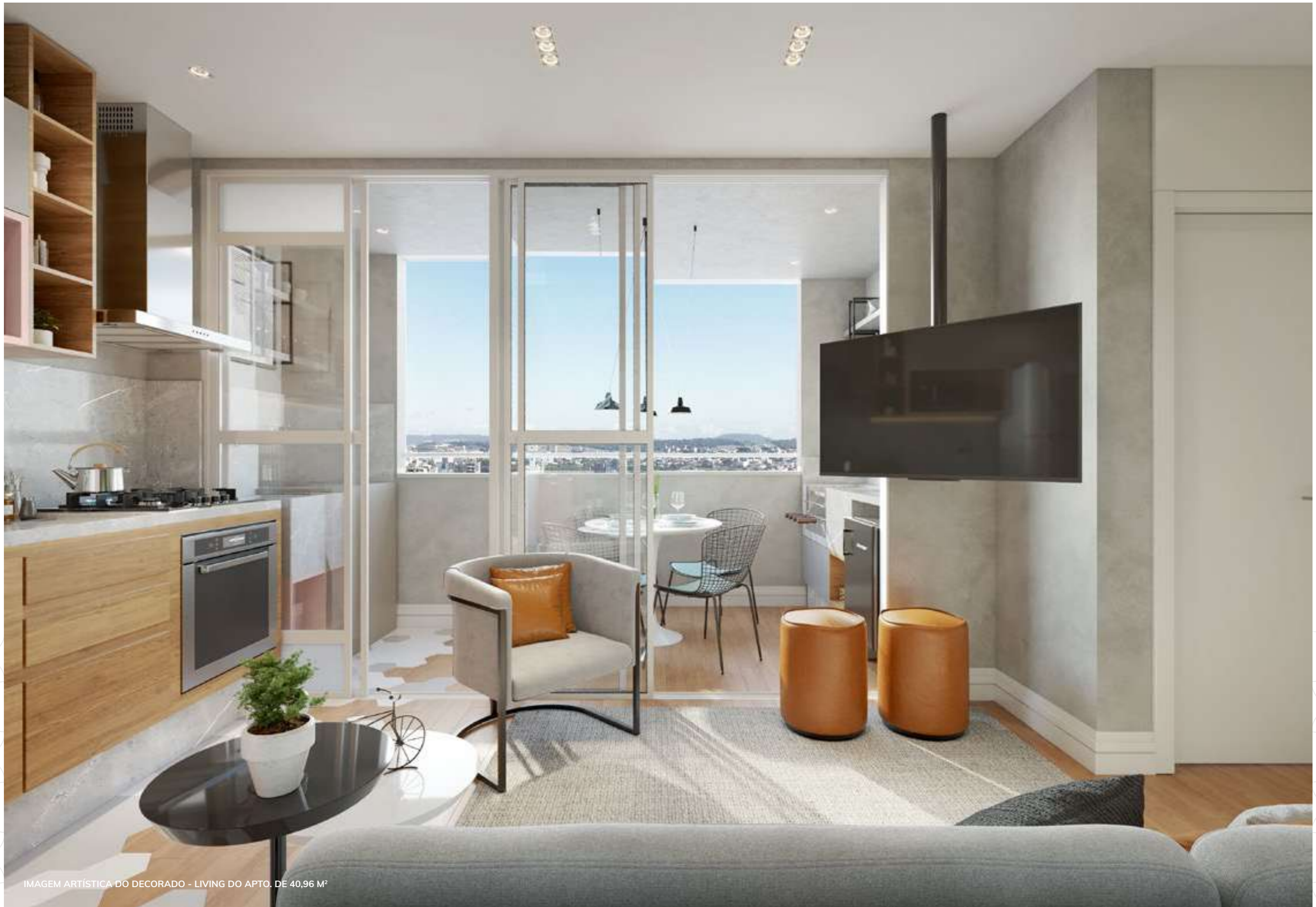
IMAGEM ARTÍSTICA DO DECORADO - LIVING DO APTO. DE 40,96 M 2