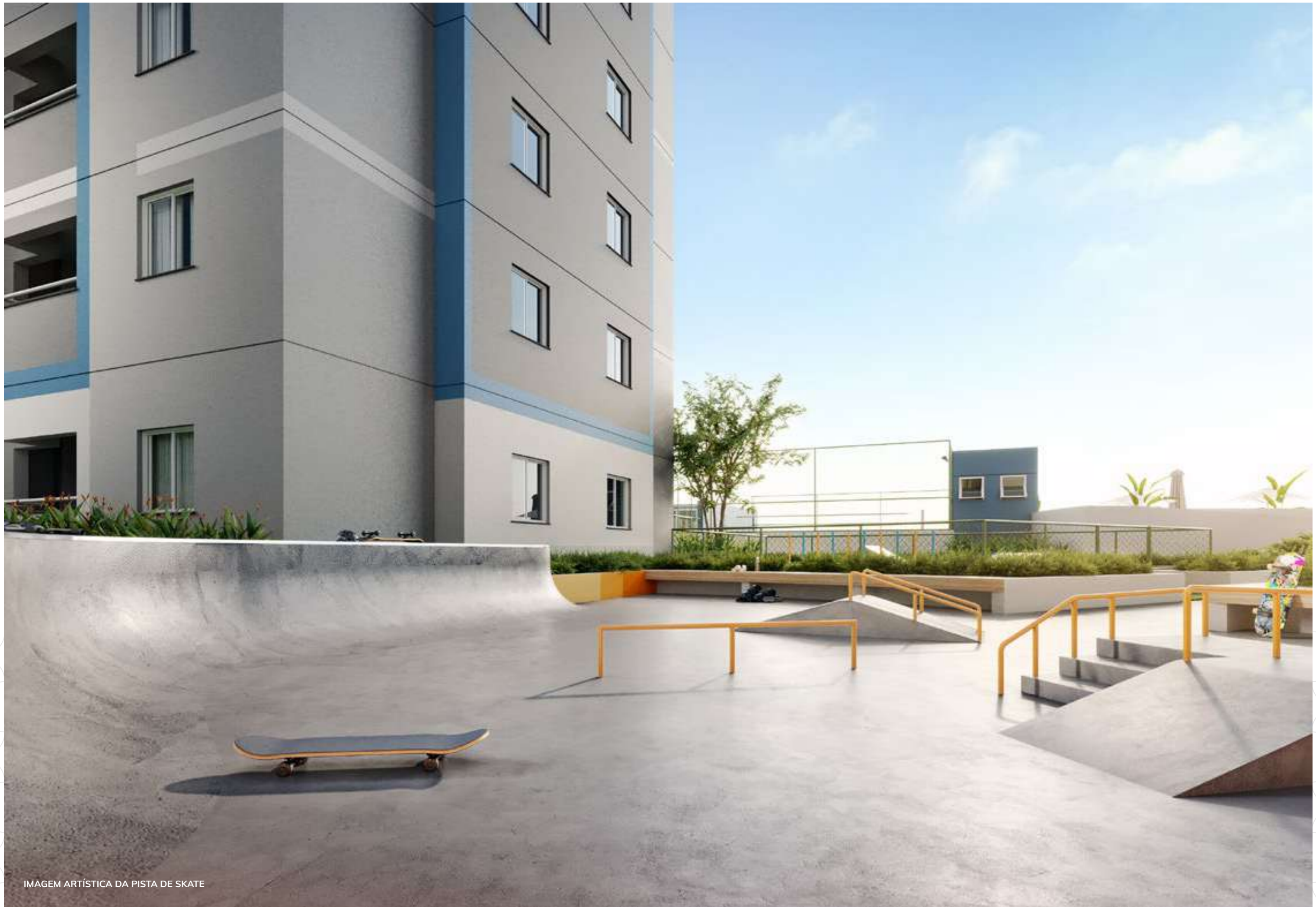
IMAGEM ARTÍSTICA DA PISTA DE SKATE