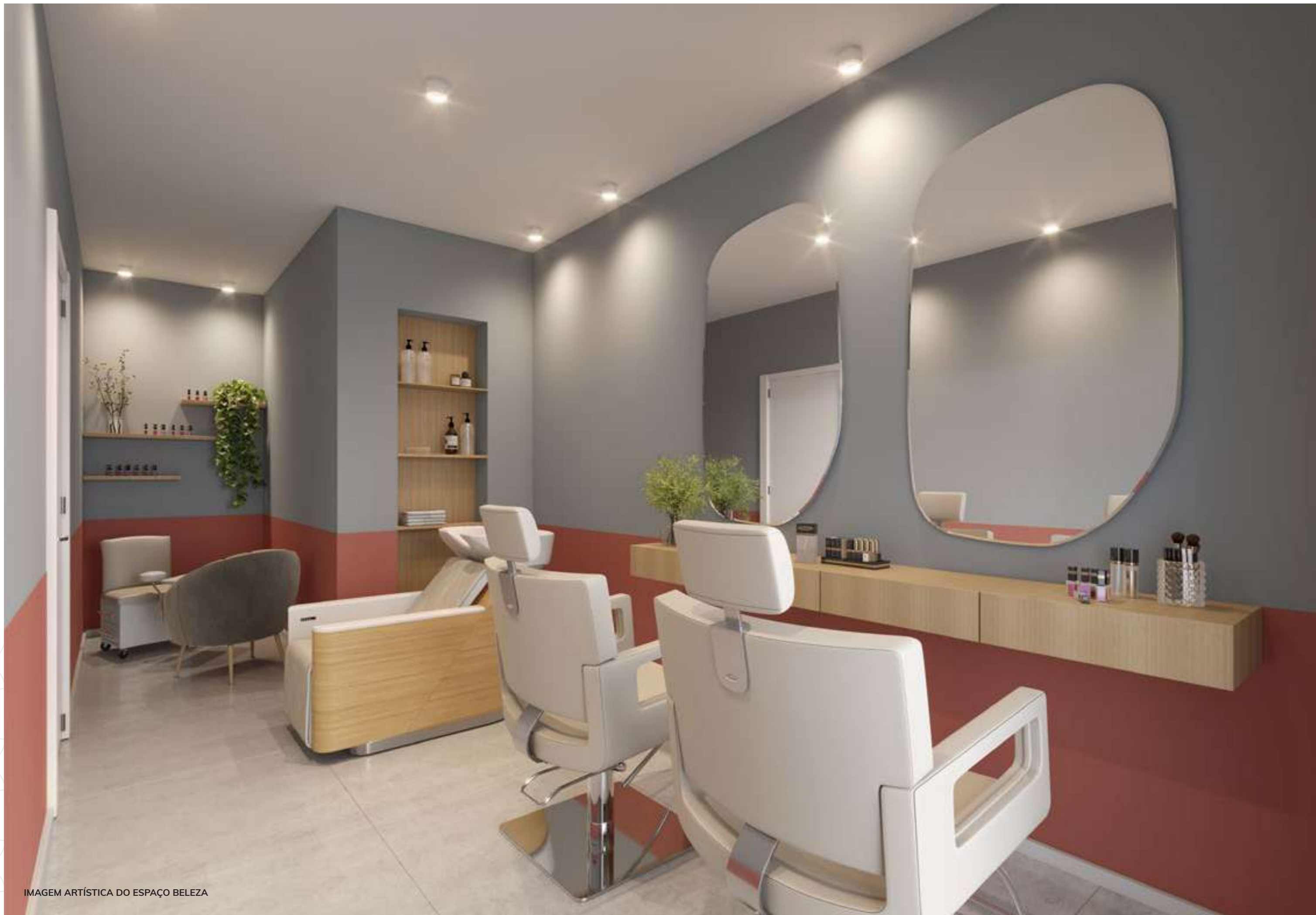
IMAGEM ARTÍSTICA DO ESPAÇO BELEZA