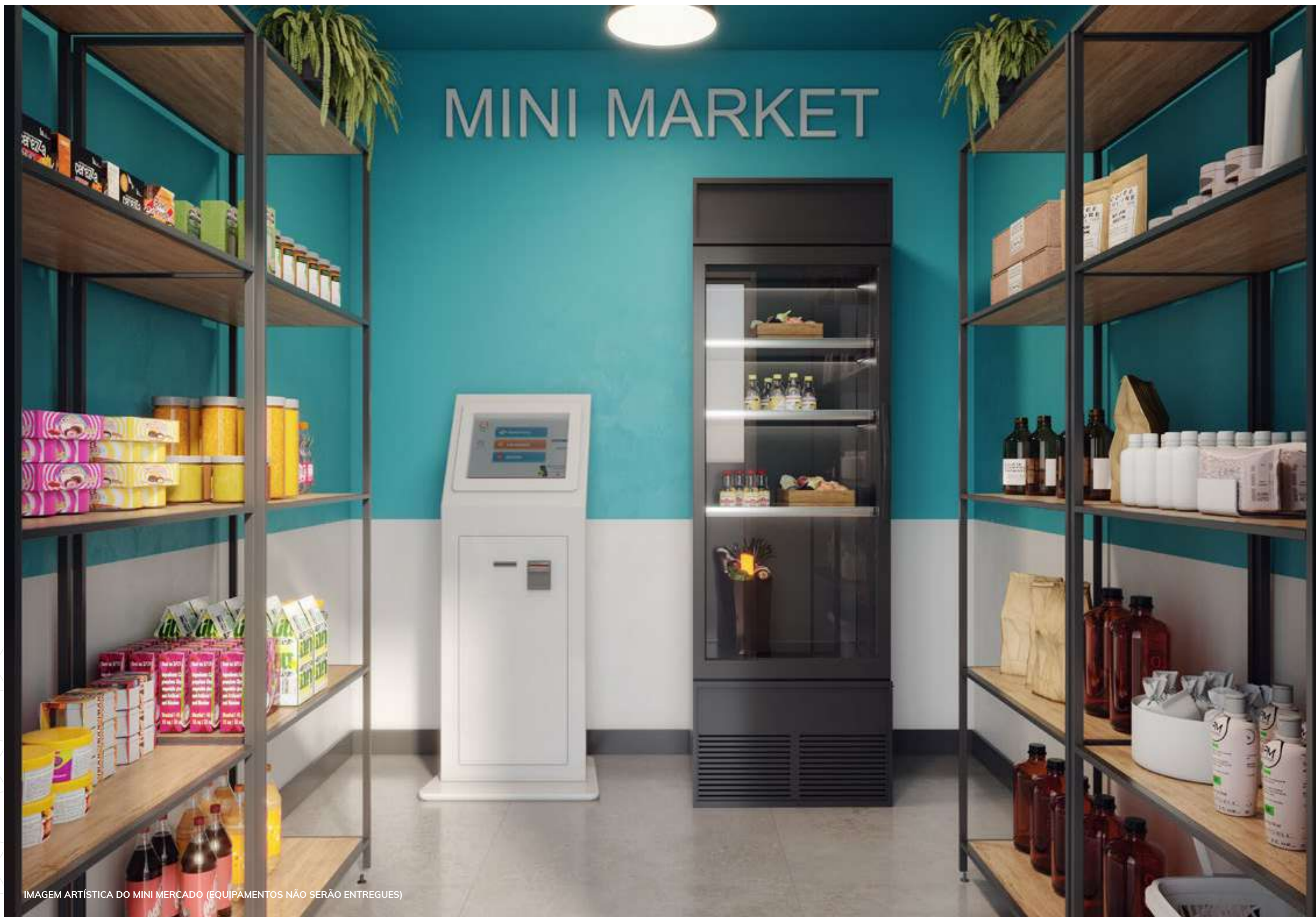
IMAGEM ARTÍSTICA DO MINI MERCADO (EQUIPAMENTOS NÃO SERÃO ENTREGUES)