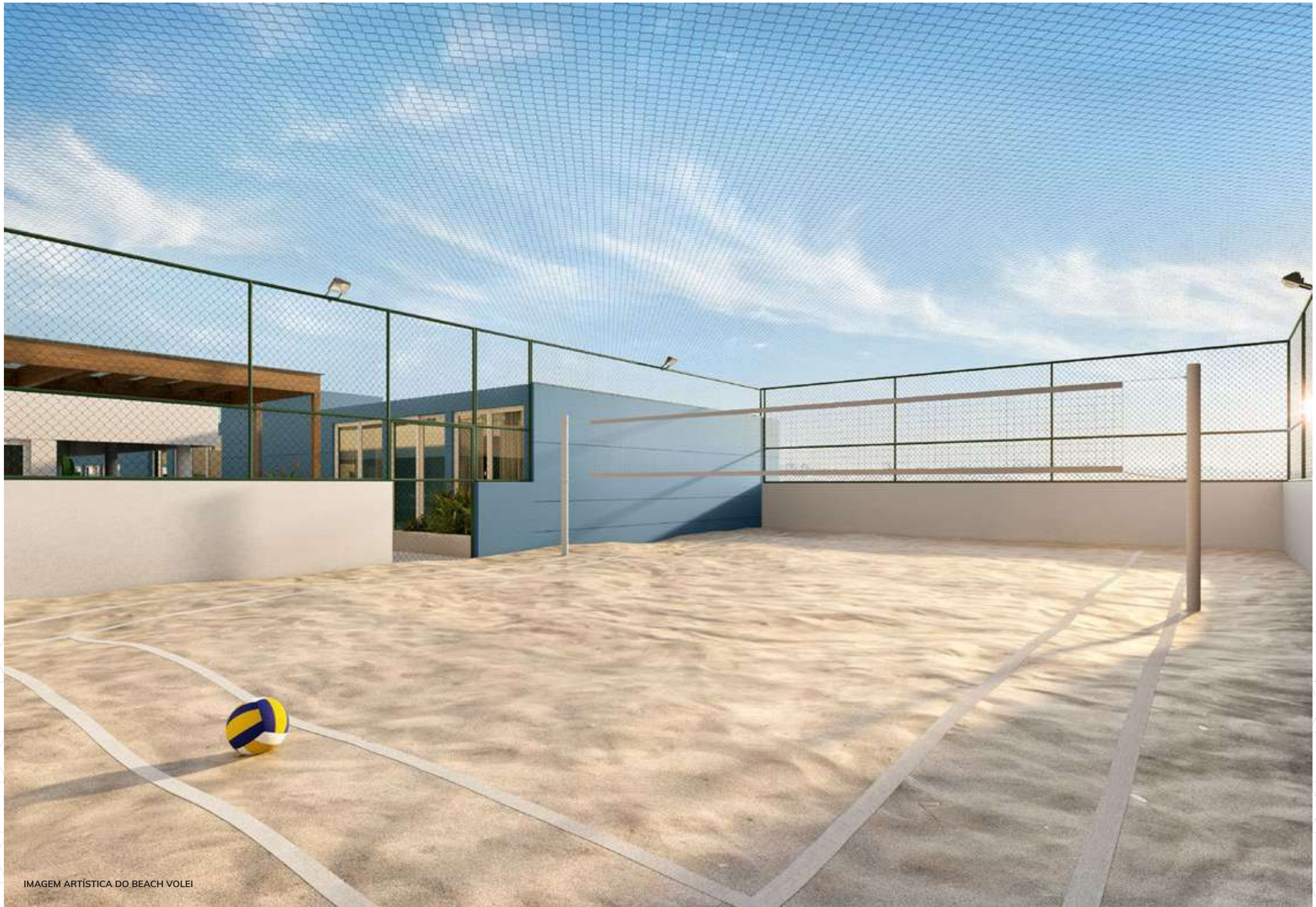
IMAGEM ARTÍSTICA DO BEACH VOLEI