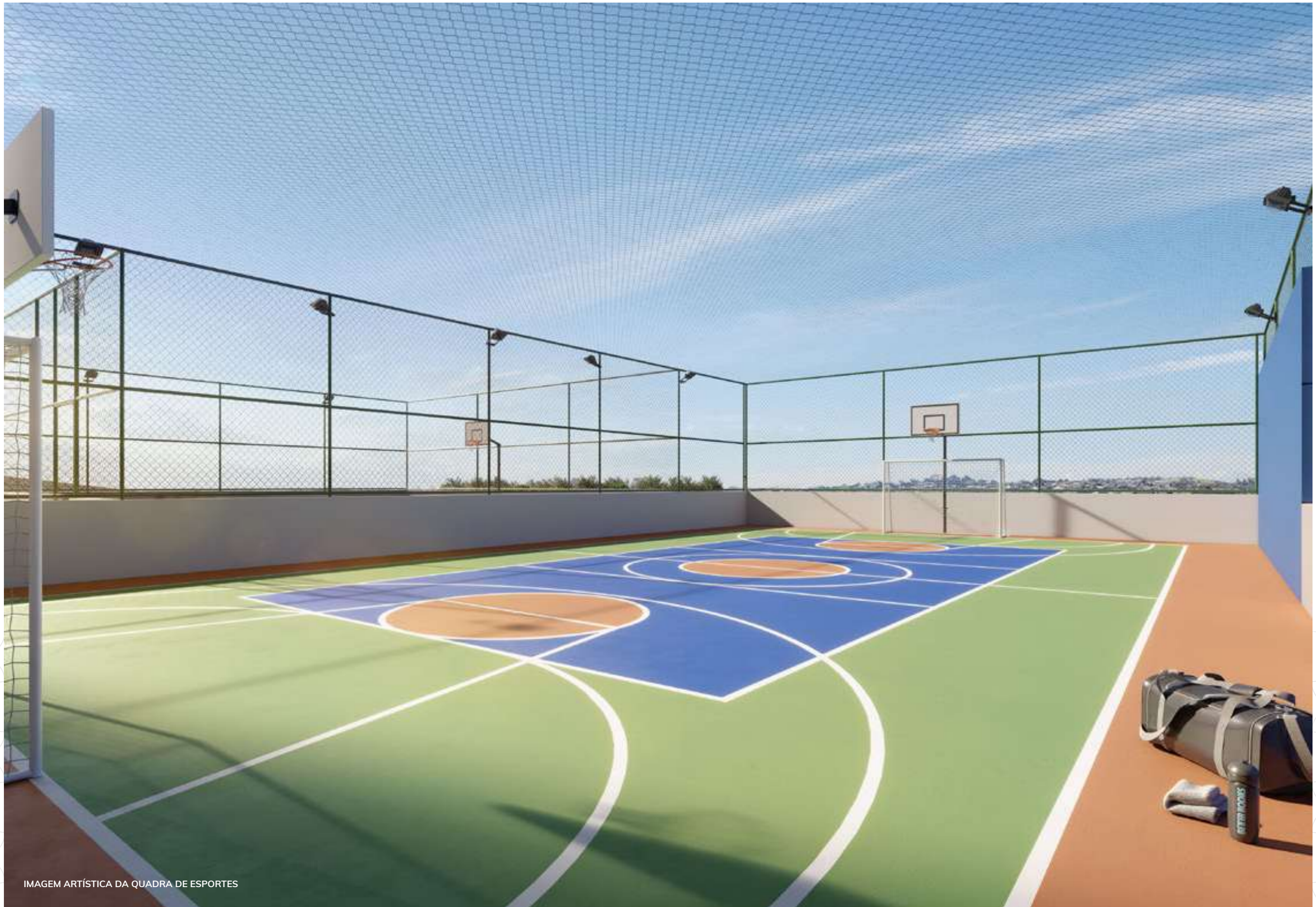
IMAGEM ARTÍSTICA DA QUADRA DE ESPORTES