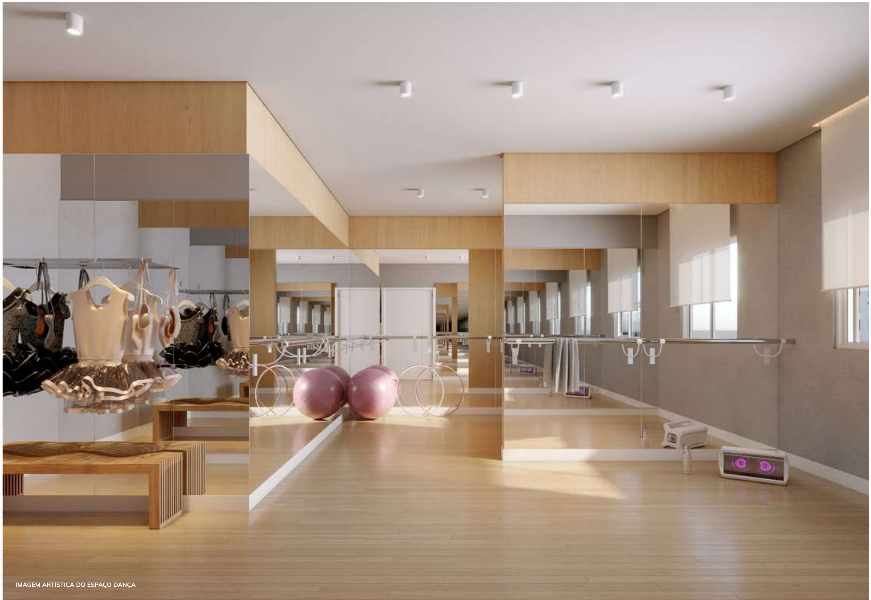
IMAGEM ARTÍSTICA DO ESPAÇO DANÇA