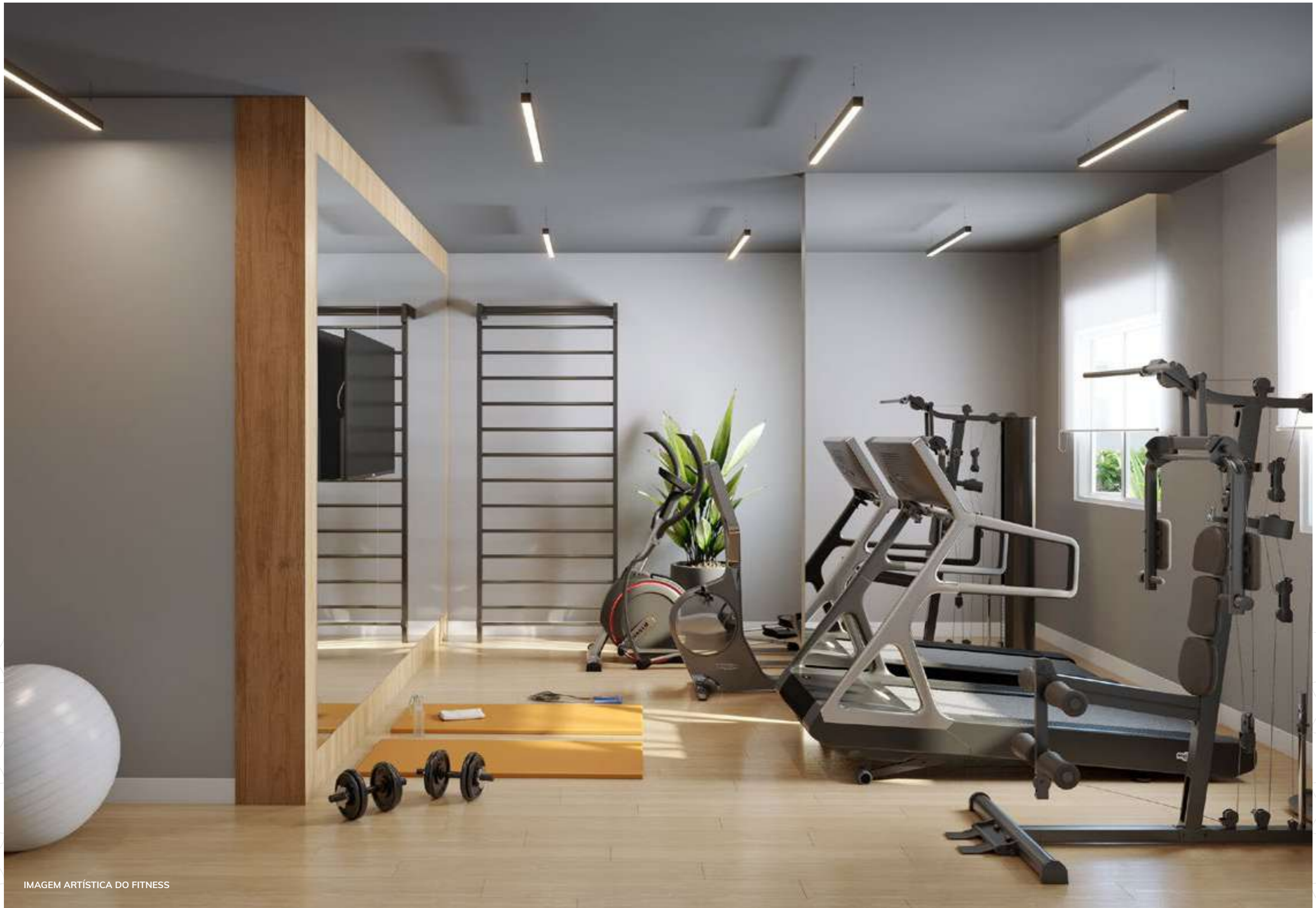
IMAGEM ARTÍSTICA DO FITNESS