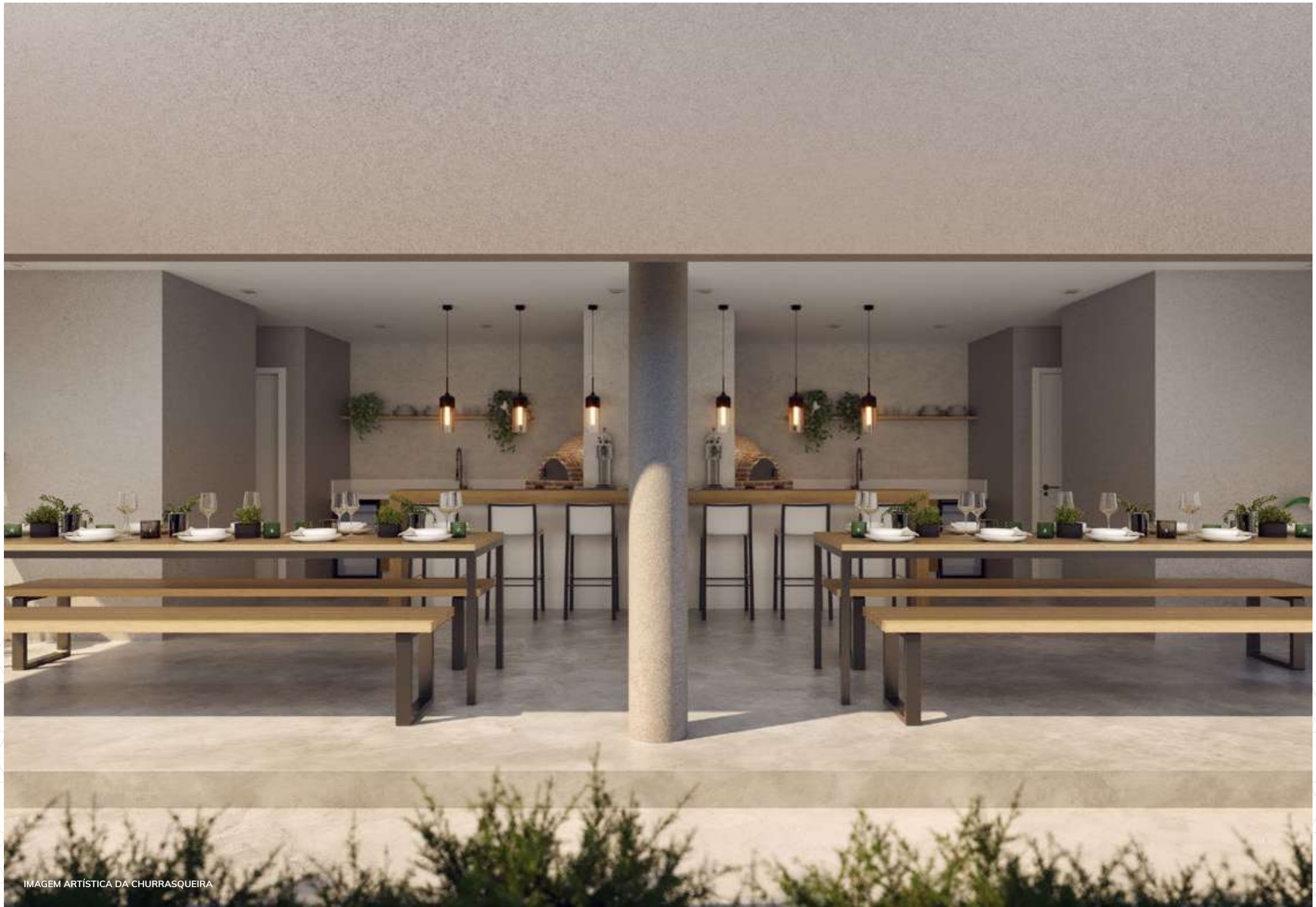
IMAGEM ARTÍSTICA DA CHURRASQUEIRA