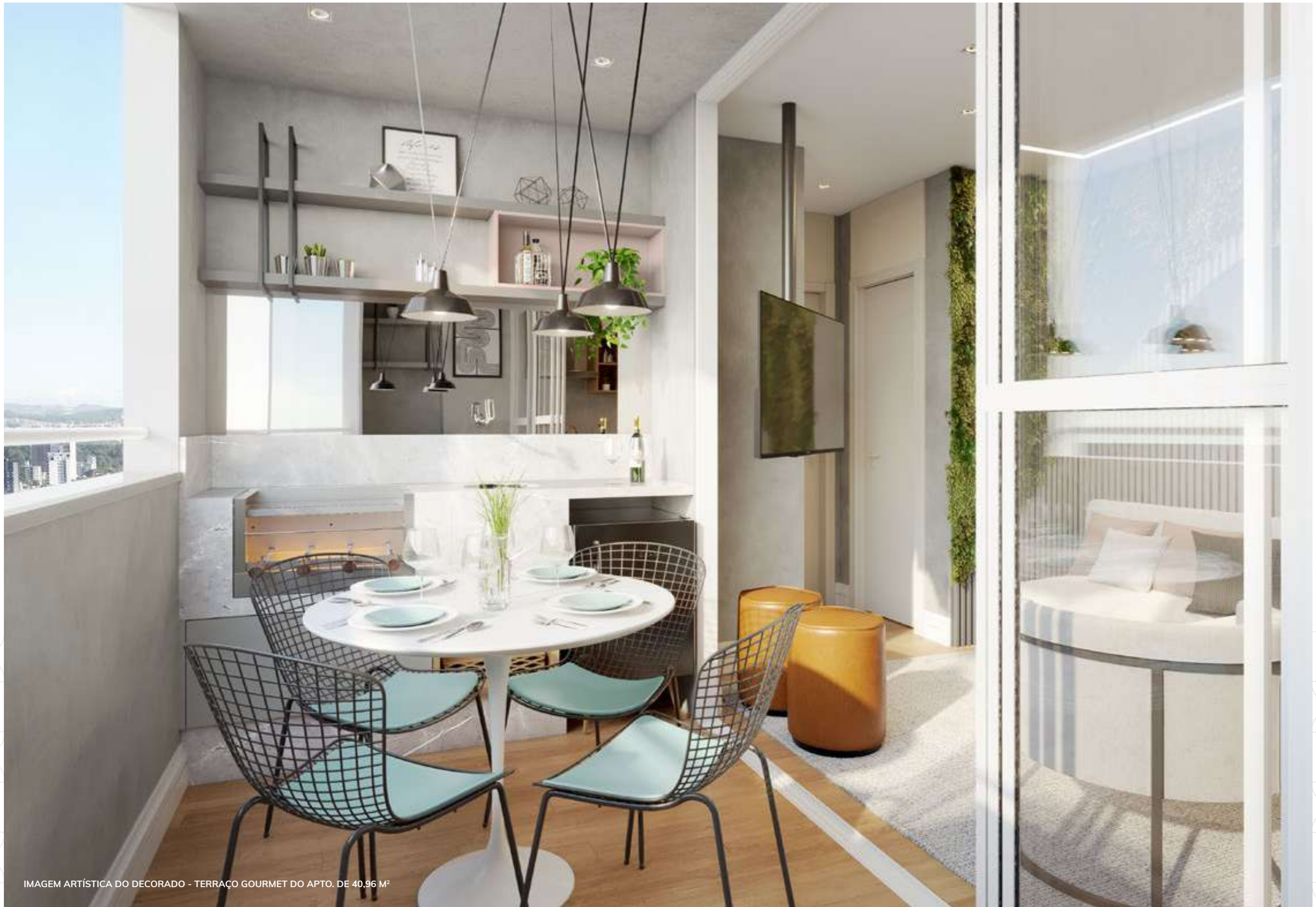
IMAGEM ARTÍSTICA DO DECORADO - TERRAÇO GOURMET DO APTO. DE 40,96 M 2