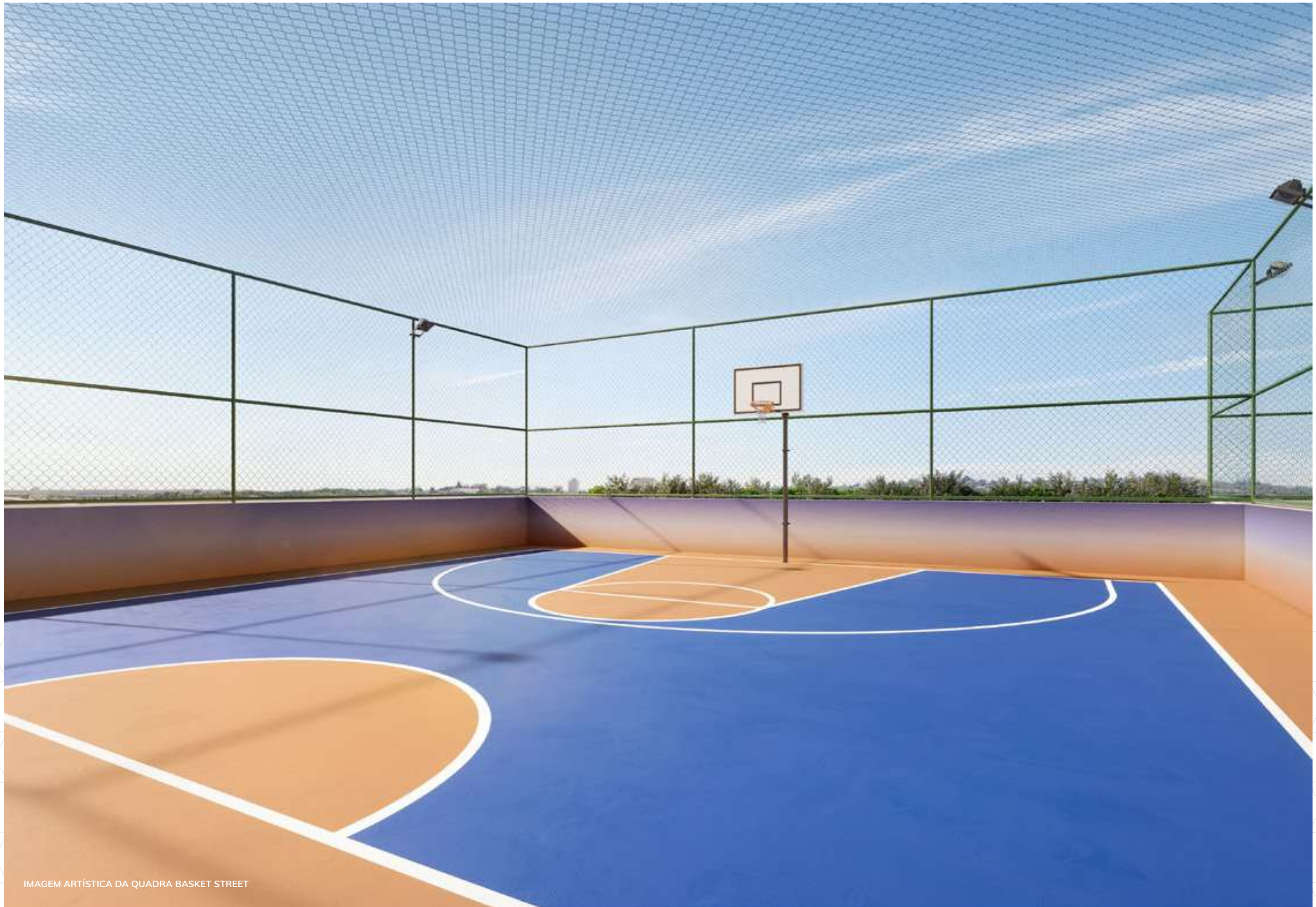
IMAGEM ARTÍSTICA DA QUADRA BASKET STREET