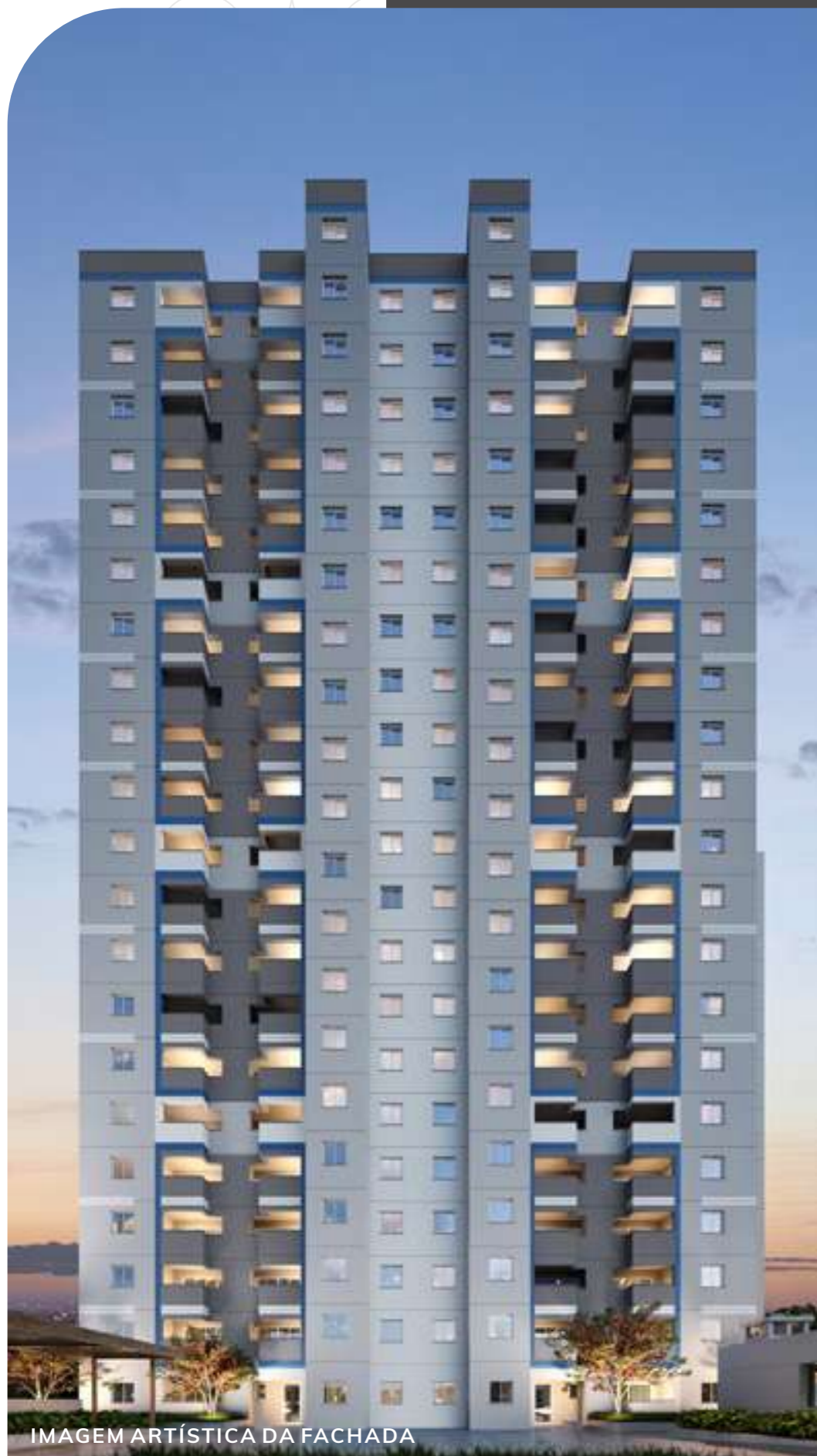
IMAGEM ARTÍSTICA DA FACHADA