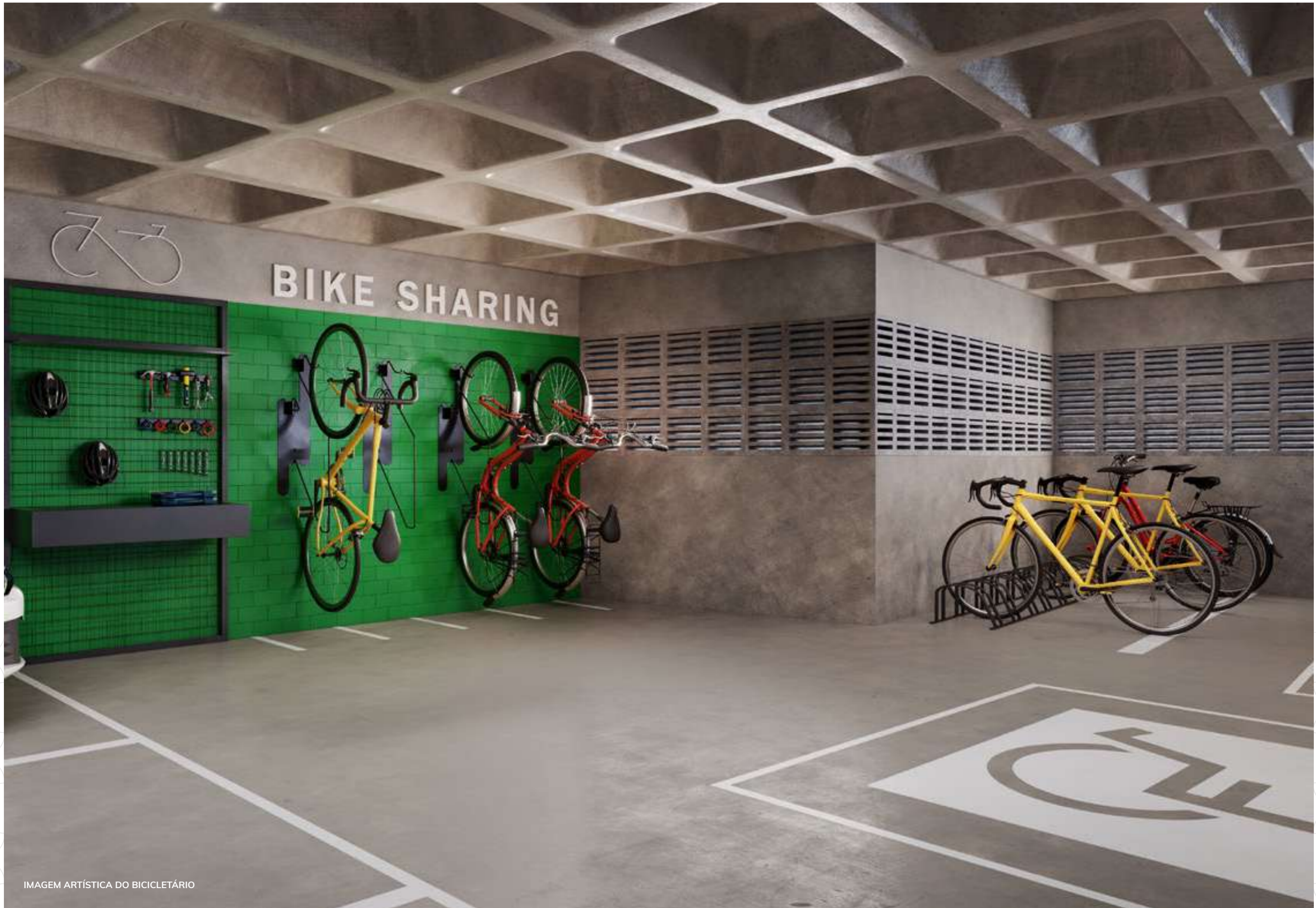
IMAGEM ARTÍSTICA DO BICICLETÁRIO