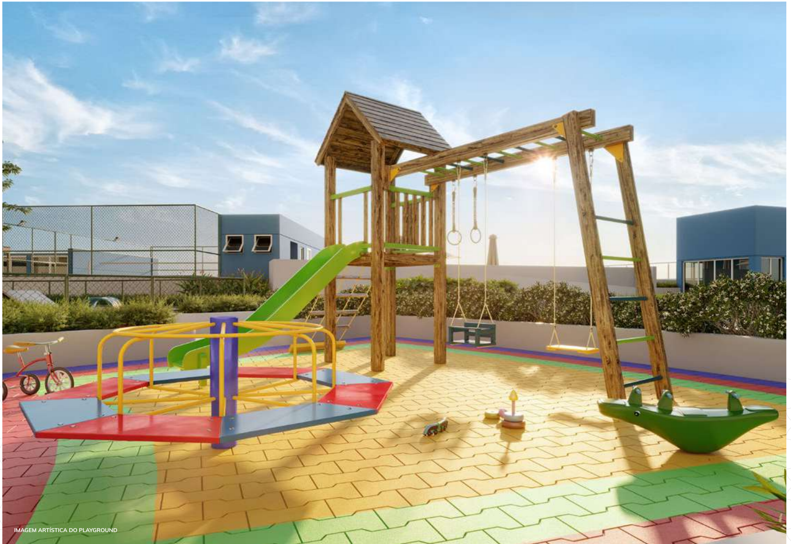
IMAGEM ARTÍSTICA DO PLAYGROUND