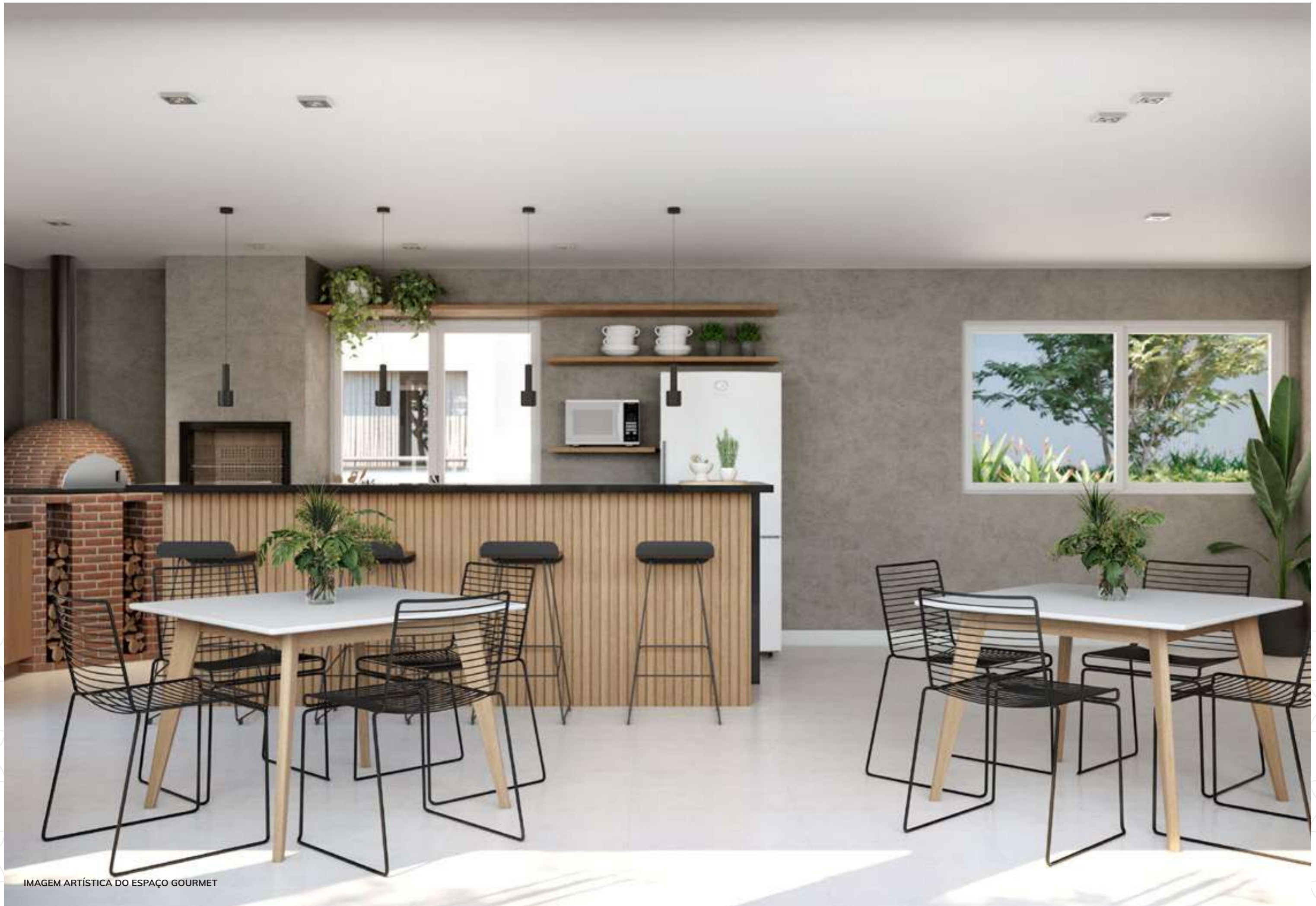
IMAGEM ARTÍSTICA DO ESPAÇO GOURMET