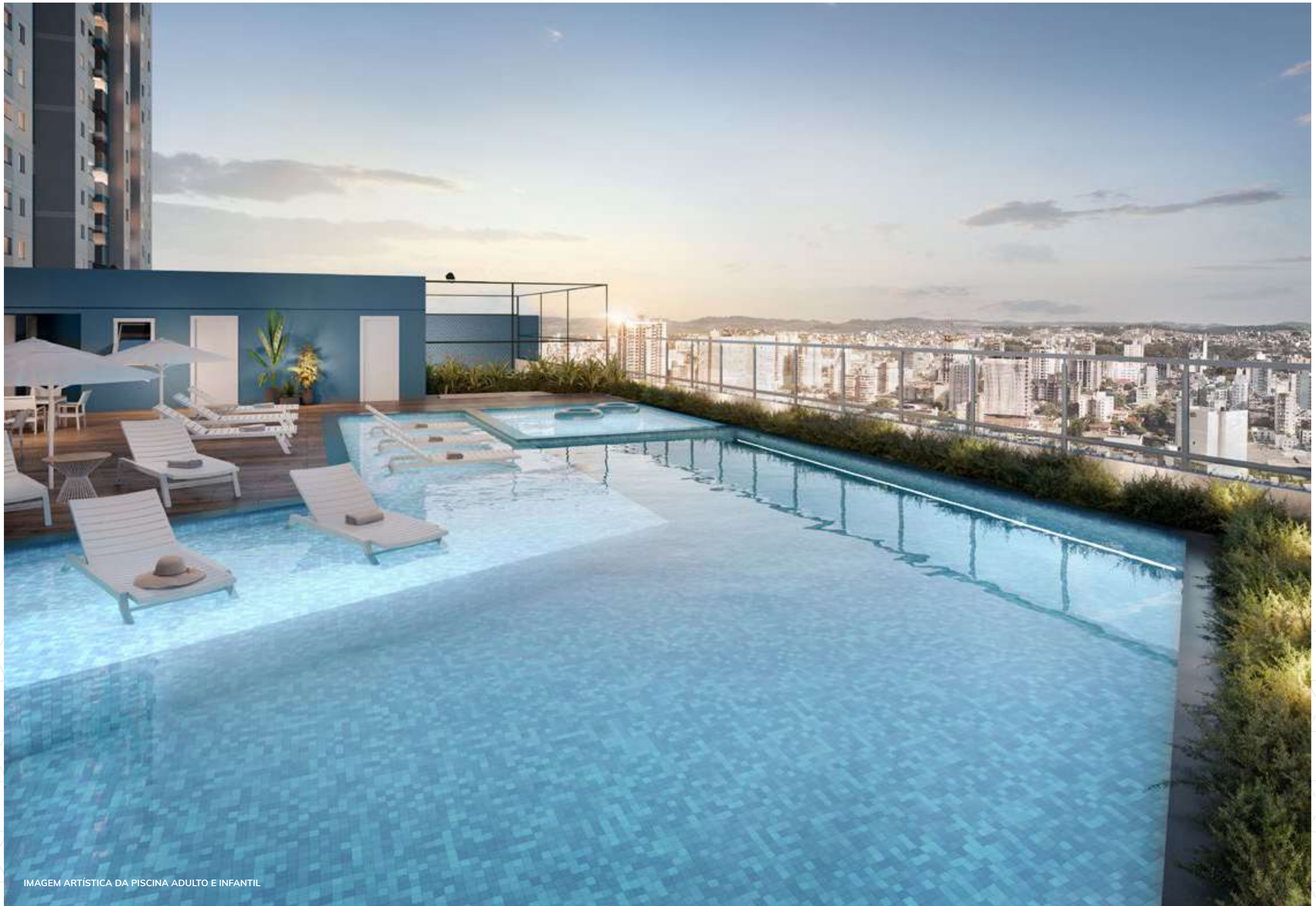
IMAGEM ARTÍSTICA DA PISCINA ADULTO E INFANTIL