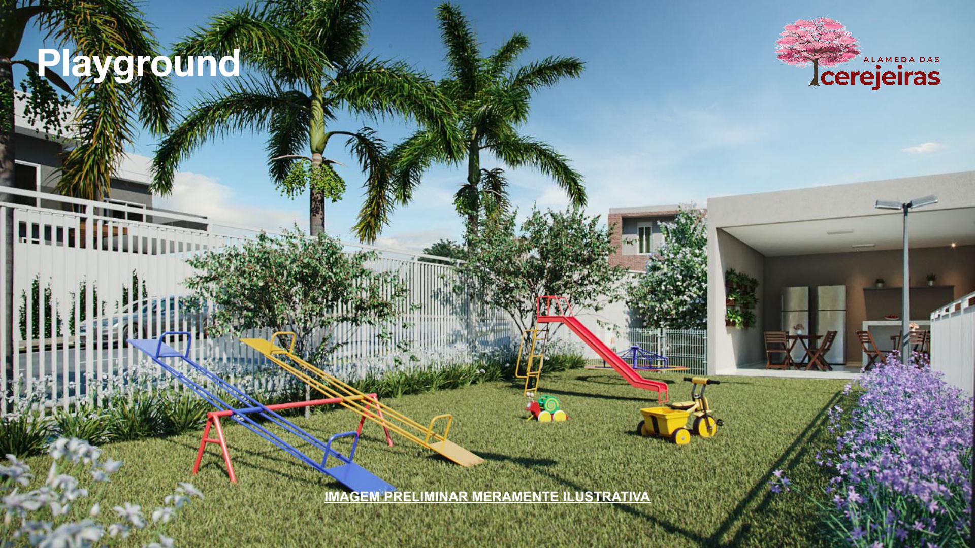
IMAGEM PRELIMINAR MERAMENTE ILUSTRATIVA