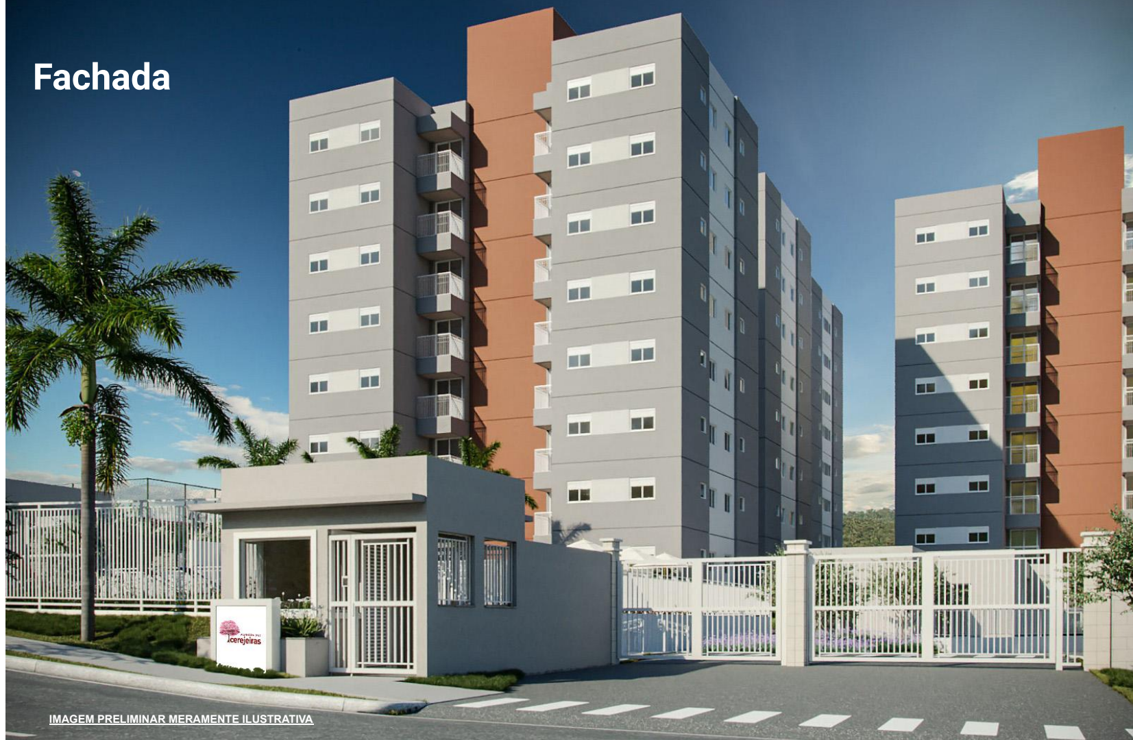
IMAGEM PRELIMINAR MERAMENTE ILUSTRATIVA