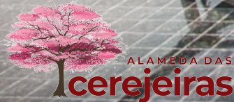
IMAGEM PRELIMINAR MERAMENTE ILUSTRATIVA