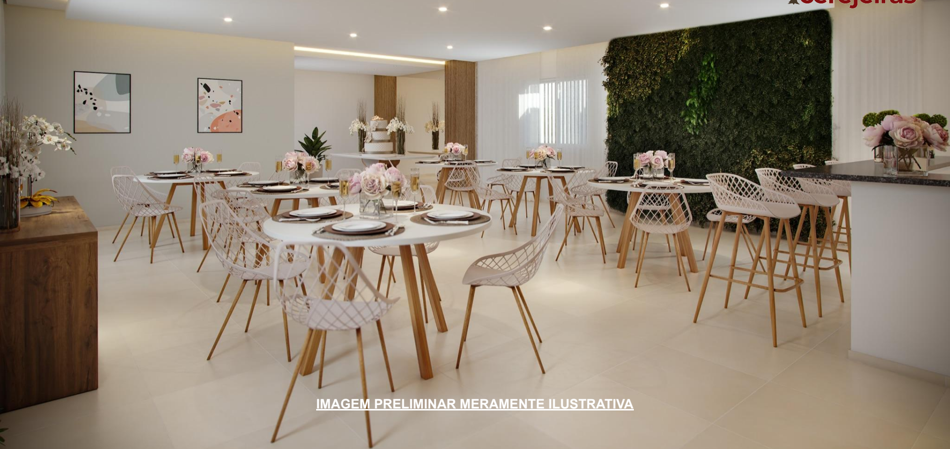
IMAGEM PRELIMINAR MERAMENTE ILUSTRATIVA