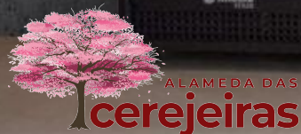
IMAGEM PRELIMINAR MERAMENTE ILUSTRATIVA