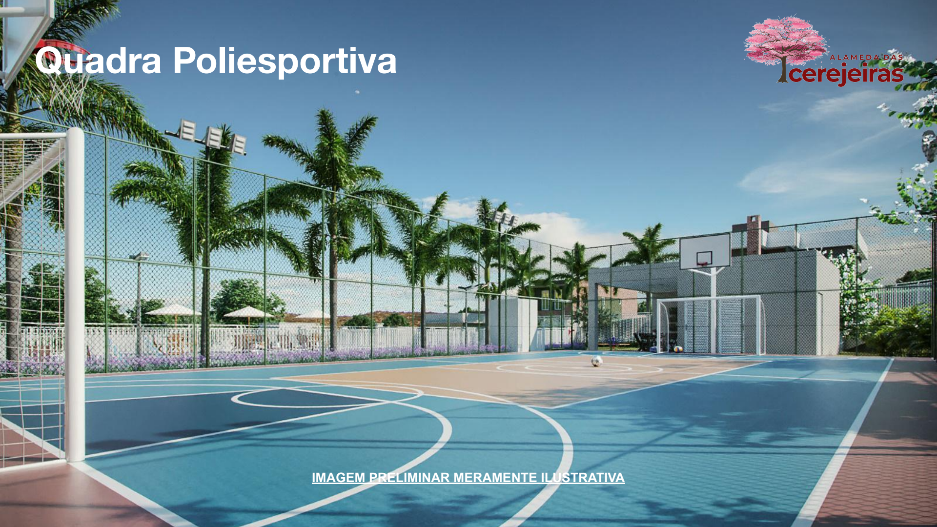
IMAGEM PRELIMINAR MERAMENTE ILUSTRATIVA