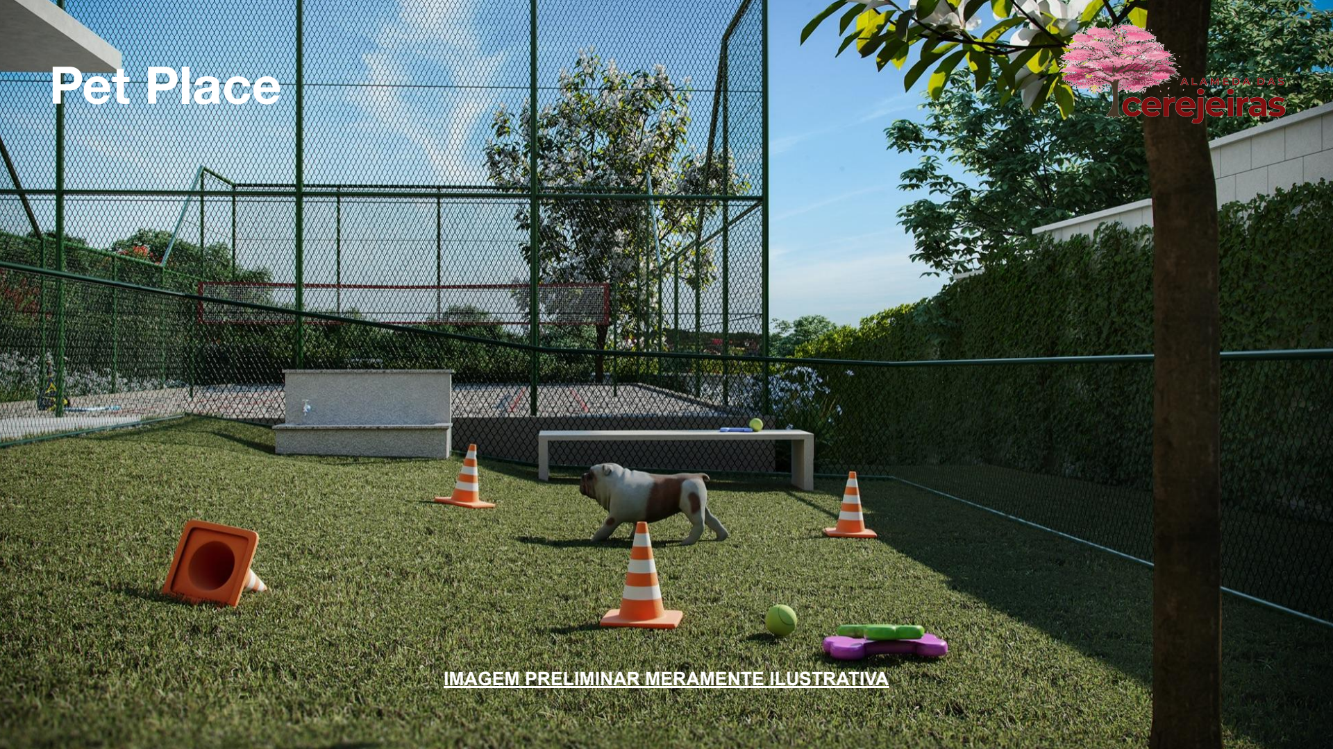
IMAGEM PRELIMINAR MERAMENTE ILUSTRATIVA