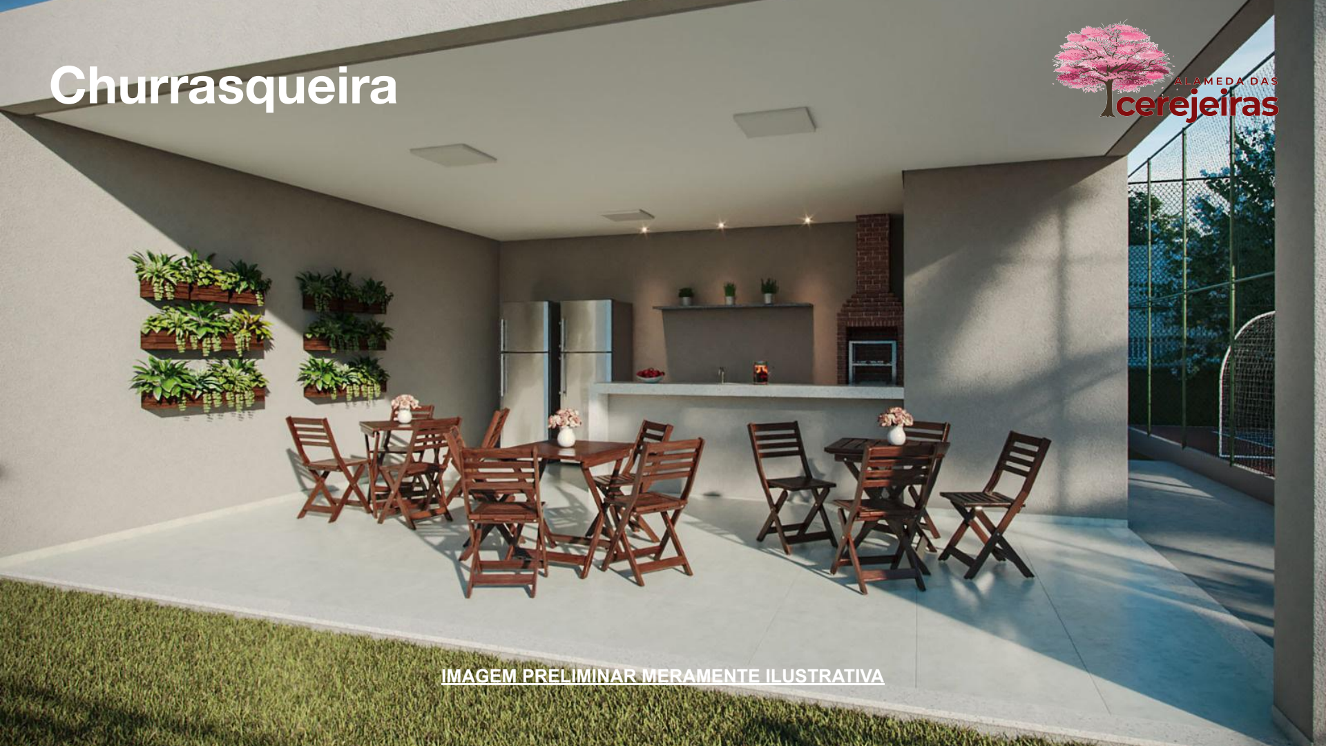
IMAGEM PRELIMINAR MERAMENTE ILUSTRATIVA