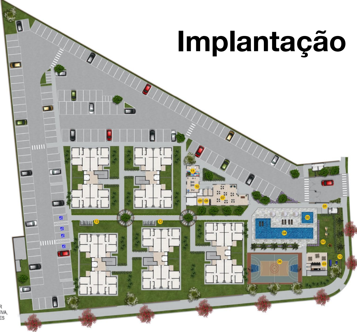
IMAGEM PRELIMINAR MERAMENTE ILUSTRATIVA, SUJEITA A ALTERAÇÕES