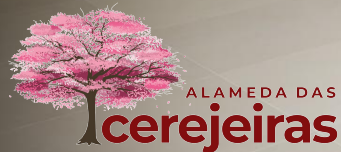
IMAGEM PRELIMINAR MERAMENTE ILUSTRATIVA