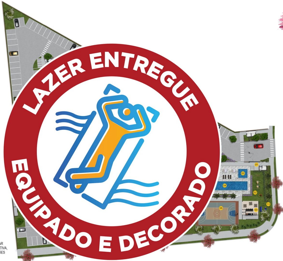
IMAGEM PRELIMINAR MERAMENTE ILUSTRATIVA, SUJEITA A ALTERAÇÕES