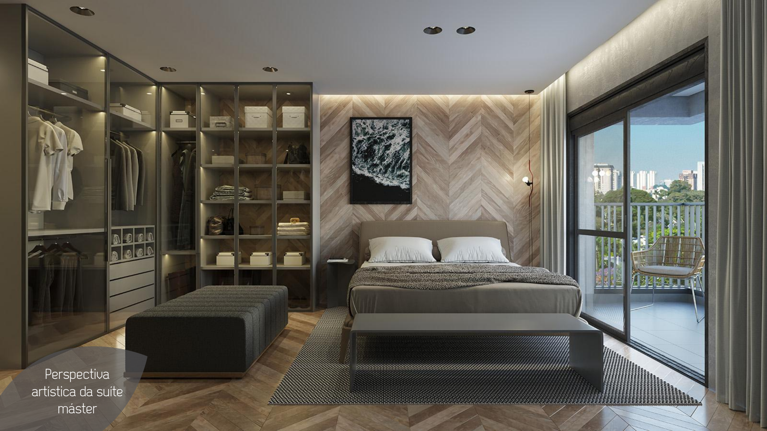
Perspectiva artística da suíte máster