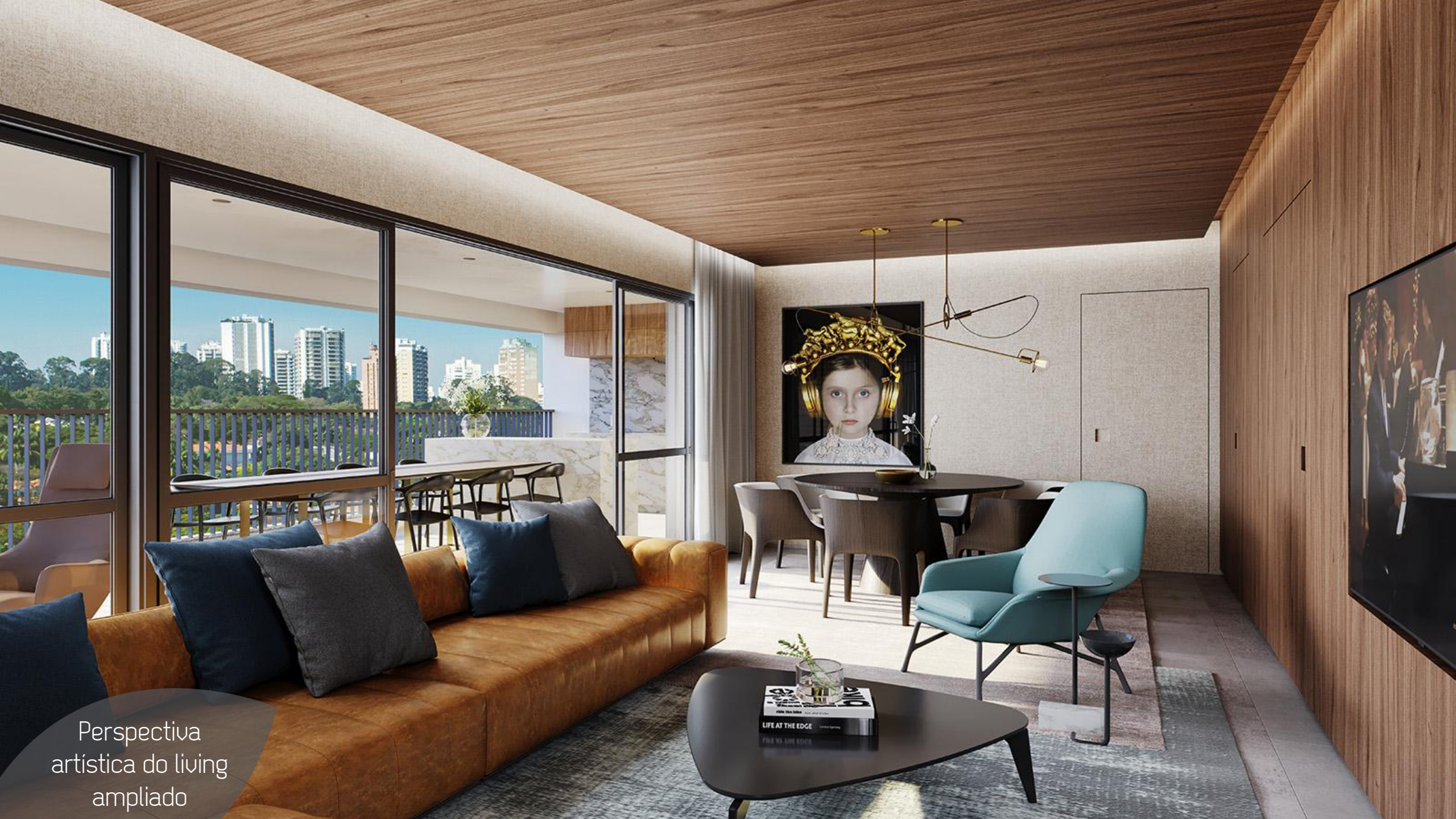
Perspectiva artística do living ampliado