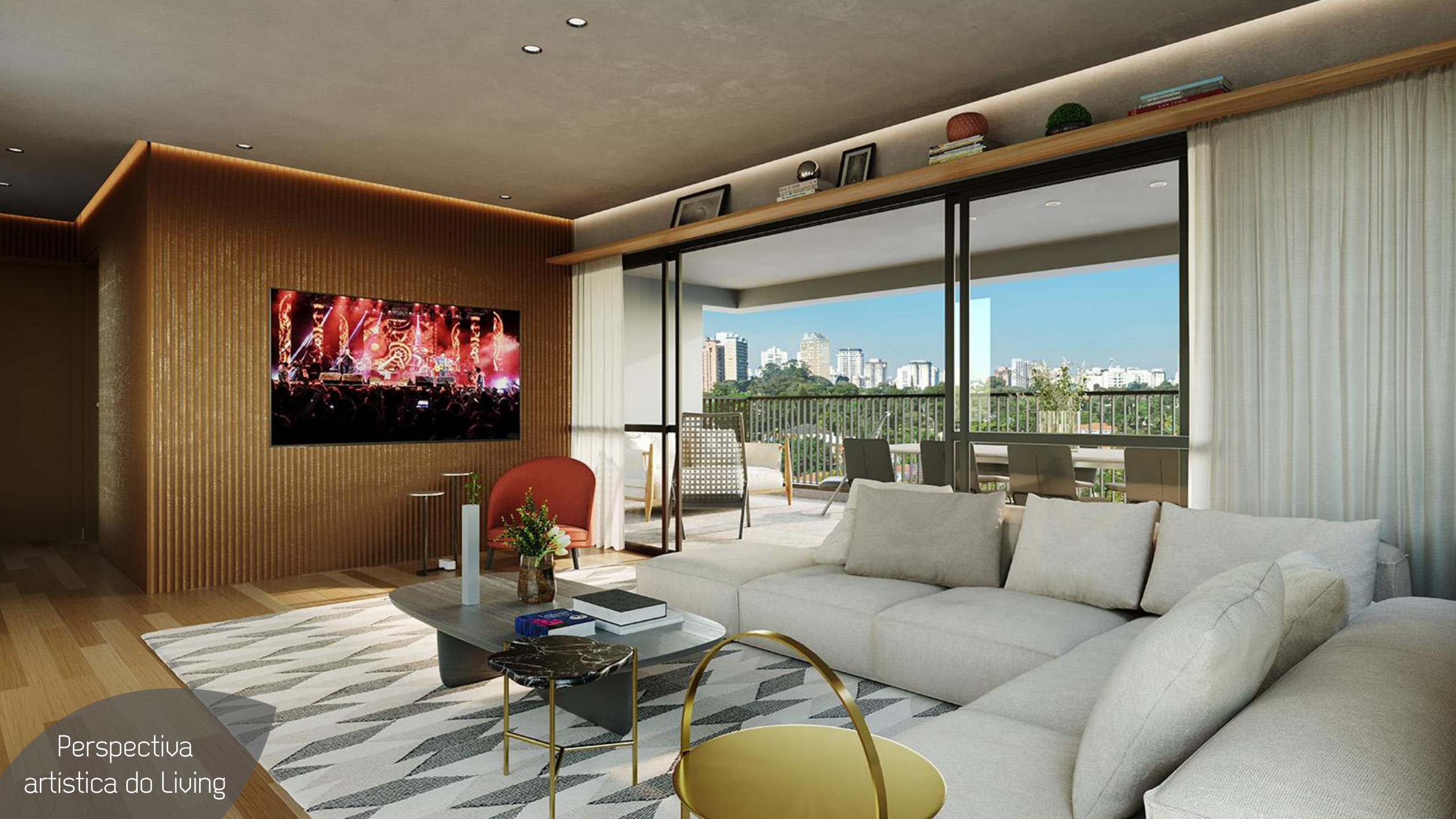
Perspectiva artística do Living