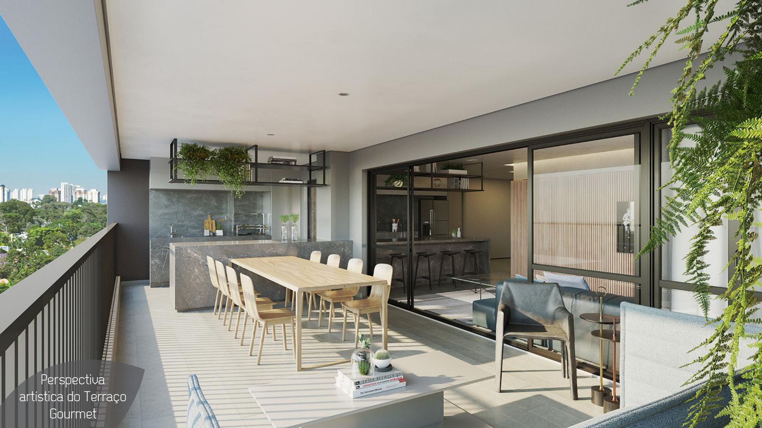
Perspectiva artística do Terraço Gourmet