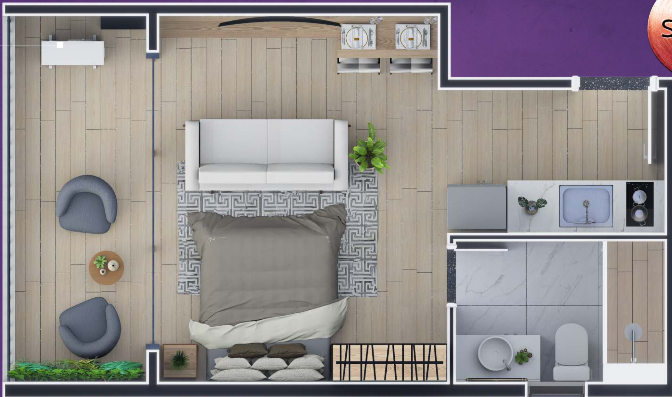
IMAGEM MERAMENTE ILUSTRATIVA, SUJEITO A ALTERAÇÕES