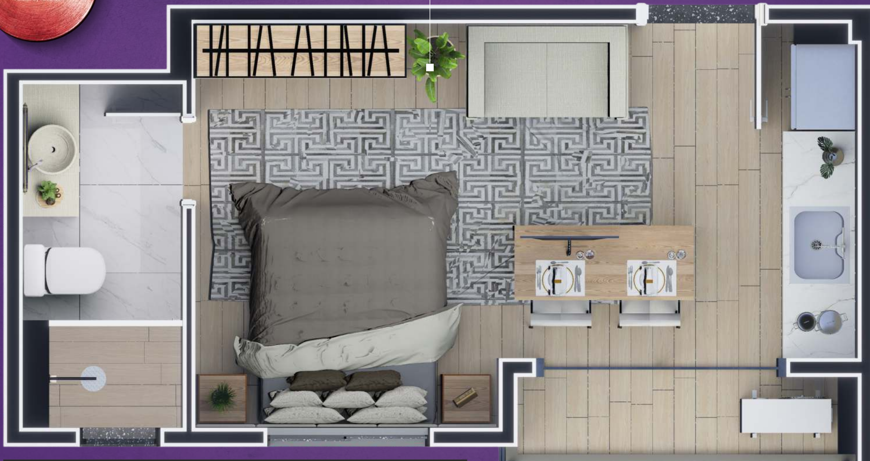
IMAGEM MERAMENTE ILUSTRATIVA, SUJEITO A ALTERAÇÕES