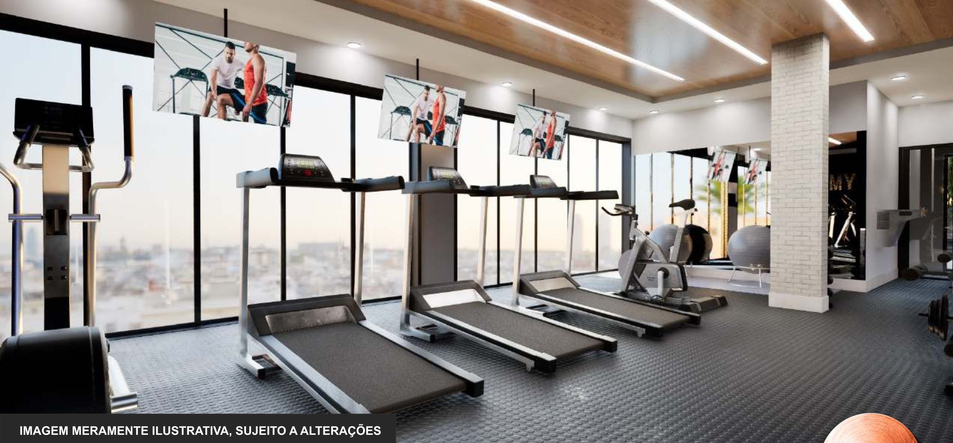
IMAGEM MERAMENTE ILUSTRATIVA, SUJEITO A ALTERAÇÕES