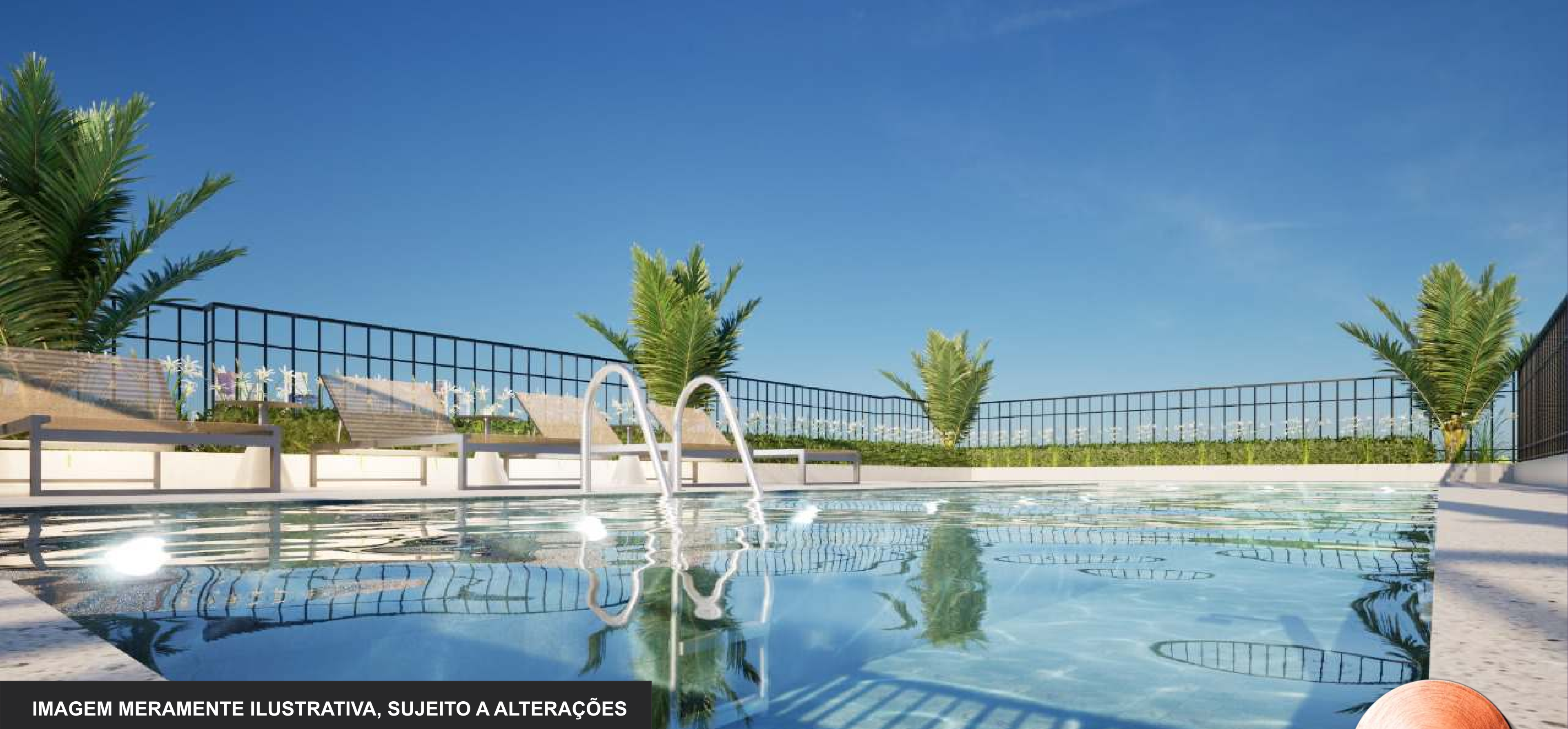
IMAGEM MERAMENTE ILUSTRATIVA, SUJEITO A ALTERAÇÕES