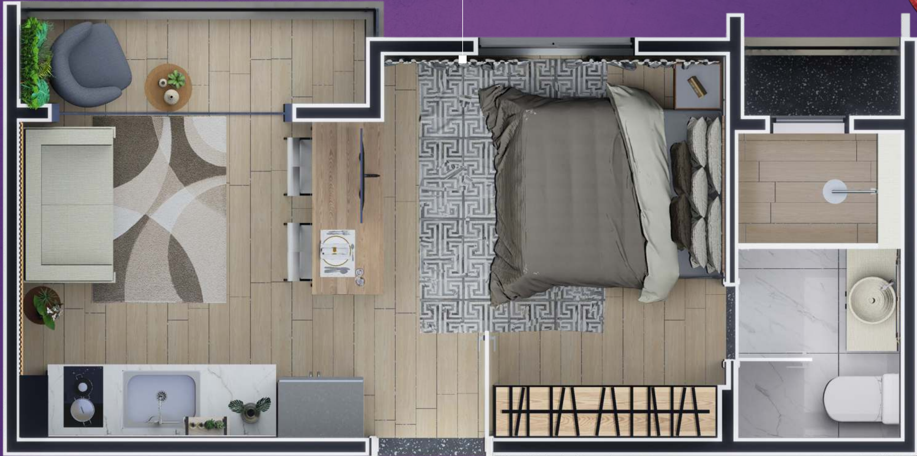
IMAGEM MERAMENTE ILUSTRATIVA, SUJEITO A ALTERAÇÕES