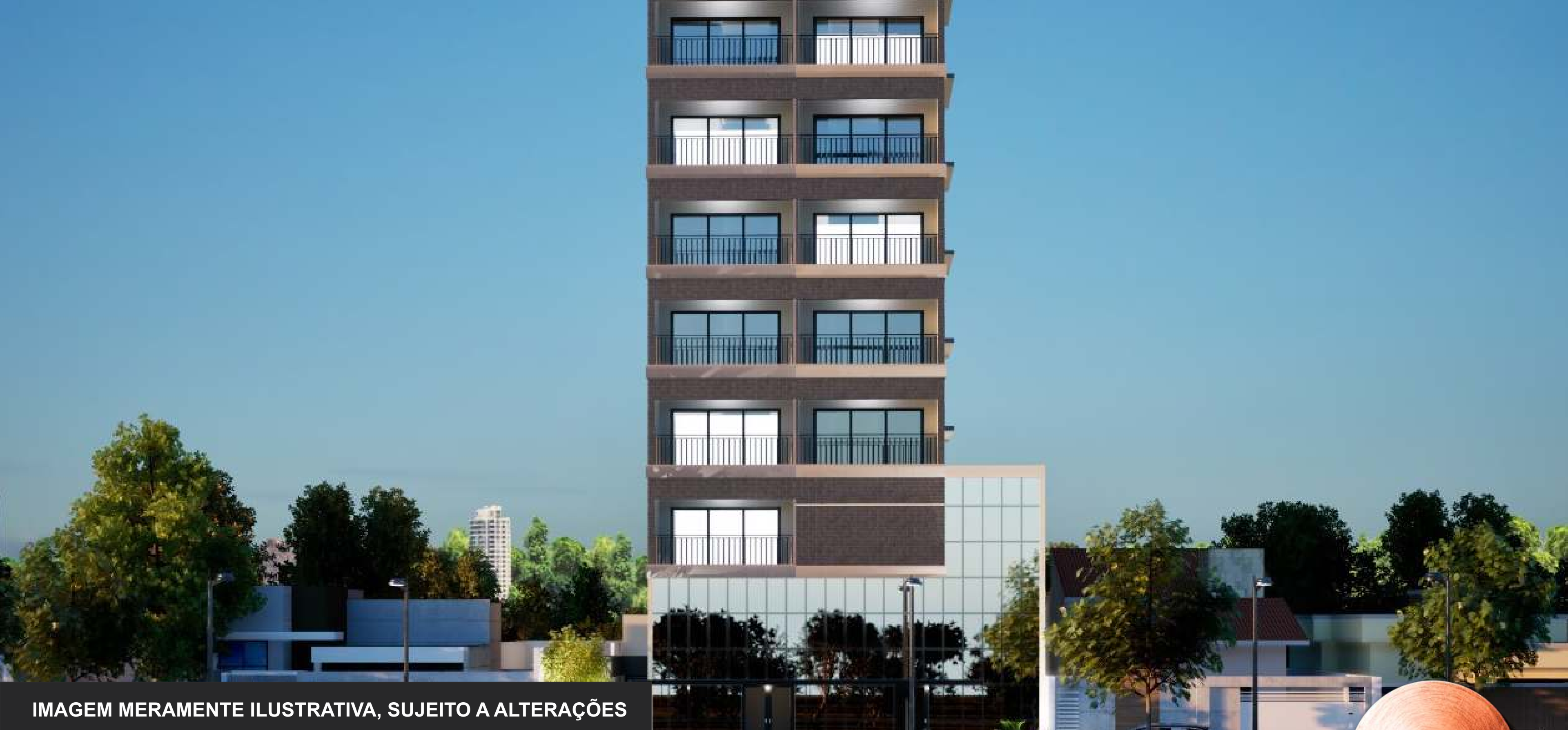
IMAGEM MERAMENTE ILUSTRATIVA, SUJEITO A ALTERAÇÕES