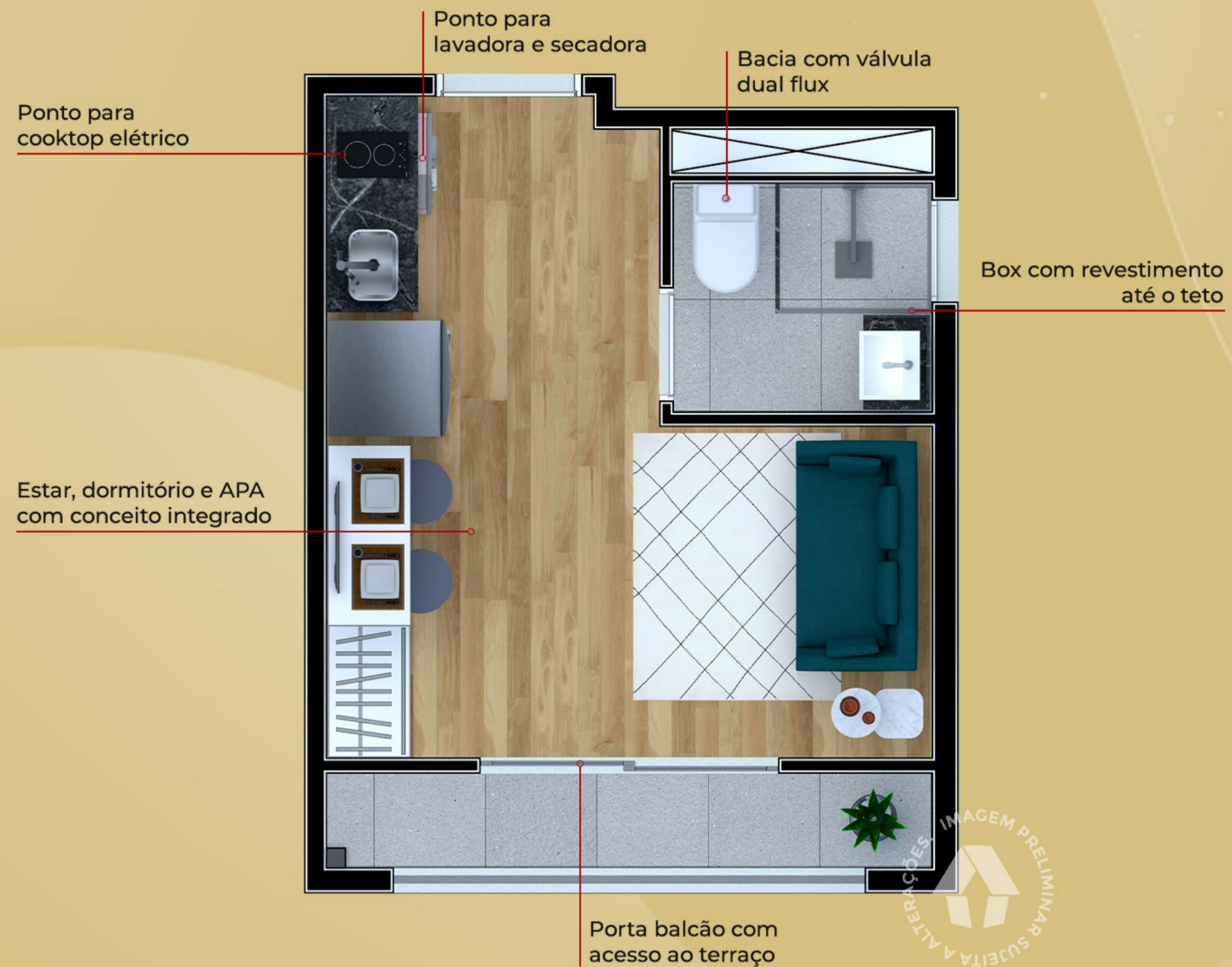
Ilustração artística da planta com sugestão de decoração. Os móveis, utensílios, adornos e equipamentos não fazem parte do contrato de venda e compra. Acabamentos e revestimentos serão entregues conforme memorial descritivo específico. Esta planta poderá sofrer variações decorrentes do atendimento de postura de órgãos públicos e concessionárias.