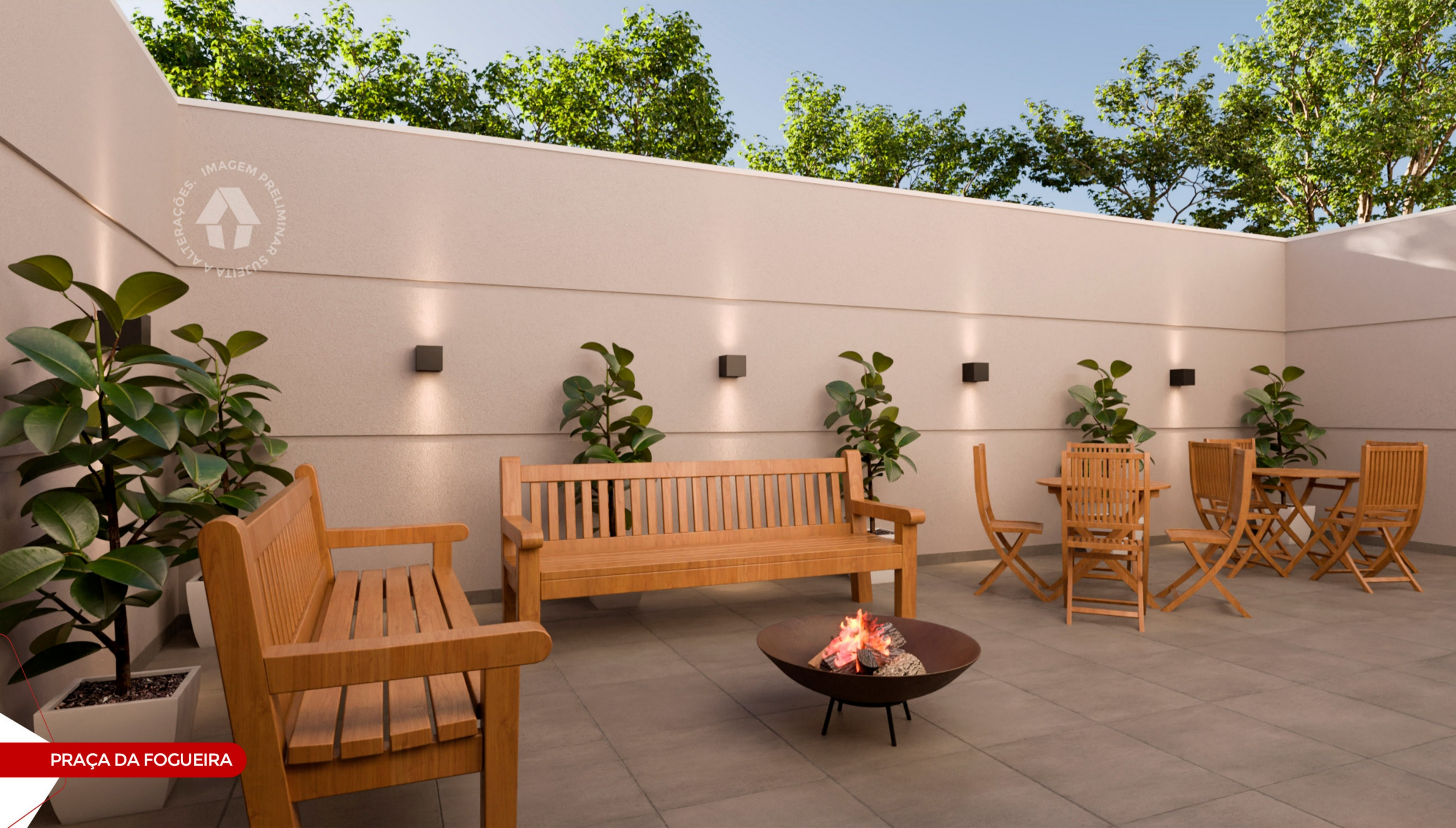
PRAÇA DA FOGUEIRA