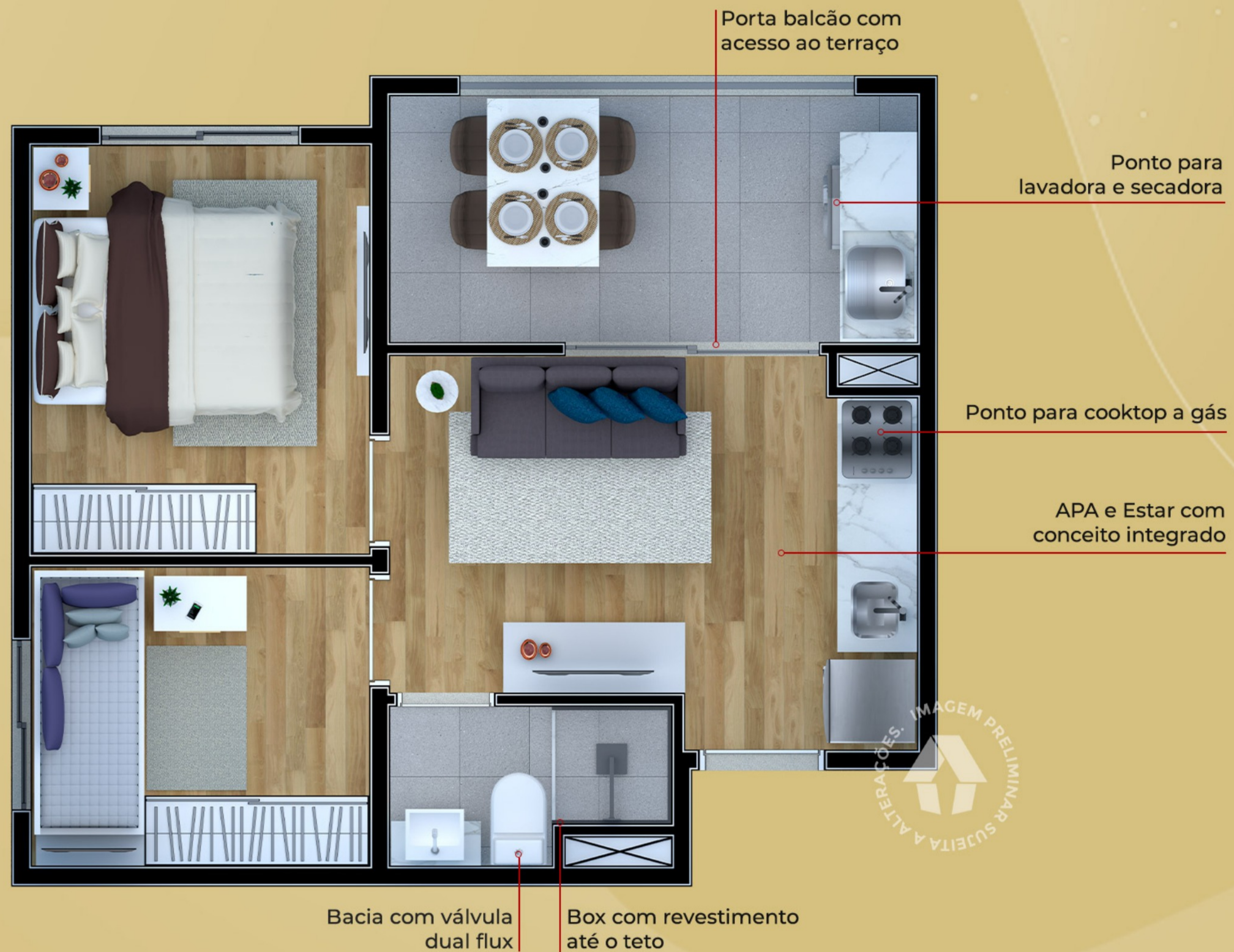
Ilustração artística da planta com sugestão de decoração. Os móveis, utensílios, adornos e equipamentos não fazem parte do contrato de venda e compra. Acabamentos e revestimentos serão entregues conforme memorial descritivo específico. Esta planta poderá sofrer variações decorrentes do atendimento de postura de órgãos públicos e concessionárias.