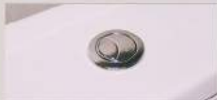
Sistema dual flush nas bacias sanitárias