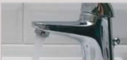
Arejadores nas torneiras dos apartamentos e áreas comuns