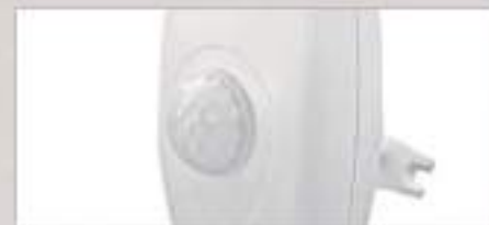
Sensores de presença nas áreas comuns de circulação