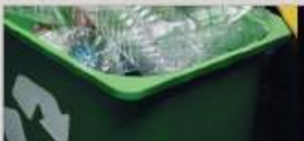
Lixeira para coleta seletiva