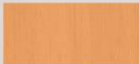
Portas e guarnições com madeira certificada