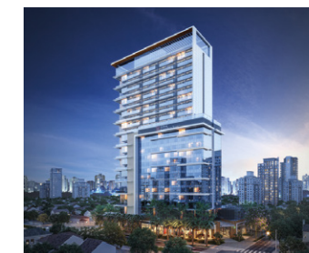
Helbor Wide São Paulo São Paulo - SP.