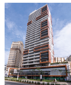
Helbor Nun Vila Nova São Paulo - SP.