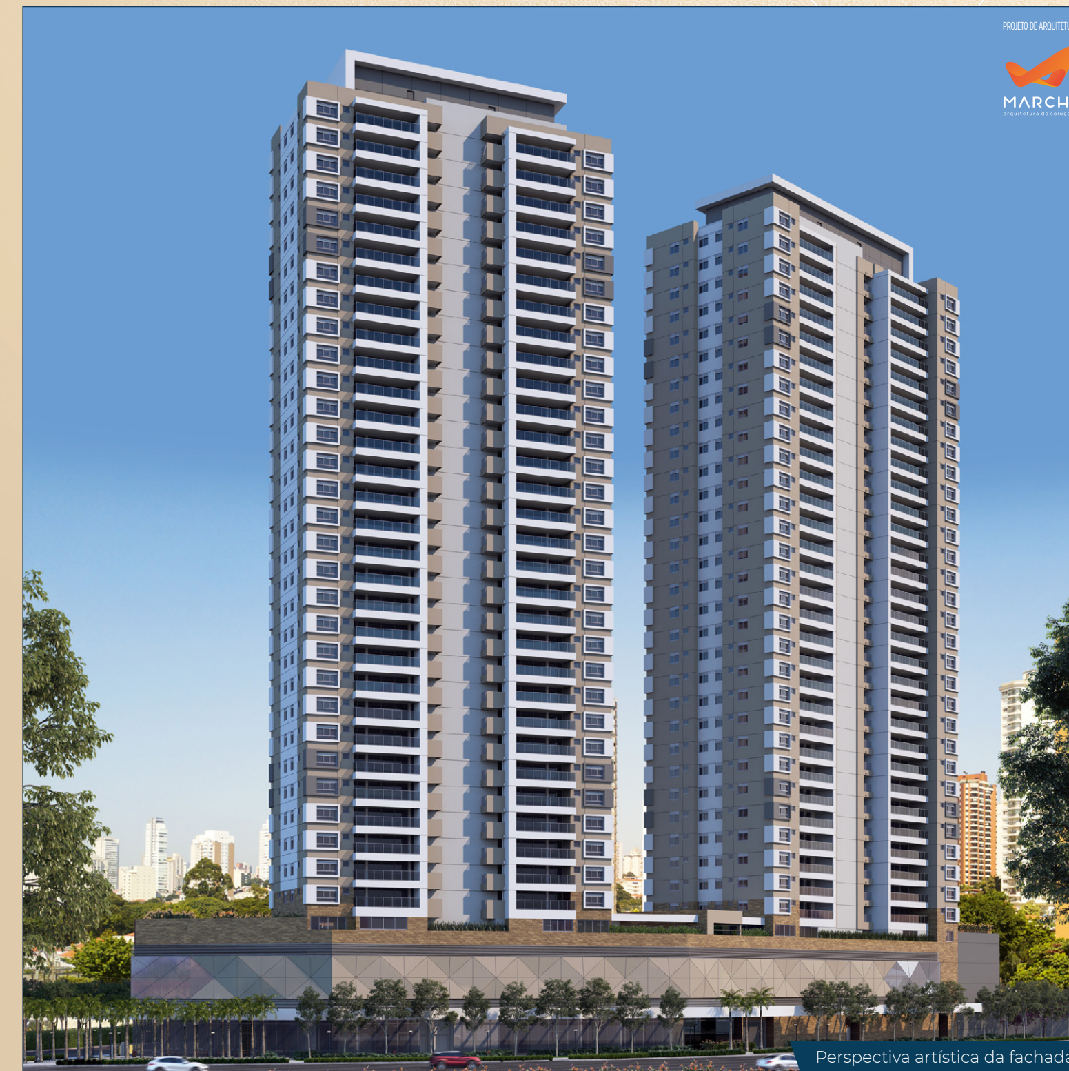
Perspectiva artística da fachada.

Projeto de paisagismo: Benedito Abbud Arquitetura Paisagística.