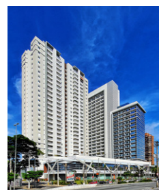
Helbor Patteo Bosque Maia Guarulhos – SP.