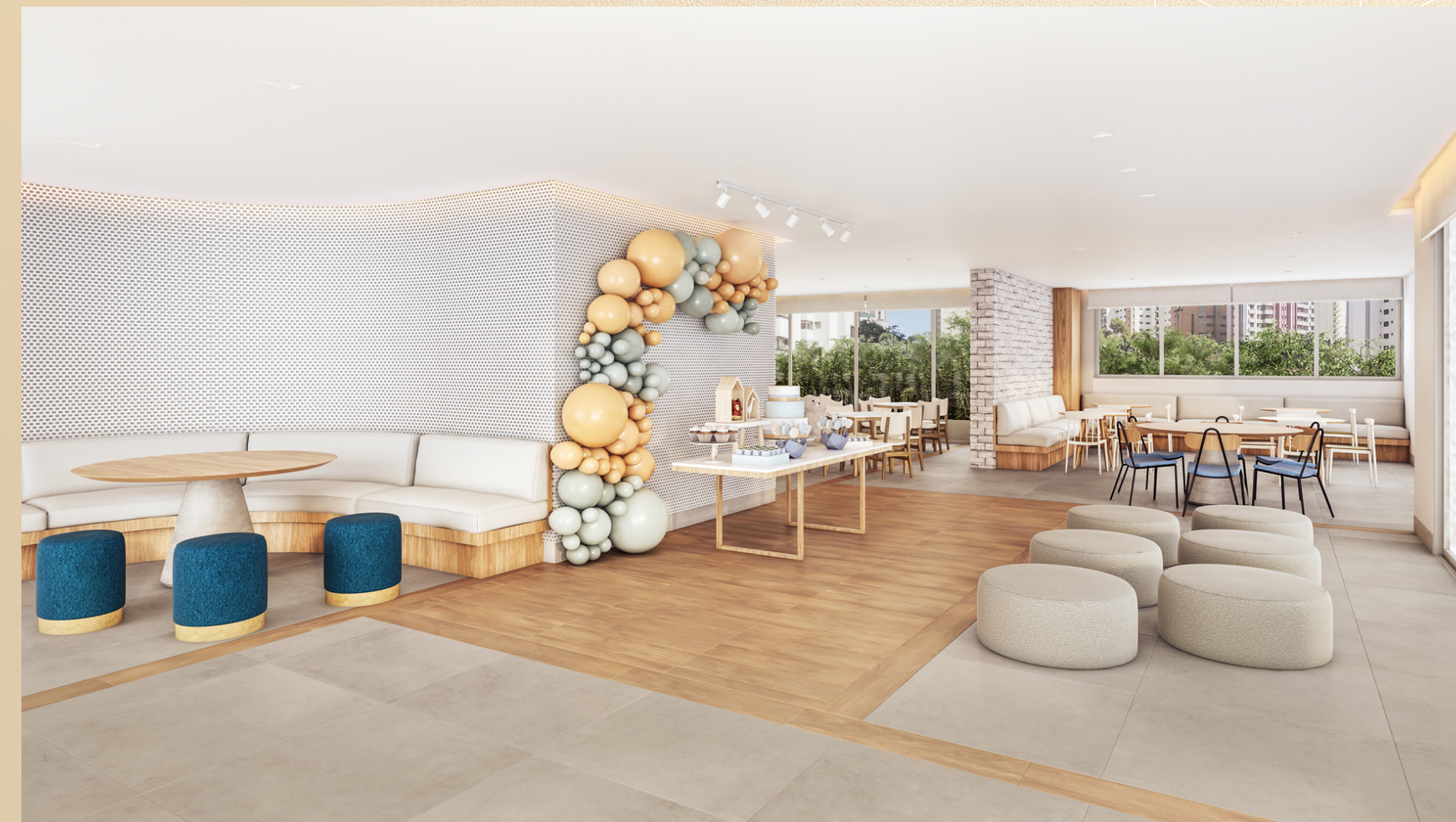
Perspectiva artística do salão de festas infantil.

A vida que você sempre quis, com o bem-estar que você sempre sonhou.