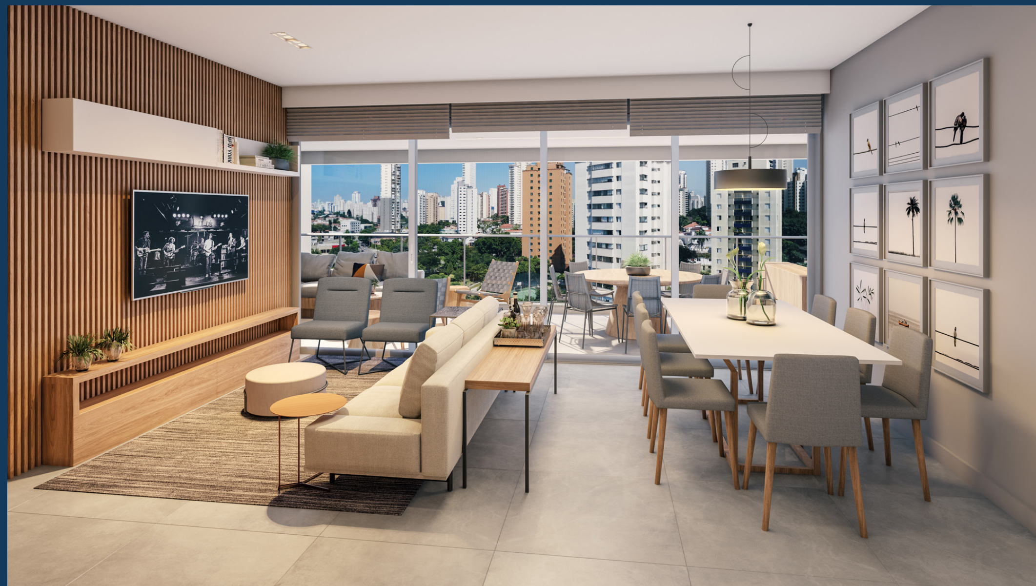
Perspectiva artística do living do apartamento tipo, 4 dormitórios (2 suítes) de 146m 2 privativos, finais 2 e 4 - torre A.

Espaços de convivência aconchegantes e modernos. E um terraço com uma vista na altura dos seus sonhos.