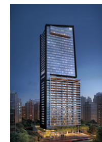
W São Paulo The Residences São Paulo – SP