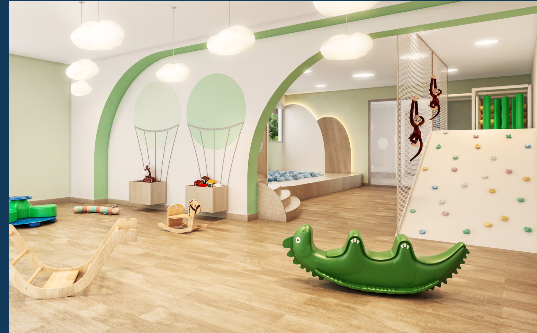
Perspectiva artística da brinquedoteca.