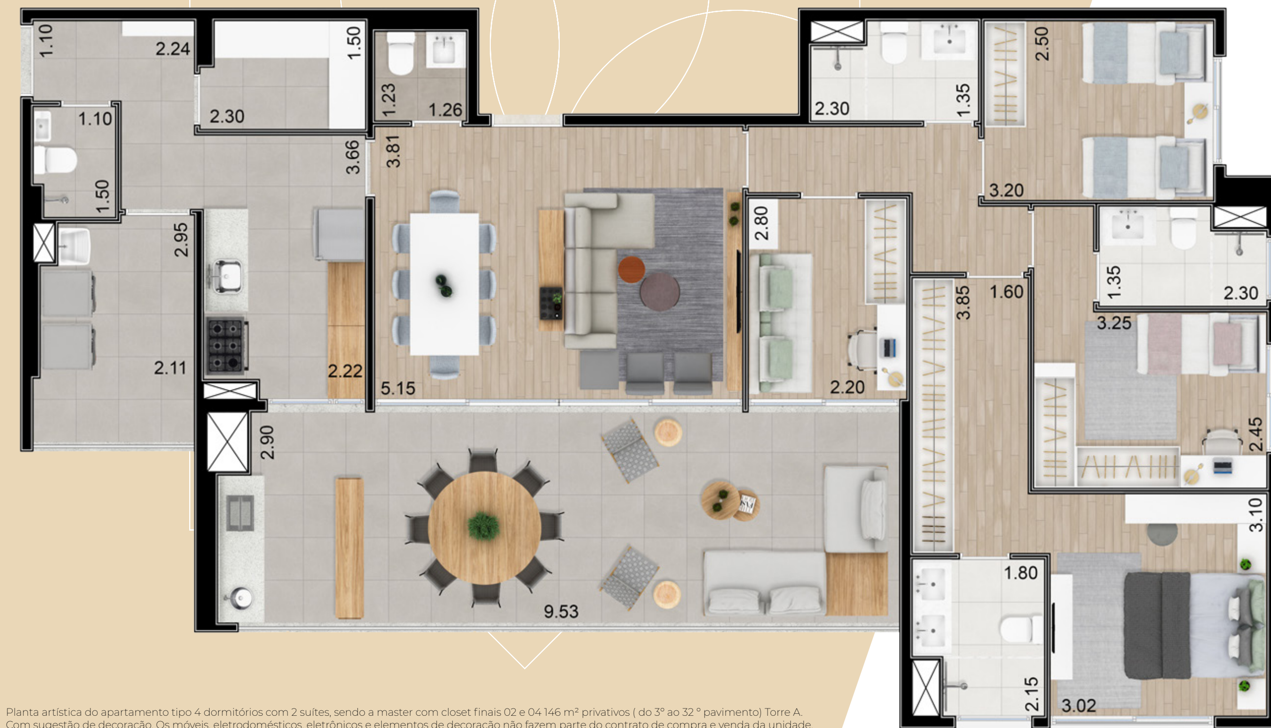
Planta artística do apartamento tipo 4 dormitórios com 2 suítes, sendo a master com closet finais 02 e 04 146 m 2 privativos ( do 3º ao 32º pavimento) Torre A. Com sugestão de decoração. Os móveis, eletrodomésticos, eletrônicos e elementos de decoração não fazem parte do contrato de compra e venda da unidade. Medidas de face a face.