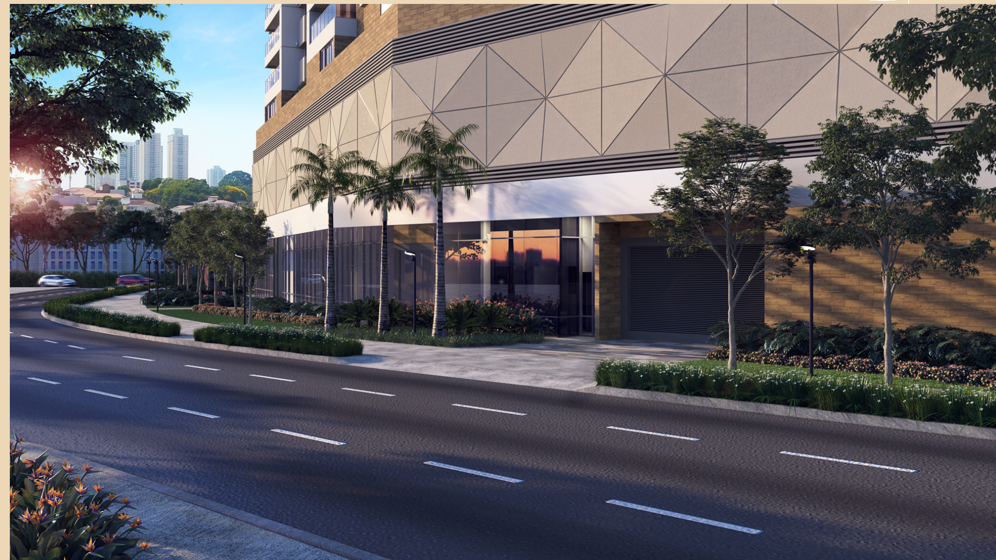
Perspectiva artística do Acesso das torres A e B.