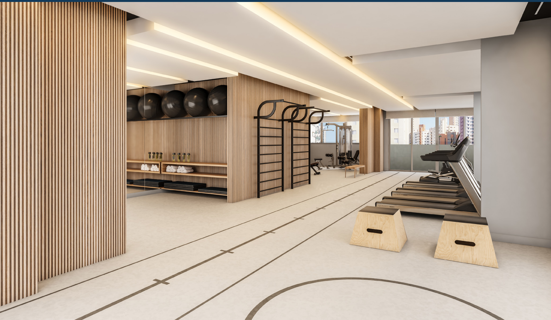
Perspectiva artística do fitness.

Espaços que inspiram saúde e cuidado com o corpo.