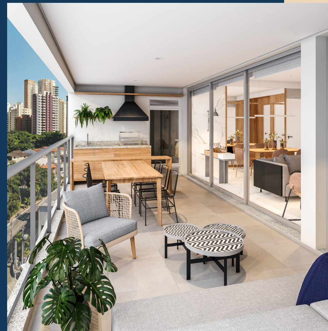
Perspectiva artística do terraço do apartamento tipo, 3 suítes de 114m 2 privativos, finais 2 e 4 - torre B.