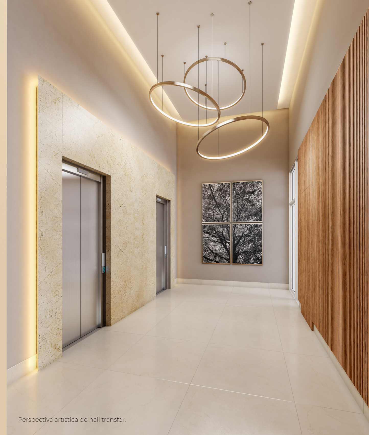
Perspectiva artística do hall transfer.