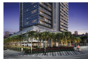
ComVem Bosque Maia.

Plataforma dedicada ao desenvolvimento e administração de centros de conveniência estabelecidos majoritariamente em cidades de grande densidade demográfica e econômica. Para locação de lojas, entre em contato com nossa equipe comercial - telefone: 11 4793-7555 | E-mail: comercial@hbrrealty.com.br