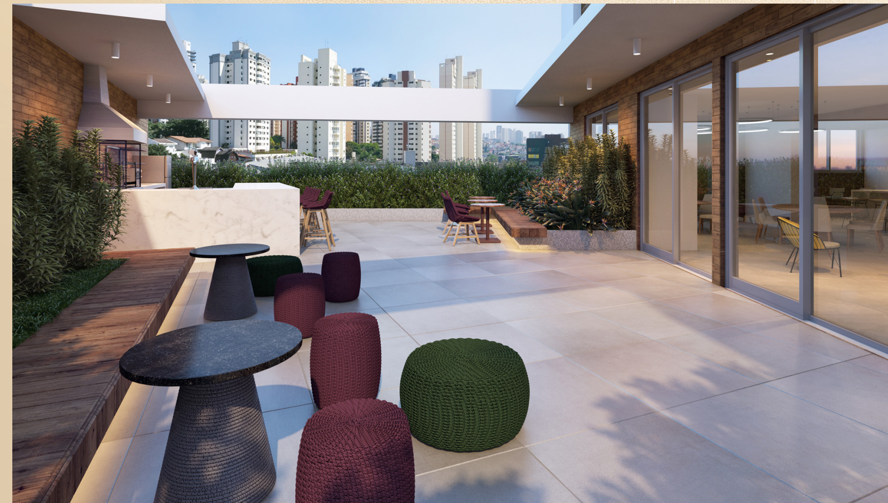
Perspectiva artística da churrasqueira.

Espaços perfeitos para receber a família e os amigos.