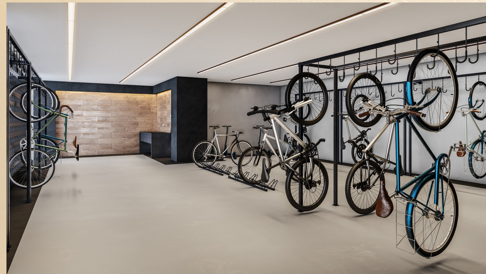
Perspectiva artística do bicicletário da torre A.

Espaços que inspiram saúde e cuidado com o corpo.