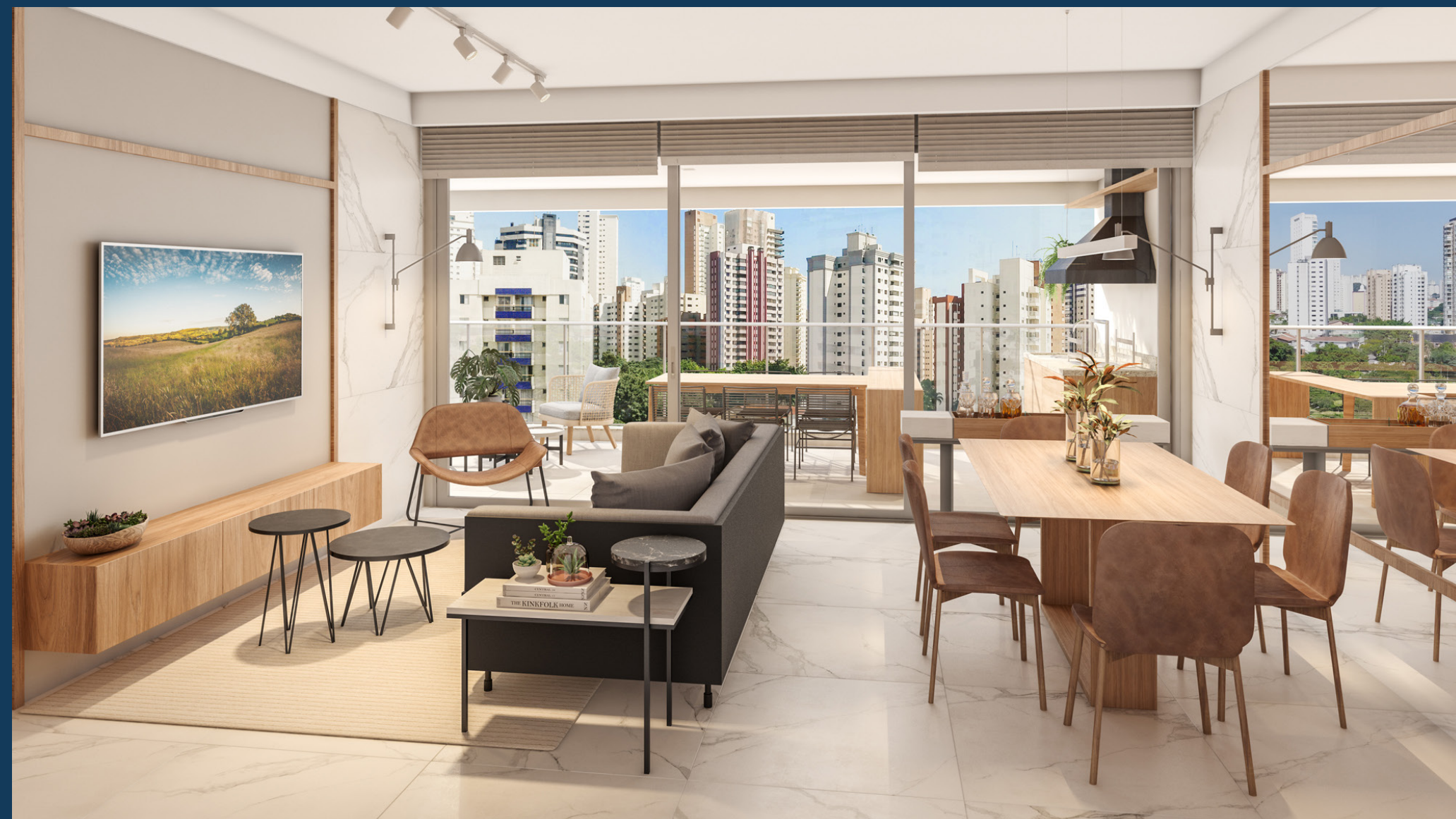
Perspectiva artística do living do apartamento tipo, 3 suítes de 114m 2 privativos, finais 2 e 4 - torre B.

Sinta o sossego da porta para dentro ou da varanda para fora.