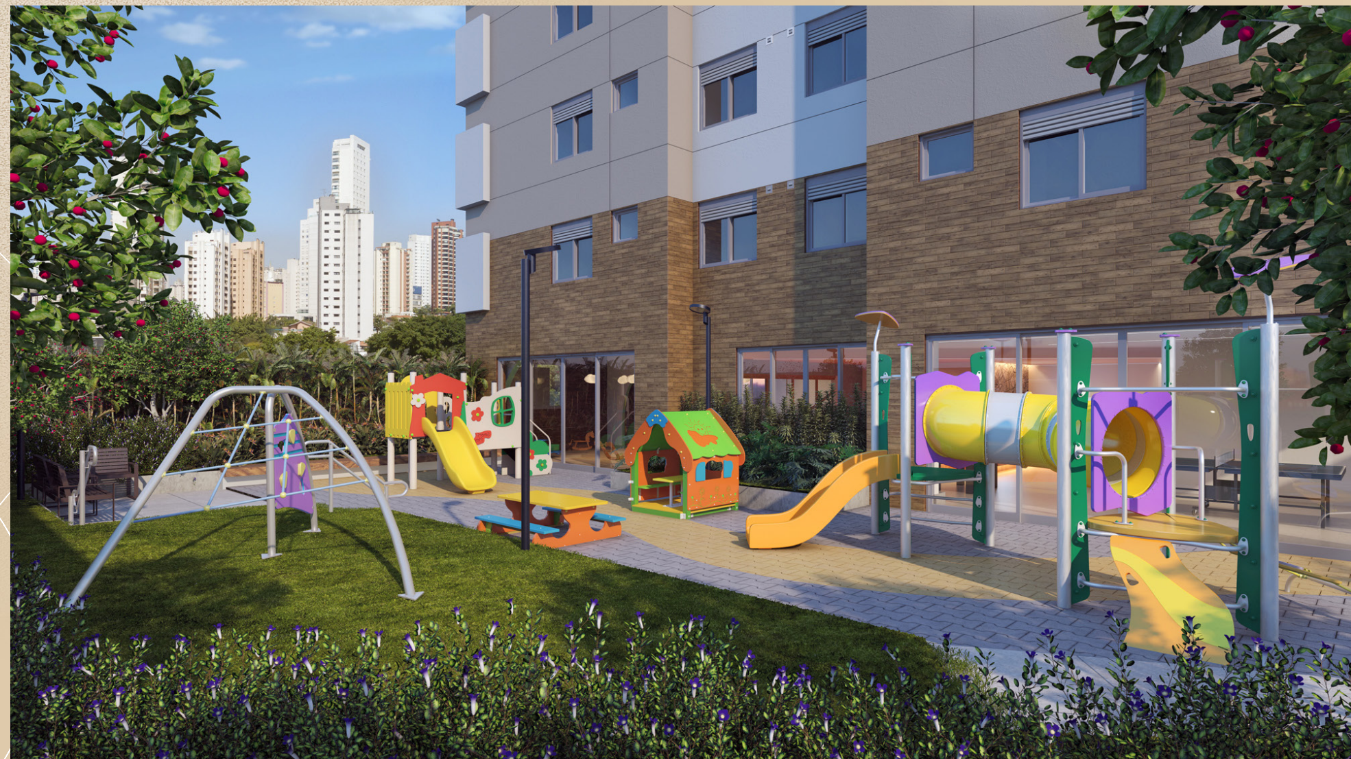
Perspectiva artística do playground.

Lazer para viver este sonho desde pequeno.