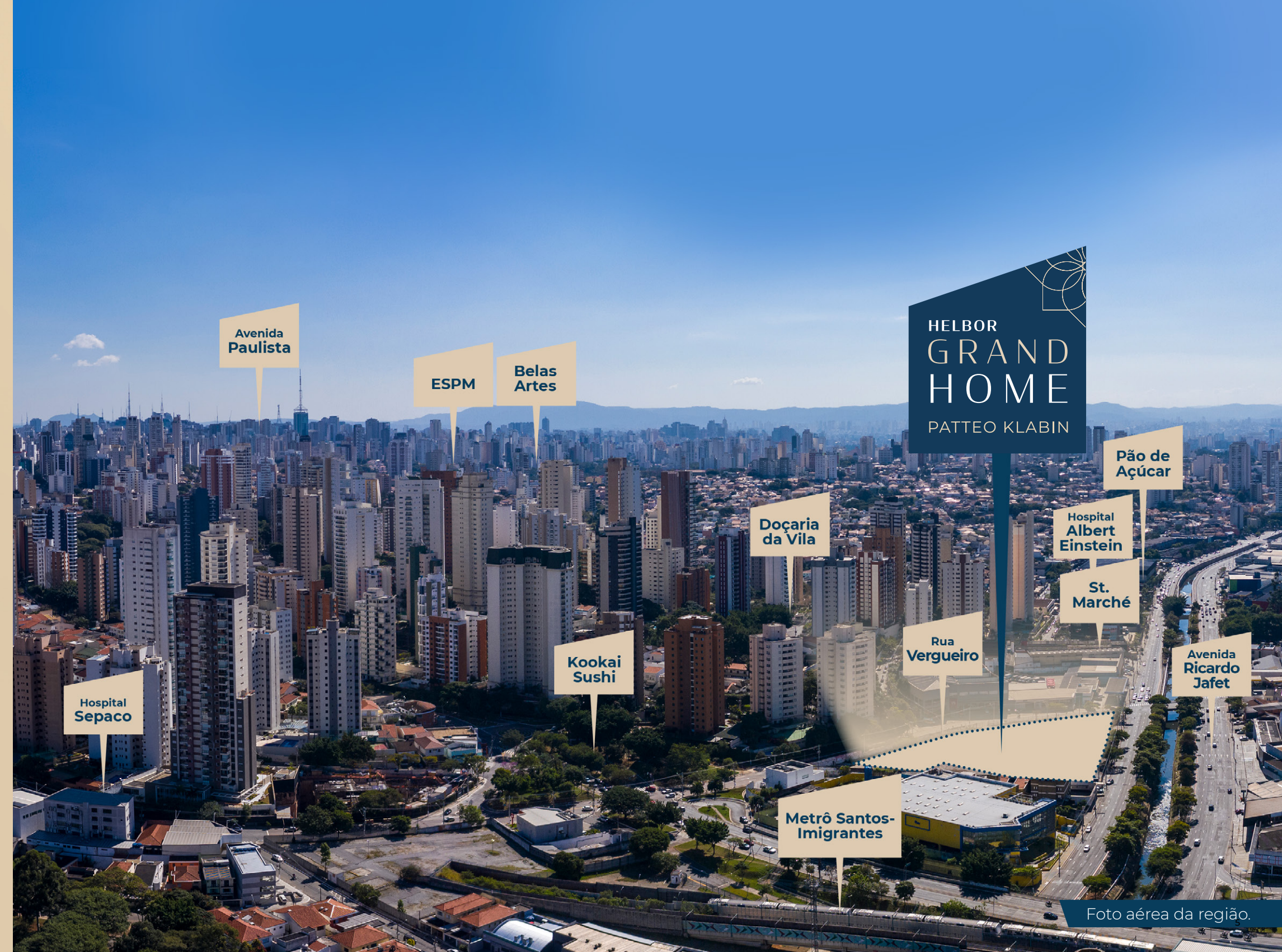
Foto aérea da região.

Gastronomia e entretenimento em um entorno cheio de charme.