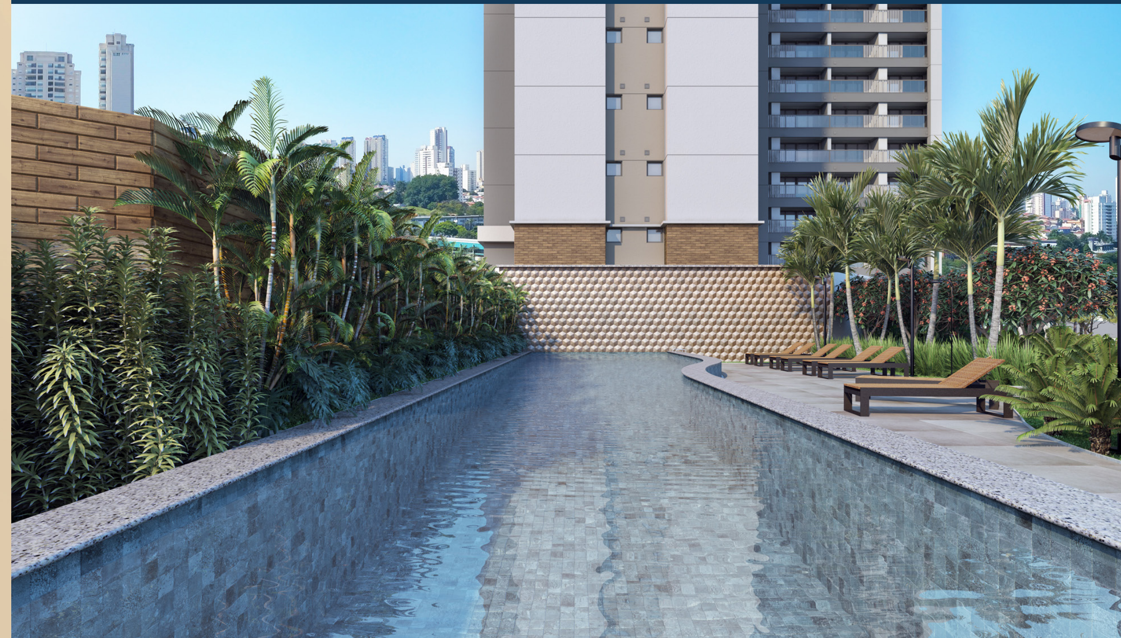
Perspectiva artística da piscina adulto.