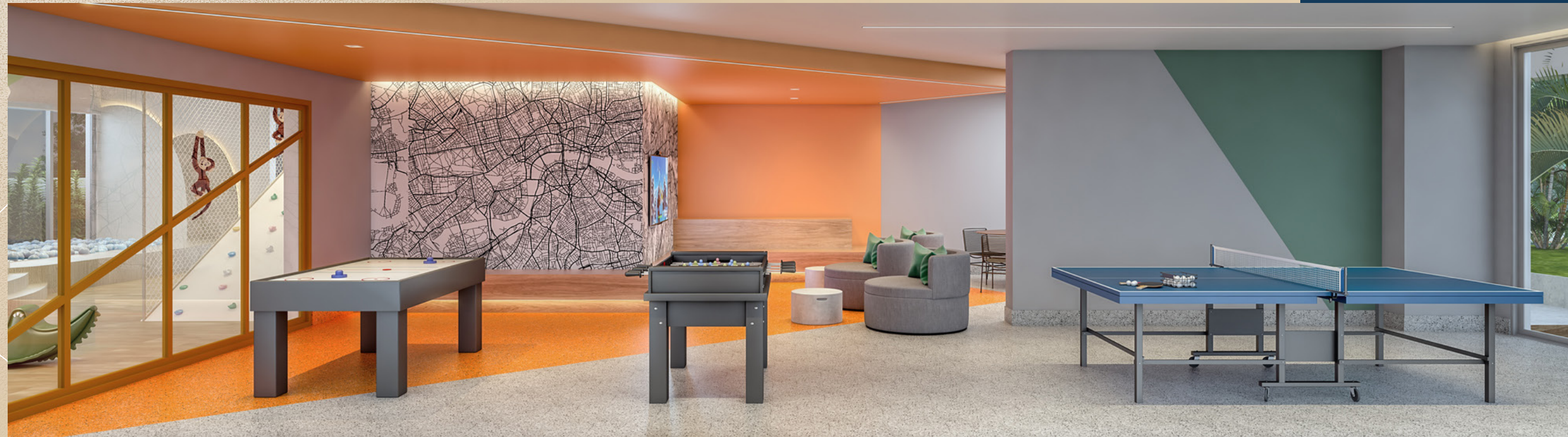
Perspectiva artística do salão de jogos.

Aproveite um salão de jogos que é um sonho de infância.