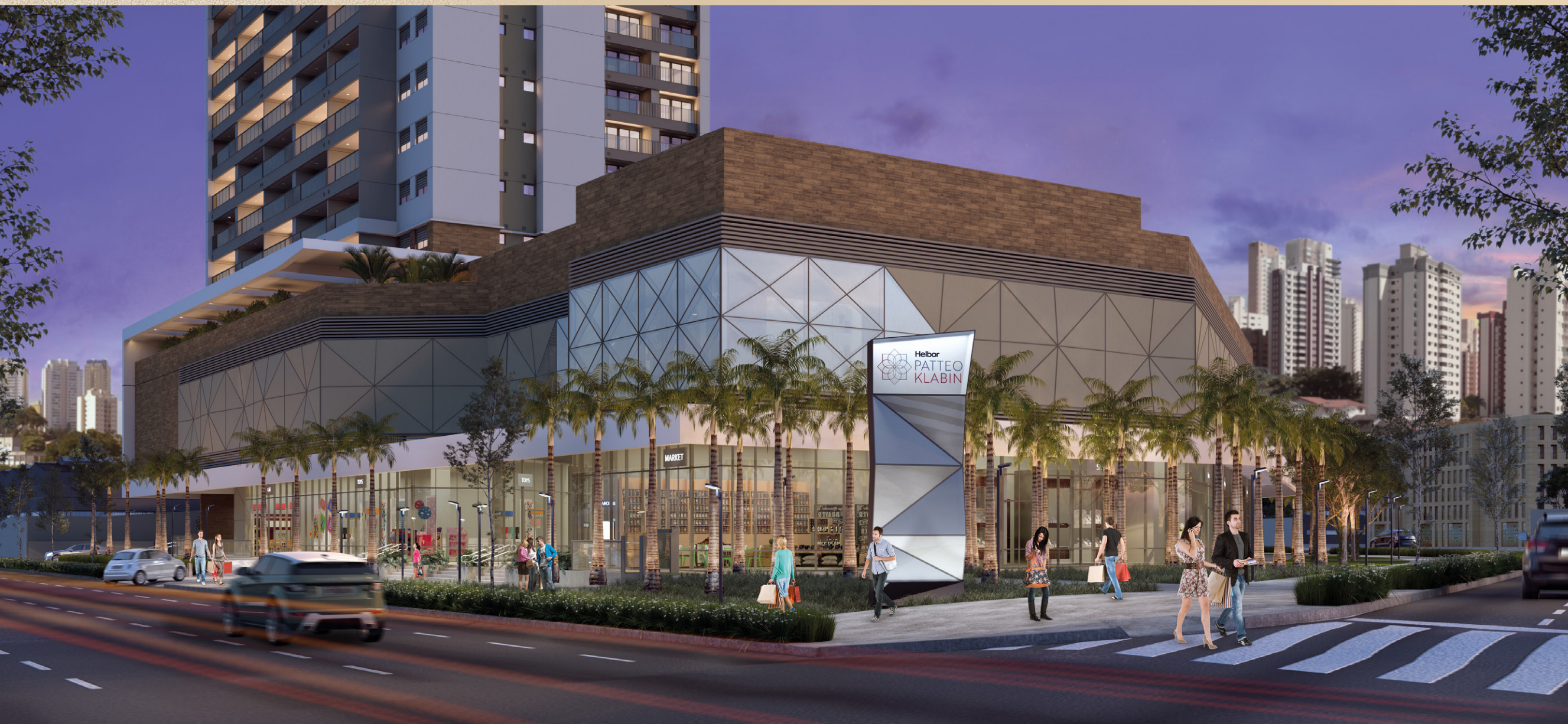
Perspectiva artística do acesso ao ComVem.

Tenha como vizinho um complexo de lojas e serviços para a sua família.