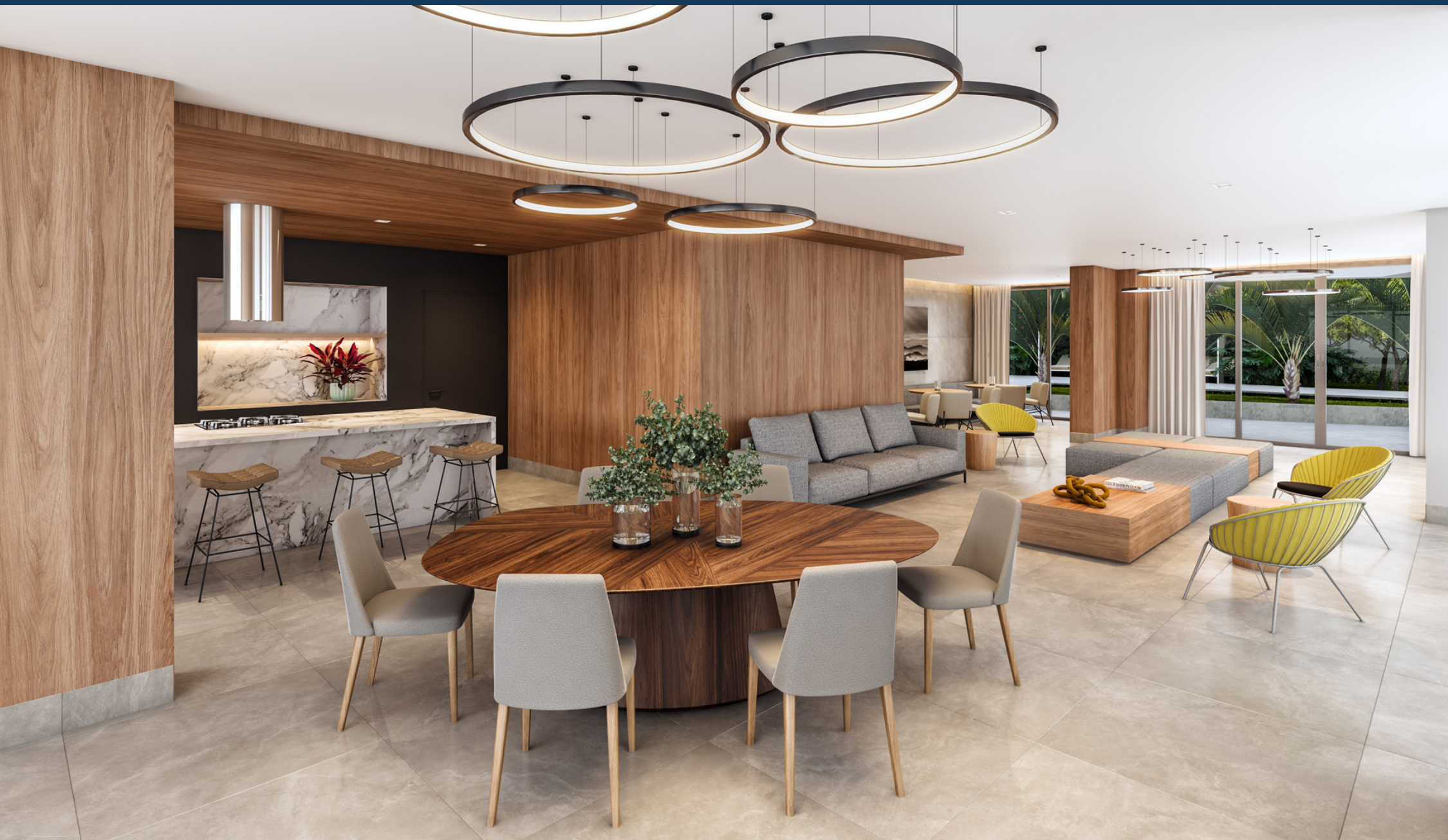
Perspectiva artística do espaço gourmet.

A vida que você sempre quis, com o bem-estar que você sempre sonhou.