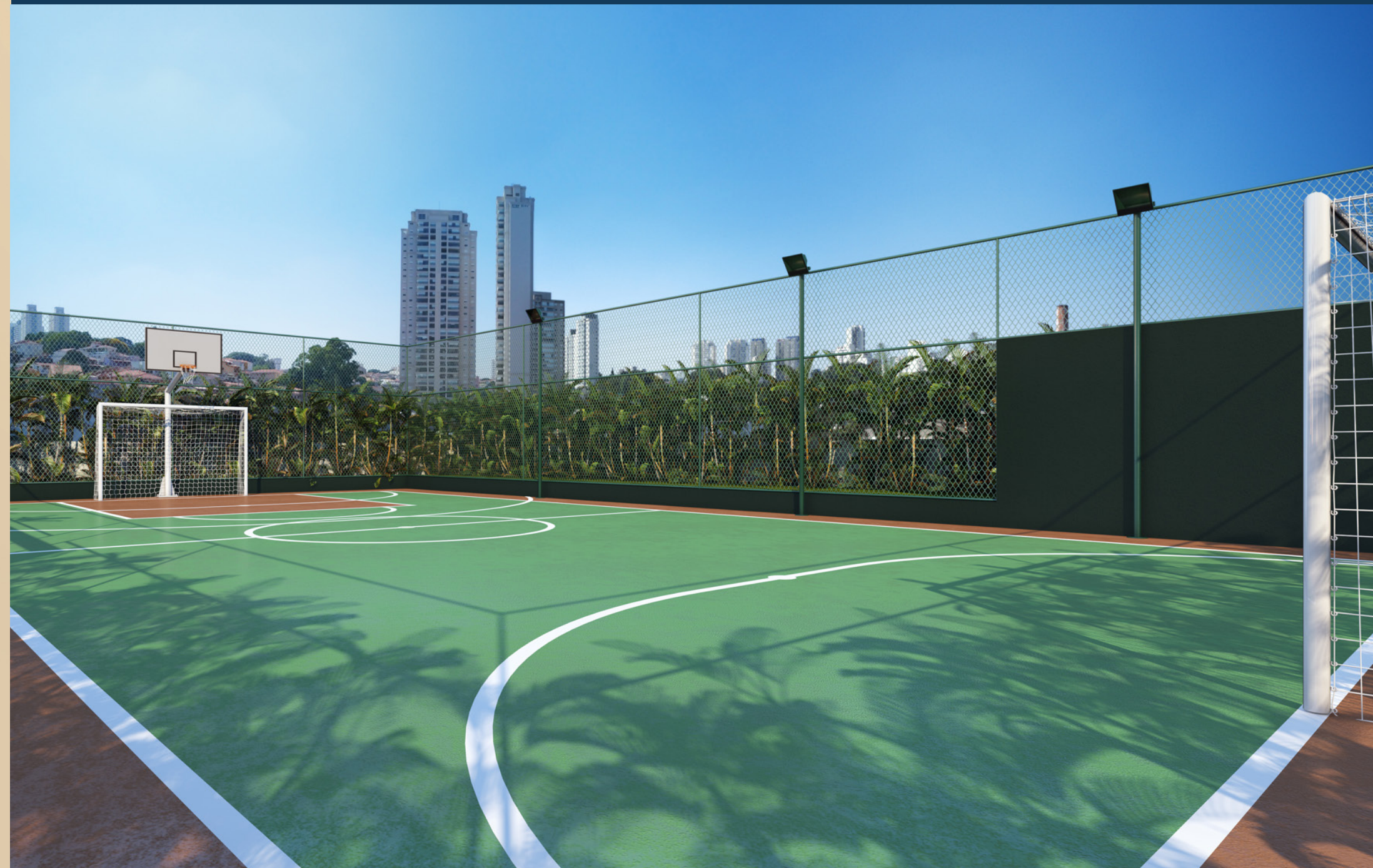
Perspectiva artística da quadra poliesportiva.