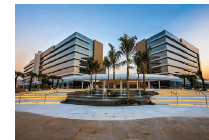
Helbor Patteo Mogilar Skymall & Offices Mogi das Cruzes - SP.