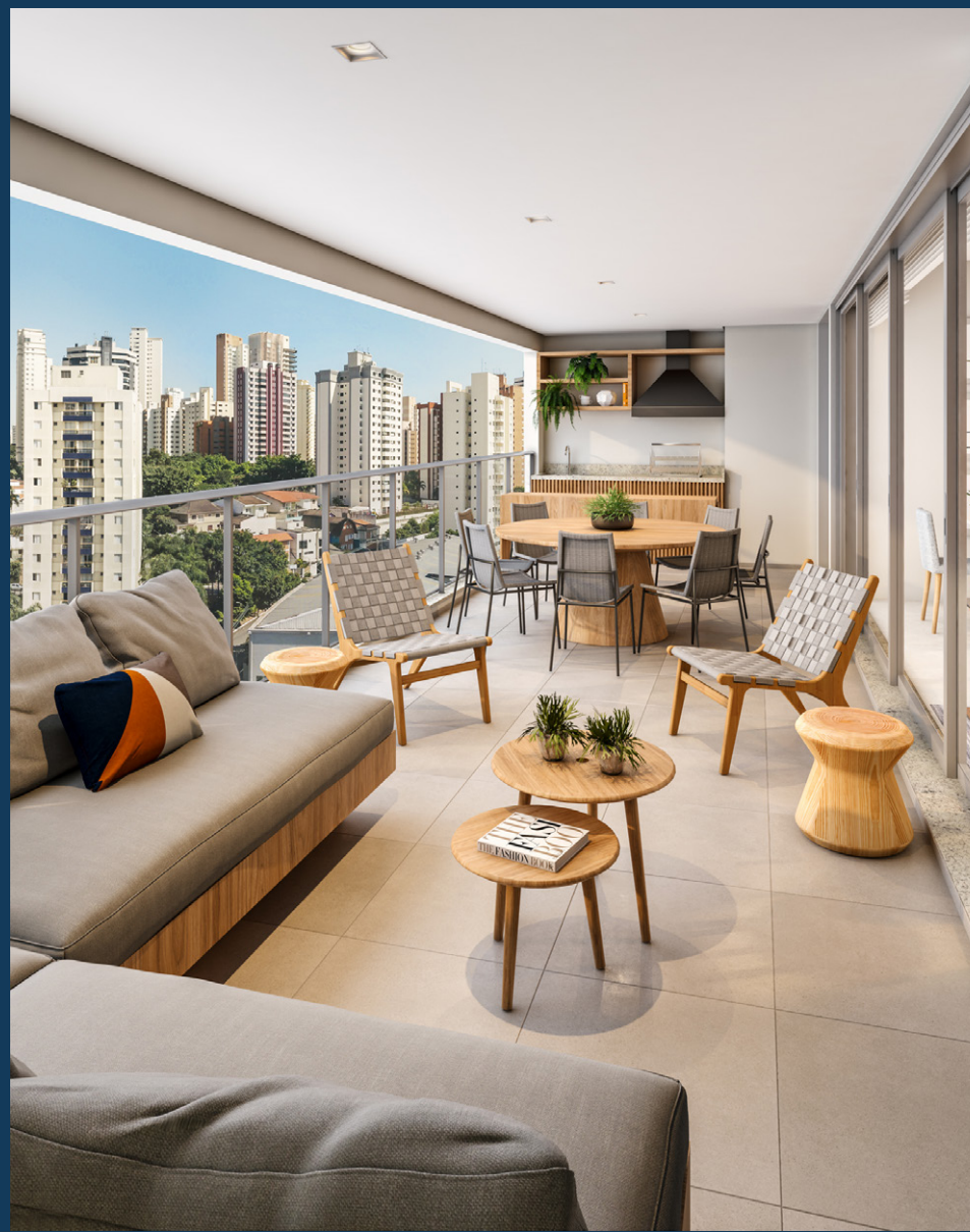
Perspectiva artística do terraço do apartamento tipo, 4 dormitórios (2 suítes) de 146m 2 privativos, finais 2 e 4 - torre A.