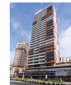
Helbor Nun Vila Nova São Paulo - SP.