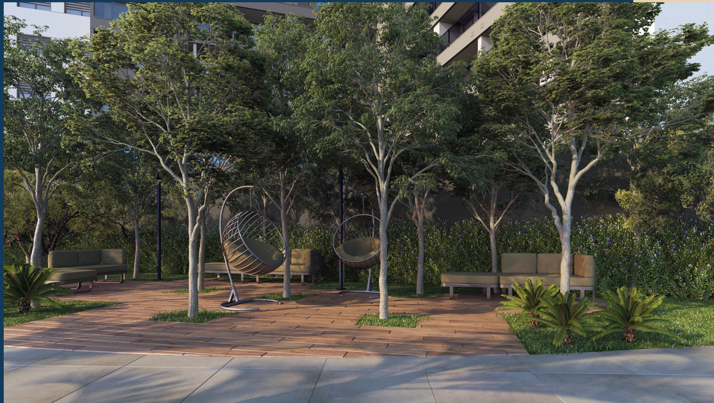
Perspectiva artística do estar externo.

Espaços perfeitos para receber a família e os amigos.