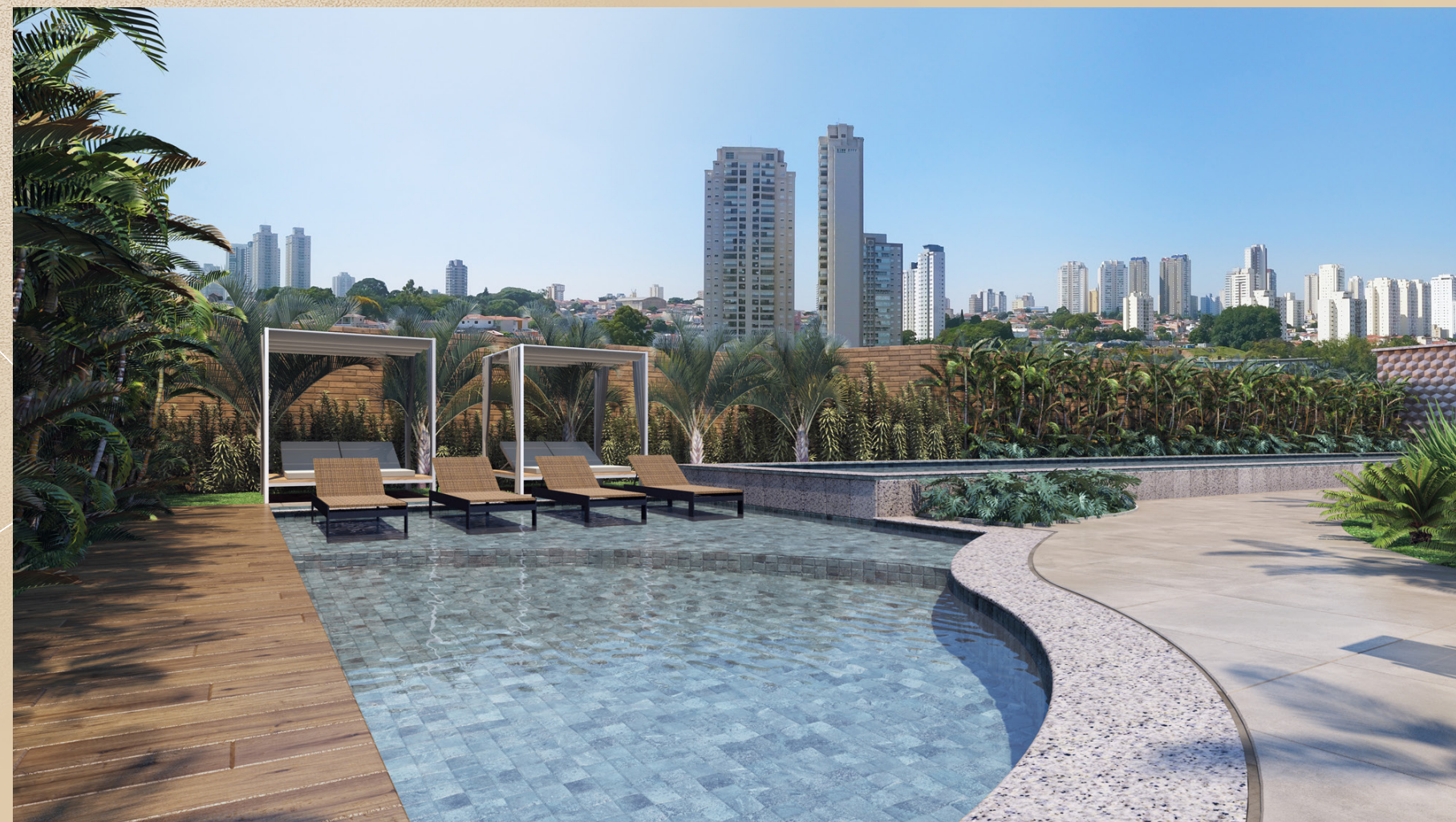
Perspectiva artística da piscina infantil.

Lazer completo e inúmeros motivos para sorrir todos os dias.