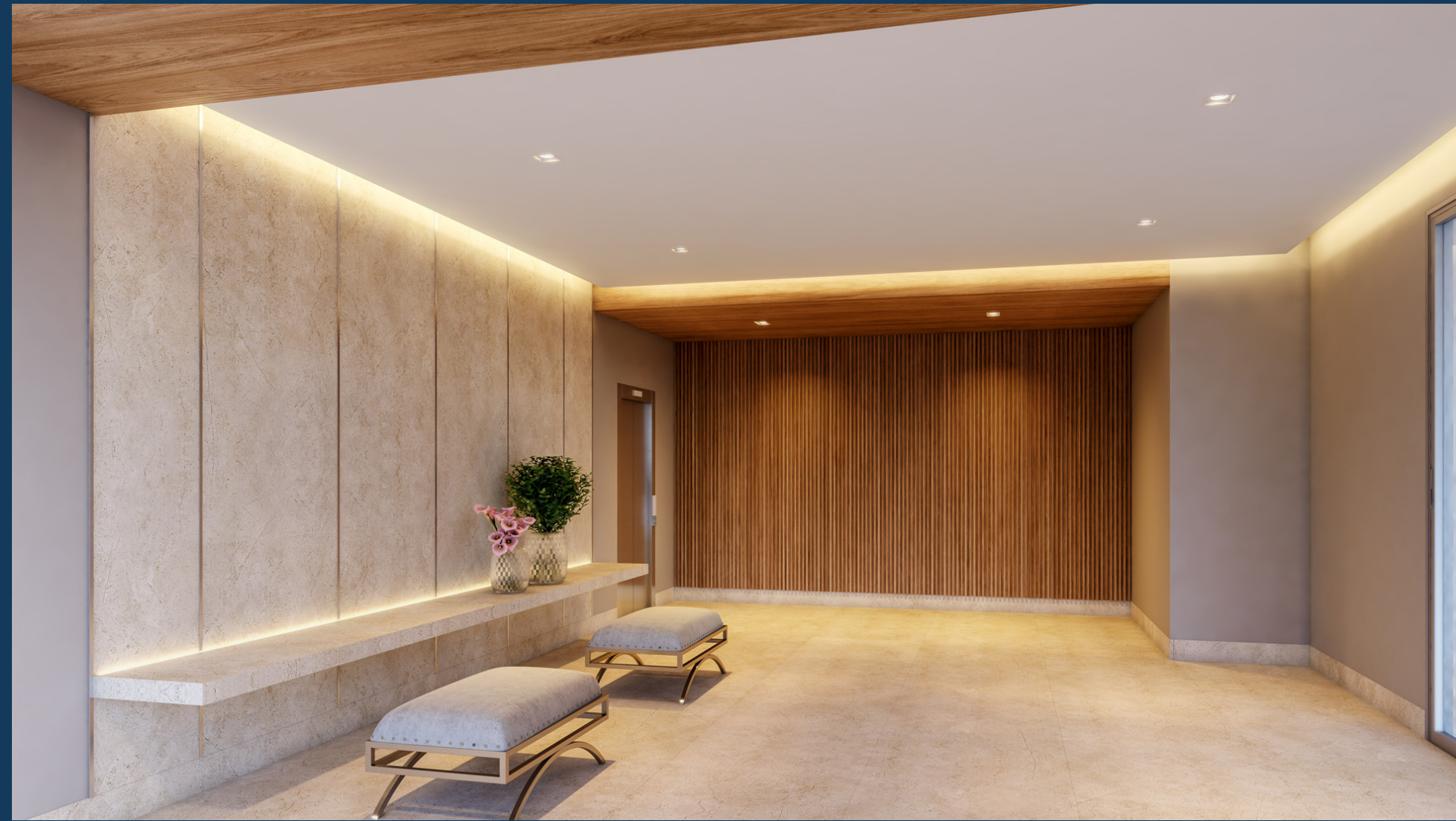
Perspectiva artística do hall social da torre A.

Toda vez que chegar em casa veja o tamanho da sua conquista.