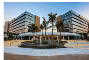
ComVem Patteo Mogilar.