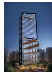
W São Paulo The Residences São Paulo – SP

Investindo continuamente em parcerias com conceituadas empresas do setor, a Toledo Ferrari visa consolidar a sua presença no mercado imobiliário brasileiro, contando com uma competente equipe de incorporação, gestão imobiliária e construção. Esses fatores resultaram em números expressivos de vendas, além da conquista de diversos prêmios relevantes do setor, como o Top Imobiliário e o Master Imobiliário, entre outros. Confiança, Solidez, Qualidade e Empreendedorismo. Estes são os valores da Toledo Ferrari.