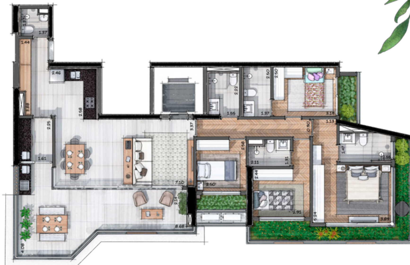
Planta padrão unidade 52, Torre Folhagem.