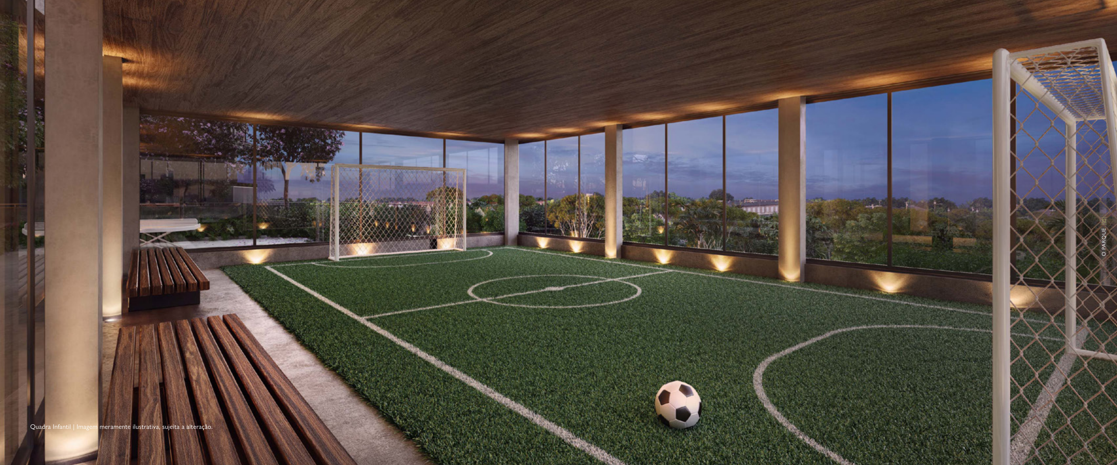
Quadra Infantil | Imagem meramente ilustrativa, sujeita a alteração.