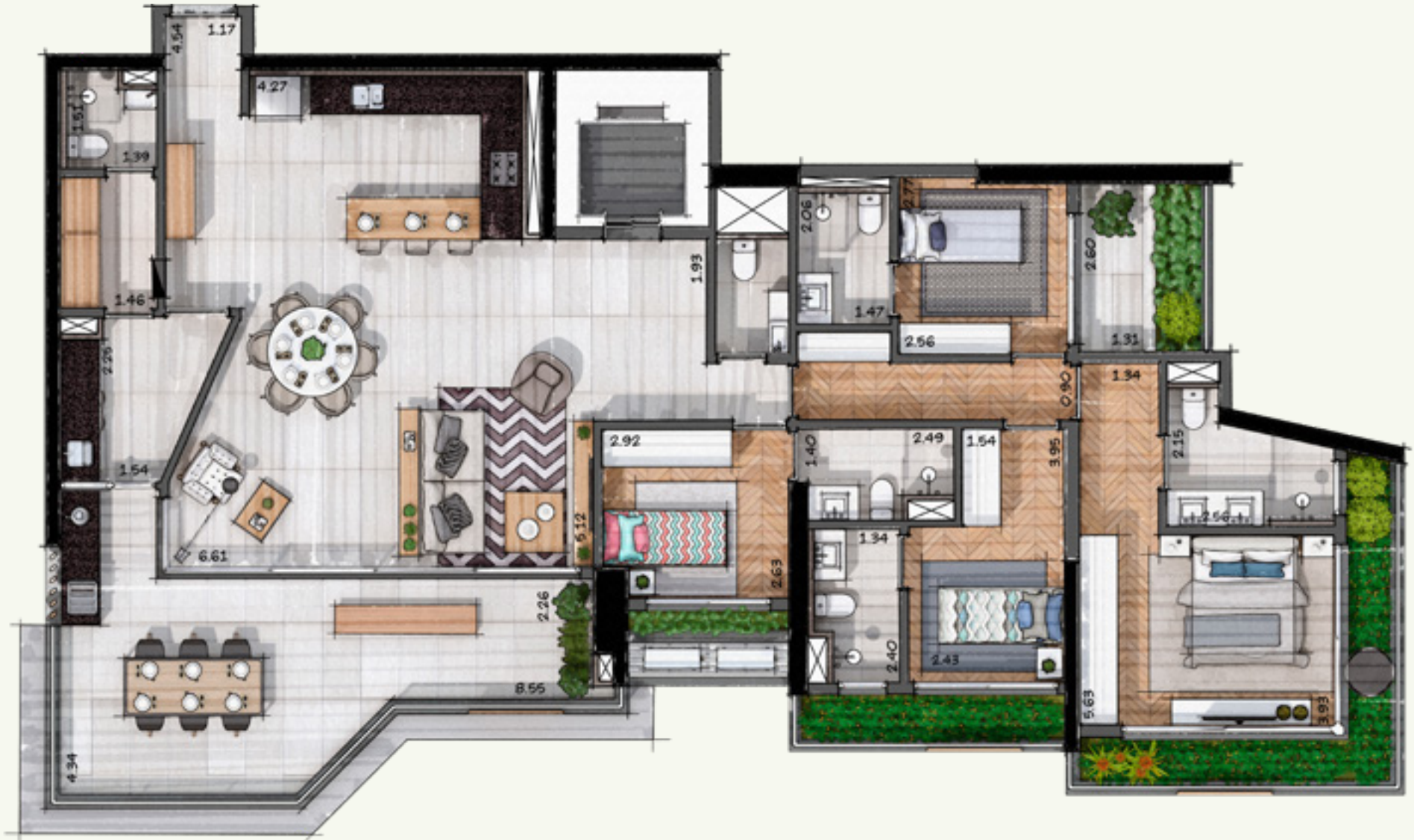
Planta padrão unidade 51, Torre Folhagem.