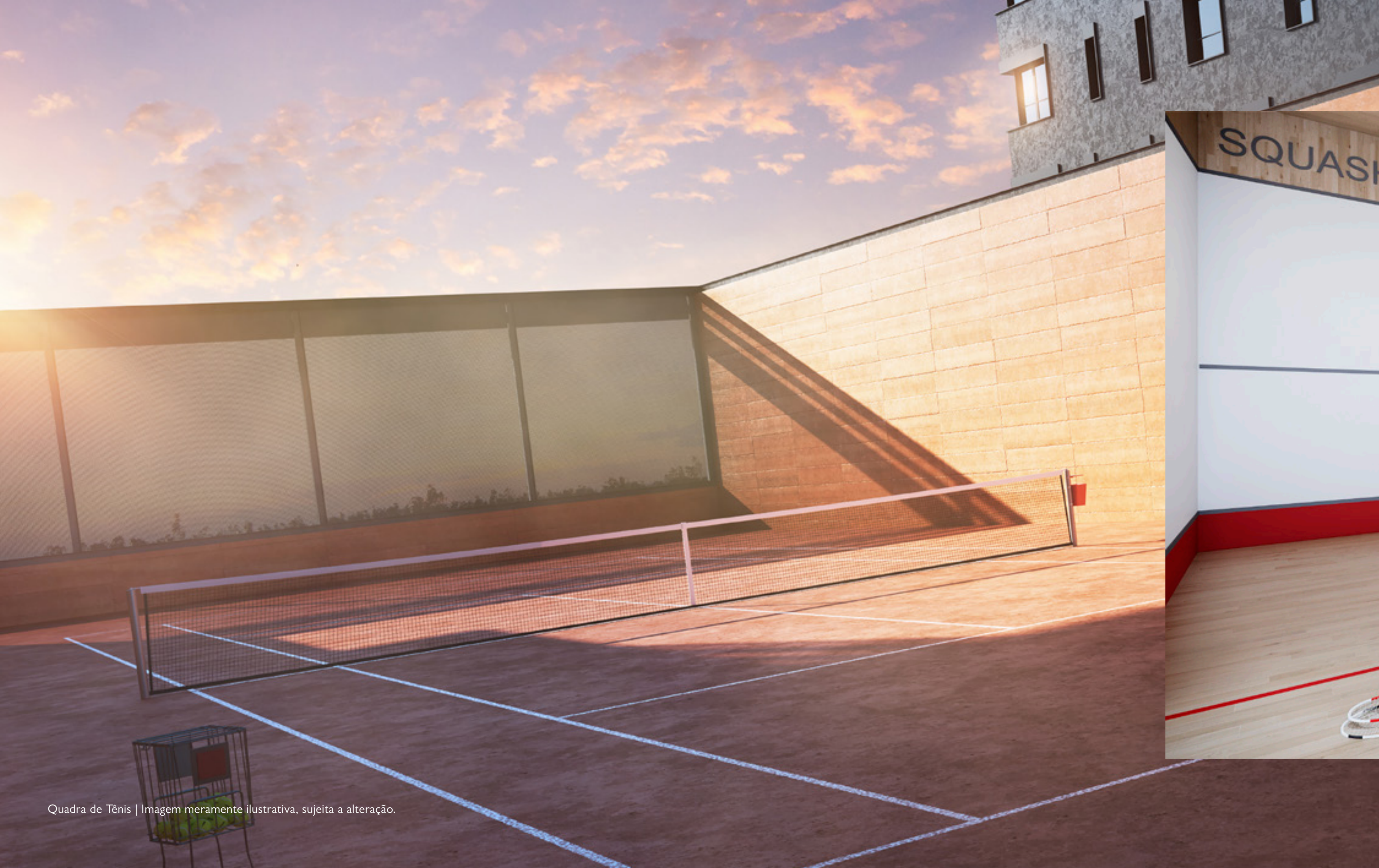
Quadra de Tênis | Imagem meramente ilustrativa, sujeita a alteração.