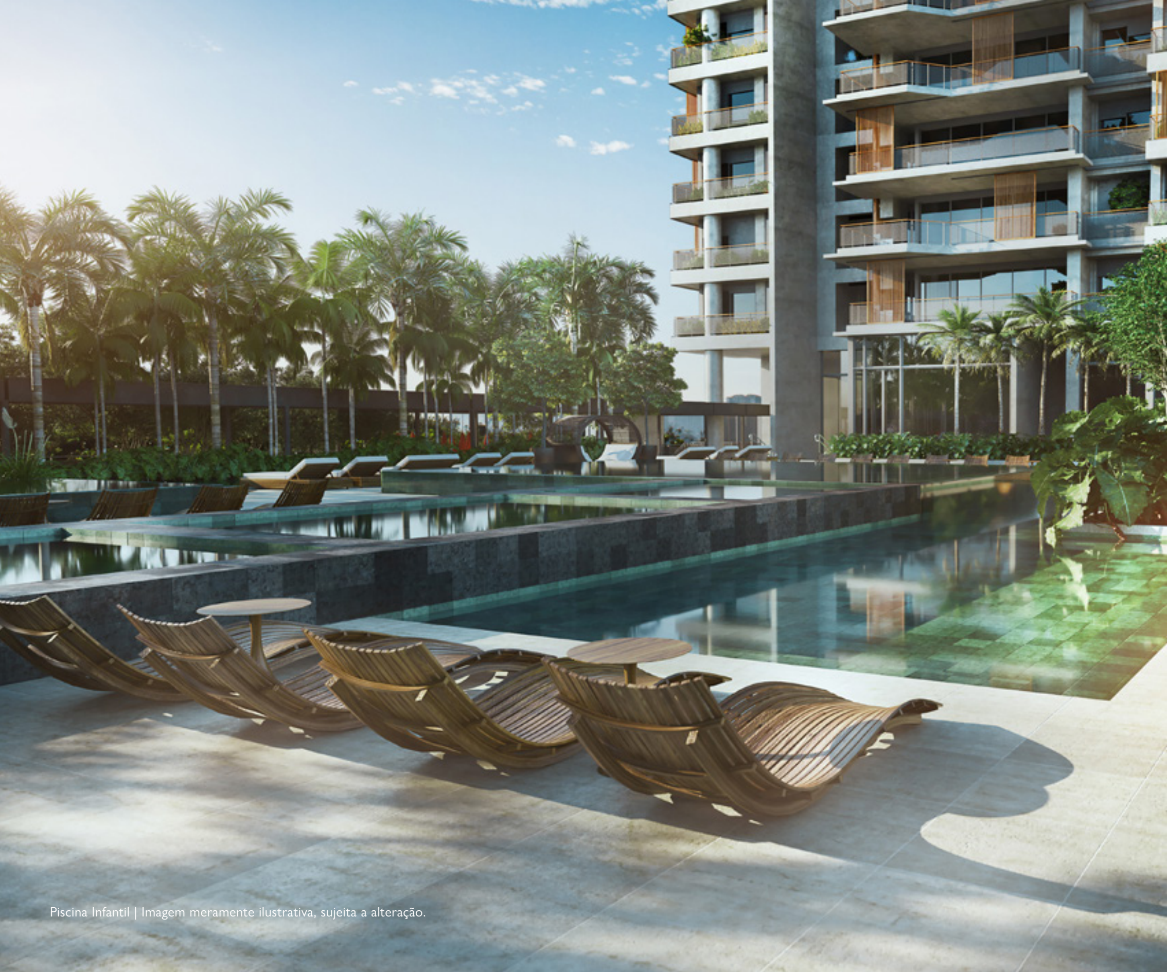
Piscina Infantil | Imagem meramente ilustrativa, sujeita a alteração.