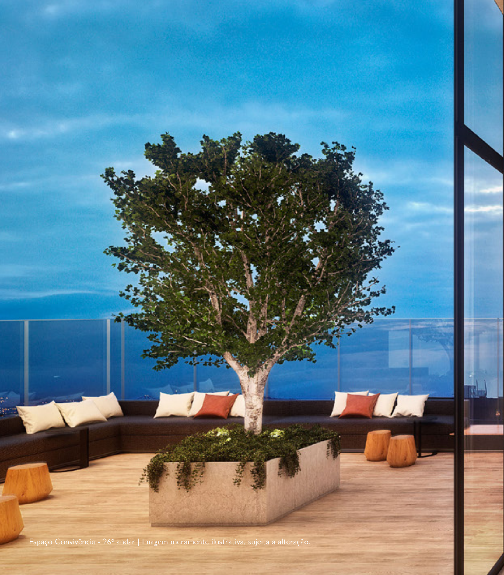
Espaço Convivência - 26º andar | Imagem meramente ilustrativa, sujeita a alteração.