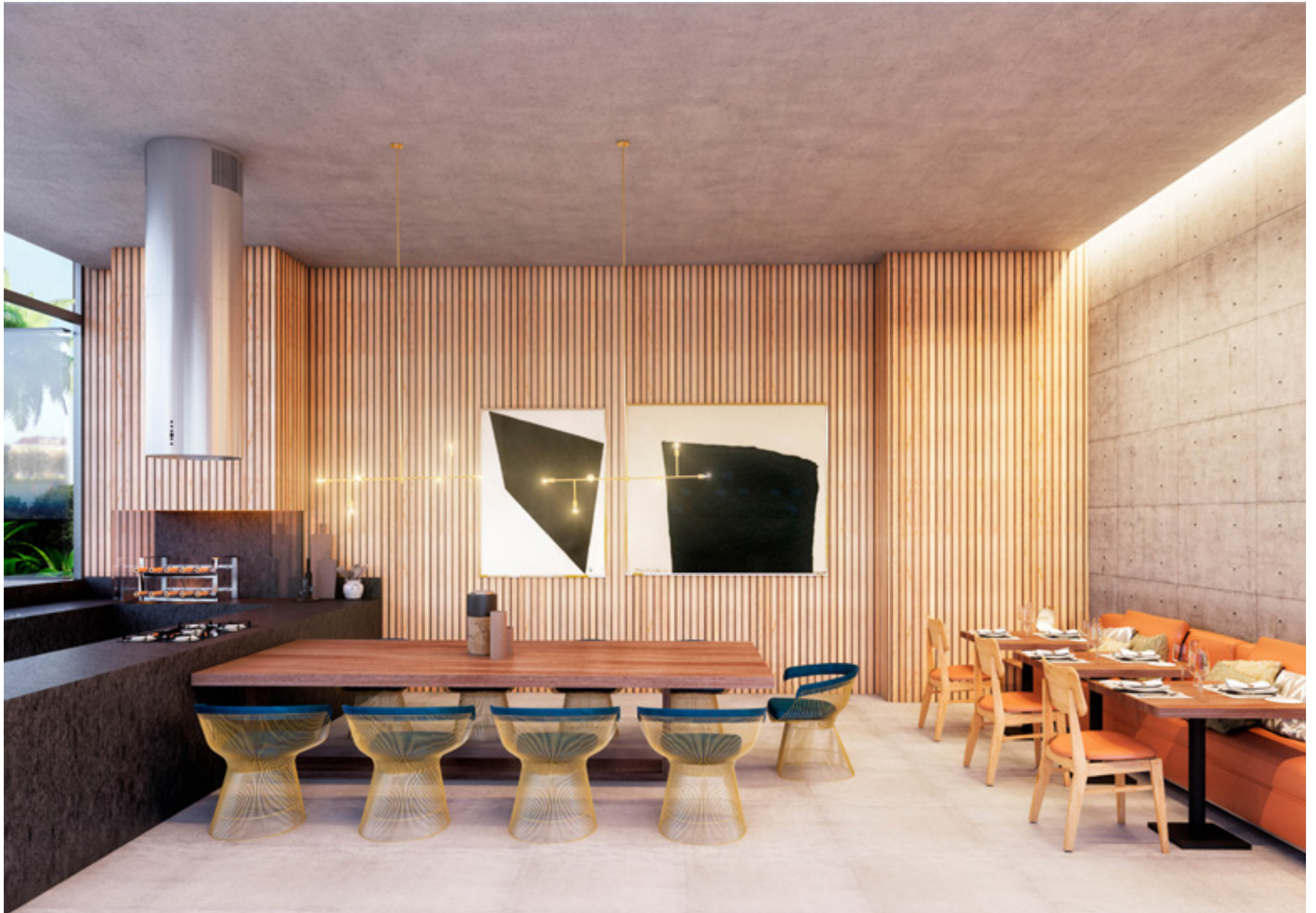
Lounge Gourmet | Imagem meramente ilustrativa, sujeita a alteração.