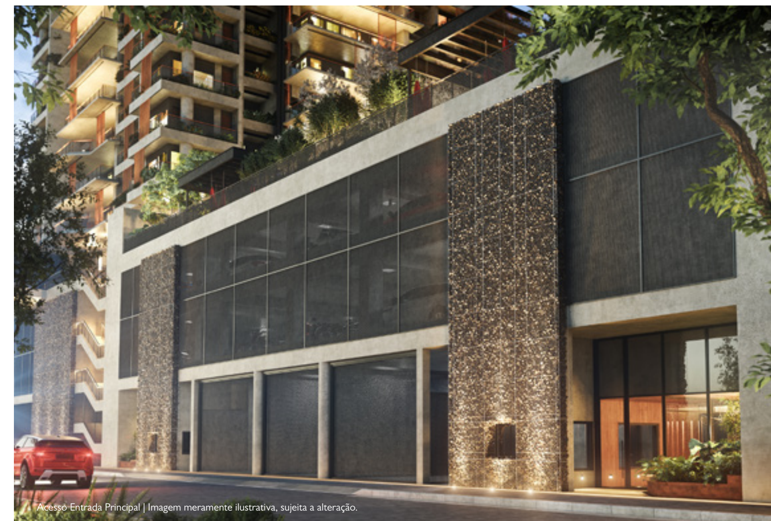
Acesso Entrada Principal | Imagem meramente ilustrativa, sujeita a alteração.