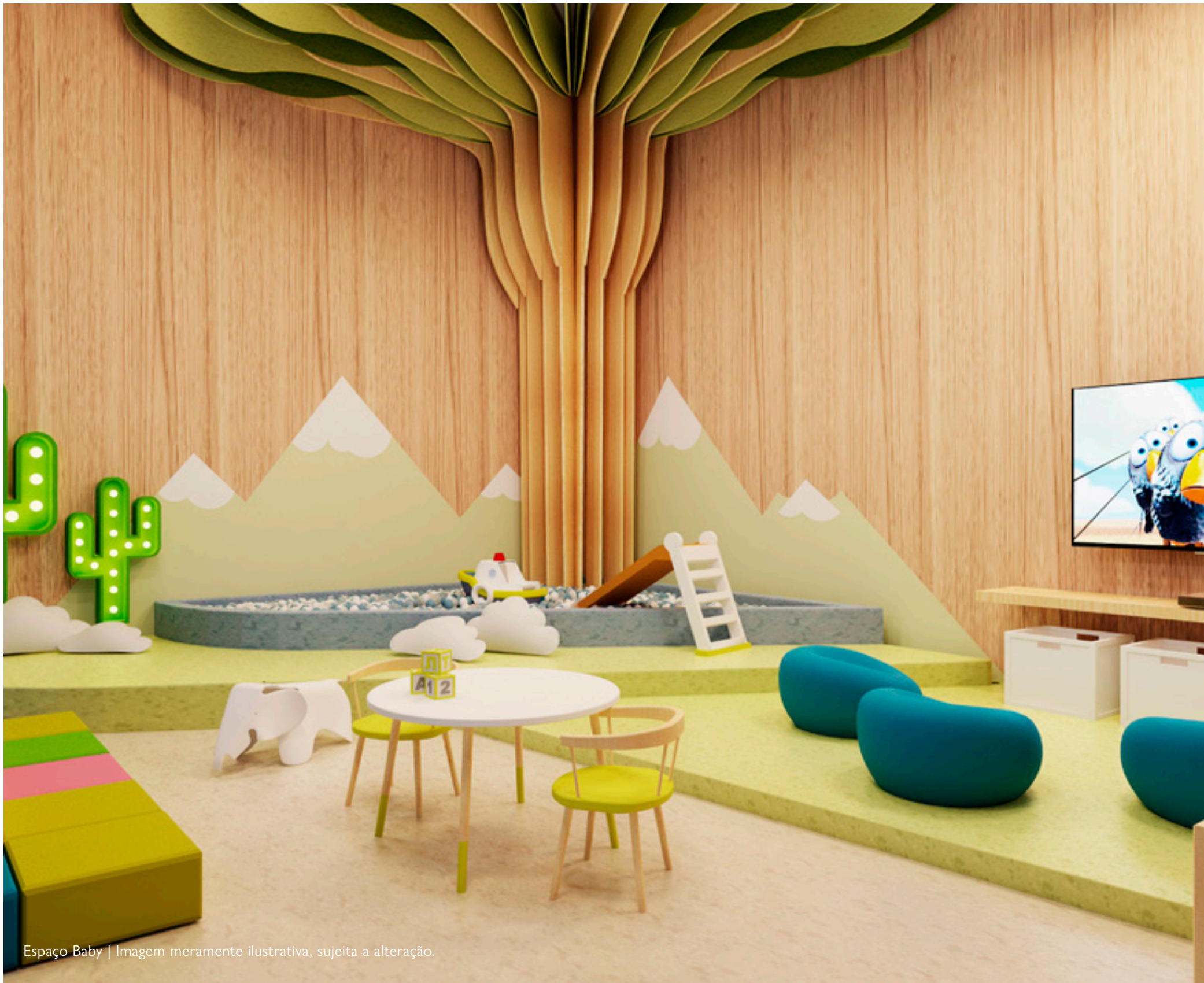
Espaço Baby | Imagem meramente ilustrativa, sujeita a alteração.