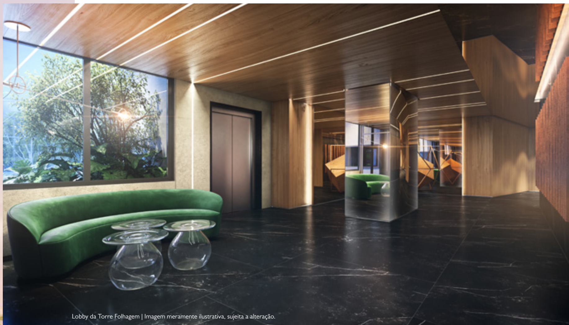
Lobby da Torre Folhagem | Imagem meramente ilustrativa, sujeita a alteração.

Viva em apartamentos amplos, de alto padrão e com acesso a espaços exclusivos d'O Parque.