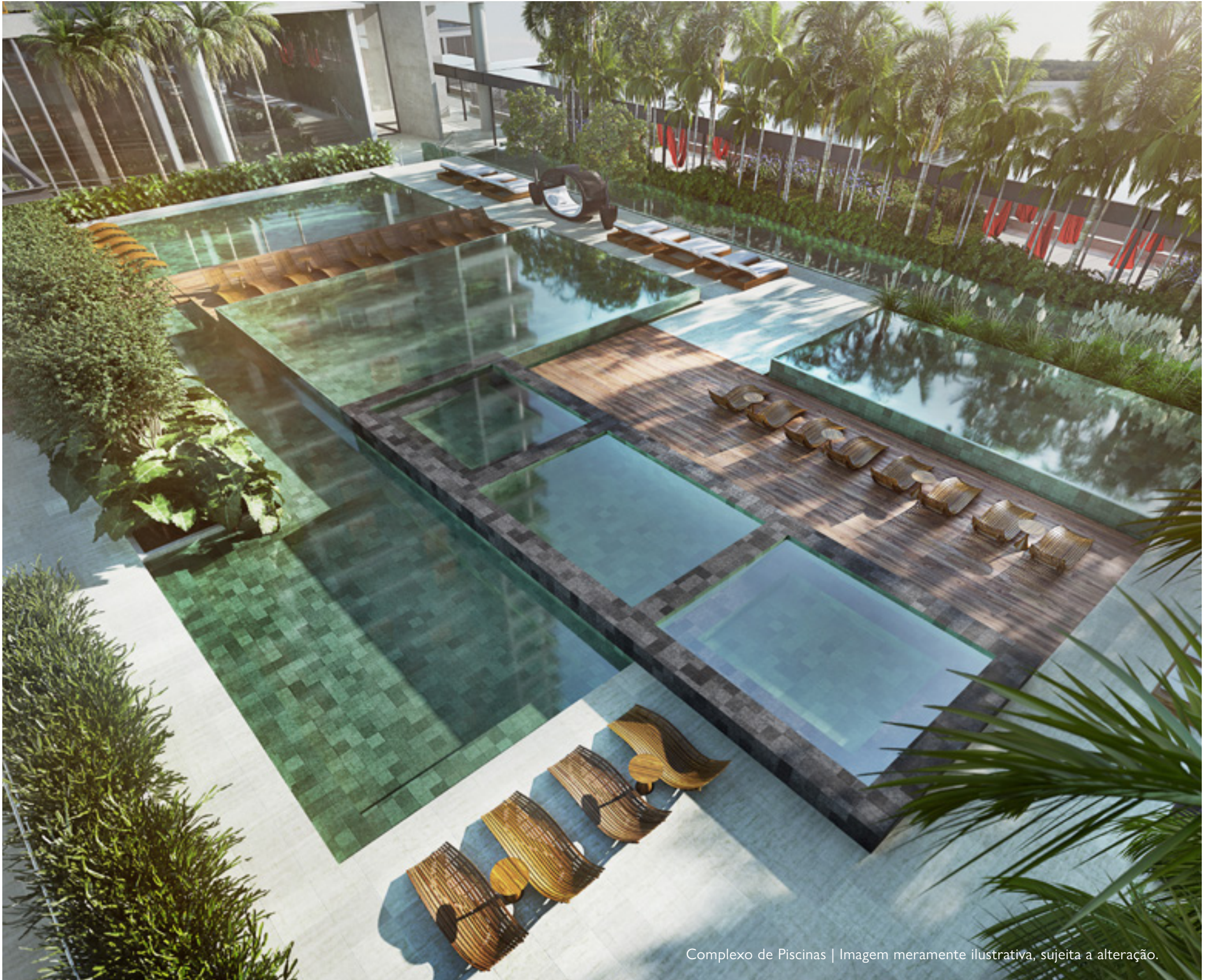
Complexo de Piscinas | Imagem meramente ilustrativa, sujeita a alteração.