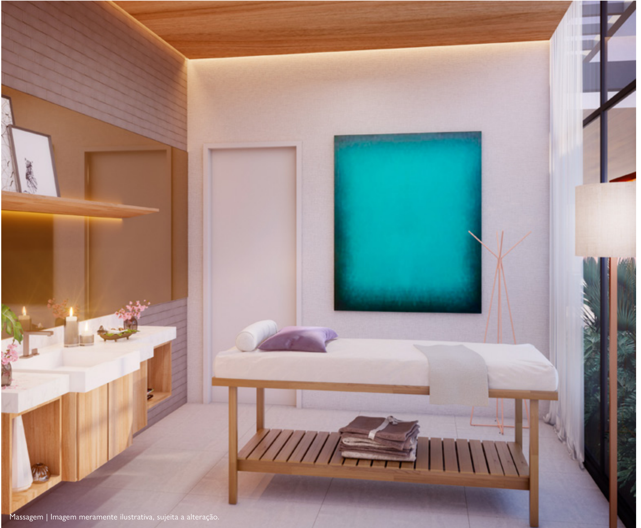
Massagem | Imagem meramente ilustrativa, sujeita a alteração.