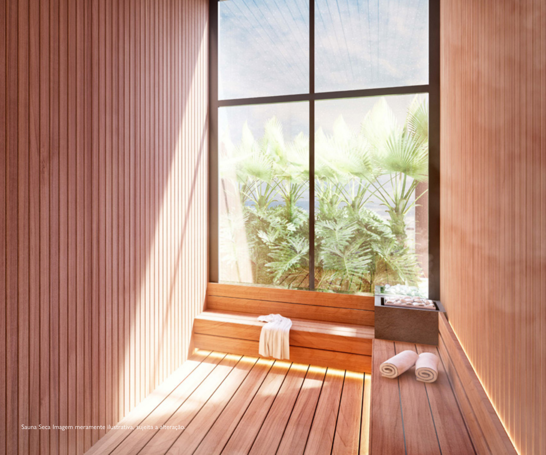
Sauna Seca Imagem meramente ilustrativa, sujeita a alteração.