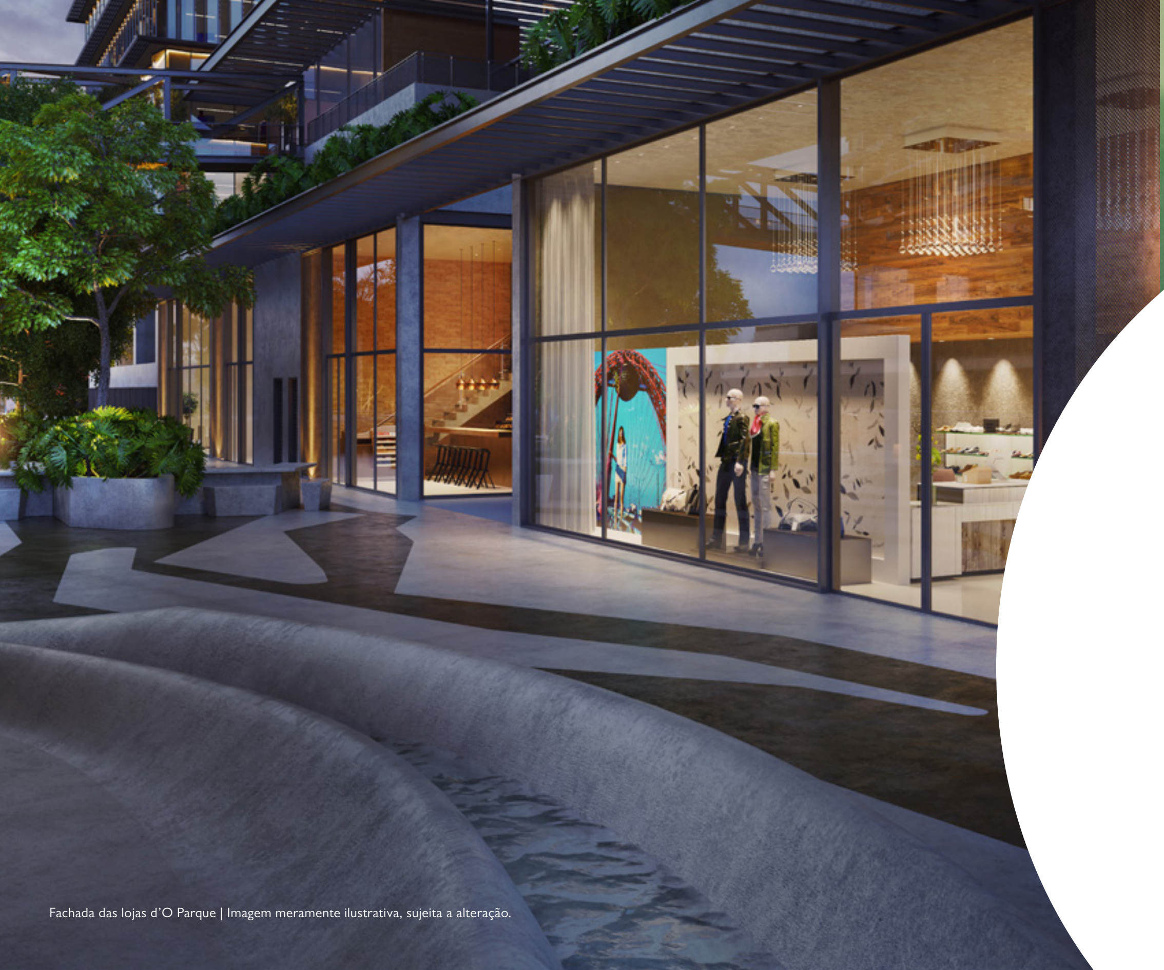
Fachada das lojas d'O Parque | Imagem meramente ilustrativa, sujeita a alteração.