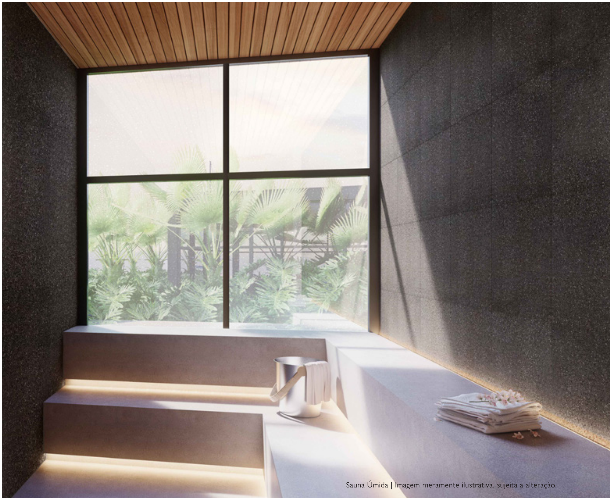
Sauna Úmida | Imagem meramente ilustrativa, sujeita a alteração.