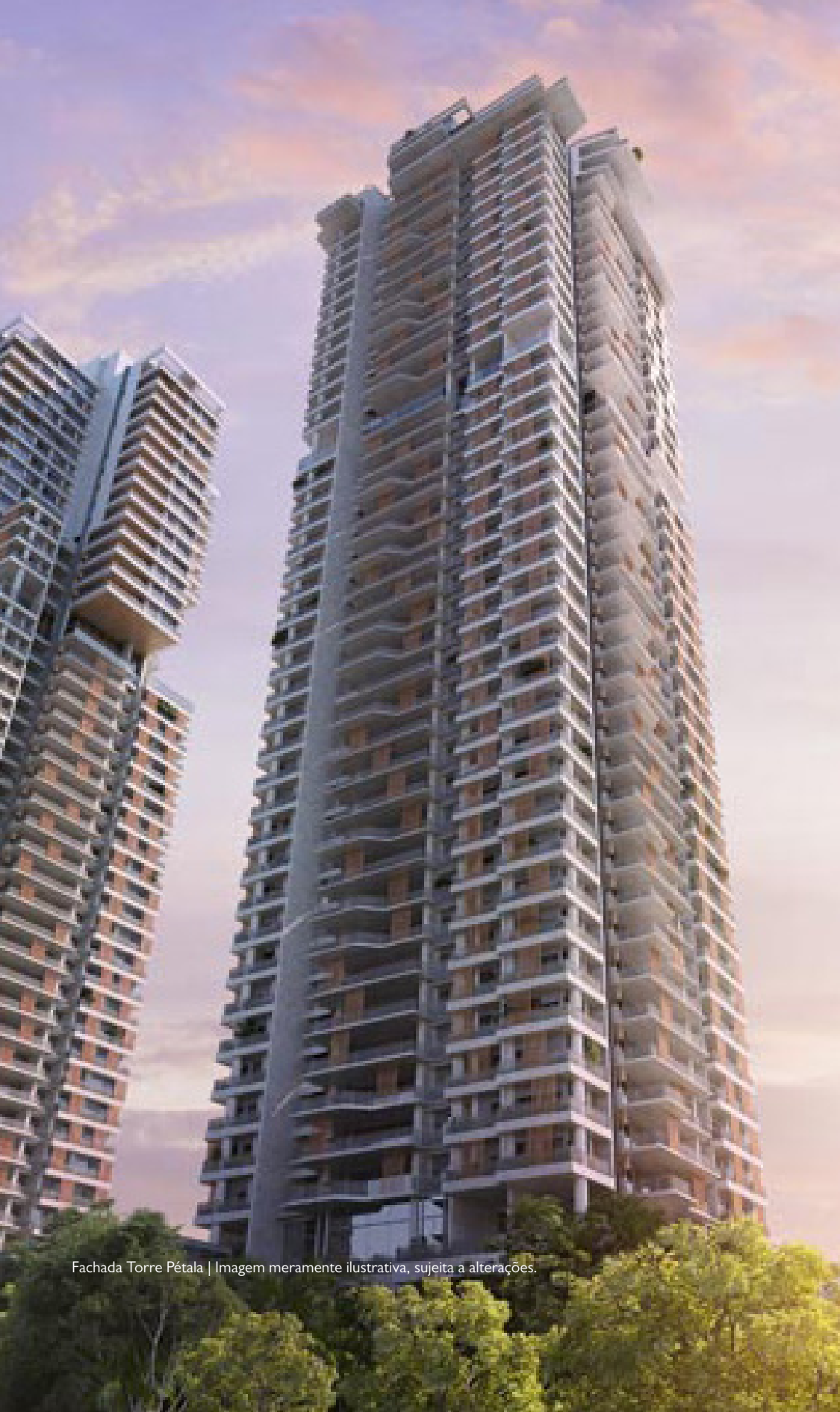
Fachada Torre Pétala | Imagem meramente ilustrativa, sujeita a alterações.