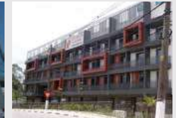
VIANNA ESPAÇOS MODULARES