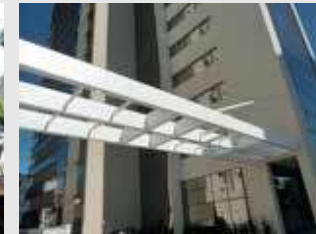
SIDE VALE OFFICES