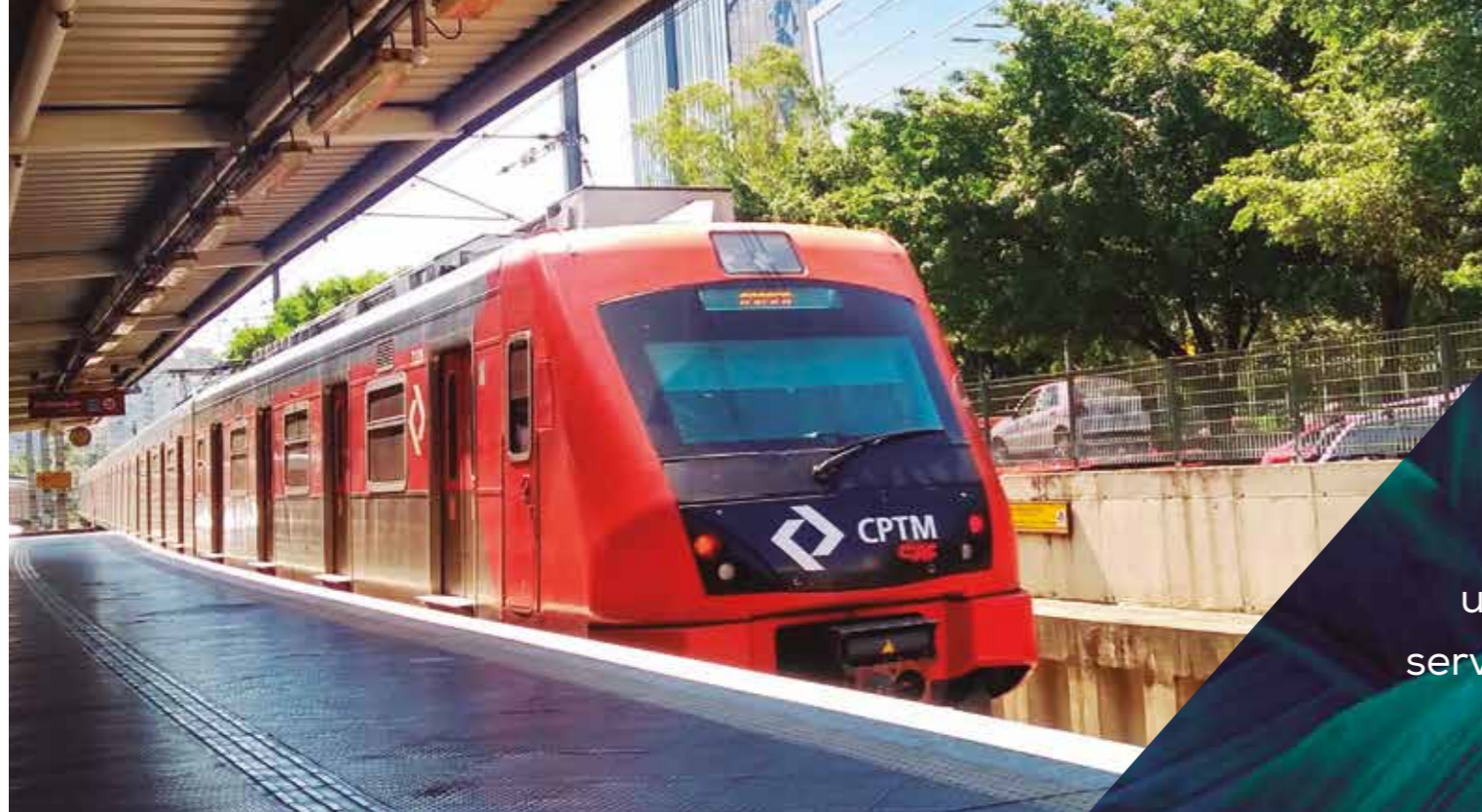
Estação Osasco • CPTM

A excelente localização do THE WAY reúne todas as características que tornarão seus dias mais práticos e dinâmicos. Uma região em constante desenvolvimento, com grande potencial de valorização, pronta para lhe oferecer um leque de opções de comércios, serviços, entretenimento e lazer.