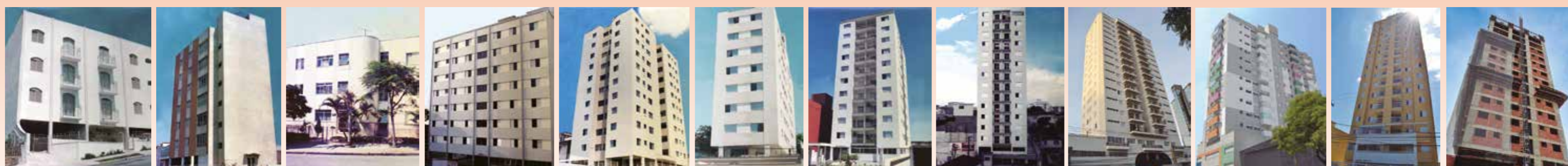
ED. MARIANGELA ED. DONA DORACY ED. ROSA FRANCISQUETTI ED. EDGAR MARINHO ED. MORADA DOS NOBRES ED. VITÓRIA RÉGIA ED. MINAS GERAIS ED. BRASÍLIA ED. LIFE ED. FORT RES. LIBERTY ED. SOLE (Em Construção)