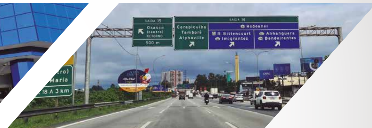
Rodovia Pres. Castelo Branco