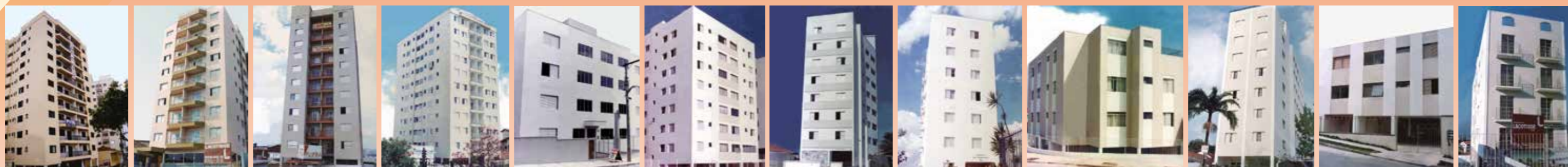
ED. FLORENÇA ED. PARIS ED. FLÓRIDA ED. SÃO PAULO ED. ILHA VERDE ED. MORADA DO SOL ED. KARLA ED. SÃO FERNANDO ED. POÇOS DE CALDAS ED. RENATA ED. JUSTINA B. CHRISTIANO ED. NEUSA MARIA