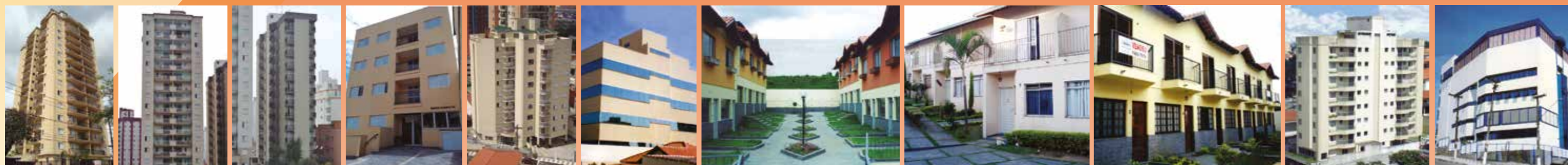
RES. PIAZZA NAVONA BELLE MAISON RES. ED. GOLDEN PLACE ED. PLENNUS ED. ÁUSTRIA ED. COMERCIAL COND. COLINAS DI SIENA COND. VILLE DE FRANCE COND. VILA DE VENEZIA ED. SANTO A.DE PÁDOVA COLÉGIO OBJETIVO

Fundada em maio de 1977, a Construtora Lacotisse mantém, ao longo desses anos, seu padrão de qualidade, podendo, com isso, oferecer aos seus clientes o melhor de Osasco. A Empresa atende a todos os critérios de qualidade, cumprindo, rigorosamente, os compromissos firmados e procurando sempre atender as expectativas do cliente, em relação à qualidade de seus imóveis e prazo de entrega.