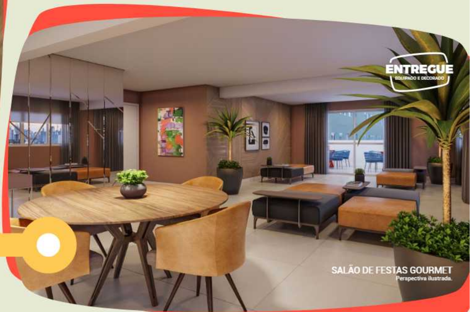
SALÃO DE FESTAS GOURMET Perspectiva ilustrada.