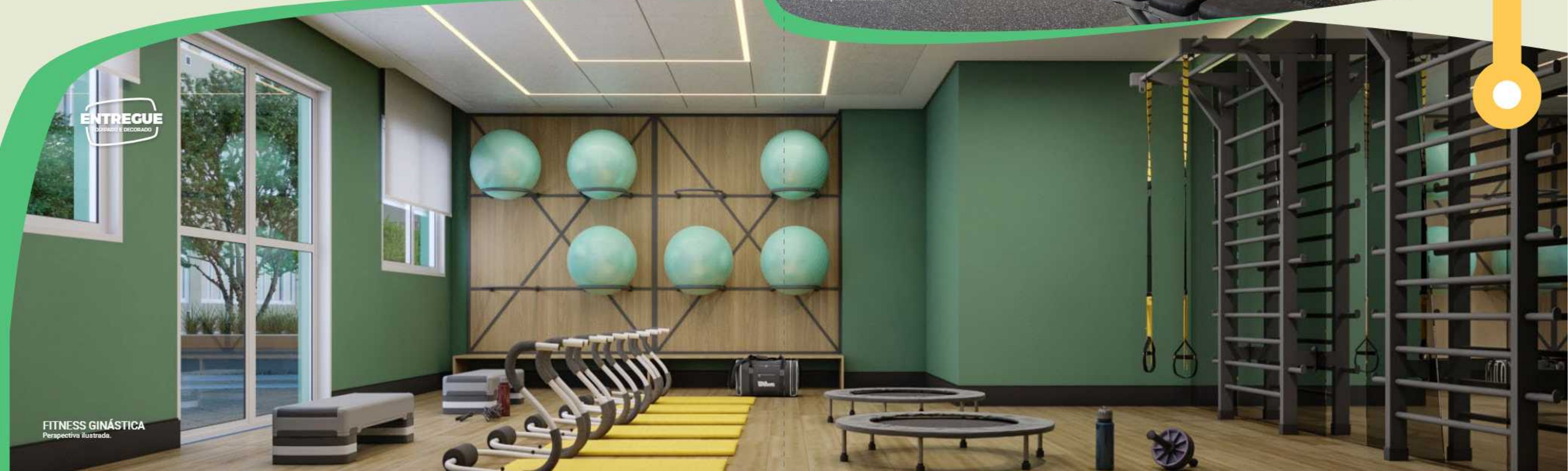
FITNESS GINÁSTICA Perspectiva ilustrada.