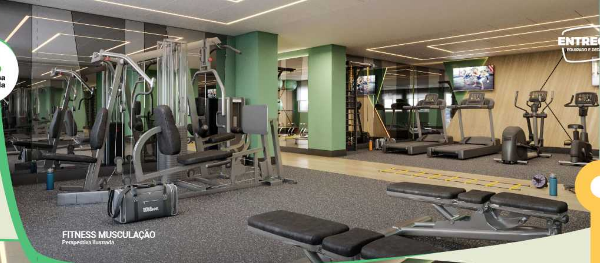
FITNESS MUSCULAÇÃO Perspectiva ilustrada.