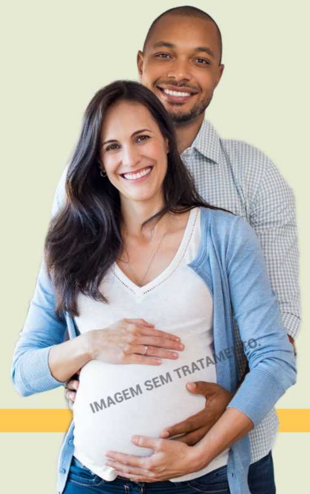
IMAGEM SEM TRATAMENTO

Portaria com segurança 24h para você e sua família.