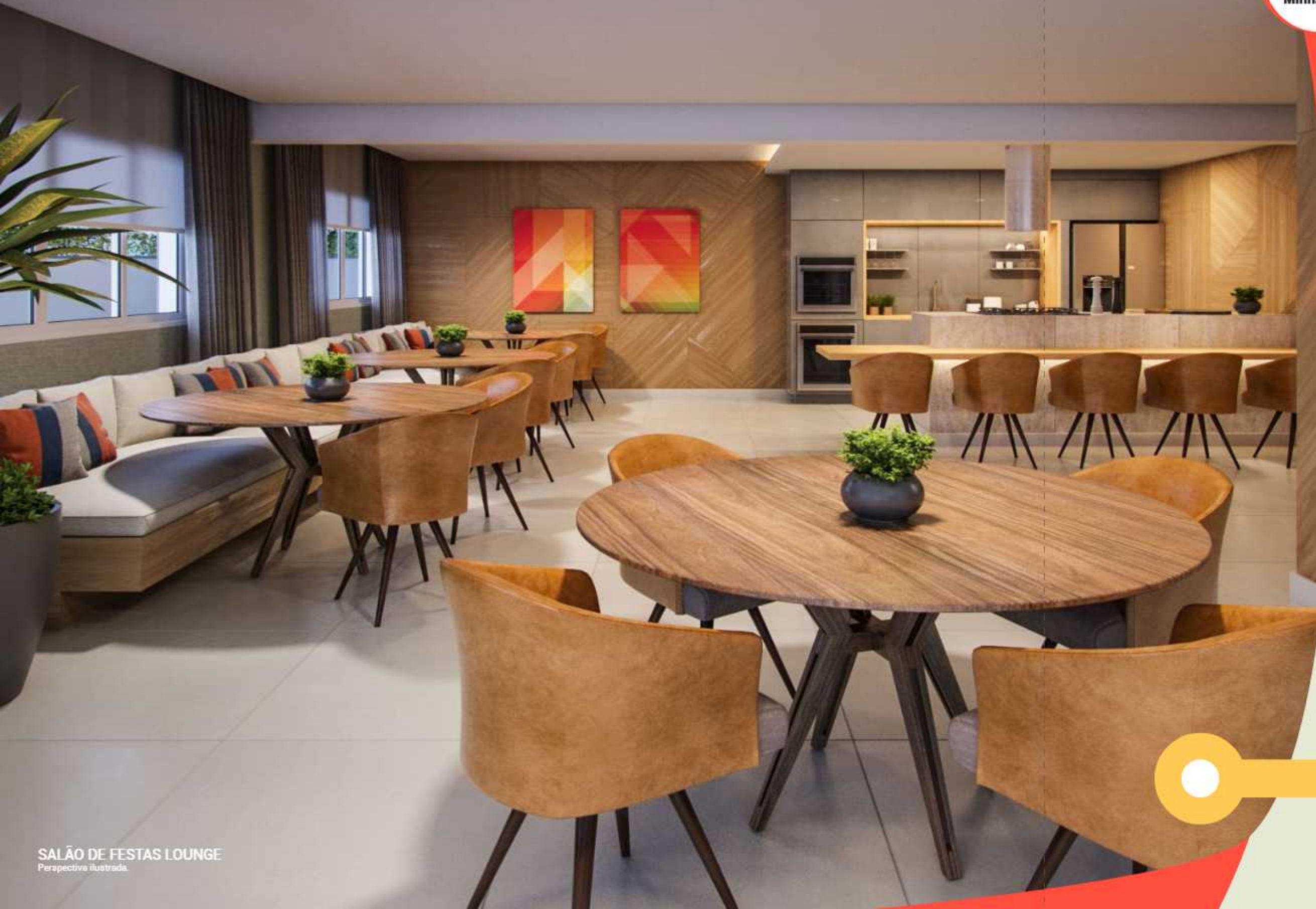
SALÃO DE FESTAS LOUNGE Perspectiva ilustrada.

Salão de festas equipado para que todos os seus convidados se sintam em casa.