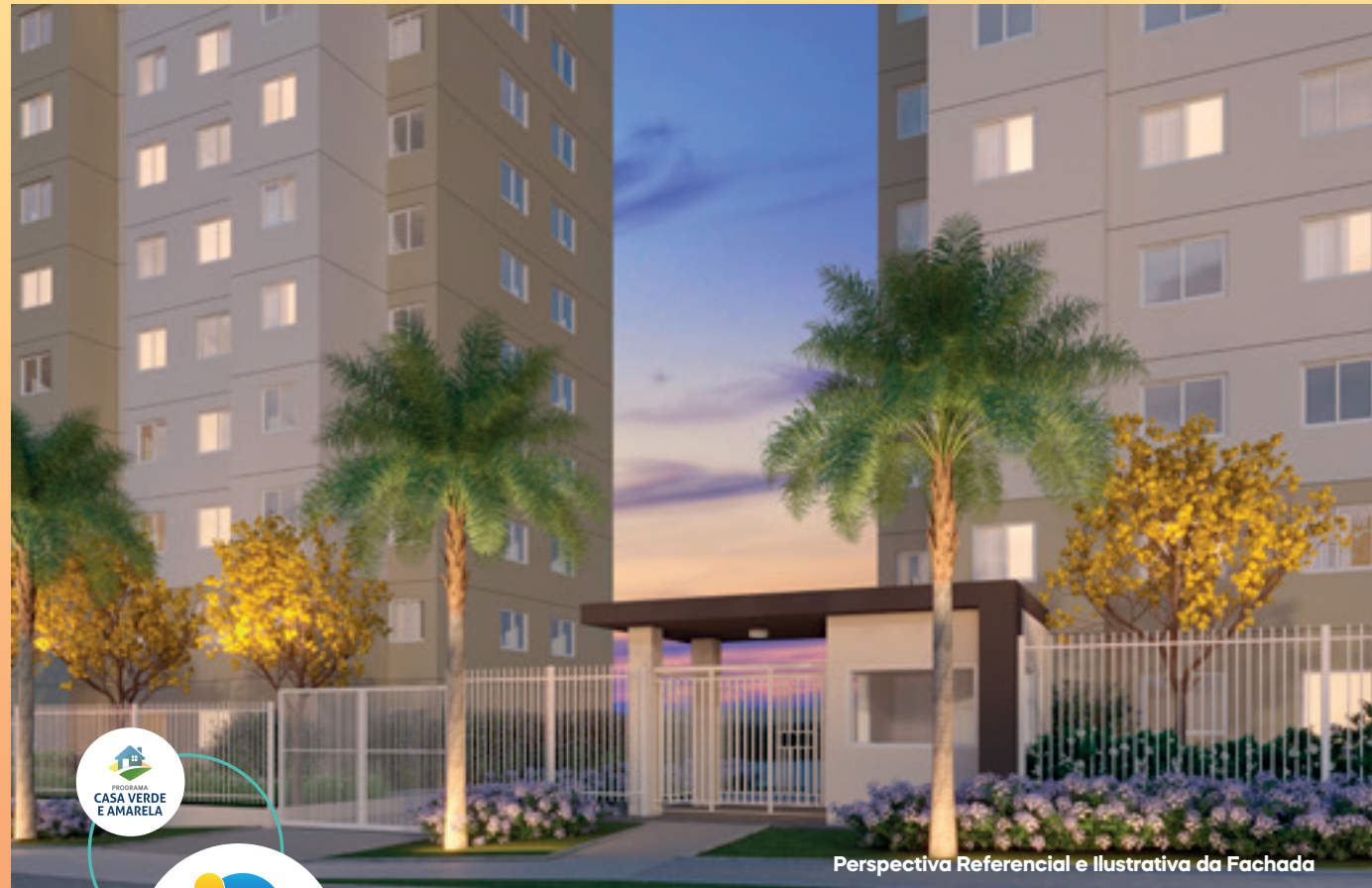
Perspectiva Referencial e Ilustrativa da Fachada

*Sugestão de uso. As áreas entregues equipadas constam expressamente no Memorial Descritivo. A área ilustrada é uma sugestão de uso e depende de contratação do serviço/infraestrutura/decoração pelo condomínio.