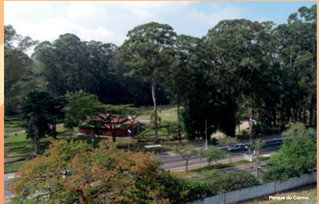
Parque do Carmo