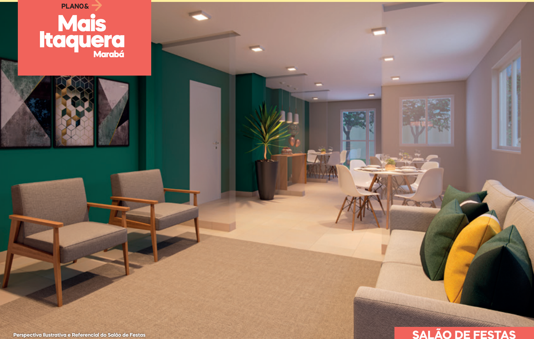
Perspectiva Ilustrativa e Referencial do Salão de Festas