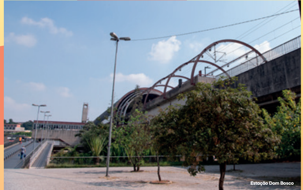
Estação Dom Bosco