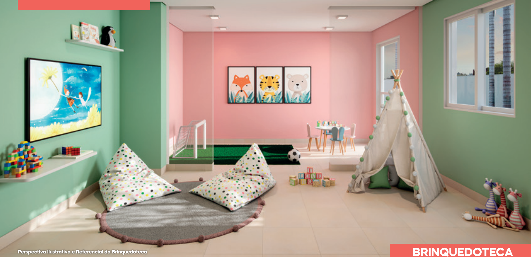
Perspectiva Ilustrativa e Referencial da Brinquedoteca