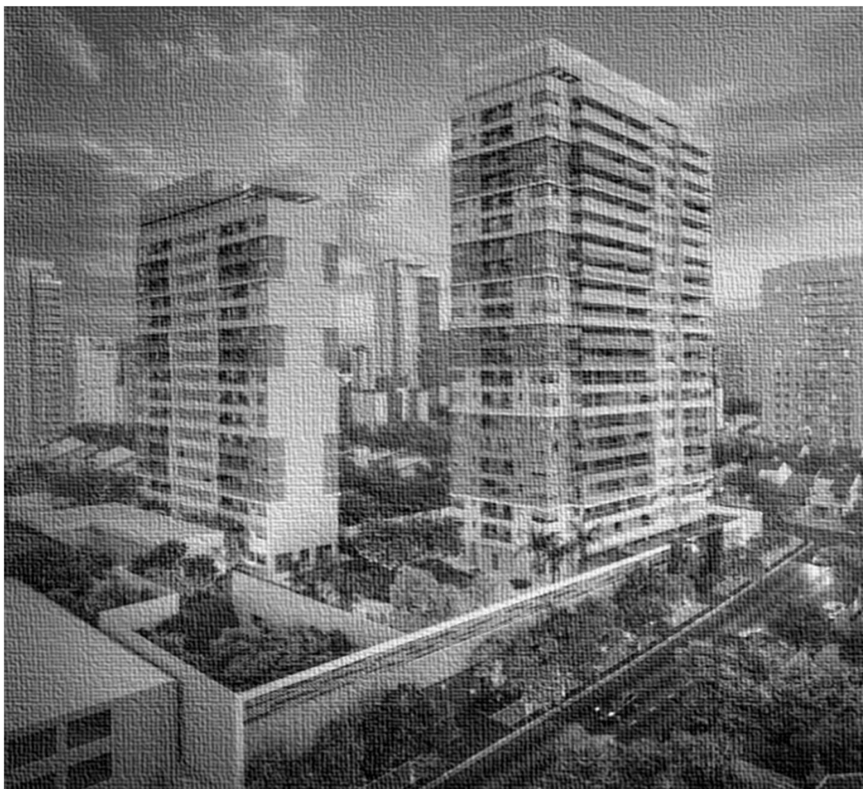
HARMONIE - TORRE BÁLSAMO