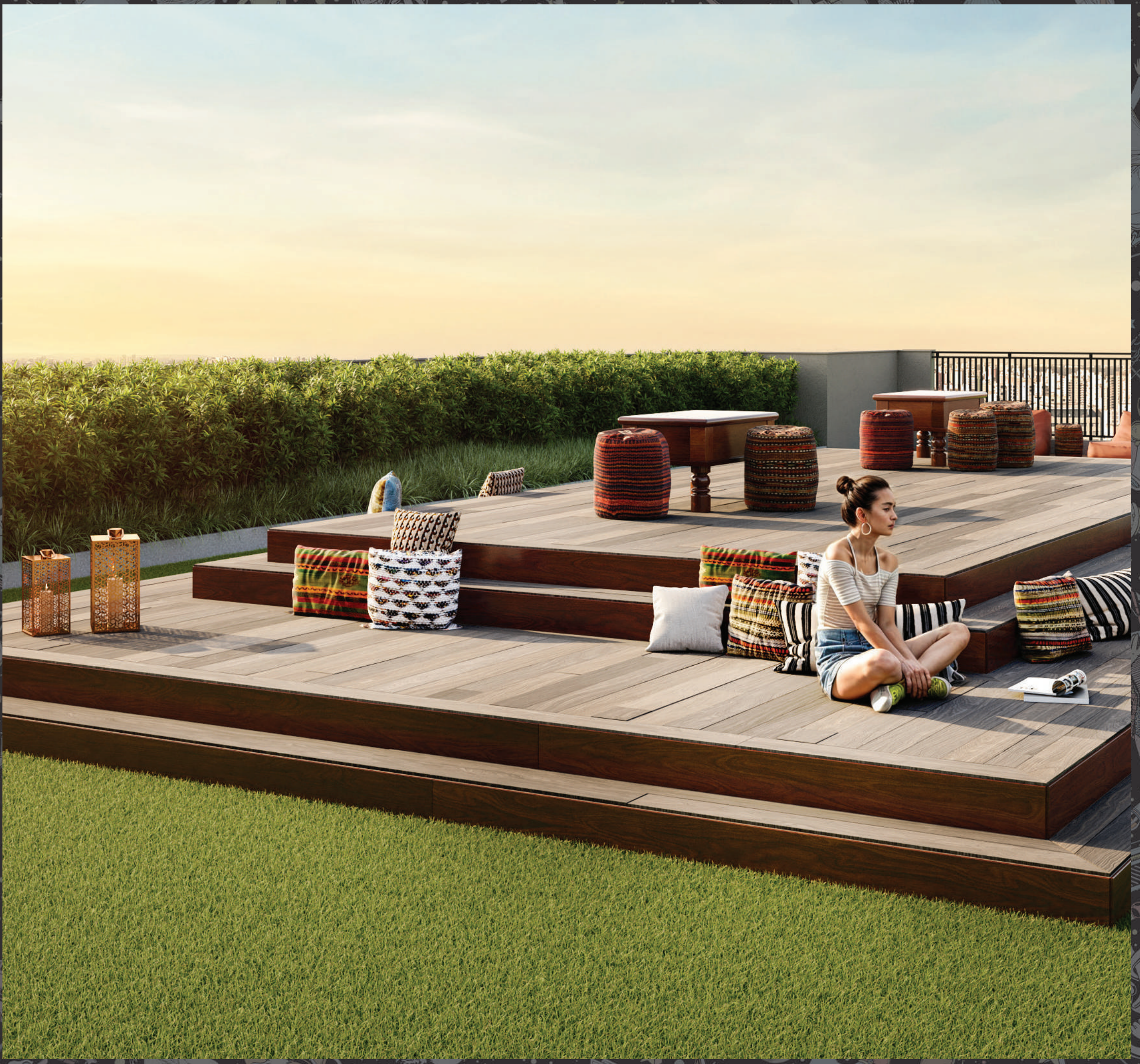
Perspectiva Ilustrada | Sky Garden