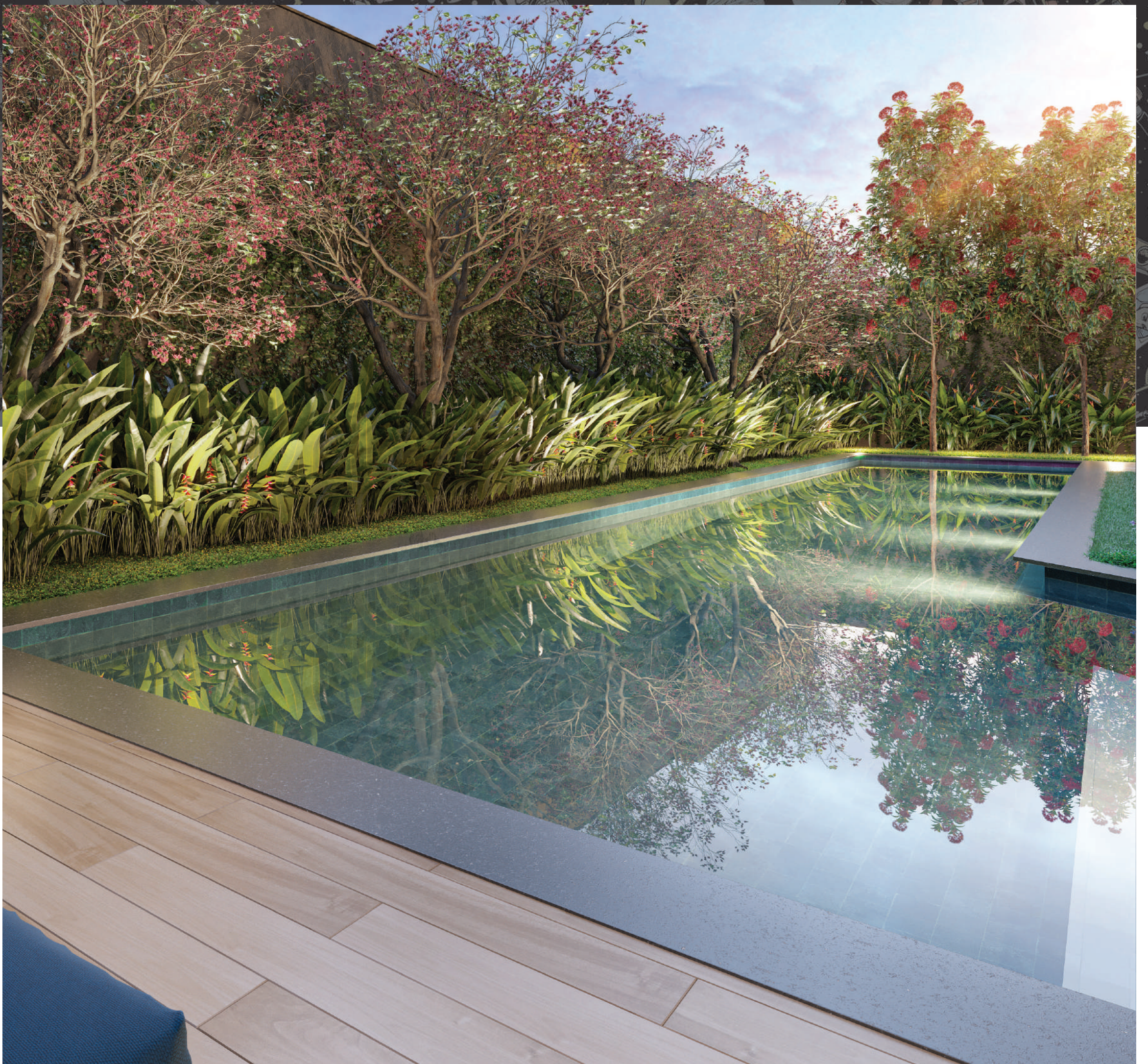
Perspectiva Ilustrada | Swimming Pool