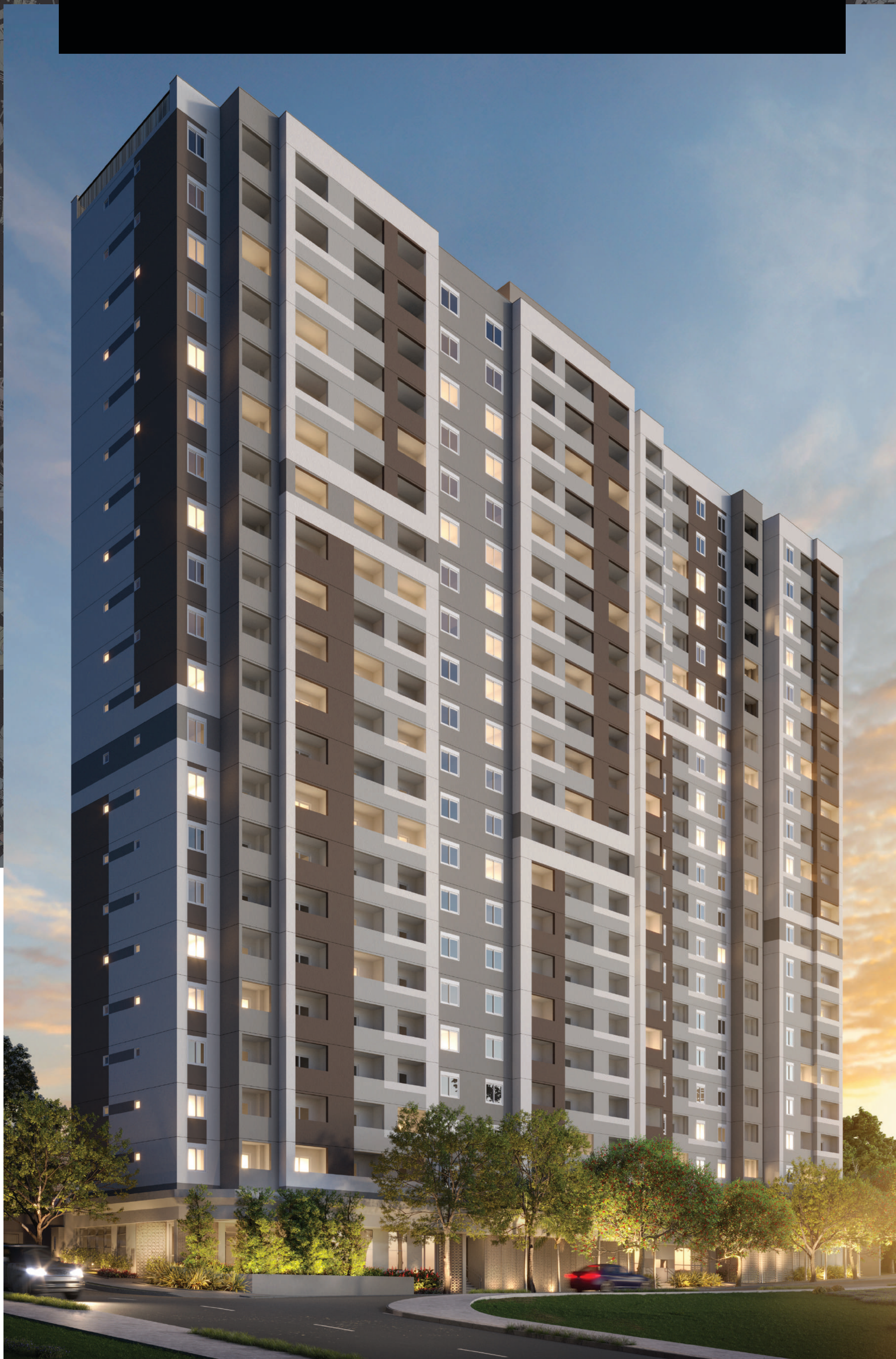
Perspectiva ilustrada | Fachada