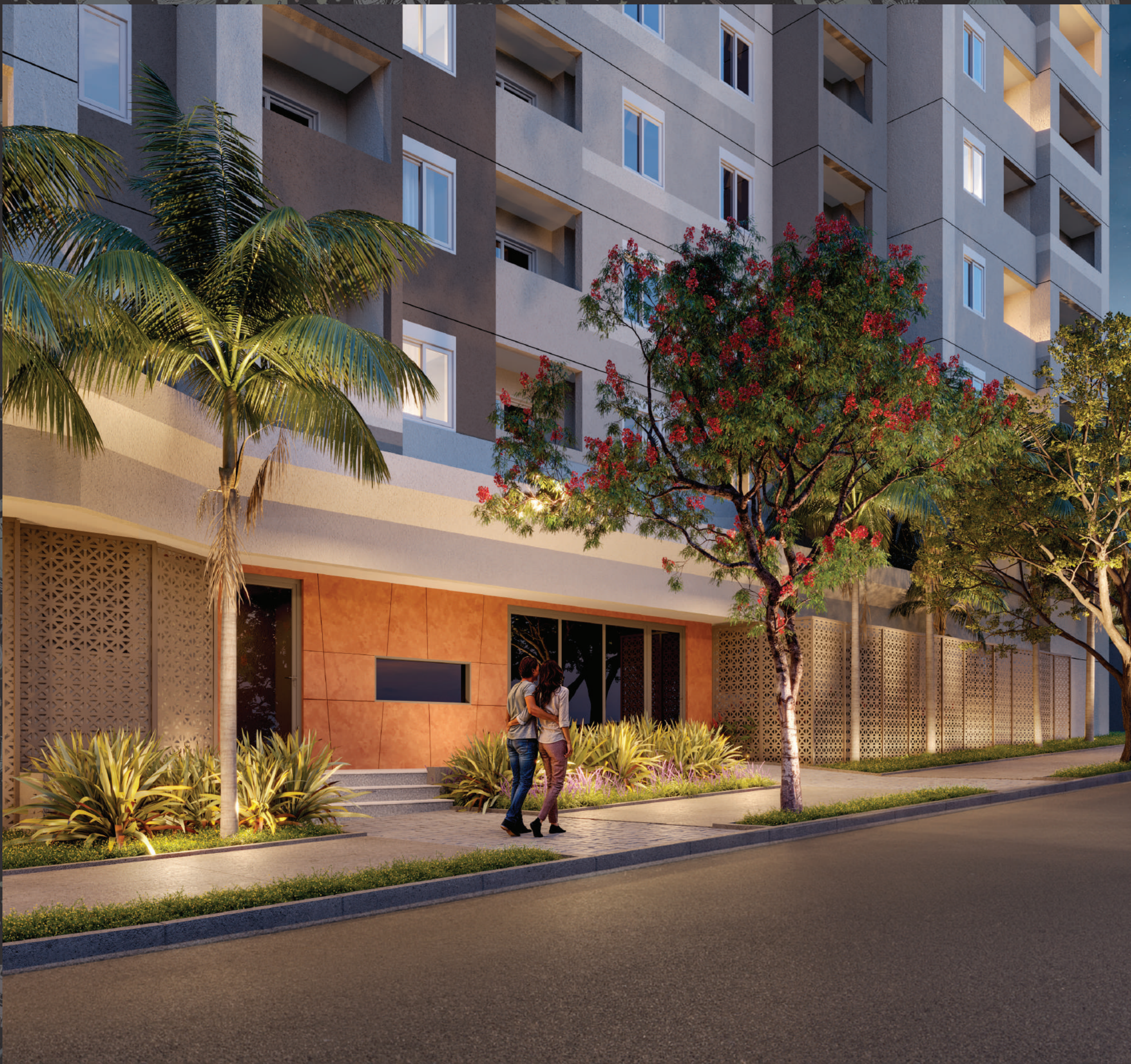
Perspectivă Ilustrată | Portaria