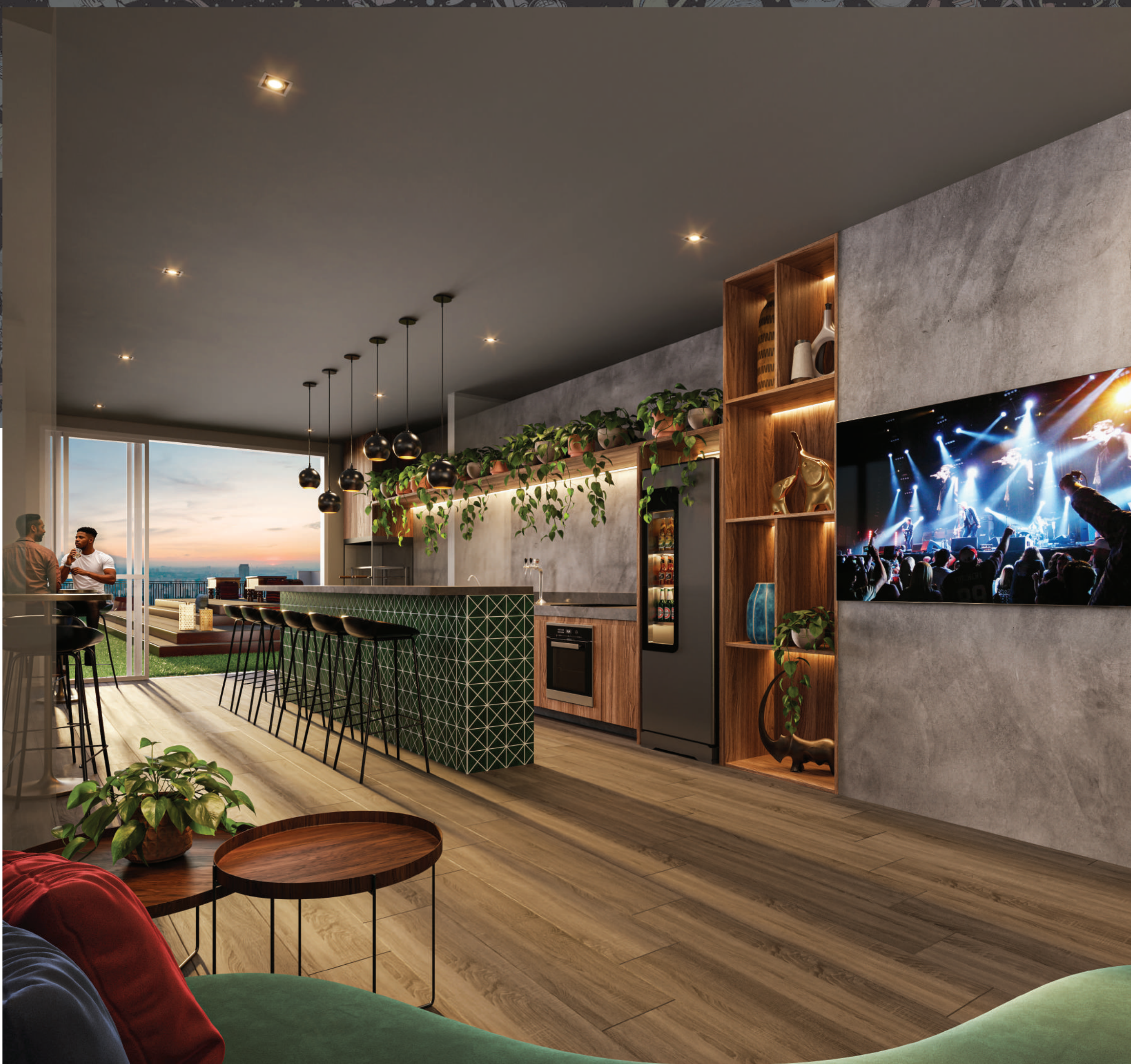
Perspectivă Ilustrată | Sunset Bar