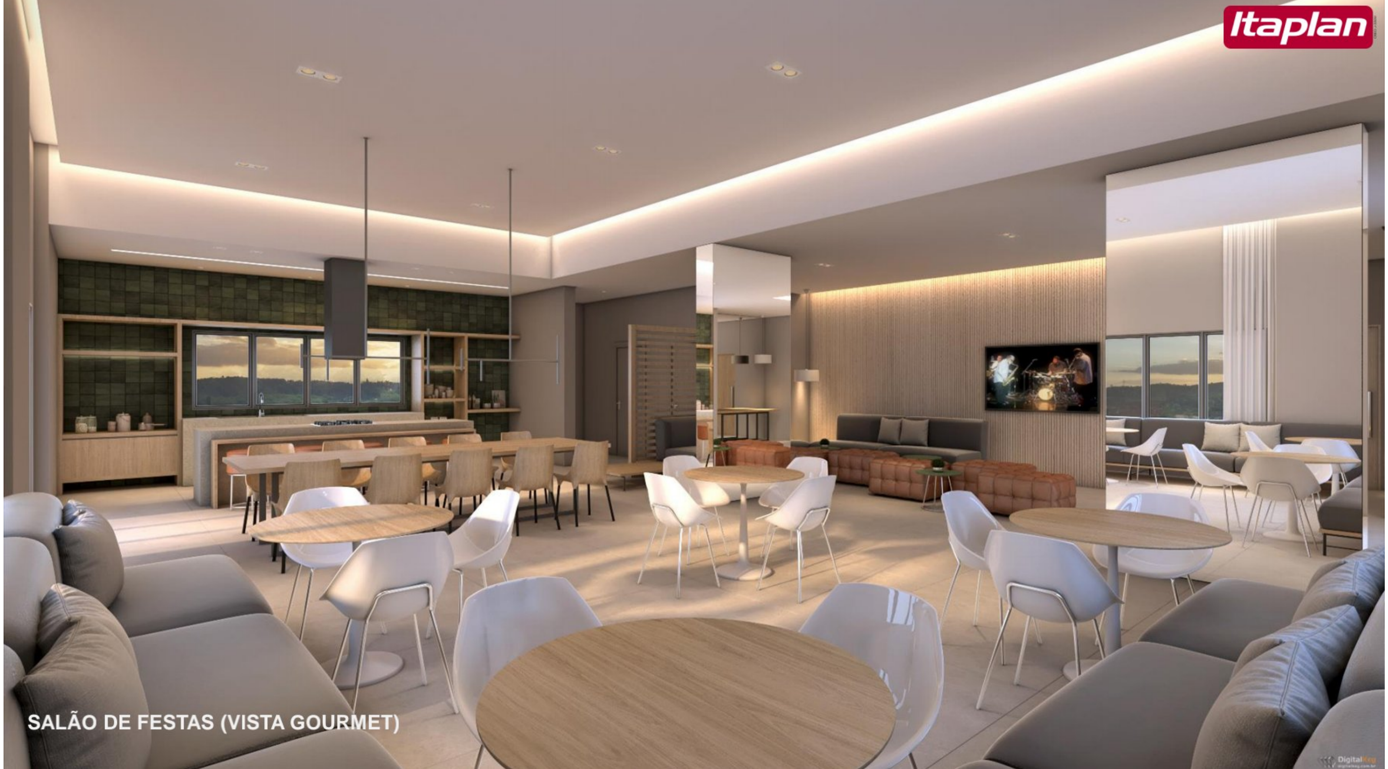
SALÃO DE FESTAS (VISTA GOURMET)