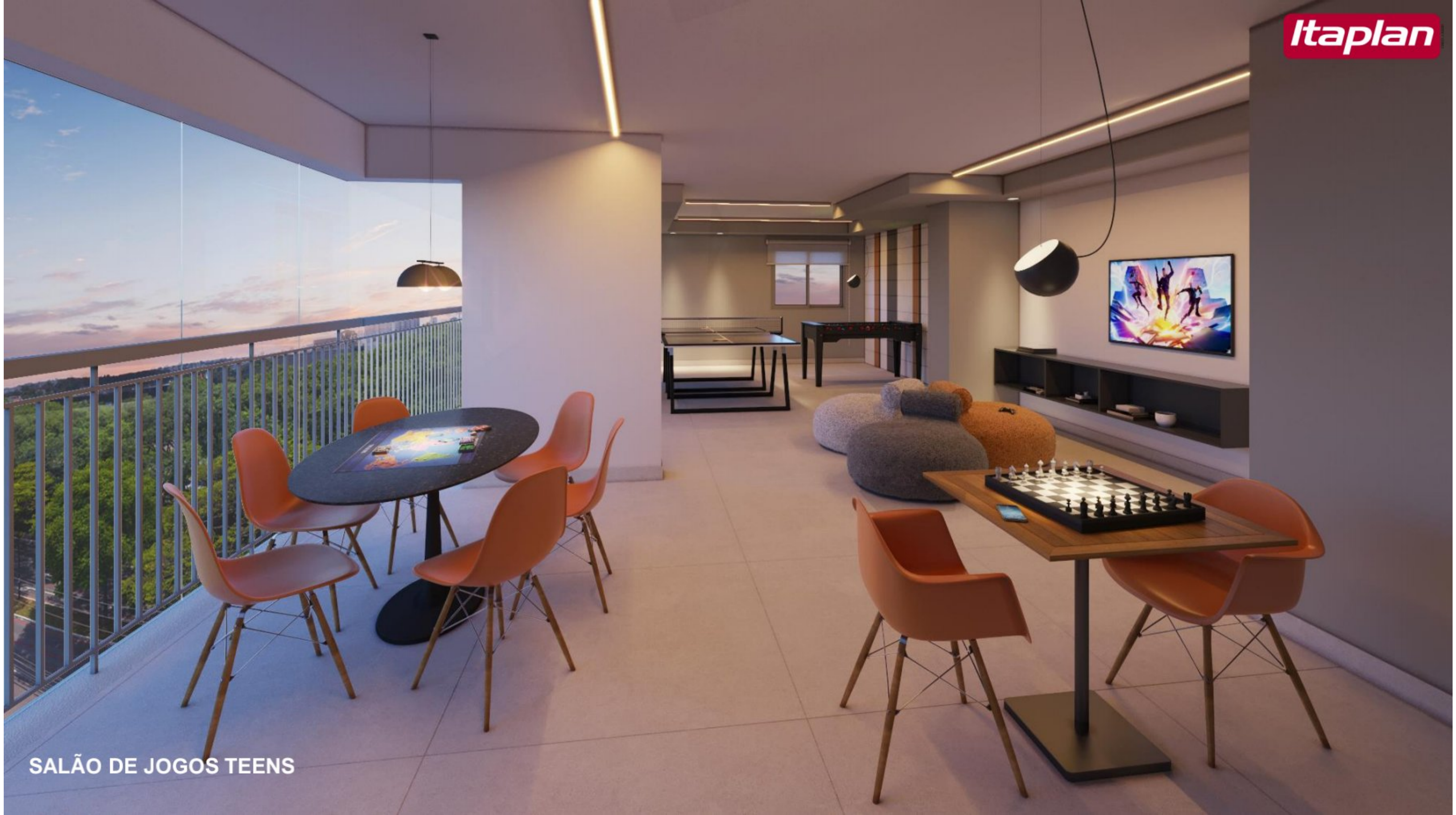
SALÃO DE JOGOS TEENS