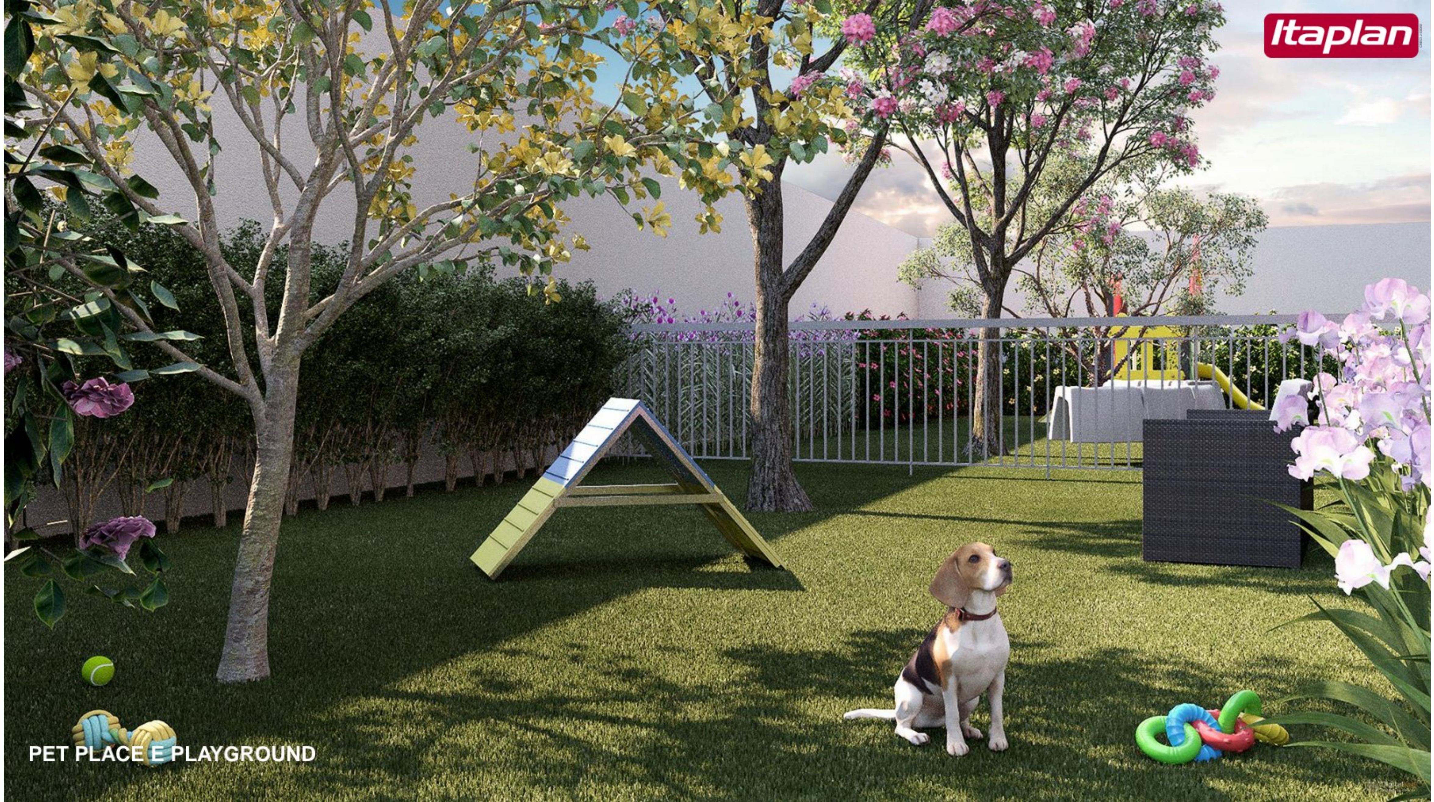
PET PLACE E PLAYGROUND