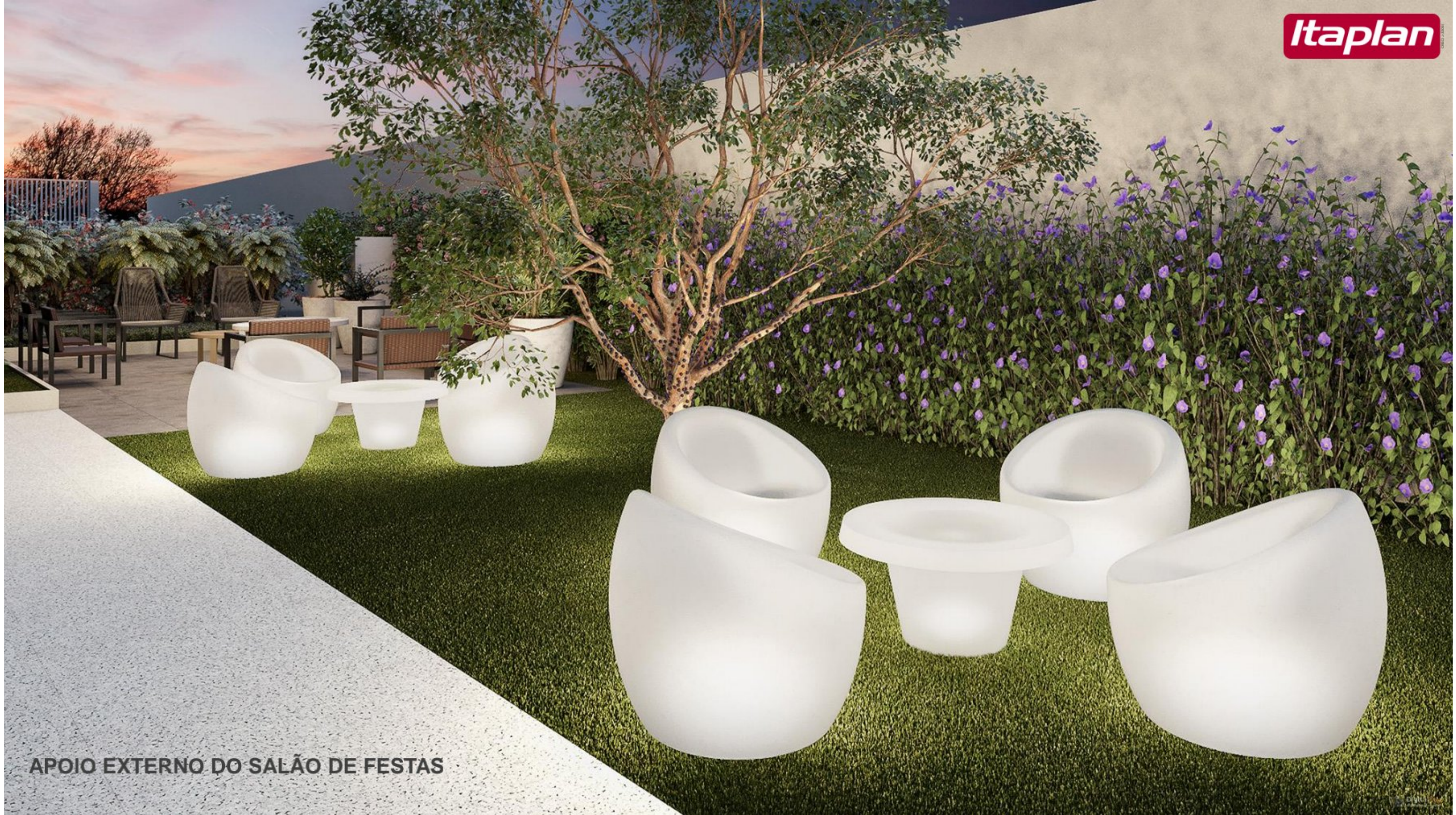
APOIO EXTERNO DO SALÃO DE FESTAS